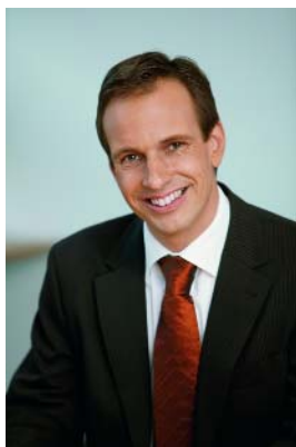
Landesrat Dieter Egger Wasserwirtschaftsreferent