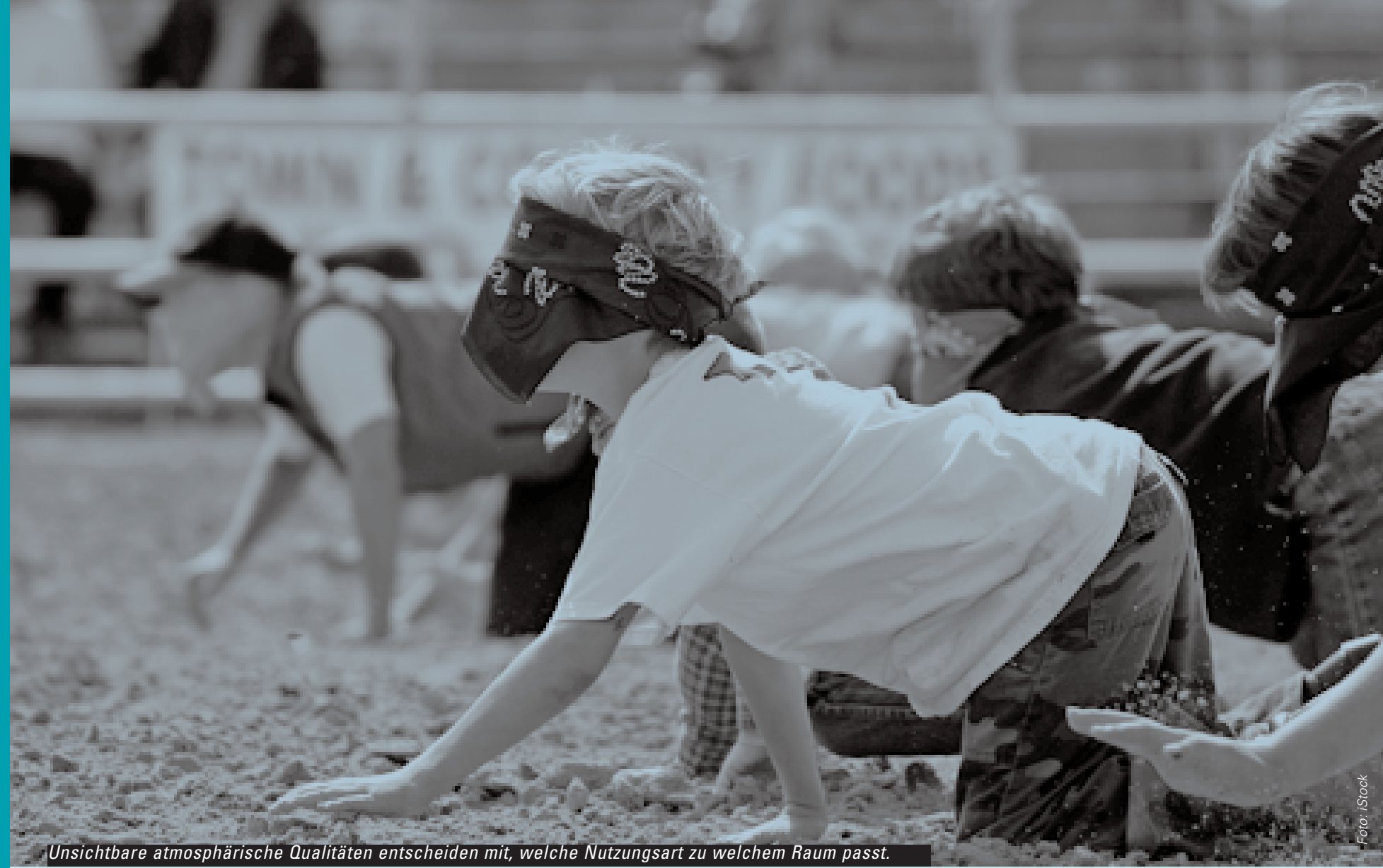
Unsichtbare atmosphärische Qualitäten entscheiden mit, welche Nutzungsart zu welchem Raum passt.