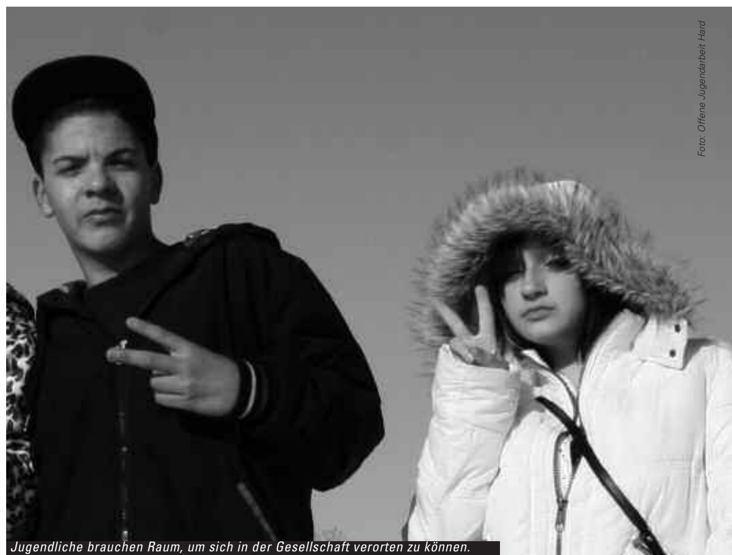
Jugendliche brauchen Raum, um sich in der Gesellschaft verorten zu können.