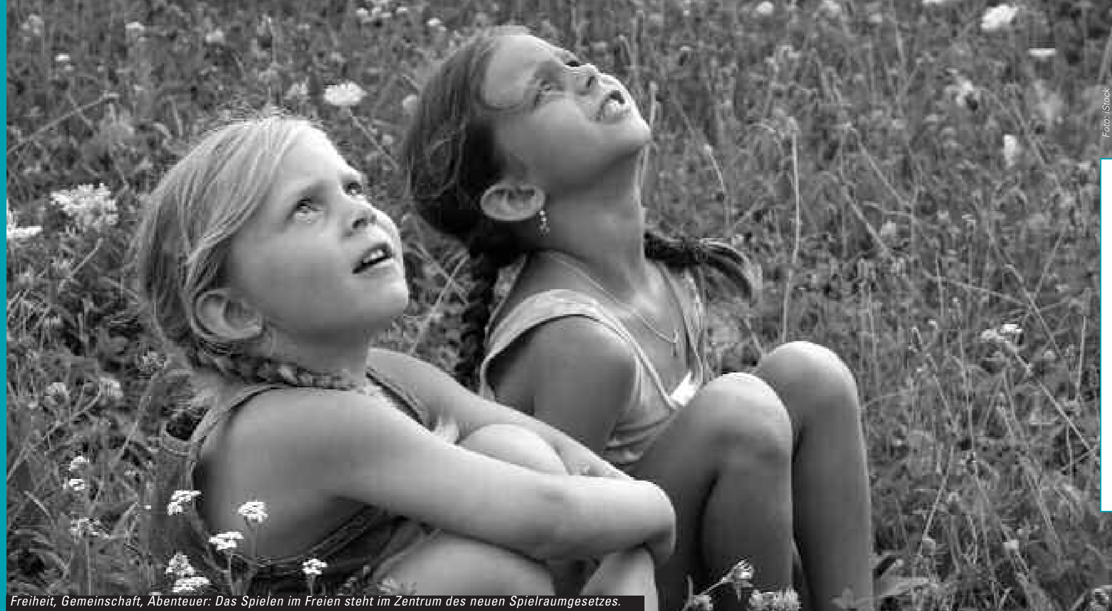
Freiheit, Gemeinschaft, Abenteuer: Das Spielen im Freien steht im Zentrum des neuen Spielraumgesetzes.