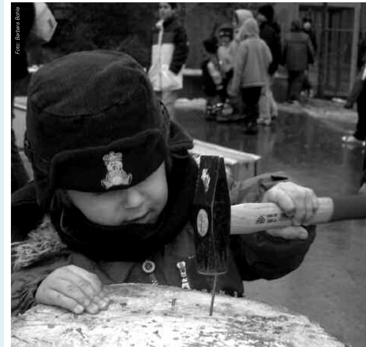
Beim selbstbestimmten Spielen begreifen Kinder sich und ihre Umwelt.