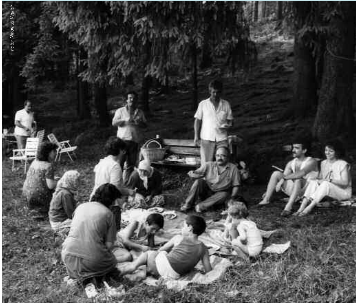
Tief in der orientalischen Lebensweise verwurzelt: Die Nutzung von Parks und Grünflächen als Treffpunkte