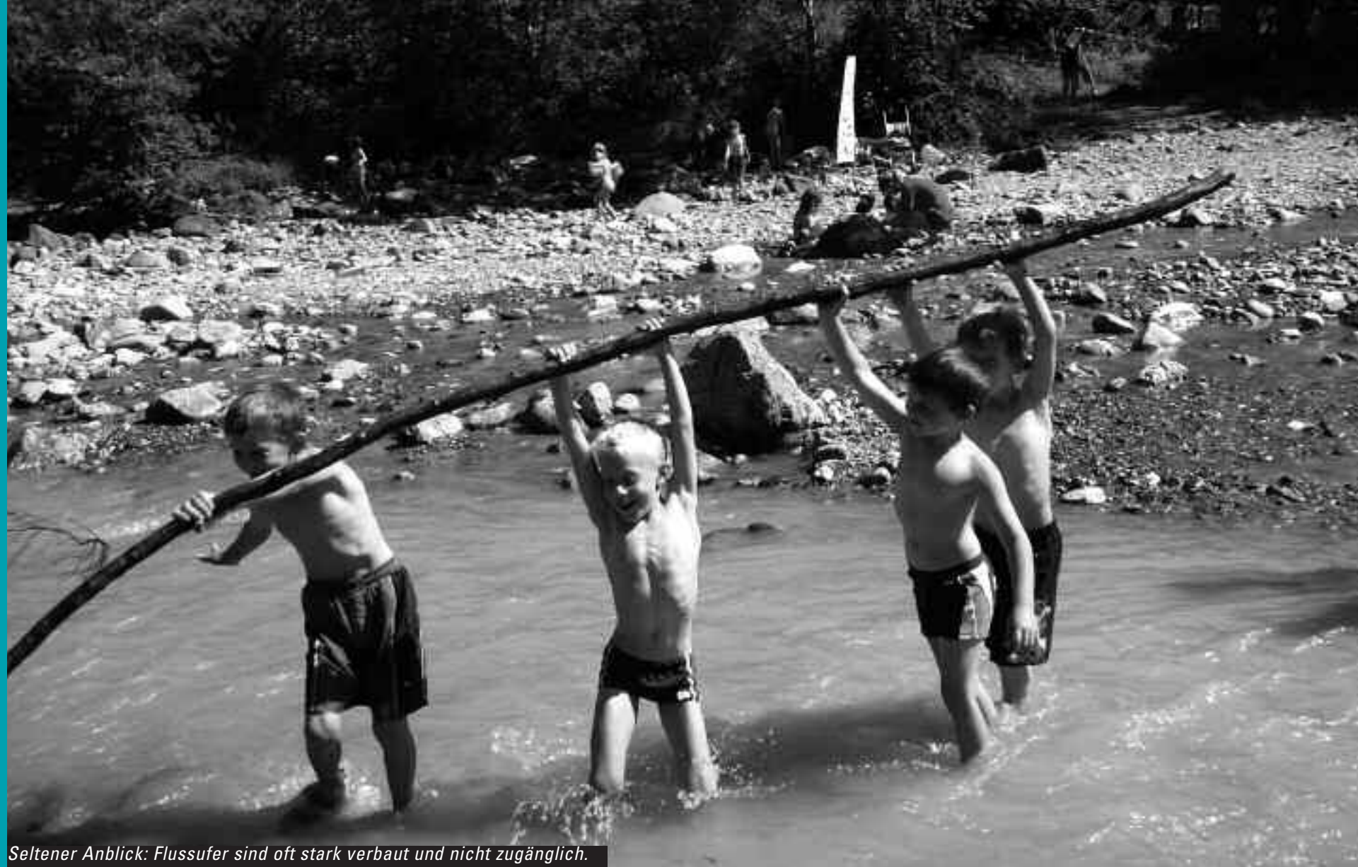
Seltener Anblick: Flussufer sind oft stark verbaut und nicht zugänglich.