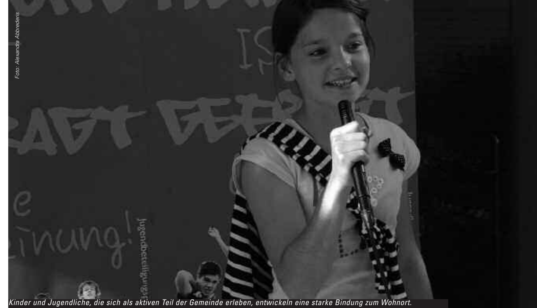
Kinder und Jugendliche, die sich als aktiven Teil der Gemeinde erleben, entwickeln eine starke Bindung zum Wohnort.

Das Mädchenzentrum Amazone lud Mädchen dazu ein, den öffentlichen Raum aktiv zu erkunden und z.B. unter dem Motto „Raumverteidigung“ den Dialog mit den Erwachsenen zu suchen ( www.amazone.or.at ).