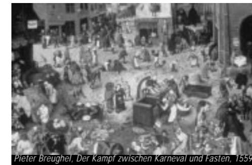
Pieter Breughel, Der Kampf zwischen Karneval und Fasten, 1559

Heißt das nun, dass wir beim Bauen oder beim Entscheiden über Bauen nicht „über die Grenzen schauen sollen“, sondern uns nur sorgfältig fragen sollen, wie wir sein wollen und was wir von uns zeigen wollen? Im Gestaltungsbeirat von Köln bin ich das einzige Mitglied, das nicht aus Köln stammt. Im Gestaltungsbeirat von Feldkirch gibt es kein Mitglied aus Vorarlberg. Im einen Fall wurde der Blick über die Grenzen von den Baubehörden anscheinend als unnötig erachtet, im anderen Fall als Bereicherung empfunden.