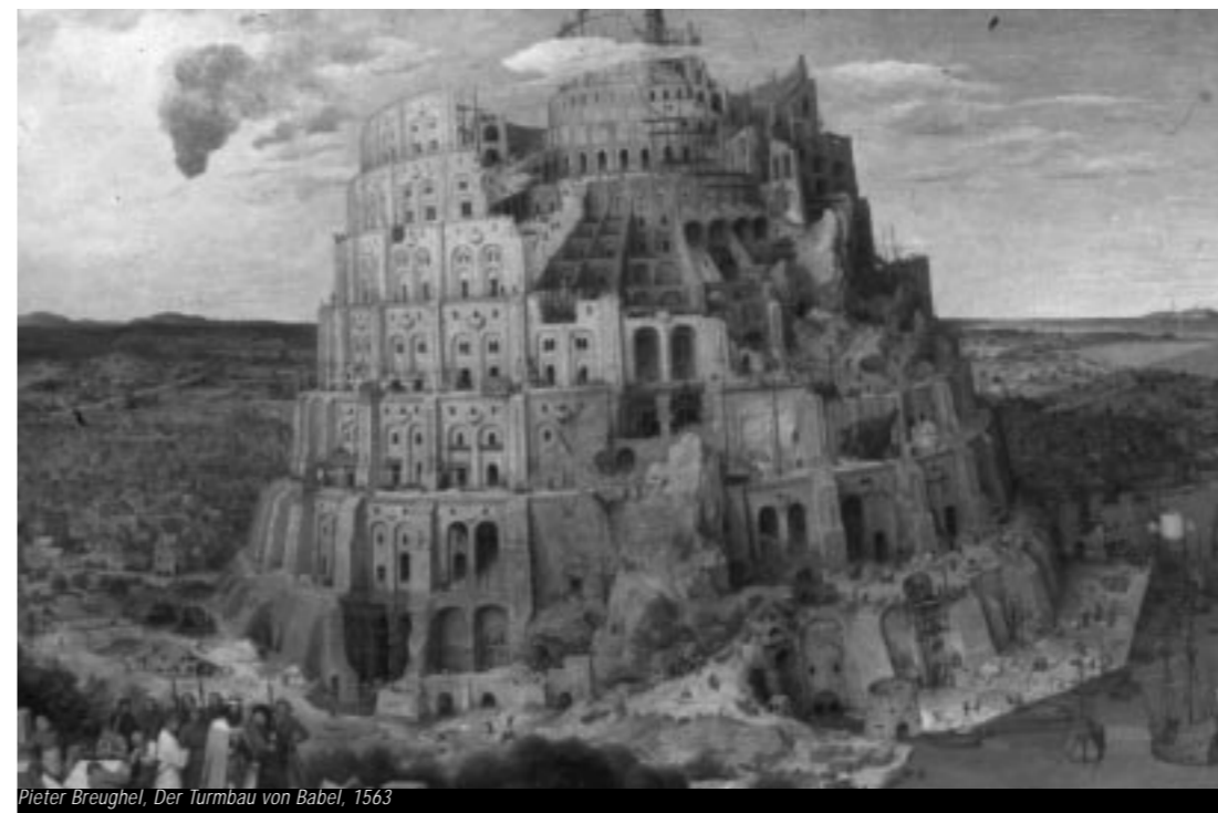
Pieter Breughel, Der Turmbau von Babel, 1563

Internet www.bodenseestadt.net sowie zur bisherigen Arbeit: Vision Bodenseestadt. Städtebauforschung zwischen Utopie und Machbarkeitsstudie, Verlag VGD Weimar 2003, ISBN 3-89739-355-7, EUR 16,80