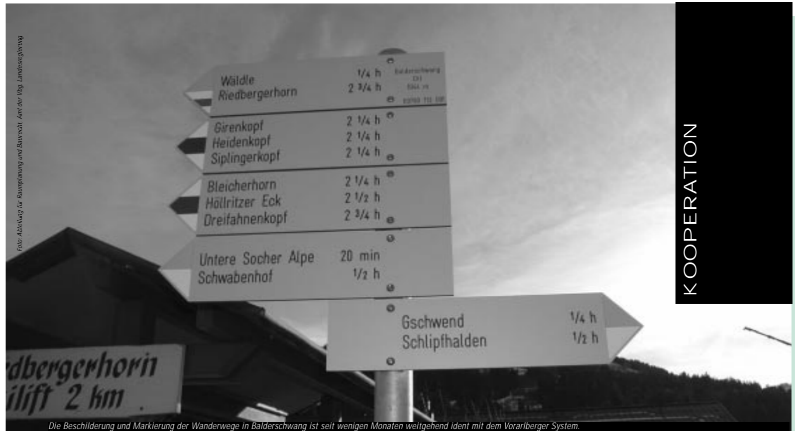
Die Beschilderung und Markierung der Wanderwege in Balderschwang ist seit wenigen Monaten weitgehend ident mit dem Vorarlberger System.