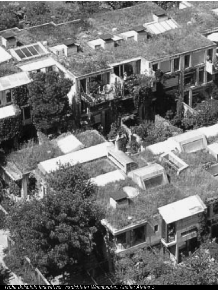
Frühe Beispiele innovativer, verdichteter Wohnbauten.

Daraus resultierende Ideen und Konzepte werden mit innovativen Wohnbauten wie z.B. in Holland oder der Schweiz verglichen und auf deren Umsetzbarkeit in der Bodenseeregion hin abgefragt.