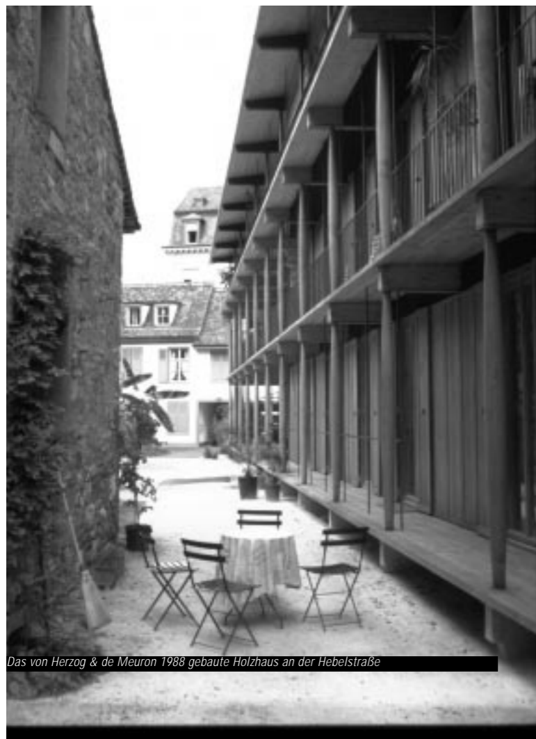
Das von Herzog & de Meuron 1988 gebaute Holzhaus an der Hebelstraße