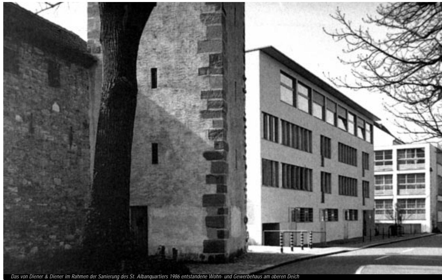
Das von Diener & Diener im Rahmen der Sanierung des St. Albanquartiers 1986 entstandene Wohn- und Gewerbehaus am oberen Deich