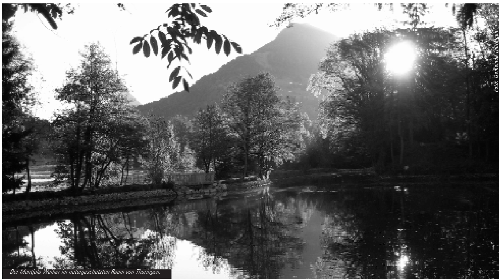
Der Montjola Weiher im naturgeschützten Raum von Thüringen.