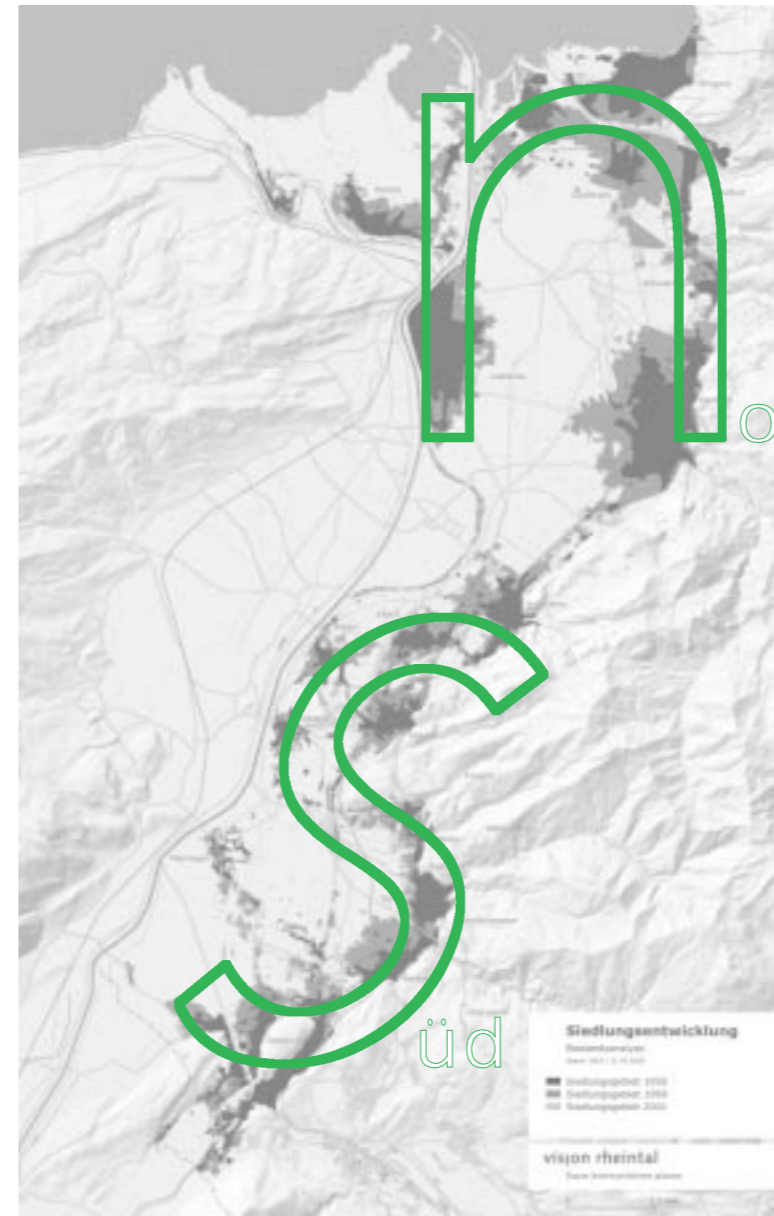
Das Vorarlberger Rheintal erlebte seit den 50er Jahren eine dynamische Siedlungsentwicklung. Es sind zwei Siedlungslandschaften entstanden: ein nördlicher Siedlungsbogen um die Riedlandschaft, ein südliches Siedlungsgebiet zwischen Feldkirch und Hohenems.

Die PolitikerInnen waren sich einig: Man lebt in einer Wachstumsregion und will den Wohlstand auch halten. Landeshauptmann Herbert Sausgruber: „Es ist aber eine gewaltige Herausforderung, Produktionsstandort in Mitteleuropa zu sein.“ Es gelte – für Gemeinden, wie für Länder – „die Vorteile der Kooperation zu erkennen“.