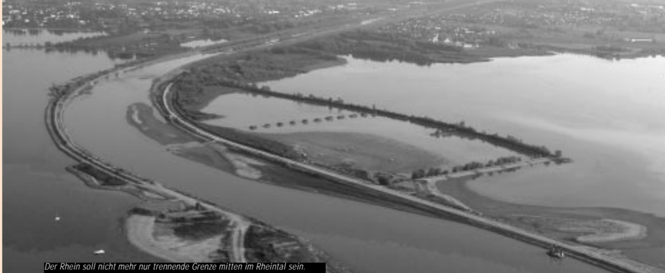
Der Rhein soll nicht mehr nur trennende Grenze mitten im Rheintal sein.