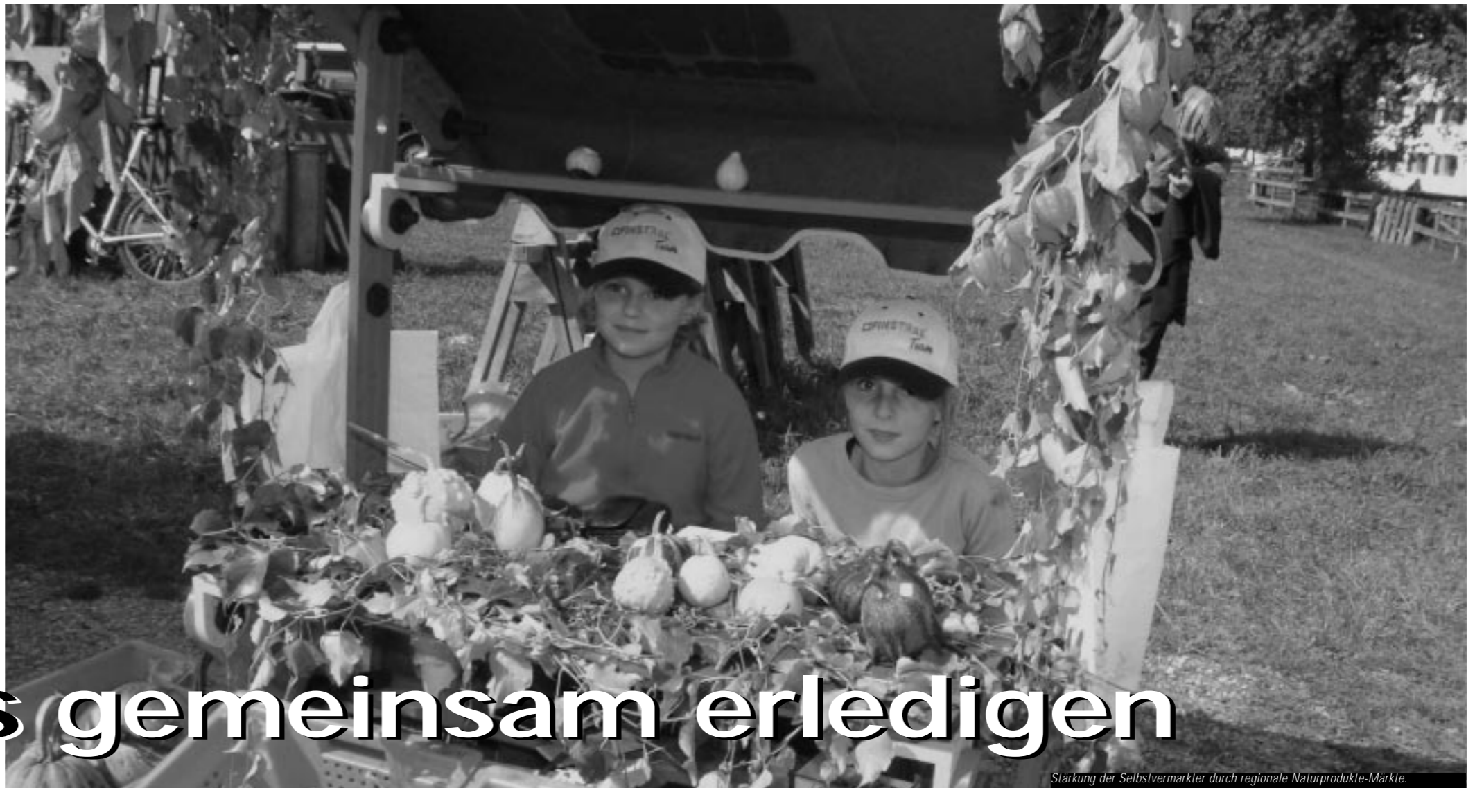
Stärkung der Selbstvermarkter durch regionale Naturprodukte-Märkte.