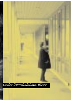
Laube Gemeindehaus Blizau