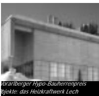
Vorarlberger Hypo-Bauherrenpreisobjekte, das Heizkraftwerk Lech