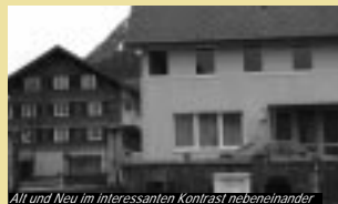
Alt und Neu im interessanten Kontrast nebeneinander

Gemeindehaus mit Bank, Post und Feuerwehr-