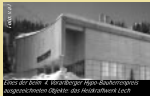
Eines der beim 4. Vorarlberger Hypo-Bauherrenpreis ausgezeichneten Objekte: das Heidkraftwerk Lech