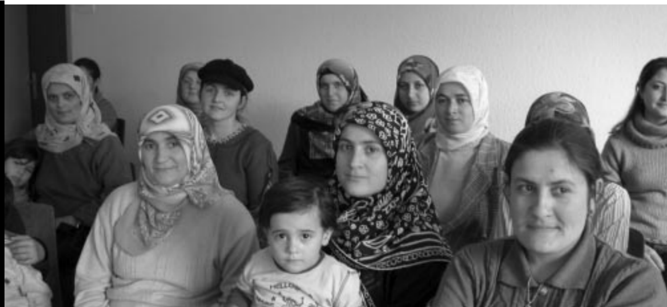
Eingliederung von MigrantInnen auf Gemeindeebene – Chance und Herausforderung