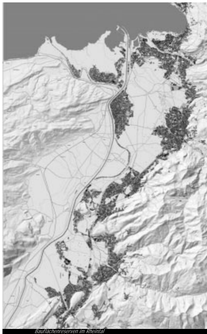
Bauflächenreserven im Rheintal

Um die raumordnerische Entwicklung in gewünschten Bahnen zu halten und damit dem Problem der Zersiedelung entgegenzuwirken, ist das bloße Vorhandensein von Bauflächenreserven zu wenig. Die mangelnde Verfügbarkeit von Baugrundstücken an geeigneten Standorten ist ein raumordnerisches Problem – das Angebot des Bodenmarktes stimmt oft nicht mit den Zielen der Raumplanung überein. Durch hohe Bodenpreise werden unerwünschte Entwicklungen oft noch verstärkt. Als ein Lösungsansatz hierfür gilt die Verstärkung der aktiven Bodenpolitik der öffentlichen Hand. Beispiele einzelner Gemeinden im Rheintal zeigen, dass durch eine aktive Bodenpolitik der raumordnerische