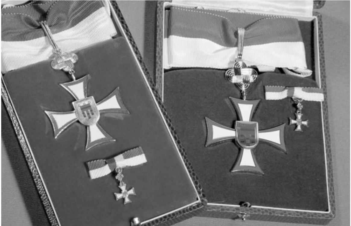
Das Ehrenzeichen des Landes Vorarlberg in Gold und Silber.

Deshalb legte die Landesregierung 1978 ein Gesetz über das Verdienstzeichen des Landes Vorarlberg vor, um zwei weitere Ehrungsstufen einzuführen: ein Großes Verdienstzeichen und ein Verdienstzeichen. 52