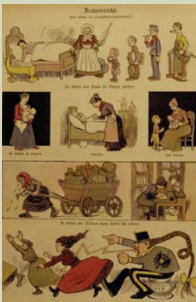
Karikatur zum Verbot des Frauenstimmrechtsvereins (BKA)