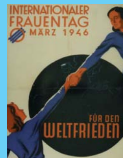
Plakate zum Internationalen Frauentag von 1946–1950 (BKA)