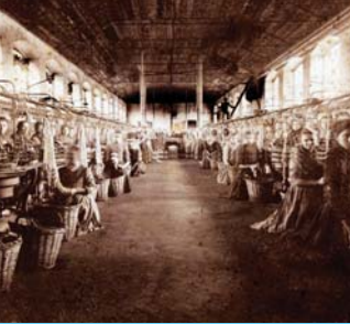
Arbeiterinnen der Seidenspinnerei Ulmer in Dornbirn, um 1900 Plakat zum Internationalen Frauentag 1931 (StaD)