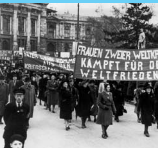
Internationaler Frauentag 1948 in Wien, ca. 15.000 Teilnehmerinnen und Teilnehmer