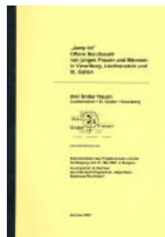
Dokumentation Jump in