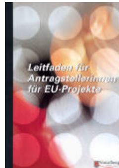
EU – Leitfaden