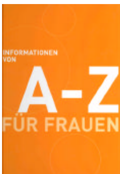
Informationen von A – Z