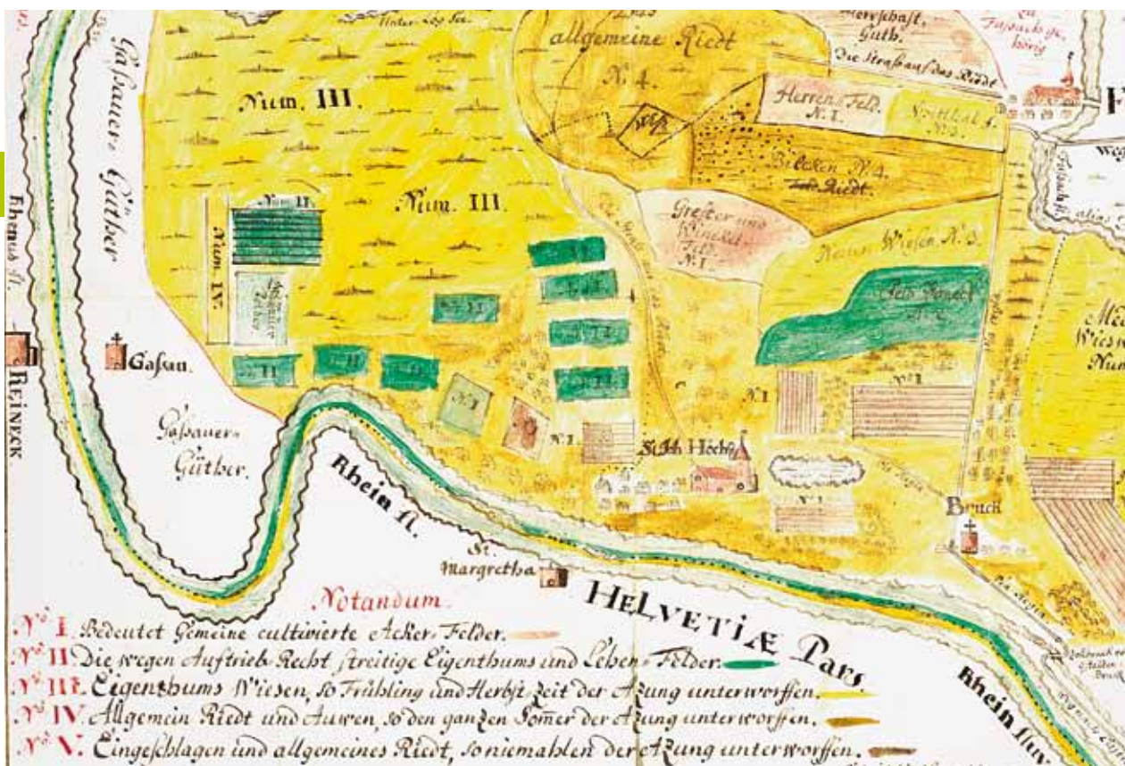
Flurkarte des Hofes St. Johann-Höchst 1770 (Gabriel Walser)

ben war, Großhöfe geistlicher wie weltlicher Grundherren, bäuerliches Privateigentum mit höchst unterschiedlichen Betriebsgrößen, darunter Großgrundbesitz, wie auch Besitz in mehreren Orten, außerdem gemeinschaftlich bzw. von Anteileern genutzte Güter.