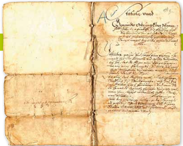
Gemeindeordnung Götzis 1686

Wer dem Kreis der vollberechtigten Gemeindemitglieder nicht angehörte, aber in der Götzner Gemarkung samt Altsach und Kommingen lebte, war ein „Hintersasse“ und entrichtete eine eigene Steuer. Heirateten Frauen von aus-