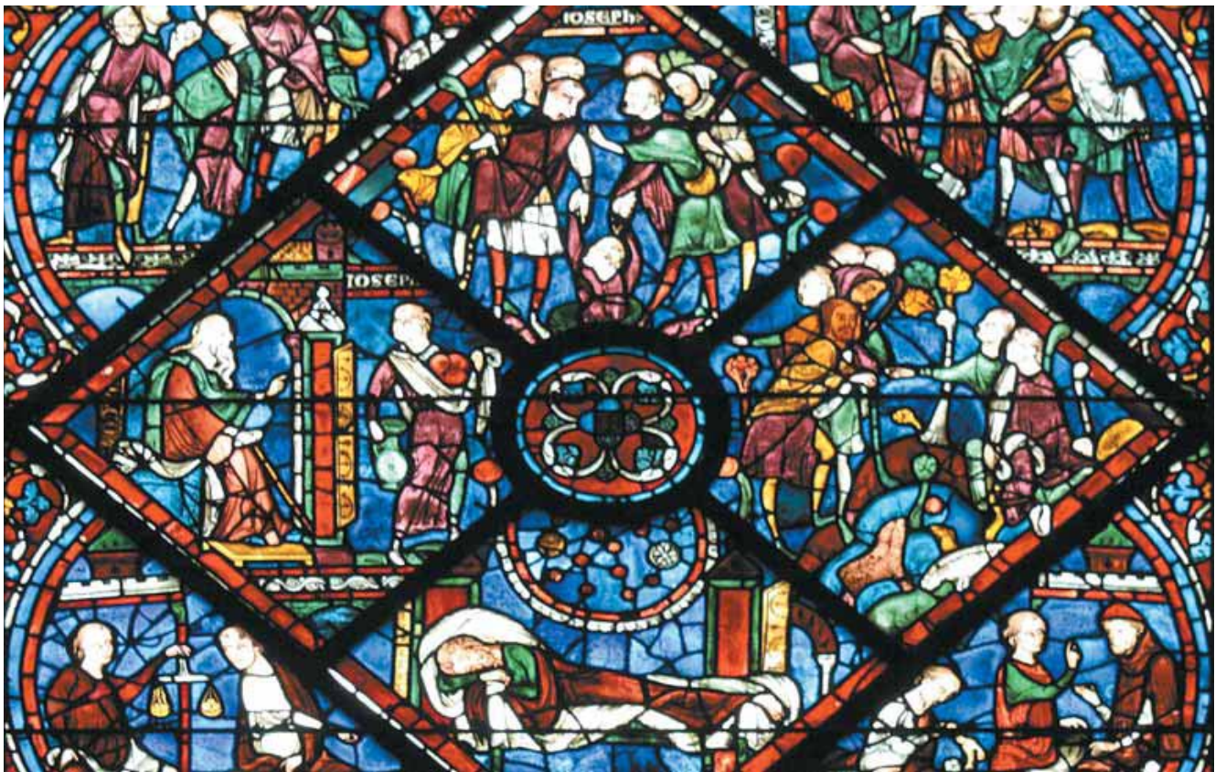
Das Leben des hl. Josef findet sich in einem der berühmten Glasfenster im Schiff der Kathedrale Notre Dame von Chartres.