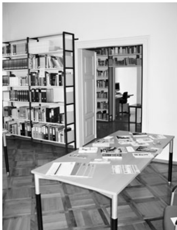
Die Musiksammlung des Vorarlberger Landesarchivs.

„Die Bestände liegen im Vorarlberger Volksliedarchiv, einer eigenen Abteilung des Vorarlberger Landesarchivs in Bregenz. Die Hoffnung auf ein heizbares Zimmer blieb leider ein schöner Traum; das Landesarchiv leidet selbst unter Raumnot“. 46