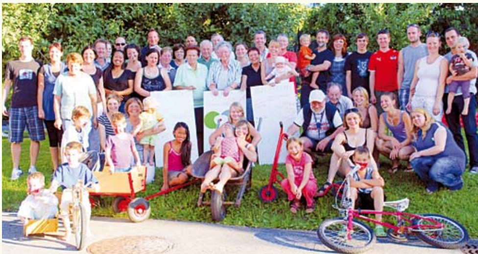
Gewinnerfoto: Kinder-Familien- Straßenfest in Muntlix, Vagöls