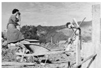
„Hütleboua“ im Porst 1958