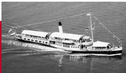
Die „Hohentwiel“, ein Symbol der Bodenseeregion

www.vorarlberg.at/europa , www.vorarlberg.at/2005