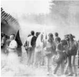
Breiners in Wackersdorf 1985