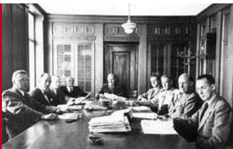
Landesregierung 11. Dezember 1945