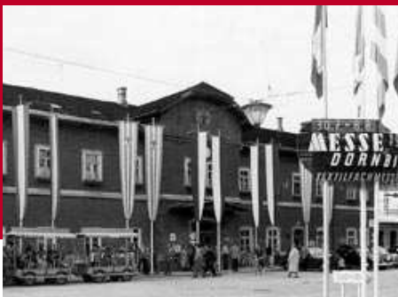
Bahnhof im „Messeschmuck“ 1954