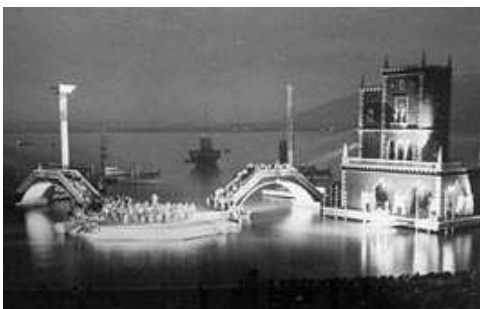
„Eine Nacht in Venedig“ 1955

Veranstalter: Vorarlberger Landesarchiv www.landesarchiv.at