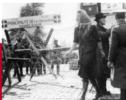
Grenze Tisis-Schaanwald 1945