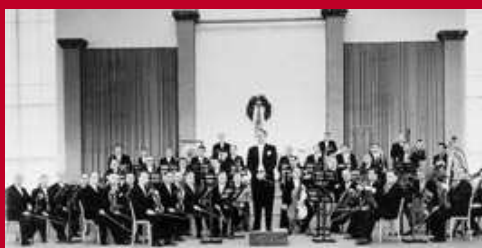
Vorarlberger Rundfunkorchester 1955

www.vorarlbergerlandeskonservatorium.ac.at