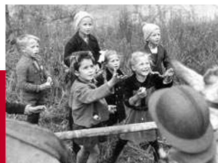
Kriegs- und Nachkriegskindheit