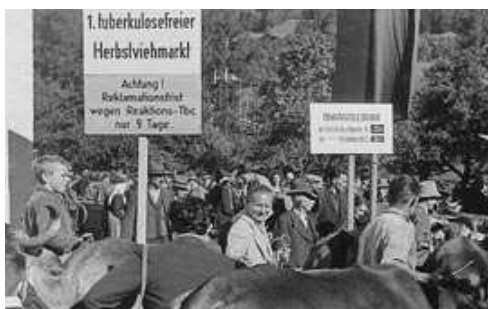
Herbstviehmarkt in Schruns 1952