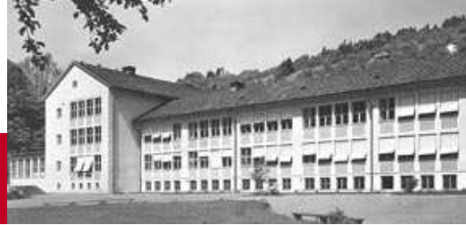
Hauptschule Levis 1953