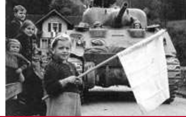
Begrüßung in Altenstadt