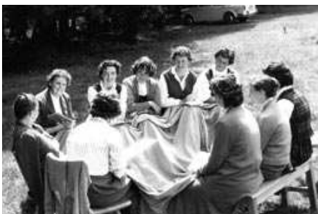
Führungskreis am Bödele 1947