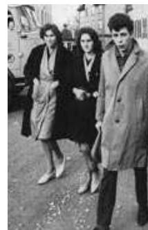
Lehrlinge F.M. Hämmerle