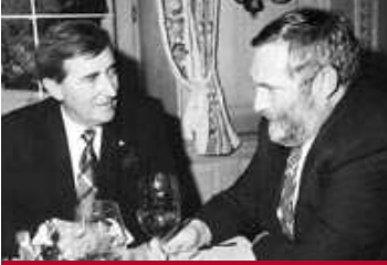
Europa-Forum Lech 1993