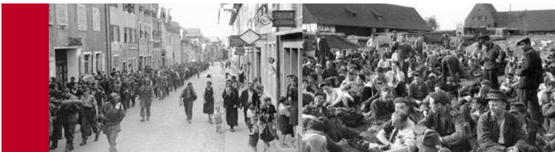
Freiheit oder Gefangenschaft?

Veranstalter: Vorarlberger Landesarchiv www.landesarchiv.at