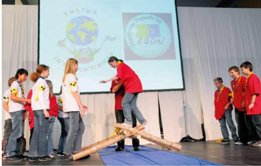
Bei der konkreten Umsetzung von Ideen – wie hier beim Jugendprojektwettbewerb 2008 in Lustenau – beweisen Jugendliche immer wieder, was mit Engagement und Kreativität möglich ist.

Aktuell arbeiten wir zum Thema „Jugend und Alkohol“ ein Fördermodell aus, das suchtpreventive Angebote in Vereinen unterstützen soll. Zudem organisieren wir beim Jugendfestival auf der Dornbirner Frühjahrsmesse mit und koordinieren den Auftritt der Jugendorganisationen. Auch an einer Homepage, die auf die einzelnen Organisationen hinweist, wird gearbeitet.