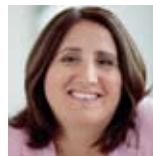
LAbg. DSA Vahide Aydin Integrationssprecherin (Die Grünen)

Es ist hoch an der Zeit , dass sich Politik und Verwaltung mit dem Gedanken anfreunden, dass Integration ein beidseitiger Prozess ist und Strukturen braucht. Dieses Leitbild ist ein Grundsatzpapier, in dem sich das Land Vorarlberg dazu bekennt, dass es keine Alternative zur Integration gibt. Das Gleis ist sozusagen gelegt. Die größte Herausforderung wird jedoch die Umsetzung sein: die Maßnahmen, die vor allem in den Bereichen Bildung, Arbeitsmarkt, Wohnen und Gesundheit definiert und umgesetzt werden müssen.