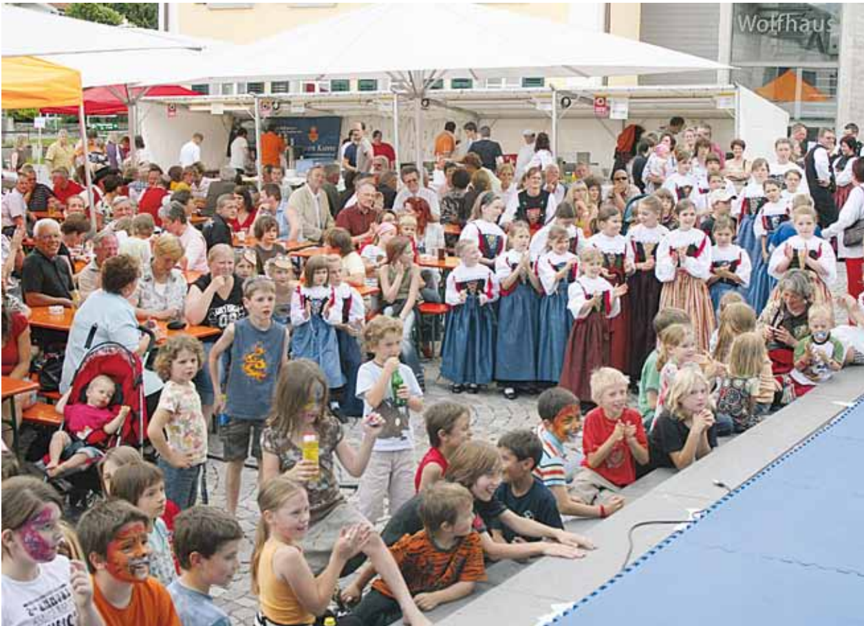
„Unsere Gemeinde“ – Aktionstag in Nenzing