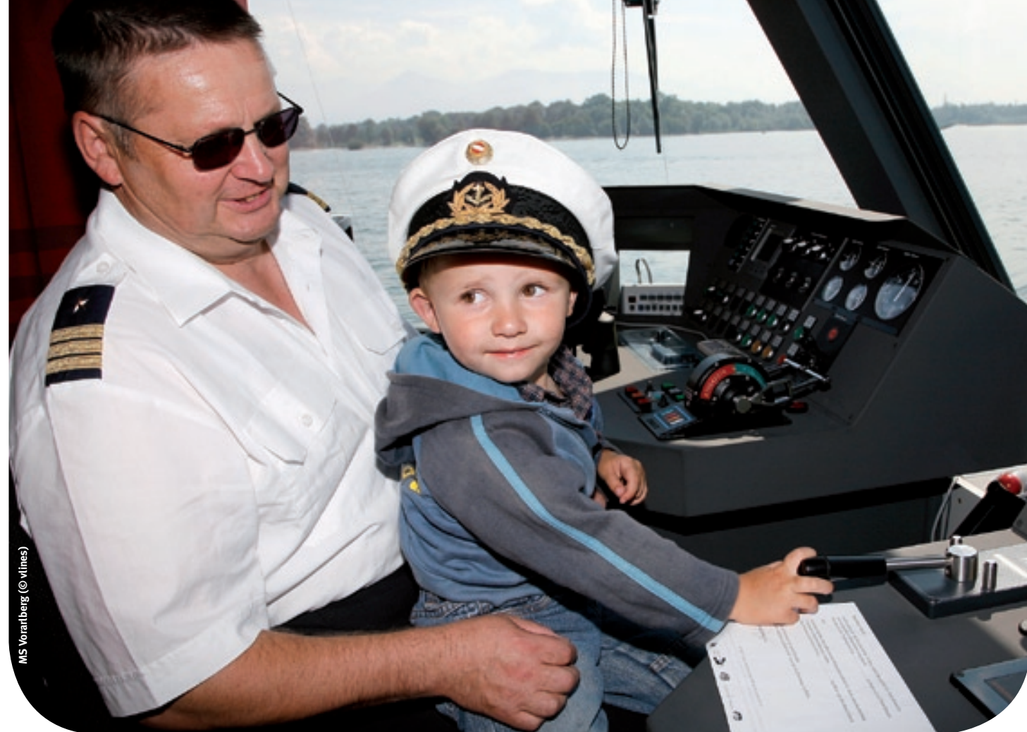
MS Vorarlberg

In diesem Sinne wünschen wir Ihnen eine schöne gemeinsame Ferienzeit.