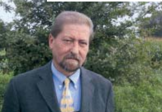
* Aktiver Obmann des Rheindeltaverains, Bürgermeister Werner Schneider