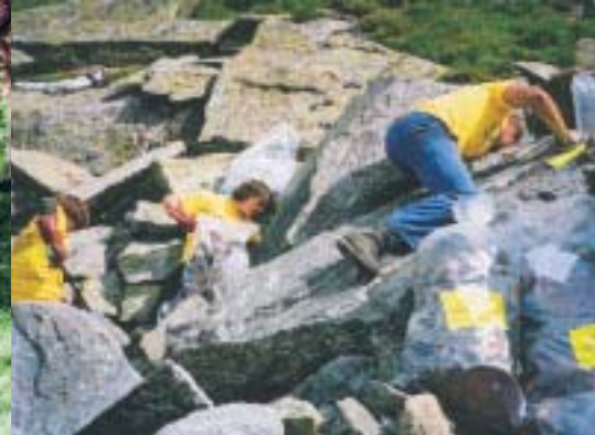
* Die „ehemaligen“ und neuen Mitglieder des Naturschutzzrats