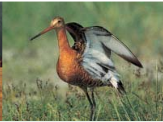
* Uferschnepfe in der Fußacher Bucht