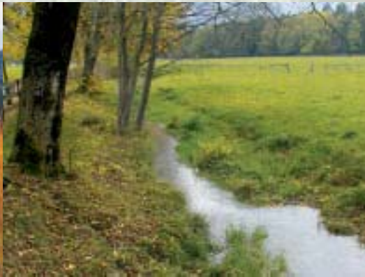
* In Ludesch wurde ein Bach naturnah zurück gebaut.