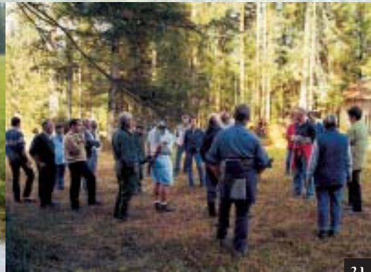
* Naturschutzberater informieren in Langenegg darüber, wie die Naturdenkmäler erhalten werden können.