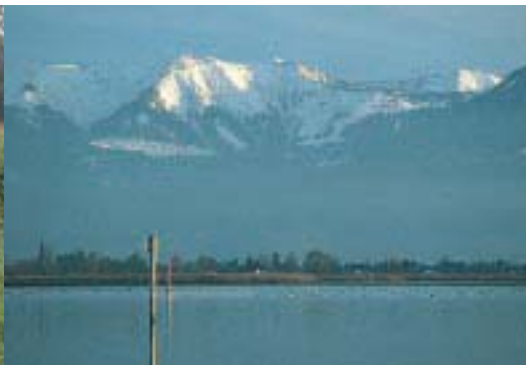
* Fußsacher Bucht