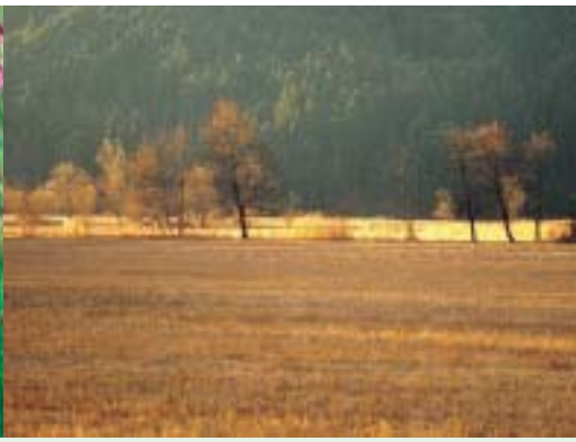
* Streuwiesenfläche im Walgau