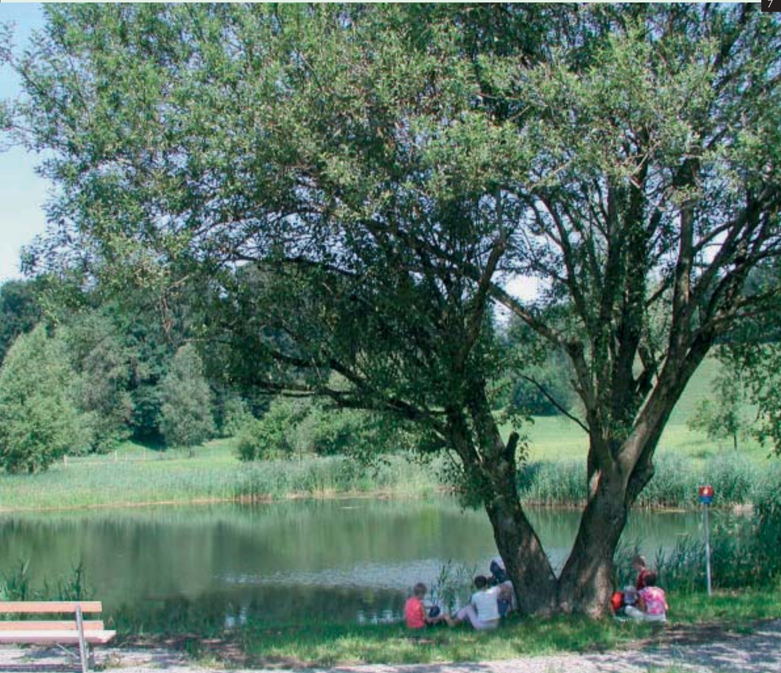
* Der Dörnlesee bei Lingenau bietet Ruhe und Erholung für Jung und Alt.