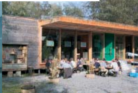
* Informationsdrehscheibe Rheindeltahaus