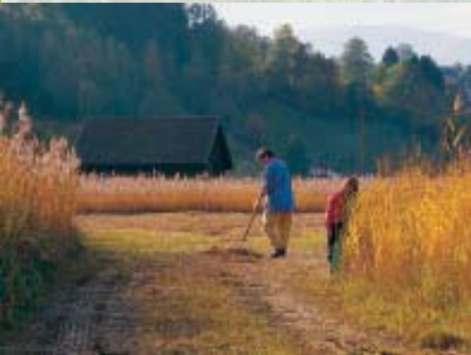
* Riedpflege in Frastanz

„LEBENDIGES DORF“ * NATURSCHUTZ IN DER GEMEINDE SCHAFFT LEBENSQUALITÄT