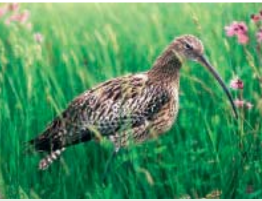
* Brachvogel am Alten Rhein