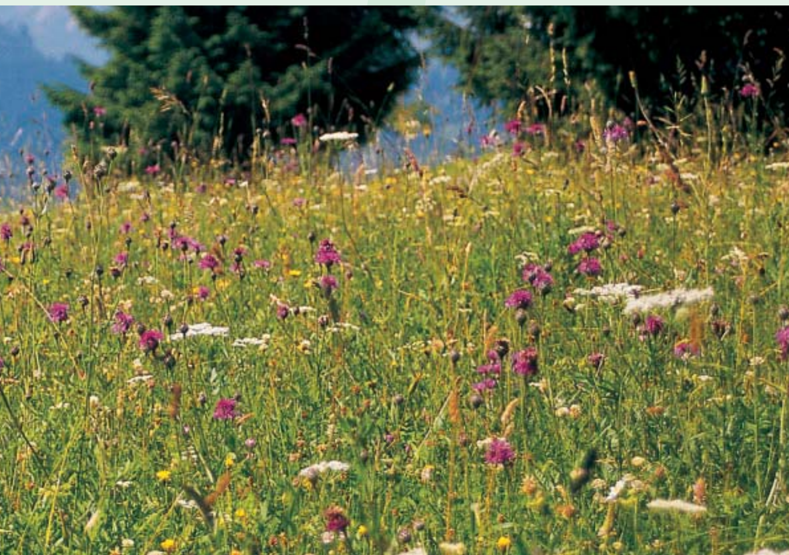
* Artenreiche Magerheuwiese

Auf fast hundert Hektar bleibt so die traditionelle Kulturlandschaft unseres Landes erhalten. *