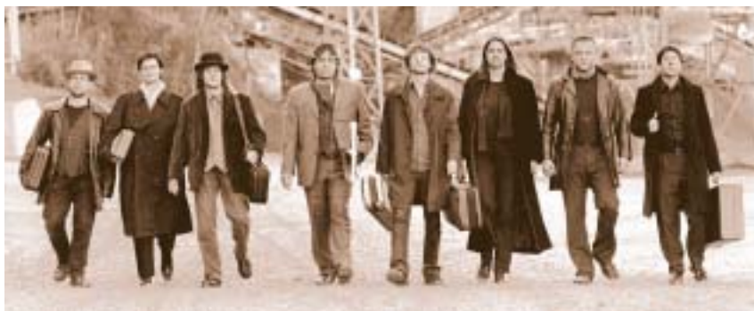
Das (Vorarlberger) Ensemble Plus gestaltet (bereits seit 5 Jahren) „Musik am Nachmittag“ im Auftrag der Stiftung (zur Förderung von Kultur und Zivilisation).

Das Vorarlberger ENSEMBLE PLUS gestaltet die Konzerte im Auftrag der Stiftung. Das Anliegen des Stifters ist es übrigens, die Konzertanzahl noch zu steigern, um noch mehr Menschen die Freude am Genuss von klassischer Musik zu ermöglichen. Gemeinsames Singen gehört dann genauso zum Programm wie Beiträge der örtlichen Musikschule. Bei den Konzerten steht übrigens ein Instrument im Mittelpunkt und wird näher vorgestellt und erklärt. Es wird also