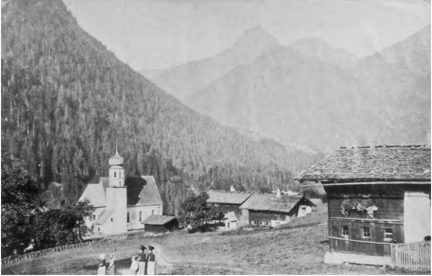
Ansicht von St.Gallenkirch um 1905

viele ähnliche Namen mehr. Die Aufzeichnungen des Jahres 1610 zeigen, dass die Familiennamen vielfach noch nicht feststanden. So ist etwa die Rede von einem Jöri Sander oder Düller , von einem Christa Felssa oder Sander oder einem Christa Gafanescha oder Carenberger . In der Liste von 1613 hingegen ist nur mehr ein Fall von schwankendem Gebrauch des Familiennamens vermerkt („Röckh oder Jacle“). Der Name „Corenberger“ fiel somit zumindest im Beichtregister einer Normierung zum Opfer. Selbst wenn er im Alltag weiter verwendet wurde, verweist zum Beispiel seine Eliminierung aus der Liste auf die bedeutende Rolle der Pfarrer bei der Festlegung von Familiennamen.