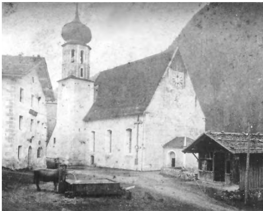
St. Gallenkirch mit Tanzlaube

Die folgende Edition gibt alle Namen des Beichtregisters buchstabengetreu wieder. Eine Ausnahme bilden offensichtliche Schreibfehler wie „Notzer“ statt „Nötzer“, „Pete“ statt „Peter“. Nicht korrigiert wurden heute ungebräuchliche Namensformen wie „Agtha“ oder „Urich“. An dieser Stelle sei darauf hingewiesen, dass „Christa“ und „Christl“ in der Frühen Neuzeit männliche Vornamen darstellten (Christian).