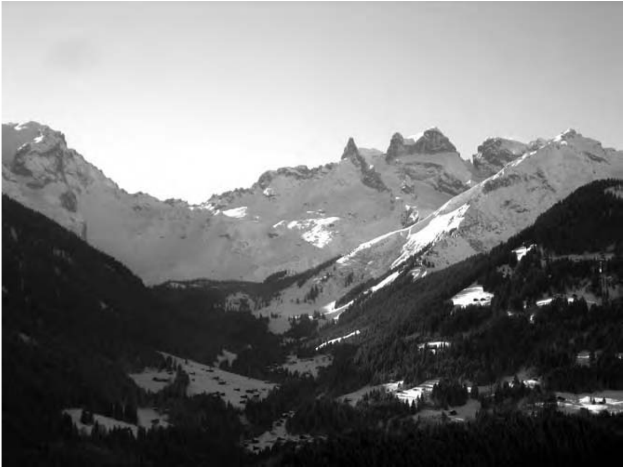
Blick vom Bartholomäberg in das Gauertal mit dem Drusentor links der Drei Türme, an deren Fuß sich die innere Spora-Alpe erstreckt.

Dass diese Gegenstände Relikte einer Schlacht zur Zeit des Schweizerkrieges darstellten, erscheint mehr als zweifelhaft. Hätte auf der Alpe Spora tatsächlich ein blutiges Gemetzel stattgefunden, wäre dies in den relativ detaillierten Unterlagen zum damaligen Kriegsgeschehen gewiss nicht unerwähnt geblieben, zumal ein solcher Sieg für die österreichische Seite einen willkommenen Ausgleich für ihre Niederlagen gebildet hätte. 12