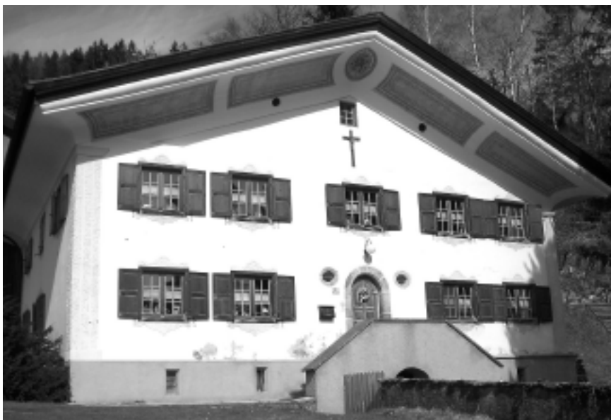
Der heutige Bartholomäberger Pfarrhof, der kurz nach 1700 – also einige Zeit nach Luzius Hausers Tod – errichtet wurde.