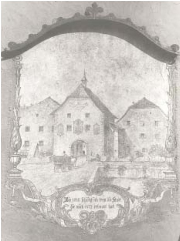
Erinnerung an das Kapuzinertor am östlichen Ausgang der Bludener Altstadt: Gemälde von Florus Scheel (1928)

fons Leuprecht herausgegebene „Heimatkunde“ stark aufgefrischt. Die darin abgedruckte Rekonstruktion des Tores aus der Feder des Fachlehrers Johann Jehly (1863-1950) bildete die Vorlage für ein Gemälde, das 1928 Florus Scheel am östlichen Eingang zur Altstadt anbrachte. 15 Um 1950 versah Hubert Fritz die Frontseite des städtischen Bauhofs in der Herrengasse mit einem großen Bild, das den Bau des „Montafoner- oder Kapuzinertors im 14. Jahrhundert“ darstellt. 16 Die beiden Gemälde sind die letzten Erinnerungen an das symbolträchtige Bauwerk, dem Basil Beiser 1845 die Abschiedsrede verfasste.