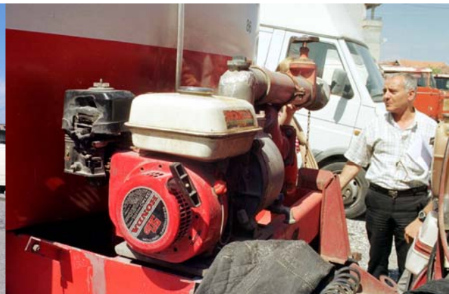
Pumpe des Wassertransportfahrzeuges

Das einzige funktionsfähige Einsatzfahrzeug ist ein LKW Iveco, Baujahr 1984. Dieses Fahrzeug wurde für den Wassertransport in das „Österreichcamp“ eingesetzt und anschließend der Feuerwehr überlassen. Das Fahrzeug hat ca. 18.000 km hinter sich, es besitzt über einen Wechselaufbau mit einem 8.000 Liter Tank und einer kleinen benzinbetriebenen Wasserpumpe. Der Druck dieser Pumpe ist keineswegs geeignet, eine effiziente Brandbekämpfung zu ermöglichen. Im Führerhaus liegen einige C-Schläuche und ein Strahlrohr.