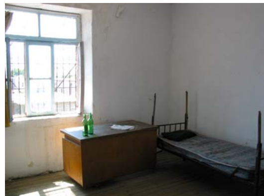
Bereitschaftsraum für die Feuerwehrleute

Im Gerätehaus der Stadt Shkoder sind die Unterkünfte der Mannschaft, das Büro des Kommandanten, das Magazin und die Notrufannahmestelle untergebracht. Das ganze