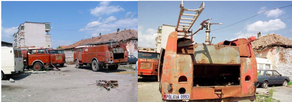
Funktionsuntüchtige Tanklöschfahrzeuge der FW Shkoder

Das Feuerwehrwesen in Albanien ist nach Polizeistrukturen organisiert, die Zuständigkeit liegt bei der Präfektur (entspricht etwa einer Bezirkshauptmannschaft). Ein neues Gesetz sieht vor, daß die Feuerwehren auch für Personenbergungen und Rettungen einzusetzen sind. Dazu fehlen aber noch alle Strukturen und Vorkehrungen. Grundsätzlich fehlt es an allem, es gibt weder geeignete Einsatzfahrzeuge, noch Einsatzbekleidung. Früher trugen die Feuerwehrmänner Polizeiuniformen, doch auch diese fehlen heute.