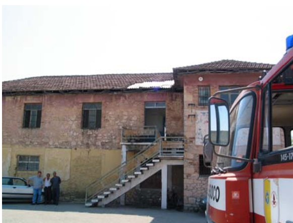
„Feuerwehrgerätehaus“ der Stadt Shkoder