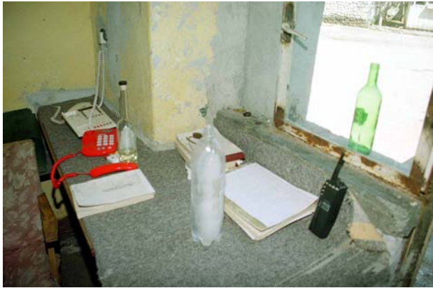
„Notrufzentrale“ der Feuerwehr Shkoder