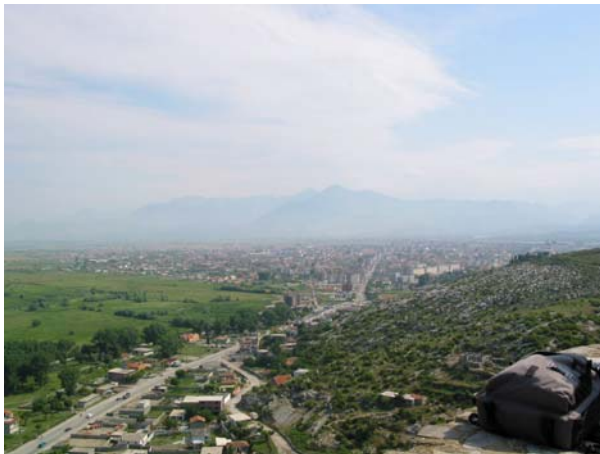
Blick auf Shkoder und Umgebung

In der Stadt Shkoder besteht ein Hydrantennetz, das angeblich ausreichend ist. Zusätzlich gibt es auch mehrere natürliche Wasserentnahmestellen. (Shkodersee, Flüsse).