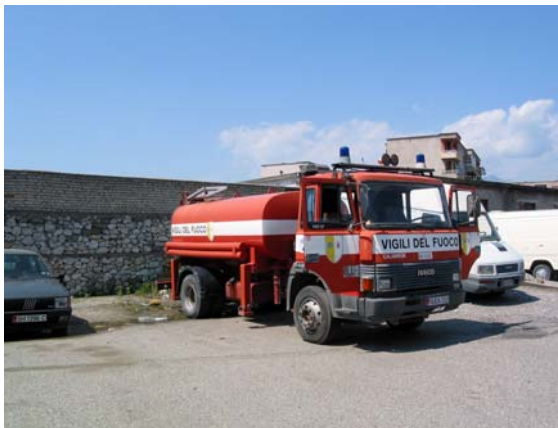
Wassertransportfahrzeug und zugleich einziges einsatzbereites Fahrzeug der FW Shkoder