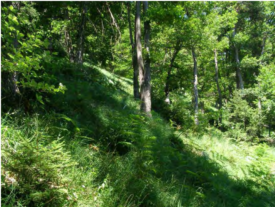
Abbildung 2: Der Waldtyp unterhalb der Letze - ein Pfeifengras-Föhren-Traubeneichenmischwald - ist in Vorarlberg extrem selten. Er ist zudem sehr artenreich und beherbergt viele gefährdete Pflanzen.

Auf den Trockenwiesen überwiegend seichtgründige, teils pseudovergleyte Lockersediment-Braunerde über abwechslungsreichem, dem Helvetikum zugehörigen Ausgangsgestein mit einer dichten Schichtfolge von Amdener Mergel, Seewer Kalk, Gault-Grünsandstein, Schrattekalk und Drusbergschichten, aus denen sich der hangabwärts folgende, mergelig- lehmige und daher wasserstauende Hangschutt zusammensetzt. Insbesondere die kalkreichen Gesteine entlang des Hangrückens von Schlattegg zur Letze begünstigen die rasche Wasserabfuhr.