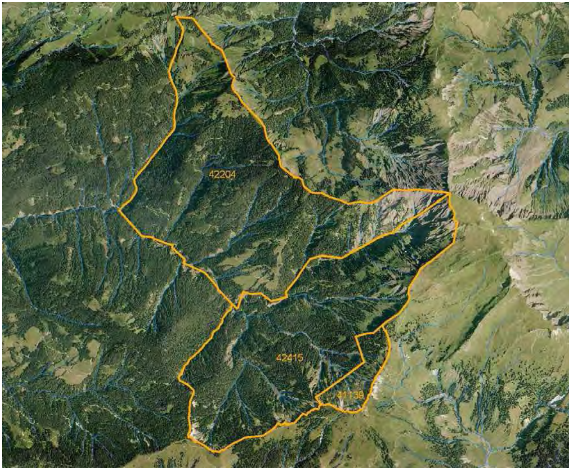
Abbildung 6: Das Großraumbiotop Hinteres Frödischtal hat Anteil an drei Gemeinden - Biotopfläche 42204 in Viktorsberg, 41139 in Laterns und 42415 in Zwischenwasser.

Das hintere Frödischtal von Engeres- und Bärenbachtobel taleinwärts bis zum Westabsturz des Hohen Freschen stellt eines der größten zusammenhängenden Waldgebiete Vorarlbergs dar. Es handelt sich um einen sehr naturnahen, hochmontan-subalpinen, heidelbeerreichen Fichten-(Tannen)wald. Mit Ausnahme des Forstwegs zur Pöpiswiesalpe ist der Bestand kaum erschlossen. Das Gebiet besitzt ansehnliche Bestände von Auer-, Birk- und Haselhuhn, Waldschnepfe, Eulen und Spechten. Der Großraumbiotop bildet einen zusammenhängenden Komplex mit den Großraumbiotopen 42415 in Zwischenwasser, 41139 und 41141 in Laterns.