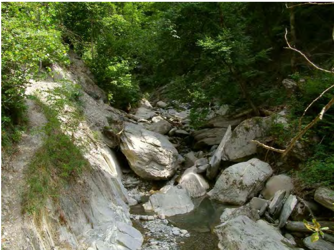
Abbildung 4: Der Ratzbach im Gemeindegebiet von Weiler nahe der Grenze zu Viktorsberg

Abwechslungsreicher, vielgestaltiger Bergbach mit bemerkenswertem Wasserfall in der Gefällsstrecke und einer Vielzahl von Kleinstrukturen, vom Grobblockgeröll bis zum Feinsand, als wertvoller Lebensraum wassergebundener Pflanzen und Tiere, wie z.B. Flohkrebse (Gammariden), Steinfliegen (Plecoptera), Eintagsfliegen (Ephemoptera) usw. Bachbegleitend ein artenreicher Bergahorn- Eschen- Tobelwald, dem neben anderen Laubbäumen auf den licht bestockten Steilhangbereichen auch Mehlbeere ( Sorbus aria ), Waldföhre ( Pinus sylvestris ) und Fichte ( Picea abies ) beigemischt sind.