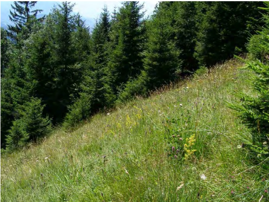
Abbildung 3: Trespen-Halbtrockenrasen östlich Viktorsberg an den Abhängen des Letze

Auf den von Gebüschgruppen mit Haselnuss ( Corylus avellana ), Liguster ( Ligustrum vulgare ), Weißdorn ( Crataegus monogyna ) und Rosen ( Rosa sp.) sowie einzelnen Traubeneichen ( Quercus petraea , 2), Eschen ( Fraxinus excelsior ) und Walnussbäumen ( Juglans regia ) aufgelockerten Halbtrockenrasen sticht das Vorkommen der ausrottungsbedrohten Herbst-Drehwurz ( Spiranthes spiralis , 1) besonders hervor. Randlich Adlerfarnsäume ( Pteridium aquilinum ), an sickernassen Stellen und im Waldunterwuchs dominiert Rohr-Pfeifengras ( Molinia arundinacea , 4) als Wechselfeuchtezeiger. Die Magerwiesen streichen unter- und oberhalb des Traubeneichenwaldes in Nordostrichtung, wo sie in Bereich Steinwiesen unterhalb der Letze von magerer Alpweide abgelöst werden.