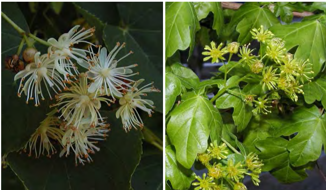
Abbildung 5: Die beiden in Vorarlberg seltenen Gehölze, Winterlinde ( Tilia cordata ), links und Feldahorn ( Acer campestre ), rechts

Dynamischer Bergbach in schluchtartig eingeschnittenem Tobel mit sehr abwechslungsreicher natürlicher Ausstattung, wie grobblockiges und feinkörniges Schwemmgut, schießenden und langsam strömenden Fließstrecken, Kolken, Totholz usw. Durch die Hochwässer der letzten Jahre kam es in den unteren Hangbereichen zu massiven Abspülungen und in der Folge zu Verkläuerungen. Der Bachlauf wird begleitet von einem artenreichen, bis ans Bachbett herantretenden Mischwald überwiegend aus Laubböhlzern. Zumindest kleinflächig sind auf den steilen Hangbereichen inselartig Eiben-Buchenwälder in den Buchen-Tannen-Fichtenwald eingelagert.