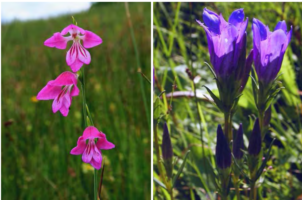
Abbildung 5: Die vom Aussterben bedrohte Sumpf-Gladiole ( Gladiolus palustris ), links, und der stark gefährdete Lungenzian ( Gentiana pneumonanthe ), rechts - zwei typische Streuwiesenarten.

Im Jahr 2006 konnte der Langblättrige Sonnentau ( Drosera anglica ) nicht wiedergefunden werden.