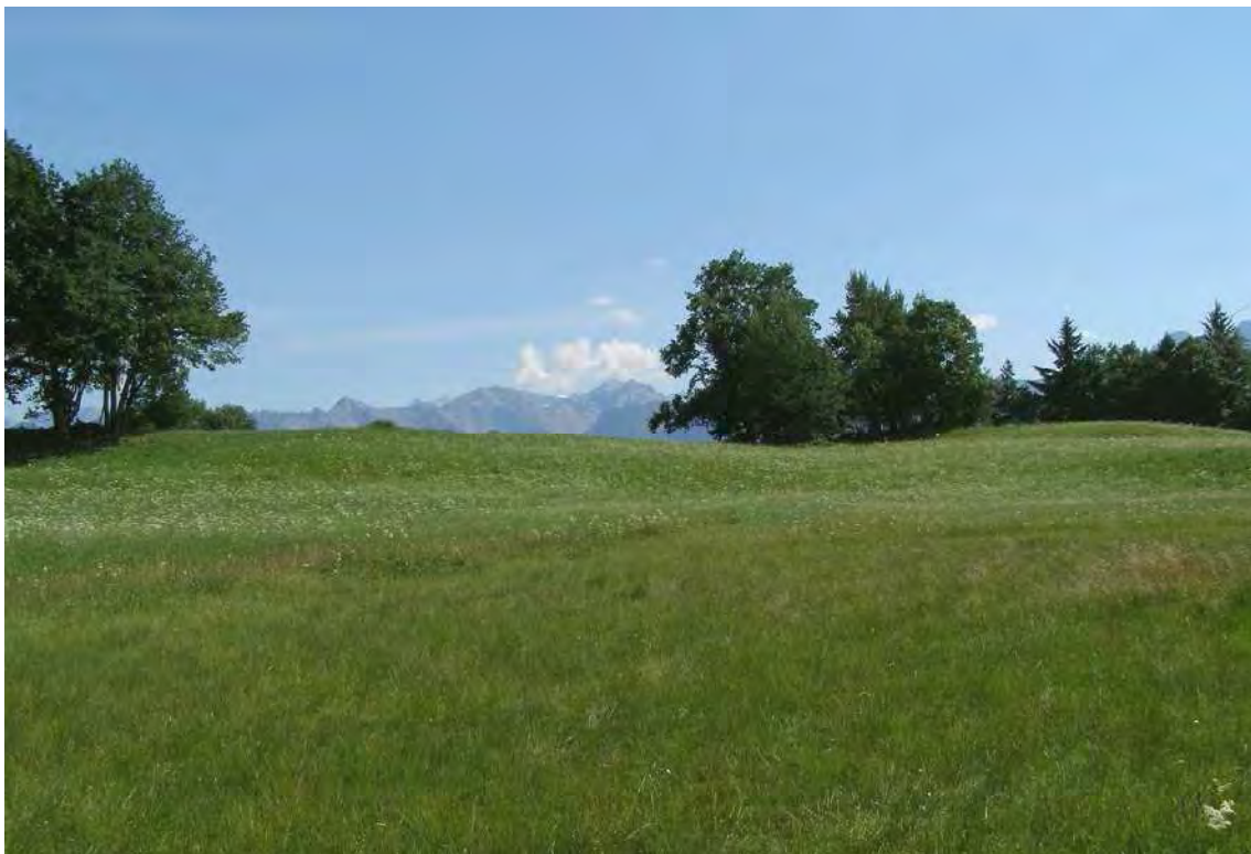
Abbildung 3: Das kleine torfmoosreiche Übergangsmoor westlich des Tubarieds.

Im eigentlichen Turbaried (Teilfläche TF 01) ist ein sehr abwechslungsreiches Vegetationsmosaik entwickelt, aus einer Alpenwollgras-Gesellschaft im Norden, gefolgt von Kopfbinsenrasen und Kleinseggenflächen. An staunassen Stellen stockt Schilfröhricht, in Mittelteil noch eine zusammenhängende Torfmoosdecke. Ein vormals von Kleinem Wasserschlauch ( Utricularia minor ) bedeckter Torfgraben war zum Aufnahmezeitpunkt großteils zugeschüttet. Bäume und Gebüschgruppen, v.a. aus Hänge-Birke ( Betula pendula ) und Faulbaum ( Frangula alnus ) steigern landschaftlichen Reiz und ökologischen Wert des Gebietes gleichermaßen.