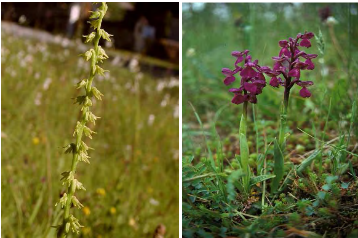
Abbildung 2: Die beiden stark gefährdeten Orchideenarten, Einknolle ( Herminium monorchis ), links, und Kleines Knabenkraut ( Orchis morio ), rechts.

Das Biotop stellt einen überwiegend feuchten bis wechselfeuchter Hangmoorkomplex mit einem staunassen Schilfröhricht und einer Mädesüß-Hochstaudenflur entlang eines frei fließenden Wiesenbächleins dar. In einer sickerfeuchten Mulde kommen kleinflächige Ausprägungen eines für Vorarlberg sehr seltenen Mehlprimel-Kopfbinsenrasens vor, daneben treten pfeifengrasdominierte Flächen auf, mit unscharfen Übergängen zu gedüngten Fettwiesen. Wenngleich die stark gefährdeten Arten, darunter Einknolle ( Herminium monorchis ), Kleines Knabenkraut ( Orchis morio ) im Jahr 2006 nicht aufgefunden werden konnten, ist damit zu rechnen, dass diese sehr wertvollen Arten noch immer in diesem Biotop vorkommen. In einem kleinen Verlandungstümpel tritt der Fieberklee ( Menyanthes trifoliata ) auf. Insgesamt bemerkenswert reichhaltige Flächen.