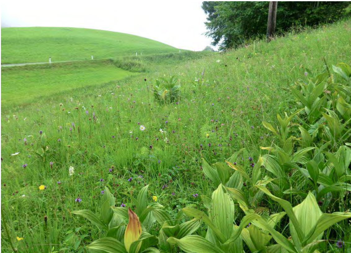
Pfeifengraswiese mit Weißem Germer und verschiedenen Orchideenarten

Ein Davallseggenried mit der stark gefährdeten Flohsegge ( Carex pulicaris ), viel Geflecktem Knabenkraut ( Dactylorhiza maculata ), Trollblume ( Trollius europaeus ) und Sterndolde ( Astrantia major ) nimmt große Bereiche des Nordabhanges ein. Hangaufwärts geht es in eine bodensaure Magerwiese mit Ruchgras ( Anthoxanthum odoratum ), Arnika ( Arnika montana ) und Heidekraut ( Calluna vulgaris ) über.