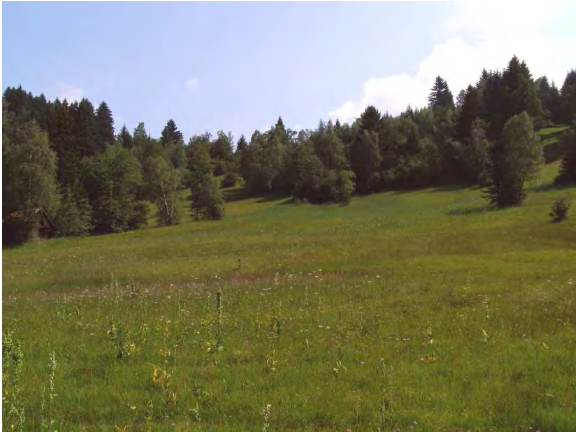
Abbildung 4: Hang- und Quellmoore im zentralen Bereich des Feuchtgebietskomplexes.