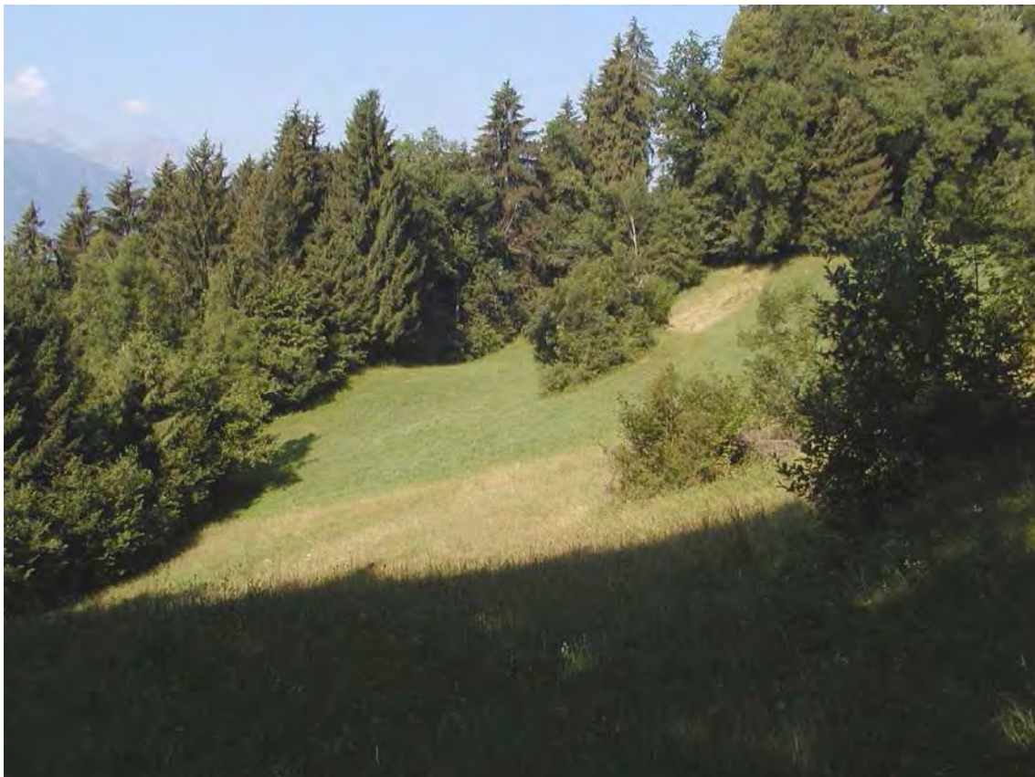
Abbildung 6: Kleinflächige Verzahnungen von Gehölzen, Mager- und wechselfeuchten Wiesen kennzeichnen die Kulturlandschaft bei Pargrand.

Die Umrahmung der Waldinseln wird von teilweise mageren Glatthaferwiesen bestimmt, stellenweise treten Trespen-Halbtrockenrasen und Tieflagen-Bürstlingsrasen auf. Brachflächen werden von Berg-Reitgras ( Calamagrostis varia ) und Pfeifengras ( Molinia caerulea ) bestimmt. Am Nordrand der Fläche liegt eine kleine Kalktuffquelle mit umgebendem Riesen-Schachtelhalmbestand. Kleine Bereiche des Biotops reichen bis auf Thüringer Gemeindegebiet.