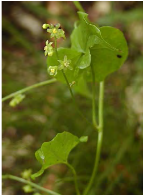
Abbildung 2: Die Steilhangwälder am Talausgang der Lutzschlucht, rechts die stark gefährdete Schmerwurz ( Tamus communis ) eine atlantisch-mediterrane Art.