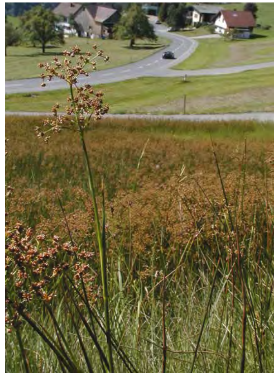
Abbildung 4: Links, sehr blütenreiche Trespens-Halbtrockenrasen in Außerberg; rechts der recht ausgedehnte Bestand der stark gefährdeten Knötchen-Simse ( Juncus subnodulosus ) an der Straße nach St. Gerold.