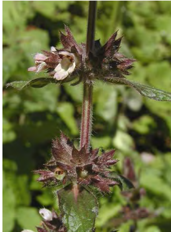
Abbildung 7: Im linken Bild ist der vom Teich-Schachtelhalm ( Equisetum fluviatile ) dominierte Teich zu sehen, rechts die seltene westlich-submediterran verbreitete Stinkende Schwarznessel ( Ballota nigra ssp. meridionalis ).