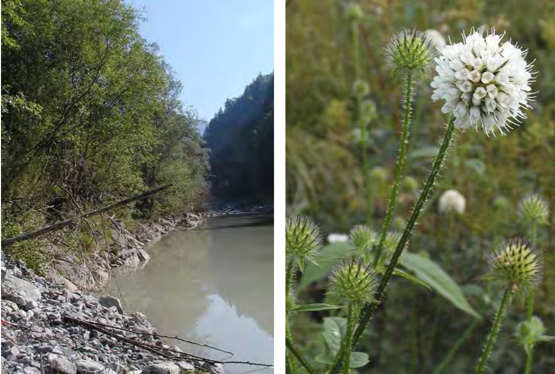
Abbildung 5: Die Auwaldfragmente am Lutzufer unterhalb des Laufkraftwerks, rechts die stark gefährdete Borsten-Karde ( Dipsacus pilosus ) eine seltene Art gestörter Standorte.