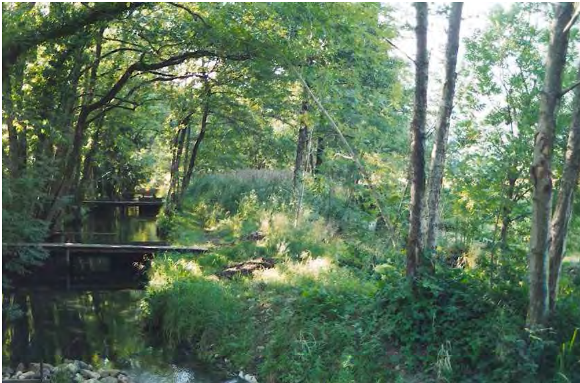
Abbildung 10: Schwarzerlen ( Alnus glutinosa ) begleiten den bei den Thüringer Weihern naturnah fließenden Schwarzbach.

Die naturnahe, teils von Gehölzen v.a. der Schwarzerle ( Alnus glutinosa ) begleitete Bachstrecke weist neben ausgeprägten Fließwasserzonen auch Ruhigwasserbuchten auf. Demzufolge reiche Differenzierung der Unterwasservegetation und der Ufervegetation. Im kaum bewegten Wasser sind bezeichnend: Schilfröhricht ( Phragmitetum australis ), eng verzahnt mit einem Steifseggensumpf ( Caricetum elatae ). Vorkommen des Tannenwedels ( Hippuris vulgaris ).