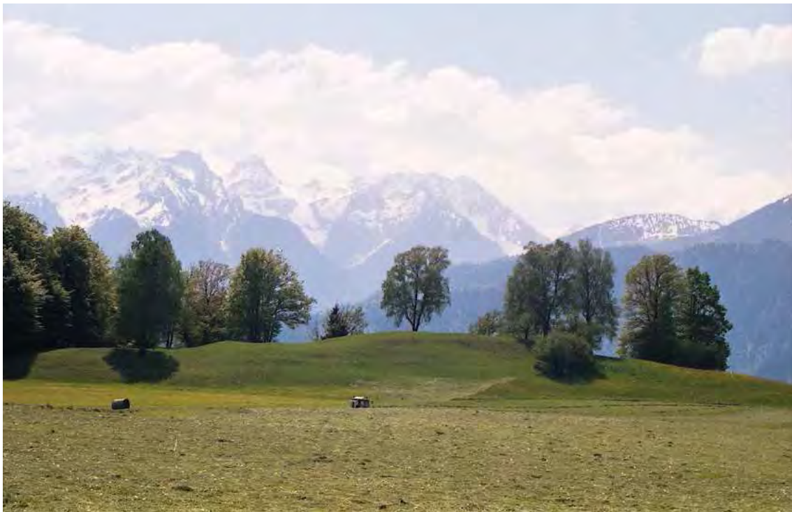
Abbildung 5: Blick auf eine der sechs Teilflächen des Biotopes Quadern mit erhaltenswertem Halbtrockenrasen.

Neben diesen extensiv bewirtschafteten Wiesen finden sich im Thüringer Gemeindegebiet häufig kleinste Halbtrockenrasen-Fragmente entlang der kurvenreichen Straßen vom Talboden bis hinauf zur Hochebene. Auf die Erhaltung der Wegrandflora ist bei den zuständigen Stellen hinzuweisen.