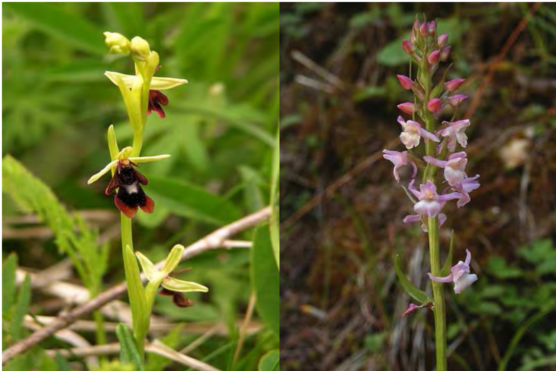
Abbildung 11: Zwei für lichte Föhrenwälder typische Orchideen, die Fliegenragwurz ( Ophrys insectifera ), links, und die Wohlriechende Händelwurz ( Gymnadenia odoratissima ), rechts.

Gegenwärtig stehen speziell die wüchsigeren Föhrenwälder (z.T. wohl auch Aufforstungen) über weite Strecken in einem dichten Bestand mit engem Kronenschluss und sind teilweise recht dunkel. Der Unterwuchs dieser Bestände ist eher schütter, moosreich und neigt zur Versauerung. Den typischen grasigen Unterwuchs der “reifen“ Föhrenwälder zeigen dagegen die lichter Bestände, die teilweise auch einer forstlichen Nutzung unterliegen.