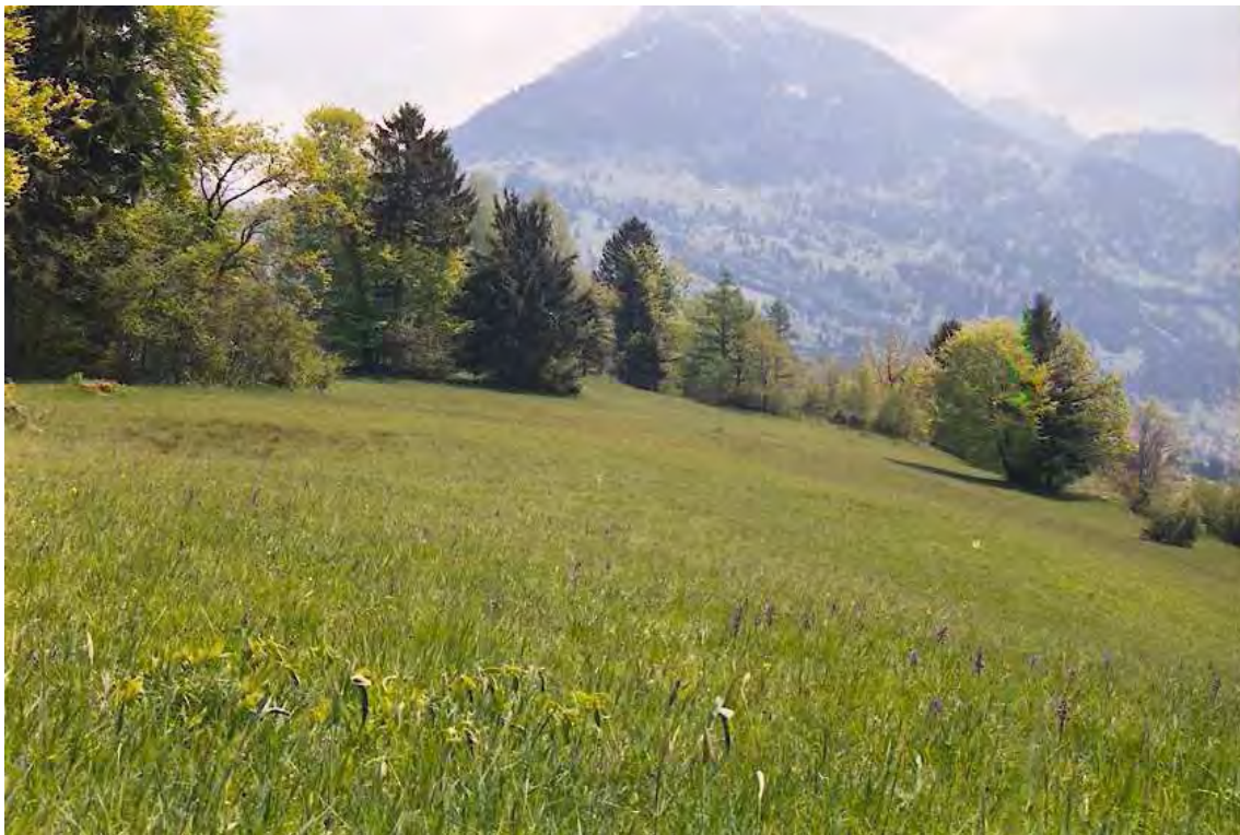
Abbildung 2: Orchideenblüte in den Magerwiesen von Flugeline.

Das Biotop ist Teil des Landschaftsschutzgebietes „Montiola“.