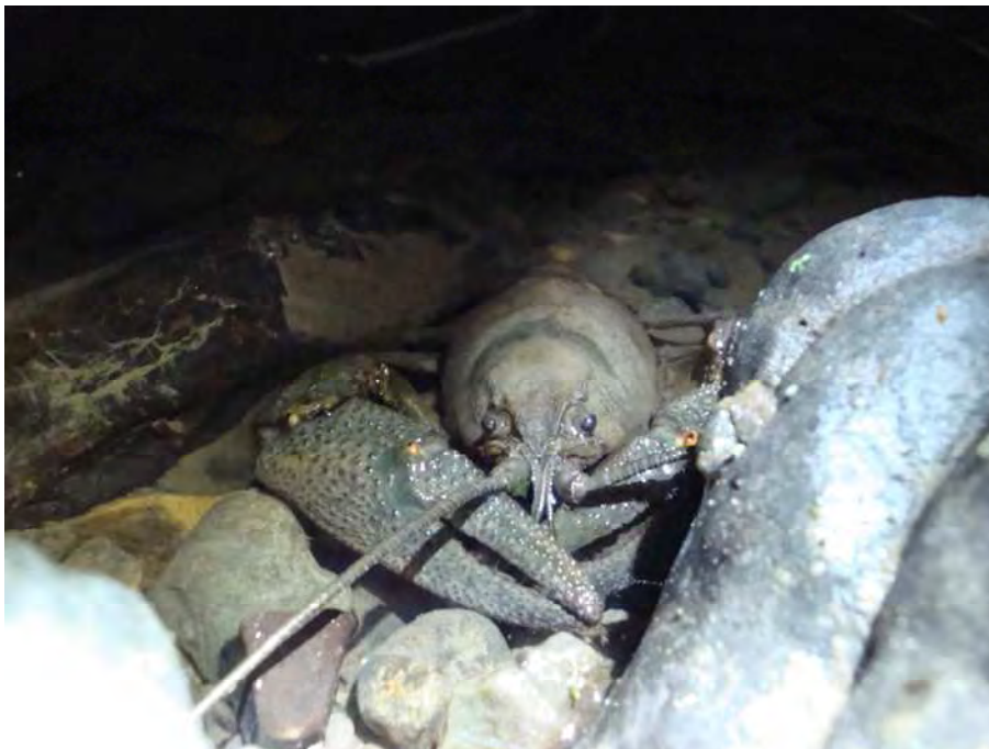
Abbildung 14: Der vom Aussterben bedrohte Steinkrebs hat eines seiner letzten Vorarlberger Vorkommen in den Walgauer Gemeinden Thüringen, Schlins, Satteins und Röns. Er benötigt saubere, naturnahe Bäche zum Leben.