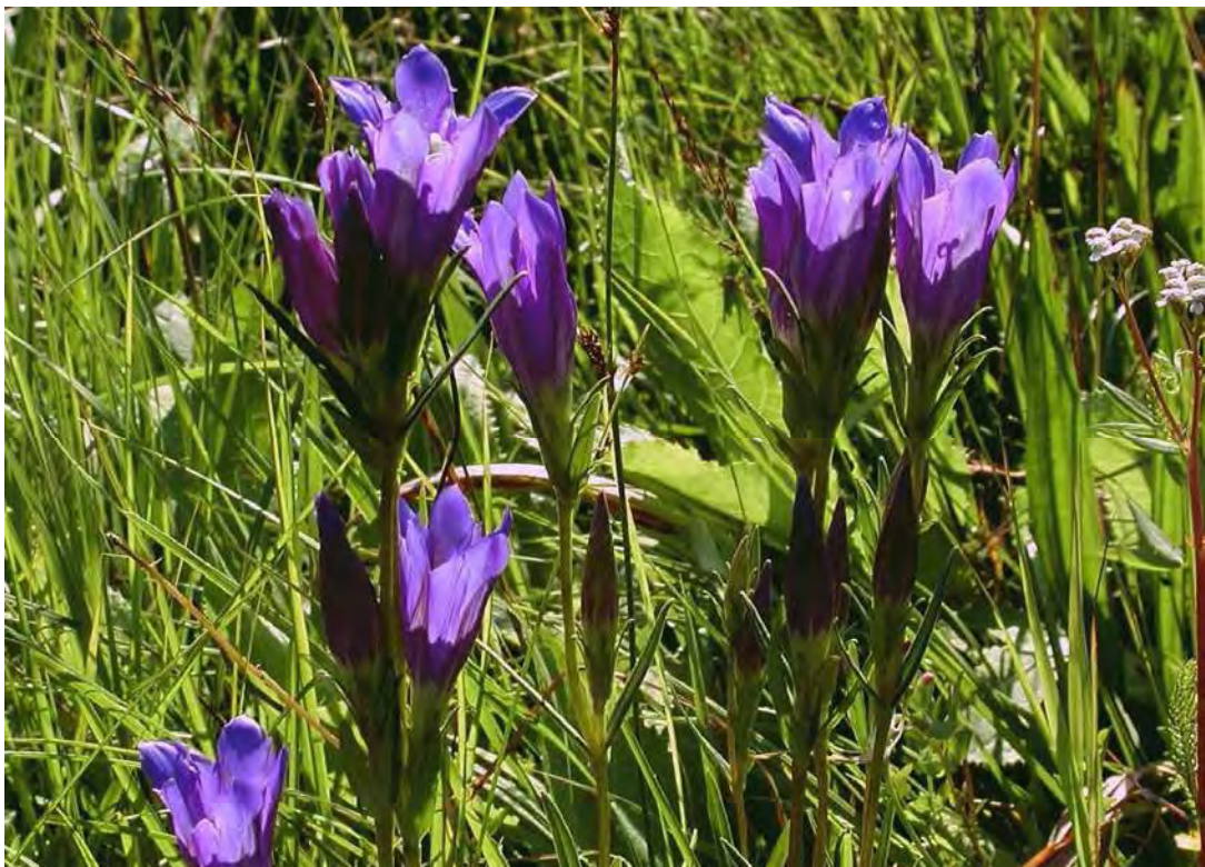
Abbildung 9: Der stark gefährdete Lungen-Enzian ( Gentiana pneumonanthe ), eine typische Art der Pfeifengraswiesen.

* Art-Angaben mit * versehen sind nach Fritz Winsauer, Thüringen.