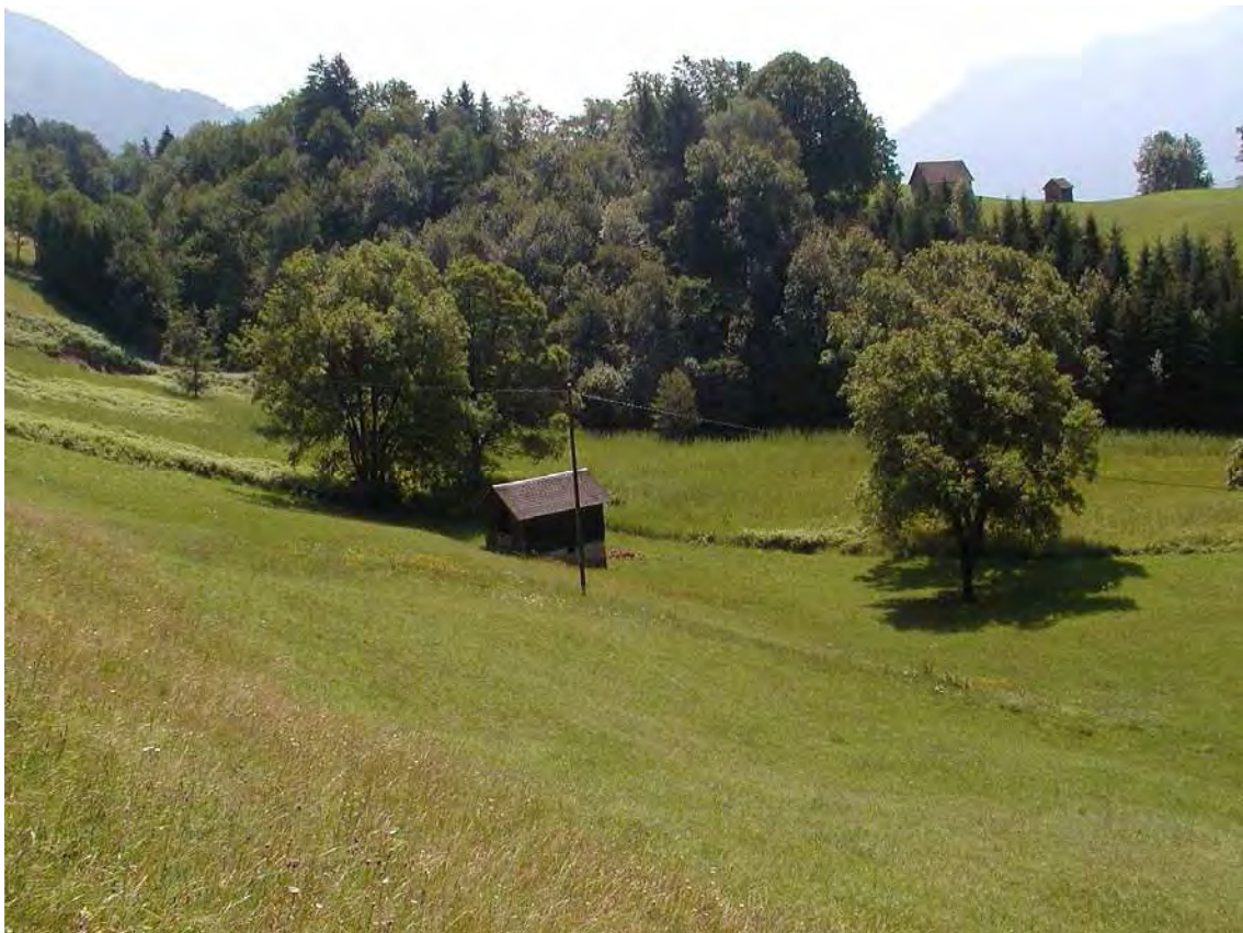
Abbildung 13: Blick auf die Feuchtflächen in der Mulde bei Rauhen.

Die Biotopfläche setzt sich aus Goldhafer-Fettwiesen mit alten Einzelbäumen und Adlerfarnbrachen an den südseitigen Einhängen und ausgedehnten Schilfröhrichtern und einem kleineren artenreichen Flachmoor mit zahlreichen gefährdeten Arten in der Wiesenmulde zusammen. Die Fläche ist durch ihre Strukturierung von hohem landschaftlichem Reiz. Nach Westen geht die Fläche in das Gemeindegebiet von Thüringerberg über. Sehr bemerkenswert ist das Vorkommen des vom Aussterben bedrohten Fleckenschierling ( Conium maculatum ) in den Schilfröhrichtern.