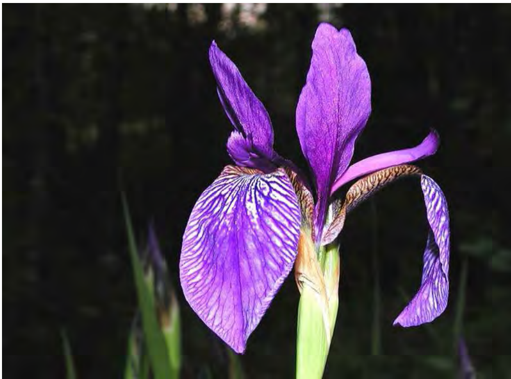
Abbildung 7: Die stark gefährdete Sibirische Schwertlilie ( Iris sibirica ) ist eine der attraktivsten Arten der Streuwiesen des Montieler Riedes.