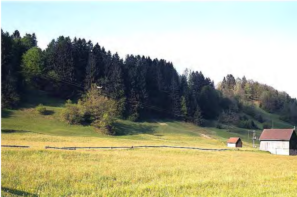
Abbildung 4: Bildausschnitt aus der alten Kulturlandschaft von Pargrand (Wald mit angrenzenden Hängen). Das vielfältige Gebiet ist Teil des Landschaftsschutzgebietes „Montiola“.

Das Biotop ist Teil des Landschaftsschutzgebietes „Montiola“.