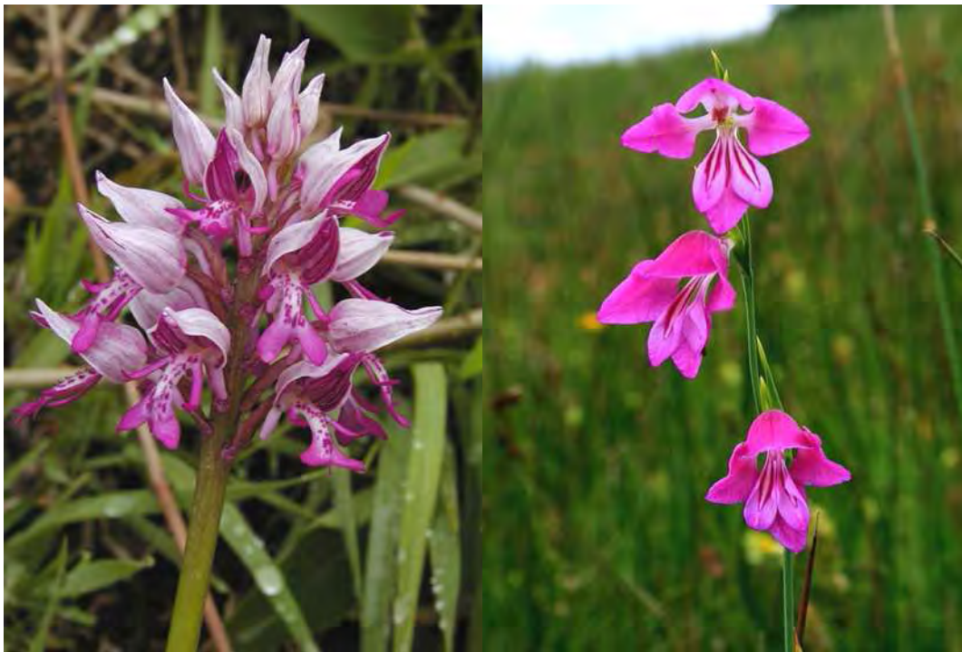
Abbildung 3: Zwei botanische Raritäten, die im Biotop von Flugeline beheimatet sind - das stark gefährdete Helm-Knabenkraut ( Orchis militaris ) links, und die vom Aussterben bedrohte Sumpf-Siegwurz ( Gladiolus palustris ), rechts.

* Art-Angaben mit * versehen sind nach Fritz Winsauer, Thüringen.