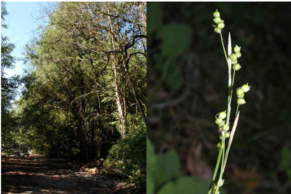
Abbildung 12: Die Restbestände der Lutzauen mit sehr alten Lavendelweiden ( Salix eleagnos ). Rechts: Der Unterwuchs wird auf den Schotterlinsen von der Weiß-Segge ( Carex alba ) dominiert.

Es handelt sich bei diesem Biotop um einen der letzten flächigen Auwaldreste der Lutz mit einem vorgelagerten, recht ausgedehnten Schotteralluvion an der Gemeindegrenze zu Thüringerberg. Die Randbereiche des Auwaldes werden von Lavendelweiden ( Salix eleagnos ) dominiert, nach Norden hin übernehmen Eschen, Bergahorne und Grauerlen die Dominanz. Entlang von schmalen, alten Altarmen stocken aber auch innerhalb des Auwaldes noch teilweise sehr alte Lavendelweiden. Die gesamte Fläche ist sehr totholzreich und als Lebensraum für Vögel und Kleinsäuger von Bedeutung. Der Unterwuchs ist nur teilweise natürlich und wird stellenweise von Neophyten beherrscht. Die dem Wald vorgelagerten Alluvionen sind zum Begehungszeitpunkt unbewachsen.