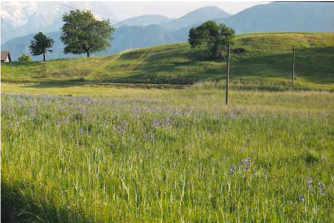
Abbildung 6: Irisblüte im Montioler Ried. Neben der Bedeutung für die Flora ist das Montioler Ried auch ein wichtiger Laichplatz für viele Amphibien.

Das Biotop ist Teil des Landschaftsschutzgebietes „Montiola“.