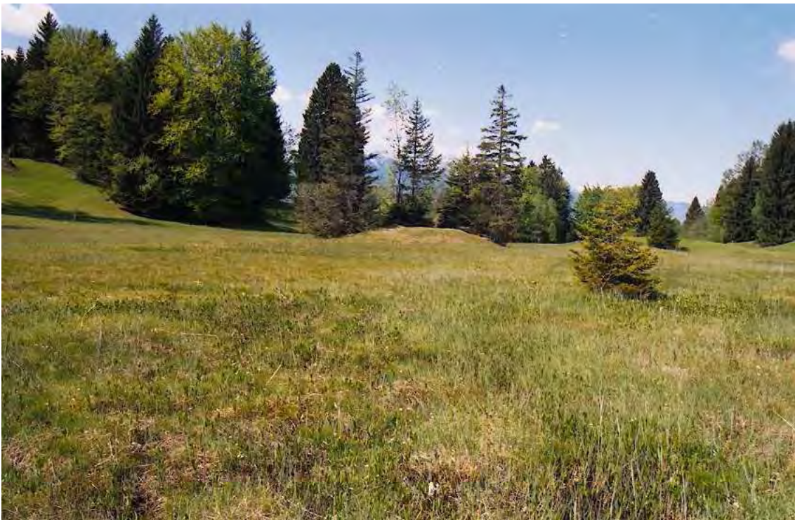
Abbildung 8: Das artenreiche Flach- und Zwischenmoor von Unter Pargrand kommt auf Grund seines speziellen Charakters mit Schlenken und bultartigen Erhebungen überregionale Bedeutung zu.

Das Biotop ist Teil des Landschaftsschutzgebietes „Montiola“.