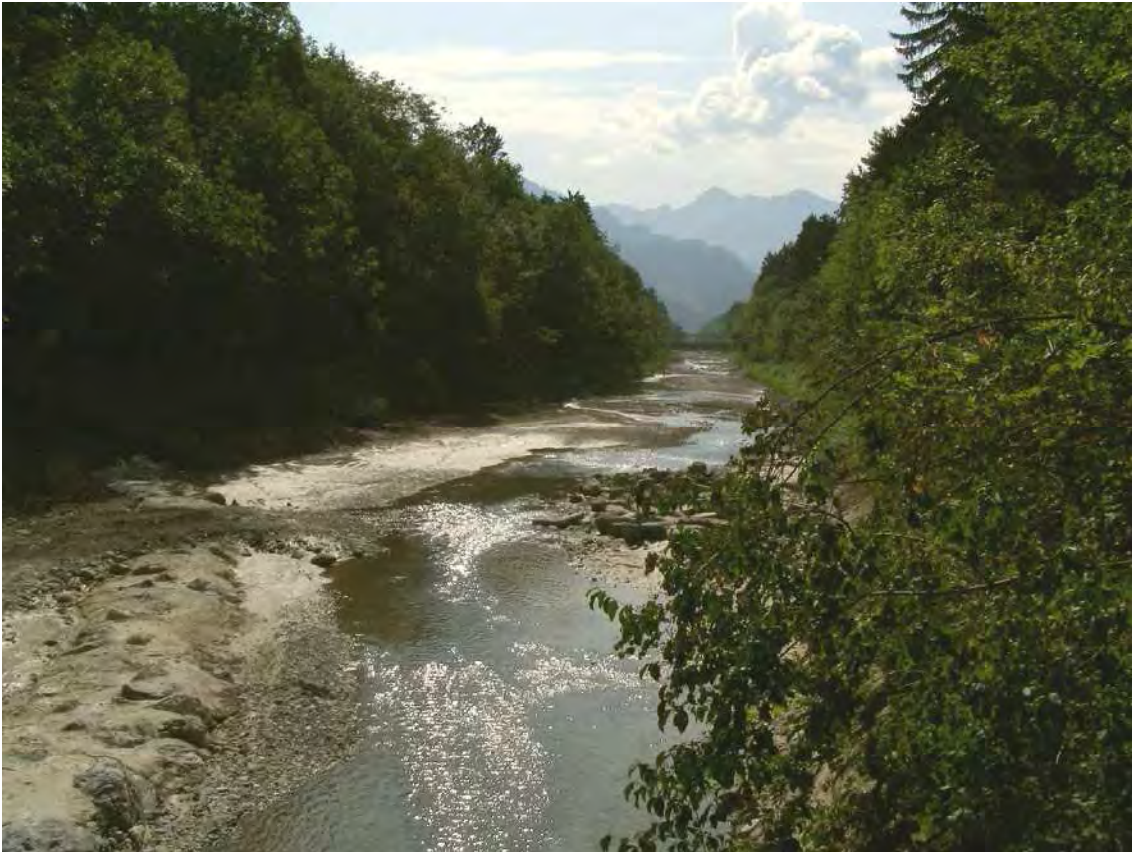
Abbildung 2: Die Frutzaugen im Bereich Schelma; Blick nach Nordwesten.