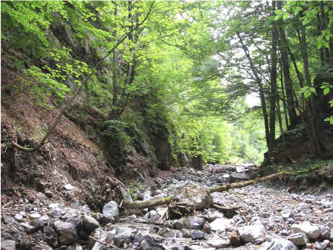
Abbildung 6: Schotterbett des Graves er Bachs.