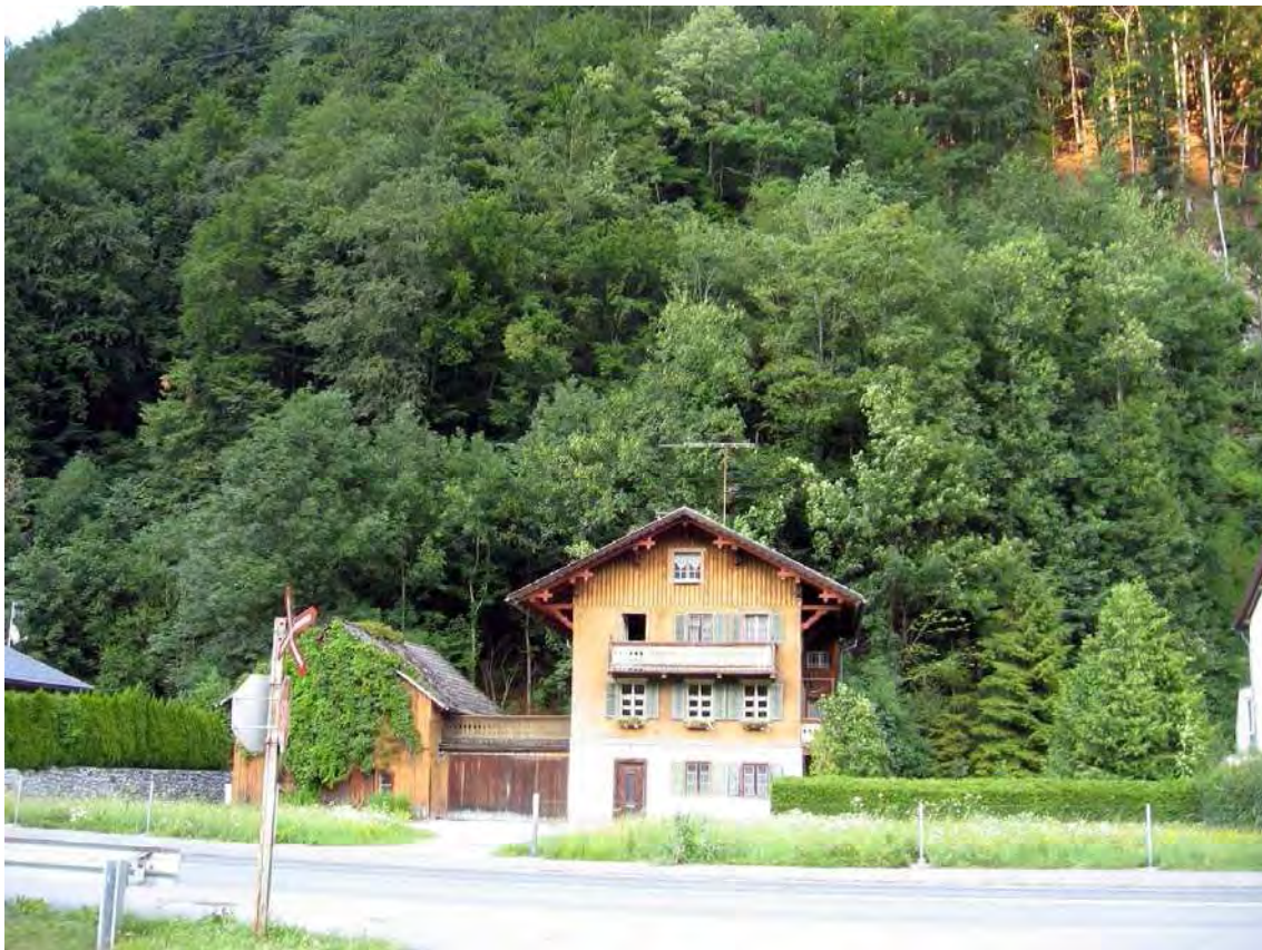
Abbildung 4: Blick auf den Bödlwald von der Bundesstraße aus.

Geschlossener, forstlich kaum beeinflusster Braunerde-Buchenwald am steilen Talhang unmittelbar hinter den Häusern, an der Gemeindegrenze nach Bartholomäberg. Der Wald setzt sich in Bartholomäberg, in einem Waldkomplex aus Kalk-Buchenwäldern fort.