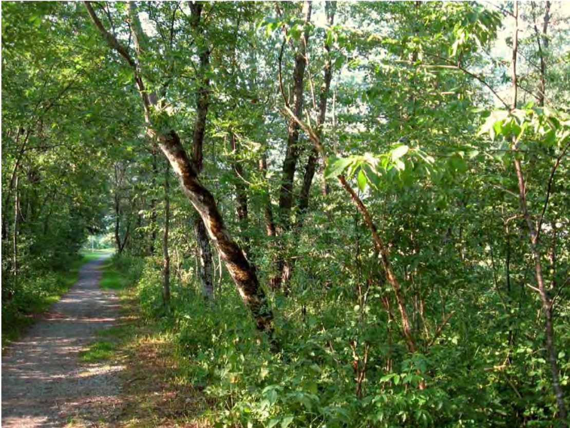
Abbildung 5: Grauerlenreicher Auwaldrest an der Ill.