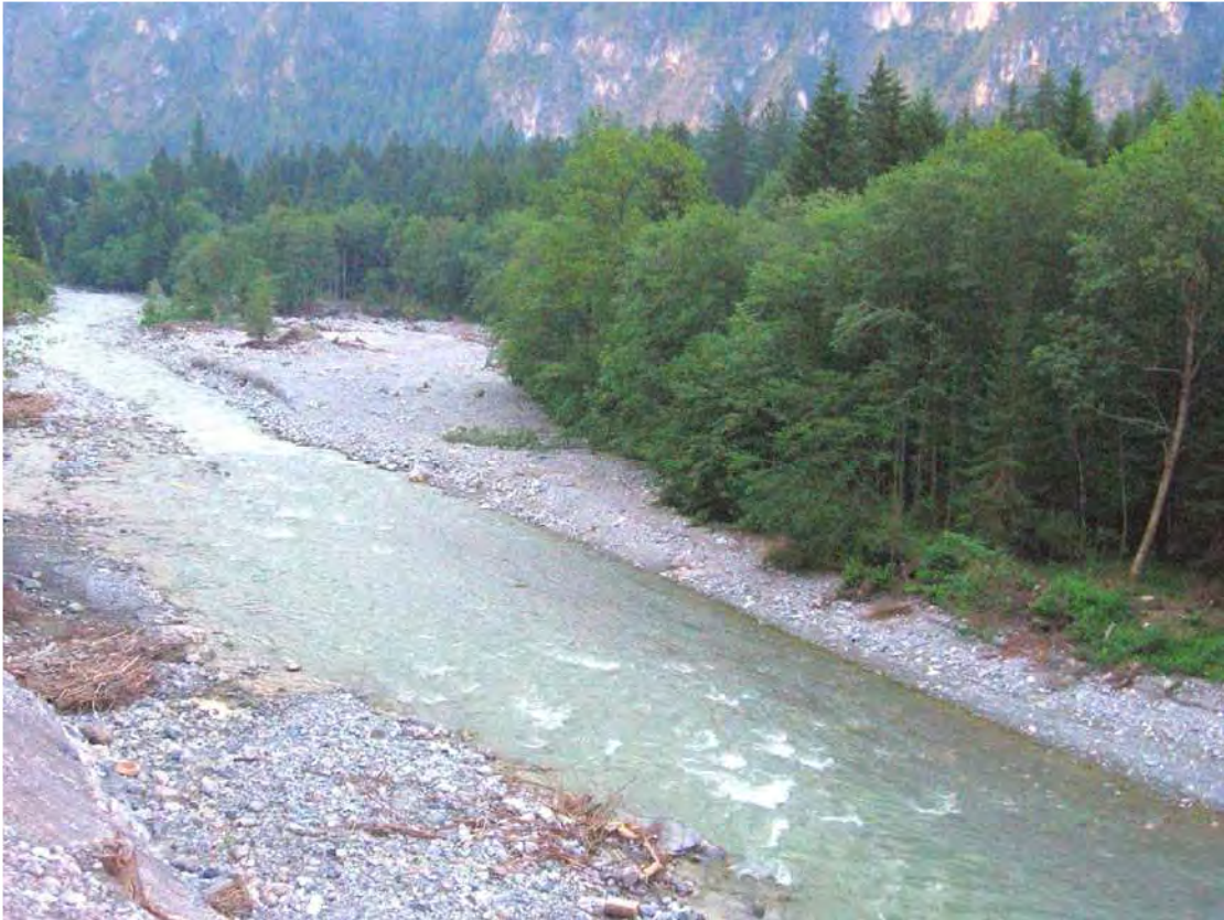
Abbildung 2: Große Schotterfläche an der Ill, die hier ihren Lauf verlagert hat.