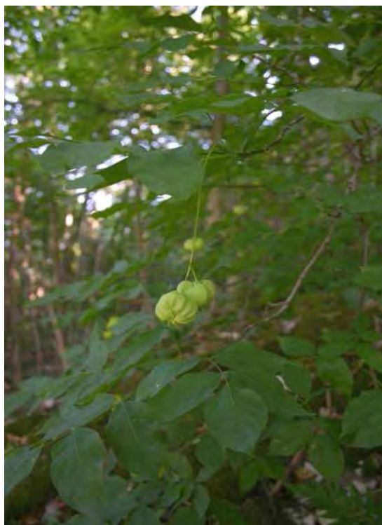
Abbildung 2: Buchenwald mit wärmeliebenden Elementen wie der seltenen Pimpernuß ( Staphylea pinnata ), hier fruchtend.