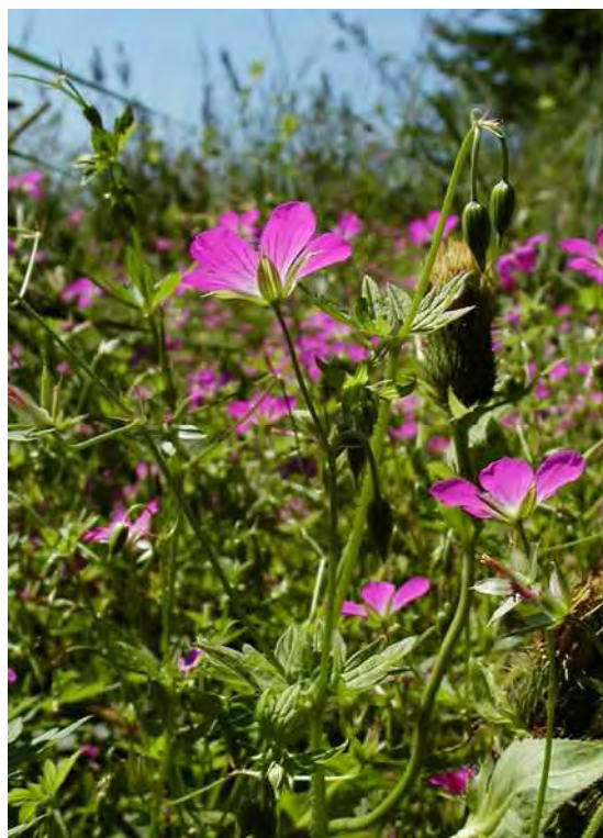
Abbildung 3: links die gefährdete Spitzblütige Simse ( Juncus acutiflorus ), eine charakteristische Art von basenarmen Streuwiesen, rechts, der in den Hochstaudenfluren des Rheintals nicht seltene Sumpf-Storchschnabel ( Geranium palustre ).