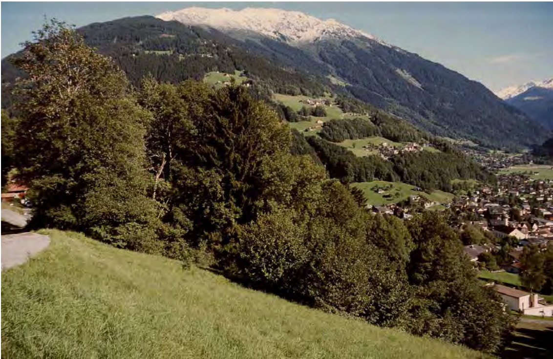
Abbildung 10: Schwarzerlenquellwald auf Montiola.

Die Quellwälder auf Montiola liegen im Bereich von Däscha-Lavadiel, Fitschamühli und dem Gavaduratobel bei Daneu. Die Schwarzerlenquellwälder stellen den untersten Teil des großen Quellsystems im Berger Moränengebiet dar, das bei Sasälla unter dem Fritzensee beginnt und sich über die Flachmoore beim Riederhof in mehreren Stockwerken bis zu den Montiolaquellen erstreckt. Zusammen mit dem Bartholomäberger Teil bilden sie einen für das Tal einzigartigen Biotopkomplex, der in Vorarlberg kaum Parallelen hat. Daneben kommt den Schwarzerlenwäldern und ihrer Umgebung auch als Quellenschutzgebiet besondere Bedeutung zu. Auf den eigentlichen Quellstandorten sowie bachbegleitend stocken Schwarzerlenwälder mit Winkelsegge. Etwas trockenere Hangbereiche werden von schwarzerlenreichen Ahorn-Eschenwäldern eingenommen. Beim Gavaduratobel stehen sie auch in Kontakt zu Sauerboden-Buchenwäldern.