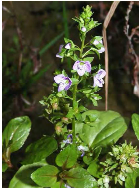
Abbildung 15: Die Bachbunge ( Veronica beccabunga ), eine typische Art von Quellfluren.