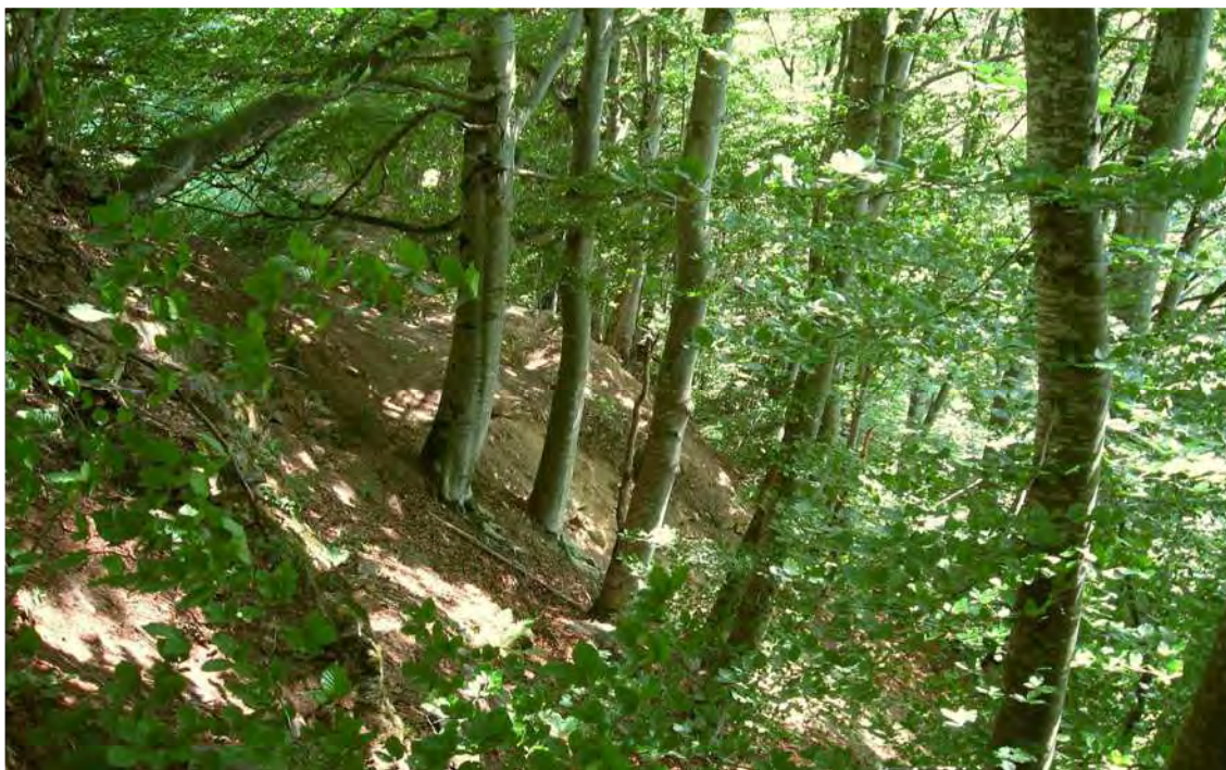
Abbildung 13: Die relativ steilen Sauerbodenbuchenwälder im Mühlitobel.

Das Biotop umfasst die Hänge zwischen Tobel-Pracomet (oberhalb Bauhof) bis zur Gemeindegrenze unterhalb Grappa und Galierm, wo es sich auf Bartholomäberger Gebiet fortsetzt (Biotop 10134). Im Talboden grenzt das Biotop an die Litz (Biotop 12211). Es handelt sich um einen vielfältigen Waldkomplex mit teilweise von Quellen durchsetzten Hangwäldern, die je nach Wasserzügigkeit des Hanges unterschiedlich zusammengesetzt sind. Die trockeneren Standorte werden von Sauerboden-Buchenwäldern mit einem gewissen Anteil an Winterlinde ( Tilia cordata ) eingenommen. Sie sind über weite Strecken stark mit Fichte durchmischt oder überhaupt durch Fichtenforste ersetzt. Auf den frischen bis nassen Böden stocken Ahorn-Eschenwälder mit einem hohen Anteil an Grauerle ( Alnus incana ). Die Wälder sind mit Ausnahme der Fichtenforste als weitgehend naturnah bis natürlich zu bezeichnen, auch wenn sie früher zumindest in Teilen landwirtschaftlich genutzt wurden (Heuen, Lauben). Als ein Hinweis auf diese Nutzung und die ehemals sicher lichtereren Verhältnisse ist die Häufigkeit der Hasel ( Corylus avellana ) in den Wäldern zu sehen.