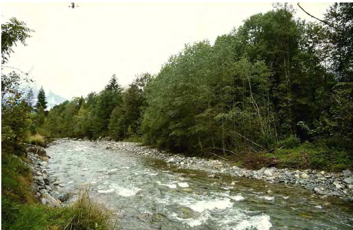
Abbildung 5: Die Gaprätzer Illauen auf Höhe der Zelfenbrücke.

Stark veränderte, in ökologischer Hinsicht aber durchaus bedeutende und schützenswerte Reste der ehemaligen Illauen mit (fragmentarischen) Auwaldbeständen und Kiesbänken. Überdies auch als Naherholungsgebiet von Bedeutung. Es handelt sich vorwiegend um Grauerlensäume, Einzelweiden und kleinen Ulmen-Eschenbeständen. Im Flussbett auf Schotterbänken und unmittelbar am Ufer findet man z.T. artenreiche und gut ausgebildete Kiesbettfluren. Die Grauerlenbestände sind meist nur kleinflächig und fragmentarisch ausgebildet, zeigen aber die typische Artengarnitur. Die Baumbestände der Au werden heute durch die Flussregulierung und die Speicherkraftwerke im Oberlauf nicht mehr überschwemmt, von ökologischer Bedeutung für die Auwälder ist aber das immer noch stark schwankende Grundwasser.