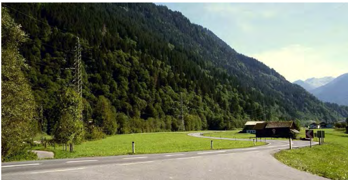
Abbildung 25: Blick auf die Ahorn-Eschenwälder in den Hängen oberhalb von Lafernegg.

Das Biotop umfasst die rechtsseitigen Auenbereiche der Ill zwischen Stiefen-Ganutsch im Norden und der Ill-Brücke bei Lafernegg im Süden sowie die darüberliegenden Hangbereiche vom Auslauf des Garnatschatobels über Forna, Gafritsch bis Pigam. Es handelt sich um einen Waldbiotopkomplex aus Auwaldresten und Hangwäldern, wobei Quellen, Quellfluren und die daraus entspringenden Bächlein wesentliche Teile darstellen. Der Auwald stockt auf den Sand- und Schotterbänken der Ill und entspricht einem Grauerlenwald. Wichtigstes und gleichermaßen (potentiell) gefährdetes Element des Biotops sind die Quellaustritte mit entsprechenden Quellfluren und den daraus entspringenden Bächlein im Auen- und unmittelbaren Hangfußbereich. In letzterem finden sich in Muldensituationen auch kleine, temporär wasserführende Vernässungen und Autümpel. Die Hangwälder werden von Ahorn-Eschenwäldern dominiert.