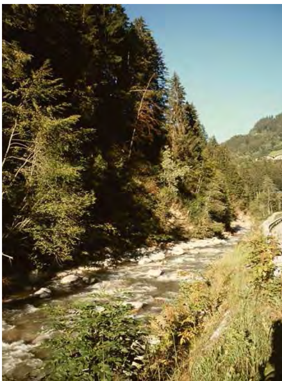
Abbildung 16: Eine der letzten naturnahen Uferpartien der Litz (kurz nach dem Bauhof Schruns).

Das Biotop umfasst die Litz innerhalb der Tobelmühle, vom Bauhof Schruns bis zur Gemeindegrenze von Bartholomäberg (unterhalb Galiern). Die Litz ist der letzte Hochgebirgsbach dieser Größe im Montafon, der über weite Strecken noch ein weitgehend unverändertes und natürliches Abflussregime zeigt. Als Folge der Hochwasserereignisse der letzten Jahre wurden die Uferpartien allerdings massiv verbaut. Die Ufer wurden mit teils sehr mächtigen und hohen Blockmauern gesichert, im Bachbett selbst wurden neue Querbauwerke eingezogen. Durch diese Maßnahmen wurden die naturnahen bis natürlichen Uferpartien bis auf wenige kleine Abschnitte stark beeinträchtigt, bzw. zerstört. Trotz dieser massiven Beeinträchtigungen ist die Litz aufgrund ihrer Hydrologie und Gewässergüte nach wie vor schützenswert.