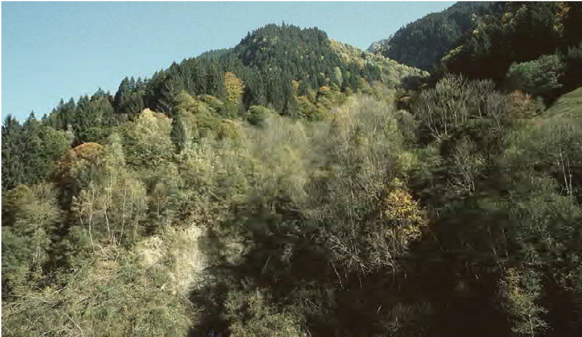
Abbildung 4: Blick auf den untersten Teil des Frattetobels. Entlang der Lawinenbahn steigen reine Laubwälder sehr weit in die Nadelwaldzone hinauf.