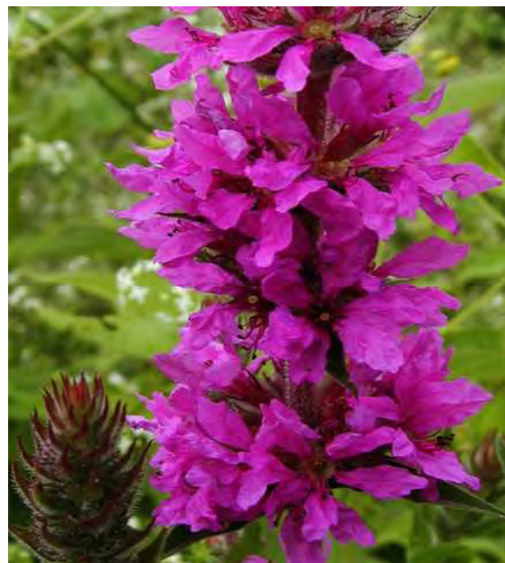
Abbildung 9: Der Blutweiderich ( Lythrum salicaria ), eine der typischen bachbegleitenden Hochstauden.