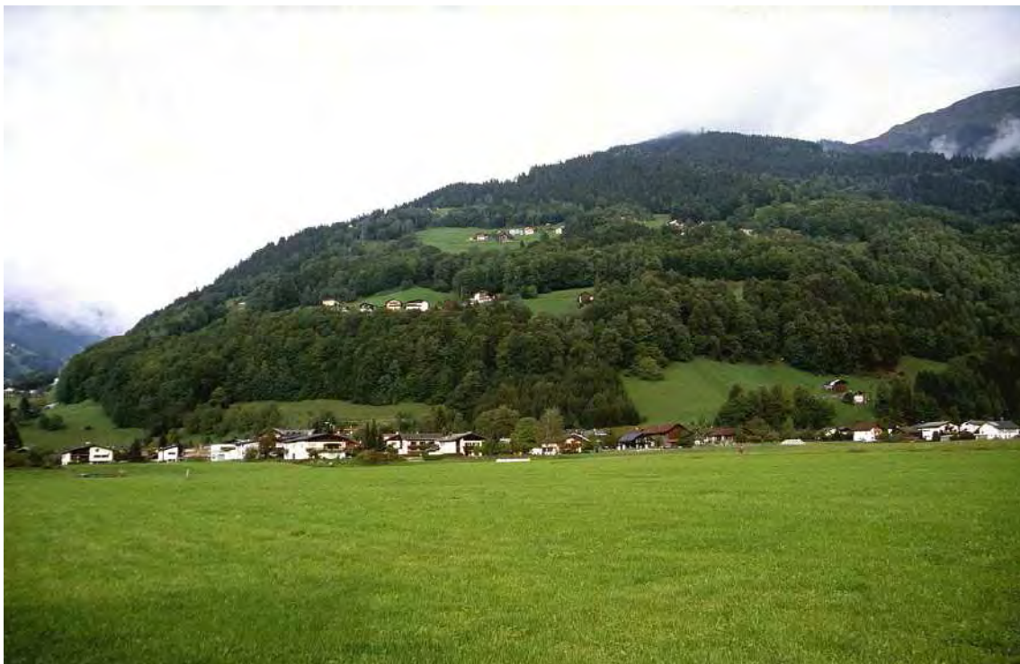
Abbildung 26: Die Sauerboden-Buchenwälder des Buchwalds sind für das Landschaftsbild von Schruns bestimmend. Im Osten davon schließen die Winterlindenwälder von Gamplaschg quasi nahtlos an sie an (rechte Bildseite).

Das Biotop umfasst die Buchenwälder in den untersten Hanglagen von Gamplaschg. Im Südwesten grenzen die beiden Teilflächen direkt an die Gamplaschger Winterlindenwälder an, mit welchen sie landschaftlich eine Einheit bilden. Es handelt sich um die größten und abgesehen von der Altersstruktur forstlich unverändertsten Bestände der Sauerboden-Buchenwälder im Gemeindegebiet von Schruns. Im Gegensatz zu einem großen Teil der übrigen Buchenwaldinseln der Gamplaschger Sonnenhänge wurde dieser Wald nicht als Mittelwald genutzt, sondern entspricht einem relativ homogen strukturierten, mehr oder weniger gleichaltrigem Hochwald. Trotz ihrer Artenarmut - dies bezieht sich allerdings nur auf die Pflanzenwelt – stellen die Buchenwälder durch ihre Lage im Alpen-Innengebiet und ihrem Baumbestand, einen der eindrucksvollsten und wertvollsten Biotoptypen des Tales dar.