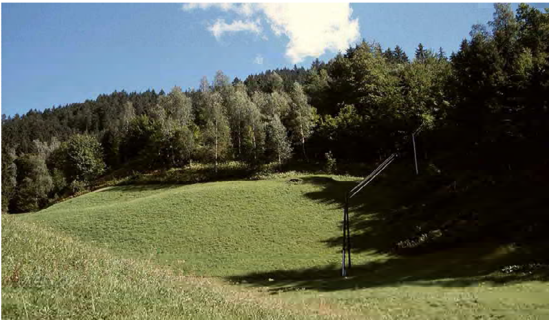
Abbildung 12: Blick auf den unteren Laubstreuhaune auf Brif.

Die Laubstreuhaune stellen ein Ensemble von hoher landschaftlicher Qualität und ein Zeugnis von landeskultureller Bedeutung dar. Diese offenen Baumgruppen verdanken ihre Entstehung den sehr spezifischen Nutzungsformen der traditionellen Landwirtschaft, welche sich durch einen sehr hohen Anpassungsgrad an die naturräumlichen Verhältnisse auszeichnete. Über bisweilen sehr ausgeklügelte Mehrfachnutzungen konnte auch an relativ unproduktiven Standorten der Flächenertrag optimiert werden. Im Fall der Haune war es eine Kombination von Laubstreuengewinnung, Holznutzung (Werk- und Brennholz), Weide und Mahd. Es mag also kaum verwundern, dass Laubstreuhaune im Tal weit verbreitet waren. Aufgrund der feuchten, sauren Bodenverhältnisse und der absonnigen Lage am Oberrand des Laubwaldareals, besitzen die Laubstreuhaune auf Brif einen sehr eigenständigen Charakter. Im Baumbestand vorherrschend sind Birke ( Betula pendula ) und Buche ( Fagus sylvatica ), letztere in teilweise sehr eigentümlichen, gedrungenen Weideformen. Erwähnt werden soll auch das Auftreten von Mehlbeere ( Sorbus aria ) und Stieleiche ( Quercus robur ), was bezüglich der Höhenlage und des kühlfeuchten Lokalklimas bemerkenswert ist. Der Unterwuchs der Haune zeichnet sich durch den hohen Anteil an ausgesprochenen Säurezeigern wie Rippenfarn ( Blechnum spicant ), Preiselbeere ( Vaccinium vitis-idaea ) oder Besenheide ( Calluna vulgaris ) aus.