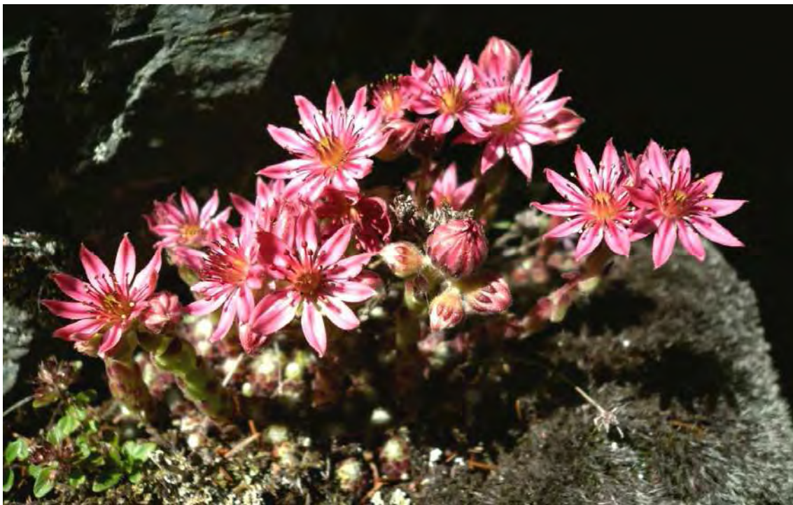
Abbildung 7: Die Spinnweb-Hauswurz ( Sempervivum arachnoideum ), eine typische Art silikatischer Felsfluren.

Das Biotop umfasst die südexponierte Felswand (Känzeli, Landschrofen) welche vom Kloster Gauenstein nach Westen zieht sowie die direkt angrenzenden Laubwaldbestände. Zentrales Schutzgut sind die Felsfluren der südexponierten Felswand. Vorwiegend in Spaltenräumen und auf schmalen Simschen gedeihen Fluren des Schwarzstieligen Streifenfarns ( Asplenium adiantum-nigrum ). Auf breiteren Simschen und der Oberkante der Felswand finden sich Fluren der Spinnweben-Hauswurz ( Sempervivum arachnoideum ). An treppig gestuften oder weniger steilen Felsbereichen gedeihen von Grasfluren durchsetzte, wärmegetönte Krüppelwälder und Gebüsche mit viel Stieleiche ( Quercus robur ). Diese findet sich auch in den Felskantenbestockungen die an den exponiertesten Bereichen stark von Birke ( Betula pendula ) geprägt werden. Ansonsten sind die Oberhanglagen von lindenreichen Sauerbodenbuchenwäldern, die steinschlagbeeinflussten Unterhänge dagegen von recht basenreichen Braunerde-Buchenwäldern, mit einem hohen Anteil an Edellaubhölzern wie den beiden Lindenarten ( Tilia cordata , T. platyphyllos ), Ulme ( Ulmus glabra ), Esche ( Fraxinus excelsior ) und allen heimischen Ahornarten. Vor allem das vereinzelte Auftreten von Feldahorn ( Acer campestre ) ist bemerkenswert.