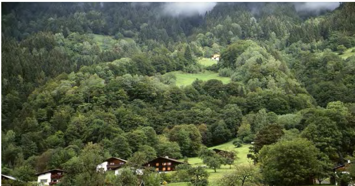
Abbildung 20: Im Bereich der Felsflucht von Zagrabs stockt ein höchst interessanter Laubwaldkomplex mit Eichenbeständen an den Felskanten, Linden-Ahorn-Eschenwäldern auf Schuttstandorten und natürlich auch den typischen Sauerboden-Buchenwäldern.

Im Bereich der Felsflucht von Zagrabs stockt ein höchst interessanter Laubwaldkomplex, der nicht nur aufgrund des gehäuften Auftretens verschiedenster Laubbaumarten bemerkenswert ist. Die Wälder sind bezüglich der Artenzusammensetzung als weitgehend natürlich zu betrachten. Ihre Alterstruktur ist durch die frühere Nutzung zwar verändert, allerdings konnten die Bestände aufgrund der Standortverhältnisse sicher nie intensiv bewirtschaftet werden. Die auf blockreichen Schutthalden und silikatischem Moränenmaterial stockenden Unterhangwälder entsprechen einem Waldtyp, der zwischen den trockenen Sauerboden-Lindenwäldern, feuchten Lindenschluchtwäldern und Buchenwäldern (vgl. Biotop 12217) vermittelt. Neben der dominanten Buche ( Fagus sylvatica ) wird der Bestand von einer Vielzahl der im Montafon vorhandenen Laubbaumarten aufgebaut. Bemerkenswert ist neben der Sommerlinde ( Tilia platyphyllos ) vor allem das Auftreten des Spitzahorns ( Acer platanoides ). Der Unterwuchs entspricht einem bunten Gemisch von Arten der Braunerde- und Sauerboden-Buchenwälder, wobei das Fehlen ausgesprochener Säurezeiger auf recht basenreiche Bodenverhältnisse hindeutet. Der Wald ist als Braunerde-Buchenwald anzusprechen und zwar in einer linden- bzw. edellaubreichen Variante, die so nur im Montafon auftritt.