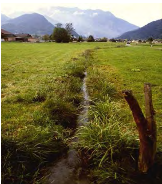
Abbildung 8: Der von Feuchtwiesenarten und Hochstauden gesäumte Mühlbach im Schrunser Feld (Stofleten Au).