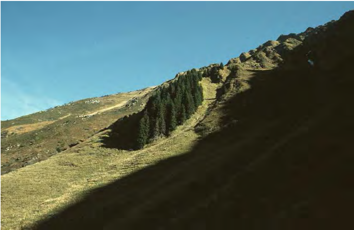
Abbildung 24: Schwarzmers Wäli stockt auf einer Felsrippe inmitten der mächtigen Lawinenbahn der Wangleui, weit oberhalb der aktuellen, durch die menschliche Tätigkeit nach unten verschobenen Waldgrenze.

Der kleine Fichtenwaldbestand stockt auf einer langgezogenen Hangrippe inmitten der weiten Rasenhänge unterhalb des Kreuzjochs, dem Einzugsgebiet der eindrucksvollen Stiefentobel-Lawine. Auf der lawinengeschützten, südwestexponierten Hangrippe, die offenbar auch lokalklimatisch günstige Verhältnisse bietet, hat sich mit Schwarzmers Wäli ein subalpiner Silikat-Fichtenwald weit oberhalb der aktuellen Waldgrenze erhalten. In der exponierten, sehr steilen Lage gedeihen mächtige, tiefastige Fichten. In den Flanken und Rinnen zu beiden Seiten geht der Wald stellenweise in Grünerlengebüsche ( Alnetum viridis ) über. Als isoliertem Zeugen einer, ohne den historischen Einfluss des Menschen weit höher gelegenen potentiellen Waldgrenze, kommt dem Bestand der Status eines Naturdenkmals zu.