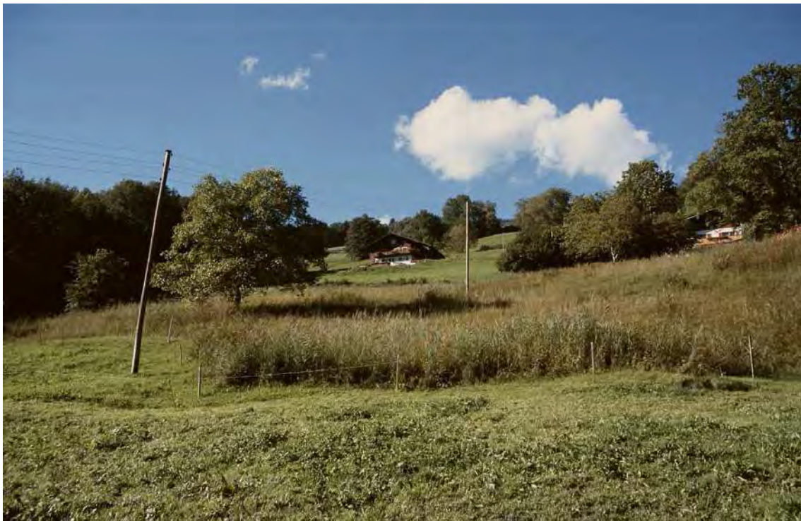
Abbildung 11: Das Quellflachmoor auf Valar/Montiola.

Das Flachmoor findet sich auf dem Hang oberhalb der Straße von der Montiola nach Valar (auf Höhe der Kapelle). Der Quellmoorkomplex unterhalb Valar ist ein schönes Beispiel für diesen am gesamten Bartholomäberger Sonnenhang typischen, aber überall nur mehr kleinflächig vorhandenen Moortyps. Es ist das am tiefsten gelegene und das einzige Vorkommen auf Schrunser Gemeindegebiet. Im unteren Teil des Rieds nahe der Kapelle finden sich die Reste eines einstmals weit ausgedehnteren Davallseggenmoors. Umgeben ist das Kleinseggenmoor von Pfeifengraswiesen und Hochstauden.