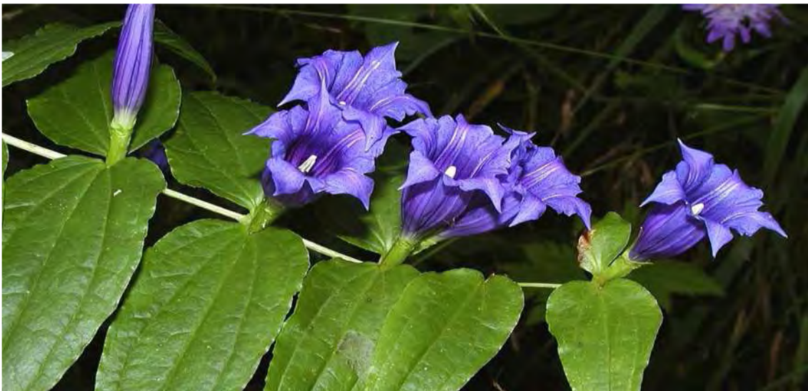
Abbildung 19: Der gefährdete Schwalbenwurzengentian ( Gentiana asclepiadea ), der deutlich die hohe Lage des Laubwaldes anzeigt.

Das Biotop liegt in den Hängen zwischen Malär und Fau (Gamplaschg), nördlich der Straße auf den Kropfen. Ein großer Teil des Biotops wird von einem inzwischen weitgehend verwaldeten Weidewald bzw. Laubstreuhaun eingenommen. Neben der Laubstreugewinnung wurde der ehemals weitaus lichtere und mit Magerrasen durchsetzte Bestand wohl mit Kleinvieh beweidet. Der Hain zeichnet sich durch eine für diese Höhenlage (ca. 1080m) außergewöhnlich reiche Laubbaumflora aus und setzt sich unter anderem aus Birke ( Betula pendula ), Mehlbeere ( Sorbus aria ), Stieleiche ( Quercus robur ), Buche ( Fagus sylvatica ), Grauerle ( Alnus incana ), Bergahorn ( Acer pseudoplatanus ) und Esche ( Fraxinus excelsior ) zusammen. Es handelt sich teils um sehr eindrucksvolle Bäume. Im Norden geht der Hain in einen Hochwald über. Er kann im unteren Teil noch als typischer Sauerbodenbuchenwald angesprochen werden, gedeiht hier allerdings an seiner absoluten Obergrenze und geht nach oben hin in einen entsprechenden Buchen-Tannen-Fichtenwald ohne Fichte über. Langfristig wird sich auch der Laubstreuhaun in diese Richtung entwickeln.