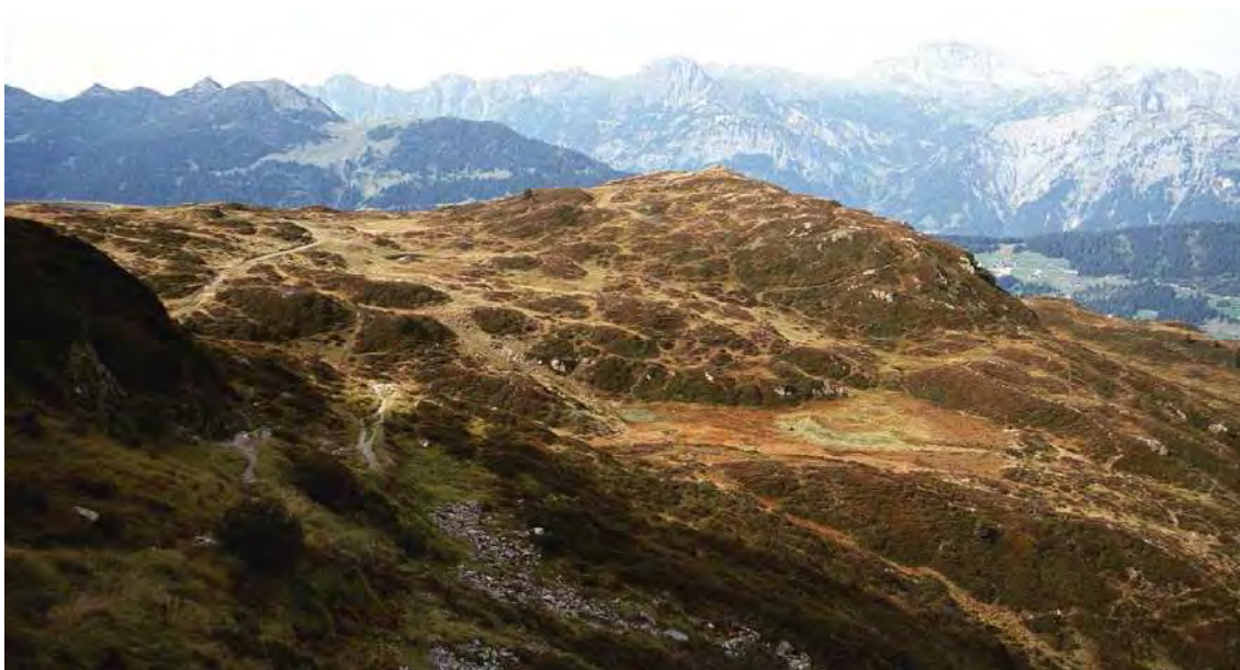
Abbildung 23: Blick auf den von Kolken, Blänken und Moortümpeln durchsetzten Moorkomplex am Surblies.

Der Hauptteil des Biotopkomplexes liegt in der Sattellage zwischen den Sennilöchern selbst und dem Surblies. Auf Silbertaler Gebiet setzen sich die Vermoorungen in Geländerinnen und -mulden fort (vgl. Silbertal, Biotop 12326). An erster Stelle müssen die vielgestaltigen Stillgewässer im Gebiet erwähnt werden. Es finden sich größere, relativ seichte Alptümpel, die bisweilen über einen Ufersaum aus Schnabelsegge ( Carex rostrata ) verfügen. In einigen Fällen sind sie bereits soweit verlandet, dass sie eher als flächige, temporär überflutete Schnabelseggensümpfe anzusprechen sind. Das nähere und weitere Umfeld der Alptümpel, aber auch versumpfte Mulden und Rinnen werden von Flachmooren eingenommen. Es handelt sich im Wesentlichen um Braunseggenmoore, die teilweise von der Rasen-Moorbinse ( Trichophorum cespitosum ) geprägt sind. Eng verzahnt sind die Flachmoore mit feuchten, torfmoosreichen und teils zwergstrauchdominierten Bürstlingsrasen, aber auch mit reinen Zwergstrauchbeständen, welche vor allem die Buckel und Kuppen im stark reliefierten Gelände einnehmen.