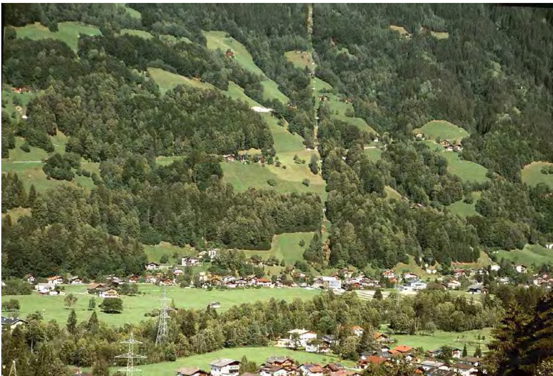
Abbildung 2: Die trockenen Winterlindenwälder auf Gamplaschg. Dieser Waldtyp ist ein Unikat der Sonnenhänge des mittleren Montafons.

Die Lindenwälder stocken auf den südwestexponierten Sonnenhängen von Gamplaschg, ausgehend von den Hangfußbereichen oberhalb Gaprätz bei ungefähr 700 Metern, bis auf maximal 1000 Meter Seehöhe bei Tolla. Die nördlichsten Bestände sind im Gebiet von Hof und Gafiala gelegen, die südlichsten bei Zabarres und Bühl (vgl. auch Biotop 12217). Die Winterlindenwälder der Gamplaschger Sonnenhänge sind sicher die herausragenden Biotope der Gemeinde und zählen zu den bemerkenswertesten des Montafons und Vorarlbergs überhaupt. Es handelt sich um einen einmaligen und demnach sehr seltenen Waldtyp zu dem österreichweit keine Parallelen existieren. Da die Wälder ähnlich der Bartholomäberger “Gandana“ auch hier eine wichtige Schutzfunktion (Steinschlag) für die Unterlieger besitzen, wurden die Wälder immer nur sehr extensiv bewirtschaftet und zwar durch Einzelstammhieb und Lauben. Die Lindenwälder gedeihen auf meist sehr steilen Geländekanten und Hangteilen über Blockwerk und Schutt. Die Obergrenze der Lindenwälder liegt etwas über 900 Metern Seehöhe. Je höher die Bestände liegen, umso stärker tritt gegenüber der dominierenden Winterlinde ( Tilia cordata ) die Buche ( Fagus sylvatica ) hervor. Daneben sind auch Stieleiche ( Quercus robur ) und Pionierbaumarten, allen voran die Birke ( Betula pendula ), beigemischt.