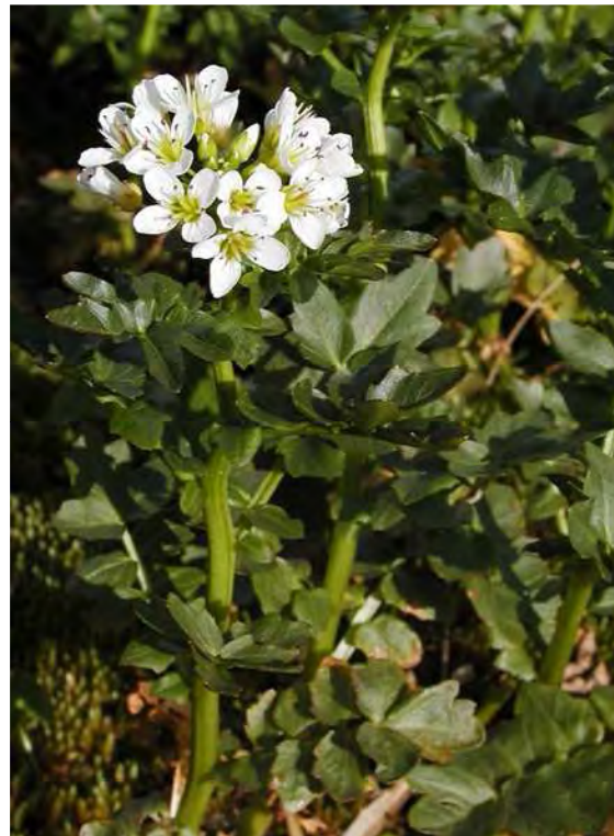
Abbildung 6: Sumpfdotterblume ( Caltha palustris ) und Bitteres Schaumkraut ( Cardamine amara ), zwei typische Art der Bachufer.