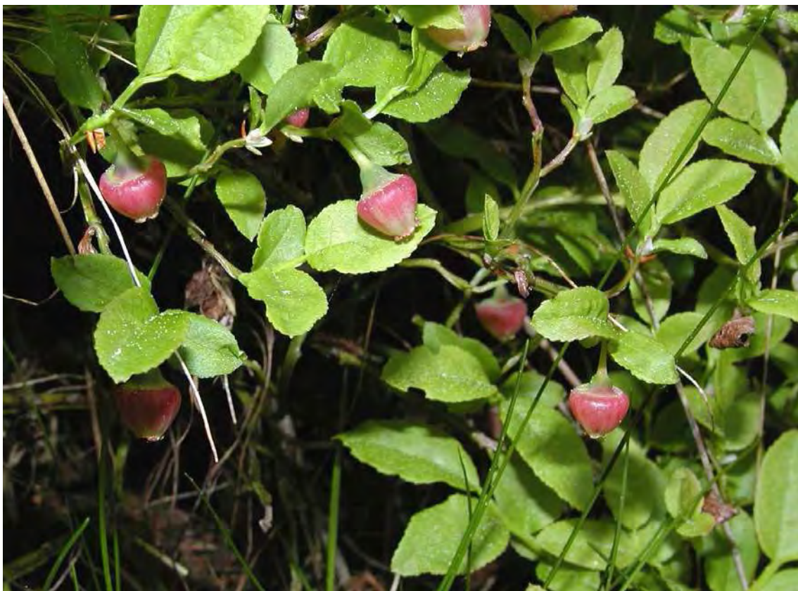
Abbildung 18: Die Heidelbeere ( Vaccinium myrtillus ) – hier blühend – eine der wenigen Arten die im Unterwuchs bodensaure Buchenwälder gedeihen.

Die Buchenwälder stocken in den Steilhängen unterhalb der Gamplaschger Straße im Gebiet von Malär. Die Sauerboden-Buchenwälder am Oberrand des Lindenwaldareals sind aufgrund der teilweise sehr alten und mächtigen Bäume landschaftlich äußerst wirksam. Vom Artenbestand her sind die Wälder als natürlich anzusehen, in ihrer Altersstruktur sind sie aber durch die spezifische historische Nutzung (Holz und Lauben) verändert. Der Bestand im Nordwesten ist ein reiner Buchenwald, dem südöstlichen Bestand sind andere Laubbaumarten, wie etwa Stieleiche ( Quercus robur ) und Birke ( Betula pendula ), beigemischt. Die beiden Lichtbaumarten sind ebenso wie das starke Auftreten der Hasel ( Corylus avellana ) in der Strauchschicht als Zeugnis für die ehemals lichtereren Verhältnisse im Unterwuchs zu sehen.