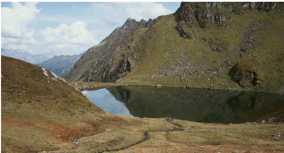
Abbildung 1: Blick auf den Schwarzsee; im Vordergrund Flachmoore.

Das Biotop umfasst Herz-, Enten- und Schwarzsee, die verbindenden Bachabschnitte (Quellgebiet des Teufelsbachs) und die umliegenden Flach- und Quellmoorbereiche im Kar unterhalb des Hochjochs. Die Seenkette im Kar unterhalb des Hochjochs stellt das oberste Quellgebiet des in die Litz entwässernden Teufelsbachs dar. Die Seen sind durch, in den Verebnungen oder nur schwach geneigten Hanglagen von Flachmooren gesäumten Oberlauf, miteinander verbunden. Herz- und Schwarzsee zeichnen sich, wie es für tiefere, nährstoffarme Hochgebirgsseen typisch ist, durch das weitgehende Fehlen einer Ufervegetation aus. Der kleinere und flachere Entensee verfügt dagegen über eine Umrahmung aus Flachmooren. Ein weiterer ausgedehnter Flach- und Quellmoorkomplex findet sich in der vom Kälbersee herführenden Hangmulde oberhalb des Schwarzsees. Bei den Flachmooren handelt es sich um Braunseggenmoore und Moorbinsenbestände, wobei gerade unter letzteren teils mächtige Torfhorizonte ausgebildet sind. Die Umrahmung der Feuchtgebiete bilden borstgrasreiche Krummseggenrasen, Schneeböden, Schutthalden und Zwergstrauchbestände auf Buckeln und Kanten.