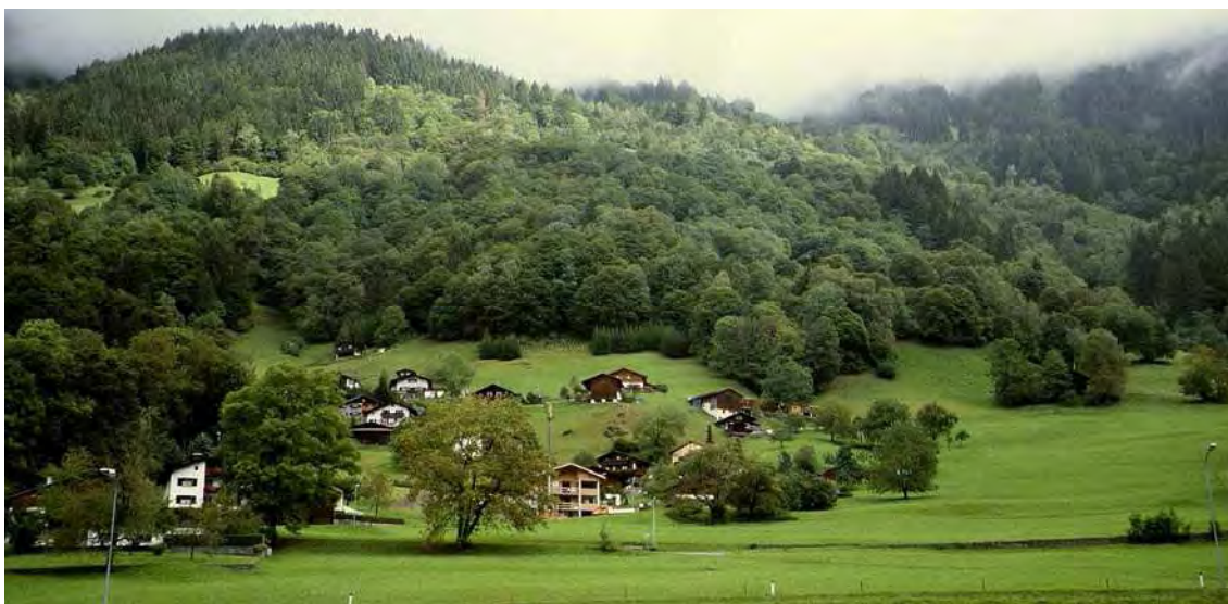
Abbildung 21: Die Hänge oberhalb von Stiefen-Bagera werden von einem vielfältigen Waldkomplex mit Ahorn-Eschenwäldern, Buchenwäldern und Haselverbuschungen eingenommen.

Das Biotop umfasst die weitgehend verwaldeten, nur mehr randlich durch Wiesen und Weiden gegliederten Hanglagen oberhalb von Stiefen- Bagera. Der gesamte Hang wird von einem großflächigen und sehr vielfältigen Laubwaldkomplex eingenommen. Dominiert wird er von Ahorn-Eschenwäldern unterschiedlichen Alters, daneben finden sich kleinflächigere Bestände von Sauerboden- und Braunerde-Buchenwäldern sowie Haselgebüsch. Erwähnenswert ist das regelmäßige Auftreten von Stieleiche ( Quercus robur ), Sommerlinde ( Tilia platyphyllos ) und Bergulme ( Ulmus glabra ). Letztere ist allerdings nur mehr in jüngeren Exemplaren vorhanden, die Altbäume wurden in den letzten Jahren vom Ulmensterben (durch den Ulmensplintkäfer übertragene Pilzerkrankung) dahingerafft. Die bestehenden reifen Wälder sind sehr naturnah. Die Jungwälder und Verbuschungsstadien besitzen ein hohes Natürlichkeitspotential und werden sich zu natürlichen Klimaxwäldern (Buchen- und Ahorn-Eschenwald) entwickeln.