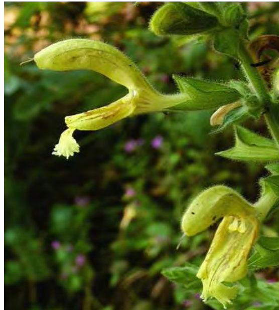
Abbildung 3: Die beiden in Schluchtwäldern häufigen Arten Waldgeißbart ( Aruncus dioicus ) und Klebriger Salbei ( Salvia glutinosa ).