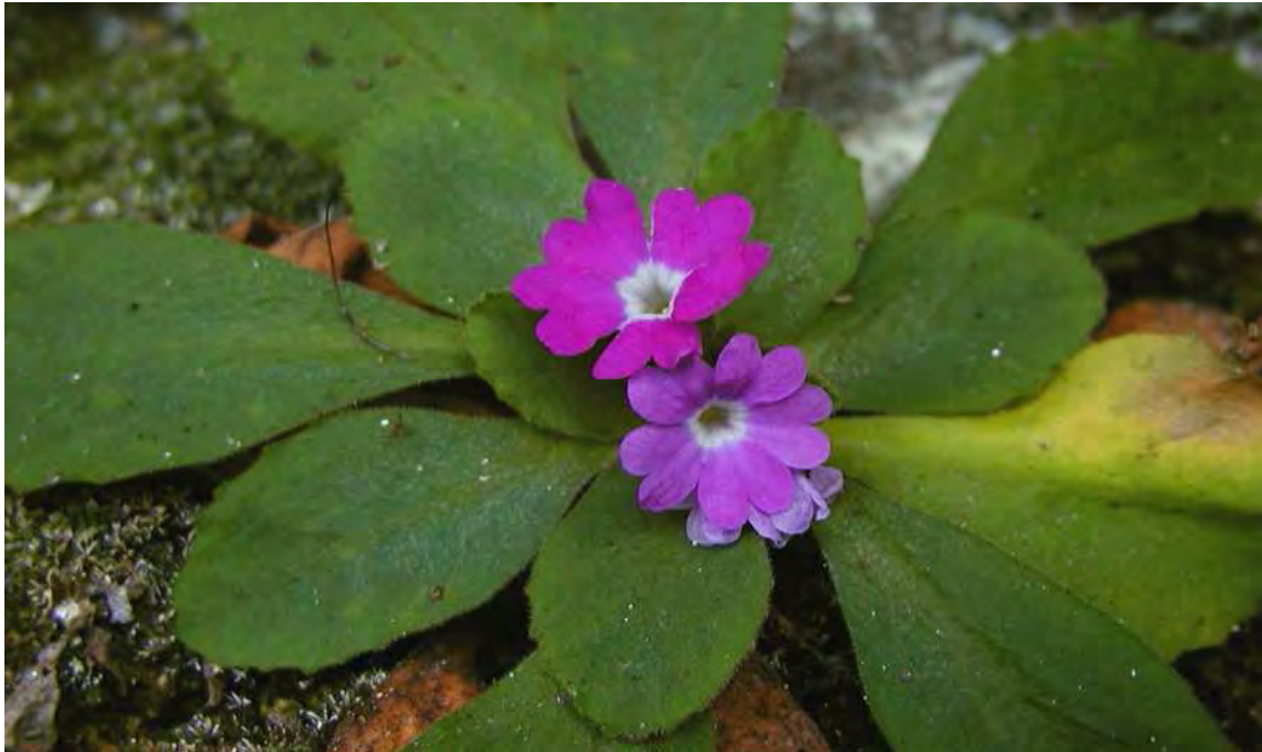
Abbildung 22: Die Pelzprimel, eine westalpine Art, die typisch ist für silikatische Felsen.

Das Biotop umfasst den mittleren Teil des Rappa- bzw. Teustobels oberhalb von Spiang und Liazaun. Zentrales Element des Schluchtbiotops ist die waldummantelte, südexponierte Amphibolit-Felswand am rechten Einhang des Rappa- bzw. Teustobels. Neben pionierhaften Birkenbestockungen auf den Felsabsätzen, finden sich in der Wand schön ausgebildete Felsflur- bzw. Spaltengesellschaften. Dieser Lebensraum der ursprünglichen Naturlandschaft ist im montanen Waldgebiet nicht sehr häufig und verdient deshalb besonderen Schutz. Die Felsfluren nehmen eine Mittelstellung zwischen den entsprechenden Gesellschaften der Tieflagen und der alpinen Gebiete ein. Die umliegenden Waldungen sind entsprechend des kleinteiligen Reliefs sehr vielfältig. Stabile Bereiche an den Oberkanten werden von hochmontanen Sauerboden-Buchen-Tannen-Fichtenwäldern eingenommen, Rutschhänge, Schutthalden und Tobelgrund von Grauerlenbeständen, Ulmen-Ahornwäldern und in den obersten Teilen von Hochstauden-Tannen-Fichtenwald. Gerade der Ulmen-Ahornwald sei an dieser Stelle hervorgehoben, dieser Waldtyp ist auf Schrunser Gemeindegebiet praktisch nur hier zu finden, sein Vorkommen ist mit dem Auftreten von Amphibolitschutt in Verbindung zu bringen. Die im Biotop integrierten Wälder sind abgesehen von einer sporadischen Holznutzung als ausgesprochen naturnah bis natürlich anzusehen.