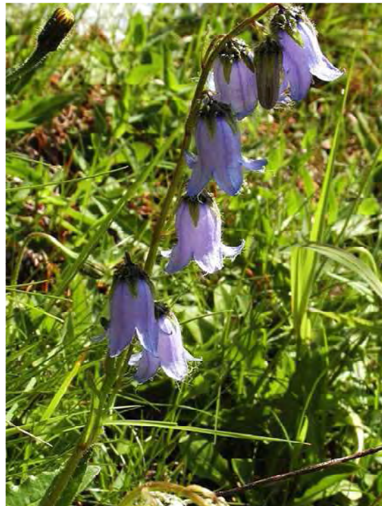
Abbildung 17: Links das Gefleckte Knabenkraut ( Dactylorhiza maculata ), eine der häufigeren Orchideen der heimischen Flora. Rechts die Bart-Glockenblume ( Campanula barbata ), eine Art der subalpinen Silikatrasen, die auch in den Magerrasen von Latang vorkommt.