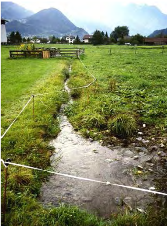
Abbildung 14: Der Stofletbach im Schrunser Feld.

Wiesenbäche sind als Reste der ehemaligen Quellgewässer, welche die ursprüngliche Aue durchflossen haben, zu deuten. Auch wenn Verlauf und Gestaltung des Gerinnes nicht mehr dem natürlichen Bild entsprechen, sind sie doch mit ihrer typischen Wasserführung Lebensraum für eine ganz spezifische Tierwelt. Die durch Quellfassungen als Lebensraum fast vollständig verschwundene Stofletquelle ist in einen kleinen Laubwaldbestand mit Esche, Grauerle, Linde, Birke, Hasel und Weide eingebettet. Auf seinem Lauf durch das Schrunser Feld sind die freien Ufersäume des Bachs von typischen Arten begleitet. An etwas aufgeweiteten, bzw. solchen Bereichen wo die intensive Landnutzung nicht direkt bis an den Gewässerrand reicht, sind bisweilen kleinere Bestände von hochstaudenreiche Uferfluren ausgebildet. In kleinen Schlammuchten finden sich vereinzelt fragmentarisch Flutrasen mit Wasserschwaden