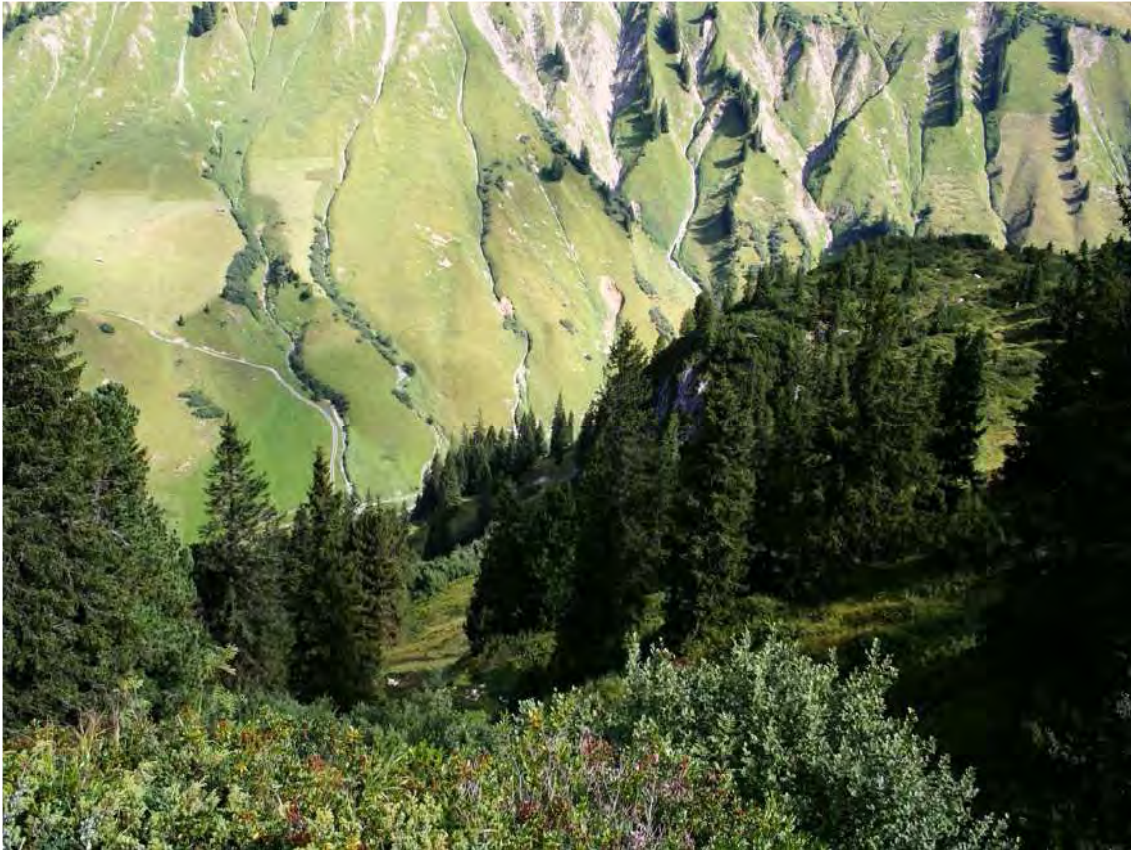
Abbildung 12: Zirbenwaldreste auf Schröckener Gemeindegebiet über den westexponierten Abhängen des Saloberkopfes; die Bestände liegen innerhalb artenreicher Zwergstrauchbestände (im Vordergrund) und Weiderasen.