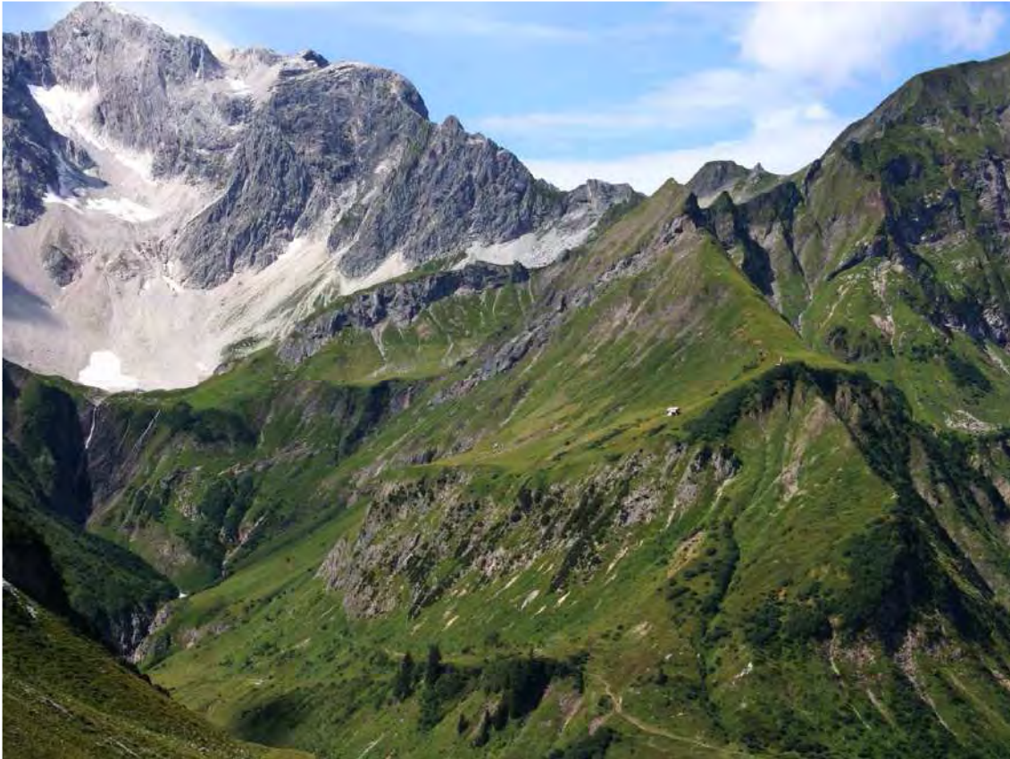
Abbildung 2: Mäher und Wildheuplanken im Bereich des hinteren Fellebachtals; der Biotop beginnt oberhalb des sichtbaren Weges und geht bis in die Kammlagen; Teile der Flächen unterhalb der neu errichteten Almhütte werden gerade gemäht; das Photo wurde von der Batzen aus aufgenommen.