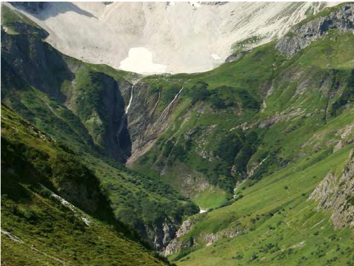
Abbildung 10: Wasserfall unterhalb der heute weitgehend schnee- und eisfreien Hochgletscheralpe.

Großer Wasserfall kurz unterhalb der Hochgletscheralpe. Er überwindet in fast freiem Fall eine ca. 100 m hohe Steilstufe. Er wird gespeist aus einem Hauptbach, mit Zufluss aus dem Firnfeld im Talkessel der Hochgletscheralpe und möglicherweise auch aus dem Gletscher unter der Braunarlspitze. Zwei kleinere Quellen entspringen etwas tiefer und ergießen sich über dieselbe Steilstufe. An den Quellen sind reichliche Moosgesellschaften ausgebildet (vor allem Cratoneurum falcati ), die sich teilweise auch noch entlang des Wasserfalles ins Tal ziehen. Das Firnfeld im Bereich der Hochgletscheralpe und unterhalb der Braunarlspitze ist temperaturbedingt massiv abgeschmolzen. Der Biotop selbst unterliegt derzeit noch keinen Veränderungen, diese sind aber zu erwarten, sobald das Wasserreservoir des Firnfeldes erschöpft ist. Die Pflanzen- und Tiergemeinschaften des Wasserfalles sind auf konstant fließendes Wasser angewiesen. Die randlichen Quellen decken dann nur einen Teil des Biotops ab.