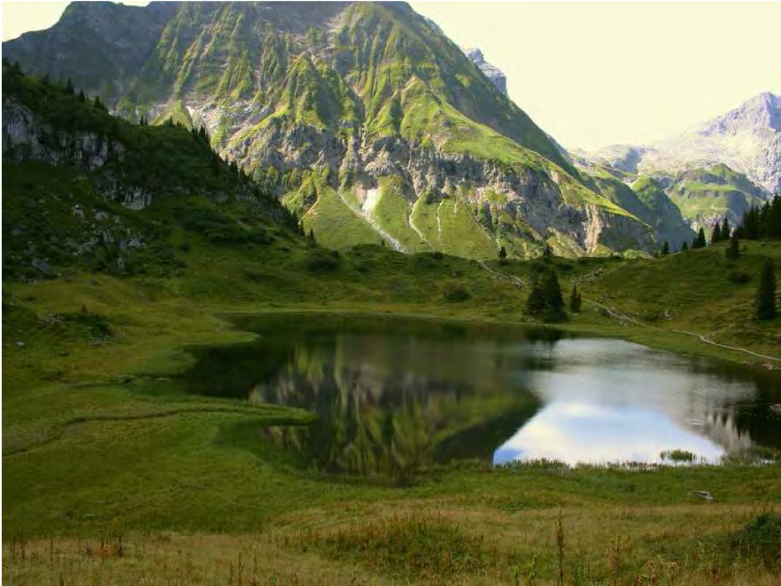
Abbildung 13: Körbersee von Westen aus gesehen; der See ist von unterschiedlichsten Niedermooren, meist Großseggenriedern gesäumt; diese sind vor allem im Mündungsbereich gut erkennbar.