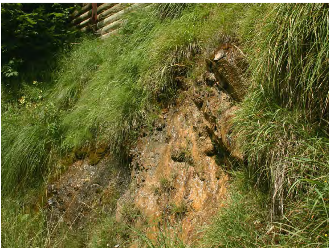
Abbildung 14: Tuffbildende Kalkquellflur in Oberboden; Quellen dieses Typus sind auch durch die FFH Richtlinie unter Schutz.

An der Straße Oberboden - Wald findet sich bergseitig eine tuffbildende Quelle mit Arten wie sie sonst nur in tiefen Lagen vorkommen. Es ist dies sicherlich die höchstgelegene Quelle im hinteren Bregenzerwald mit Arten des Eucladio-Cratoneuretum commutati, eines vor allem im Mediterrangebiet weit verbreiteten Quelltyps. Neben den namensgebenden Arten treten auch tuffbildende Algen auf. Mikrostalaktiten bereichern die Physiognomie dieser Quelle. Aufgrund der Lage am Straßenrand ist sie höchst gefährdet. Die Schüttung der Quelle ist gering, der Abfluss erfolgt unter der Straße. Die Quelle wurde neu ins Inventar aufgenommen.