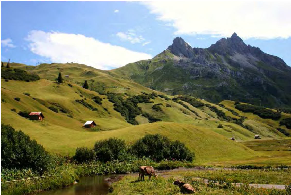
Abbildung 4: Überblick über die artenreichen Mähwiesen im Auenfeld in Hanglage; diese werden von unterschiedlichsten Pflanzengesellschaften gebildet von trockenen Magerwiesen bis hin zu feuchten Niedermooren.

Im Nordwesten des Biotopkomplexes sind auch einzelne Moorflächen ausgebildet. Dabei handelt es sich in erster Linie um Quell- und Durchströmungsmoore vom Davallseggenmoortyp ( Caricetum davallianae ). An einem Bestand ist das Vorkommen von Schilf auffällig. Schilf in dieser Höhenlage ist nur mehr vegetativ fortpflanzungsfähig und kann sich daher nur in den klimatisch günstigeren Zeiten des Mittelalters angesiedelt haben - ein weiterer Beweis für Alter und Schutzwürdigkeit des Biotopkomplexes. Im Oberbereich dieser Moore findet man kalkige Quellen ( Cratoneuretum filicino-commutati ).