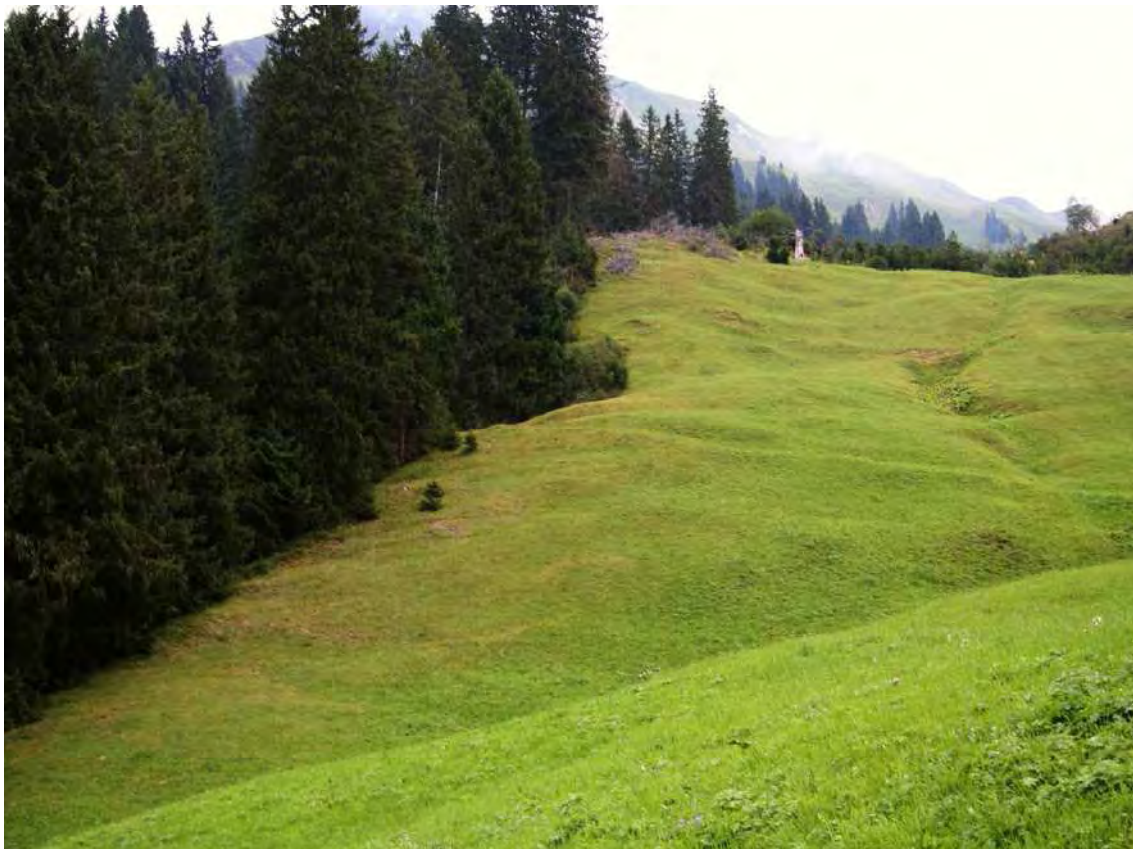
Abbildung 9: Frisch gemähte Magerwiesen mit wärmeliebender Vegetation (Mesobrometum) in Oberboden am Weg zum Tannberg.

Die Wiesentypen tendieren zu den mageren Bergheuwiesen, wenn sie auch von zahlreichen Arten der trockenen Trespenwiesen durchsetzt sind. Auch Arten aus den tiefer liegenden Glatthaferwiesen sind zu finden. Auffallend sind der Blumenreichtum und der vergleichsweise geringe Anteil der Gräser am Bestand. Stellenweise sind Erosionserscheinungen zu bemerken, teilweise beginnen die Flächen zu verbuschen. Es wurden im Vergleich zur Erstaufnahme zwei oberhalb liegende Mähwiesen in die Biotopfläche integriert.