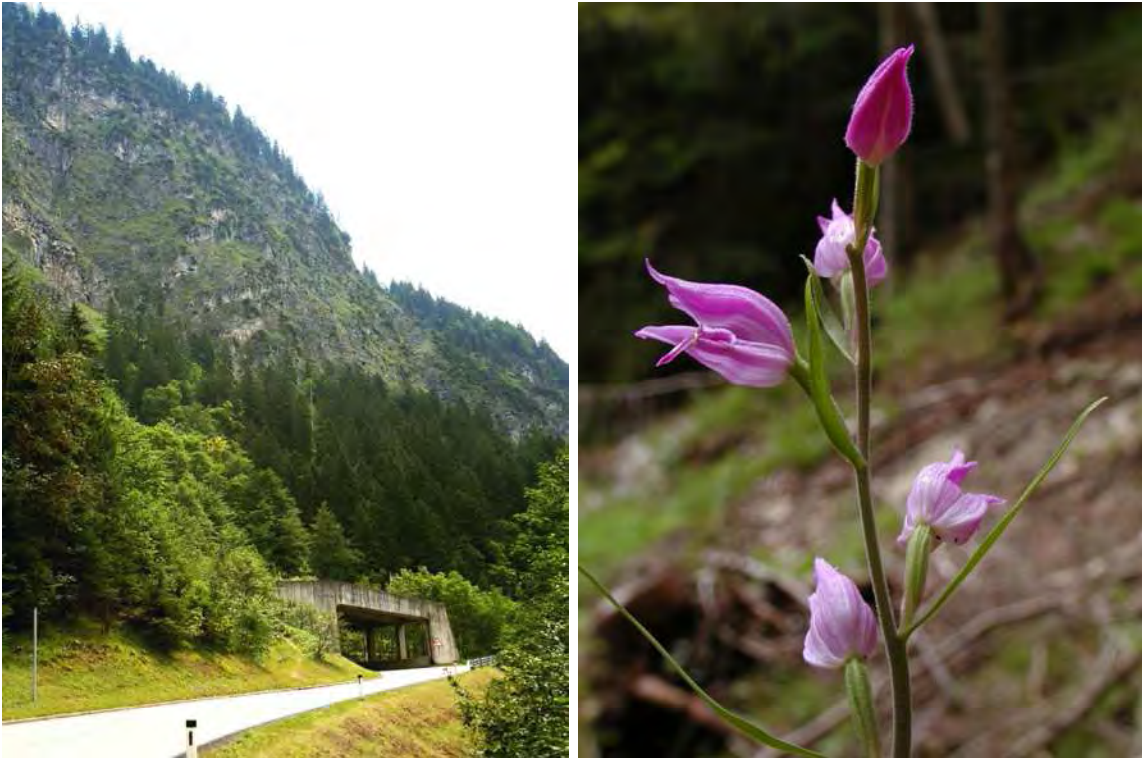
Abbildung 5: Die Steilhänge und Rasengirlanden östlich der Bregenzer Ach an der Gemeindegrenze zu Schoppernau. Rechts das seltene Rote Waldvöglein ( Cephalanthera rubra ) in den lichten Steilhang-Wäldern.