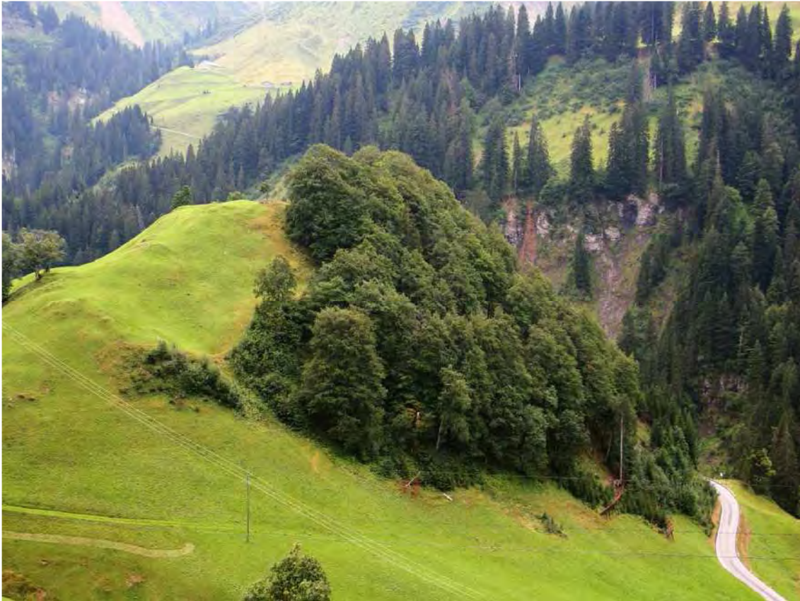
Abbildung 8: Buchenwald auf Moränenkuppe zwischen Unter- und Oberboden; Buchenwälder in dieser Höhenlage sind als Besonderheit anzusehen; am Unterrand ist die Lawinverbauung mit Fichtenaufforstung zu sehen.