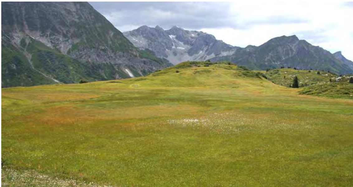
Abbildung 3: Vom Braun der Rasenbinse dominiertes Moor auf der Saloberalpe; die mannigfaltigen Farben zeugen von der Vielfalt der verschiedenen Moorpflanzengesellschaften in diesem Moor.

Den größten Teil der Fläche bedecken Rasenbinsenmoore, die zumeist sehr artenarm sind. Randlich sind häufig Quellbereiche ausgebildet, die von moosreichen Braunseggenmooren ( Caricetum nigrae ) bedeckt sind. Auch kleinere Tümpelbereiche mit hohem Fieberkleeanteil werden von letzterer Gesellschaft gesäumt. An wasserbedeckten Stellen finden sich Schnabelseggenrieder ( Caricetum rostratae ). Das Davallseggenmoor ( Caricetum davalliana ) bedeckt kleinere Flächen. Auf ehemaligen, vermutlich durch den mäandrierenden Bach aufgestauten Tümpelflächen innerhalb des Moorbereichs gibt es Schlammseggenschwingrasen ( Caricetum limosae ). An den Bachgerinnen findet man Hochstauden wie Eisenhutblättriger Hahnenfuß ( Ranunculus aconitifolius ) und kleine Weidenbüsche ( Salix myrsinifolia ). Ein Bestand von Scheuchzers Wollgras ( Eriophoretum scheuchzeri ) vervollständigt die Biotopausstattung.