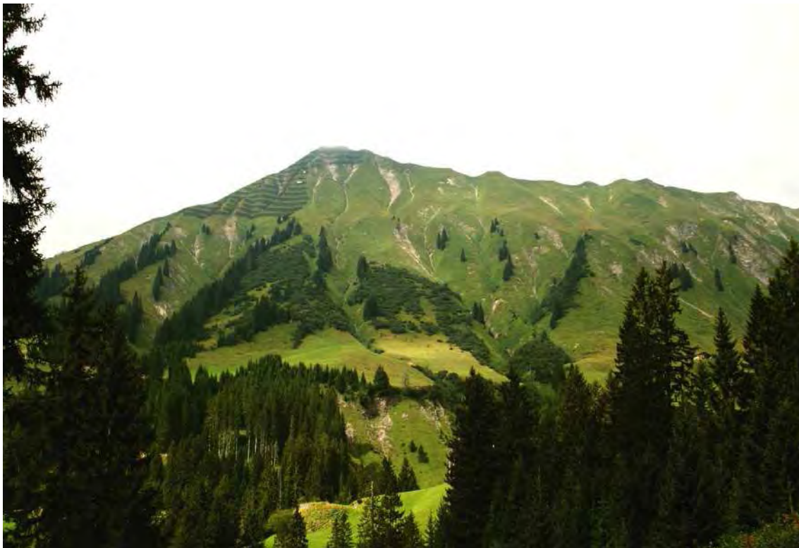
Abbildung 7: Kamnahe artenreiche alpine Rasen und Wildheuplanken zwischen Höferspitz (mit Lawinerverbauung) und Bellischegg; die Waldbestände sind nicht mehr Teil des Biotops.

Aufgrund der Aufrechterhaltung der Mahd in einem Großteil der Mähwiesen gibt es gegenüber der Ersterhebung kaum Veränderungen in den weiträumigen Mähwiesen, die den wichtigsten Bestandteil des Biotops ausmachen. Als schwerwiegender landschaftsästhetischer Eingriff in den Großraumbiotop muss die Errichtung von Lawinenschutzbauten in der Gipfelregion der Höferspitze genannt werden.