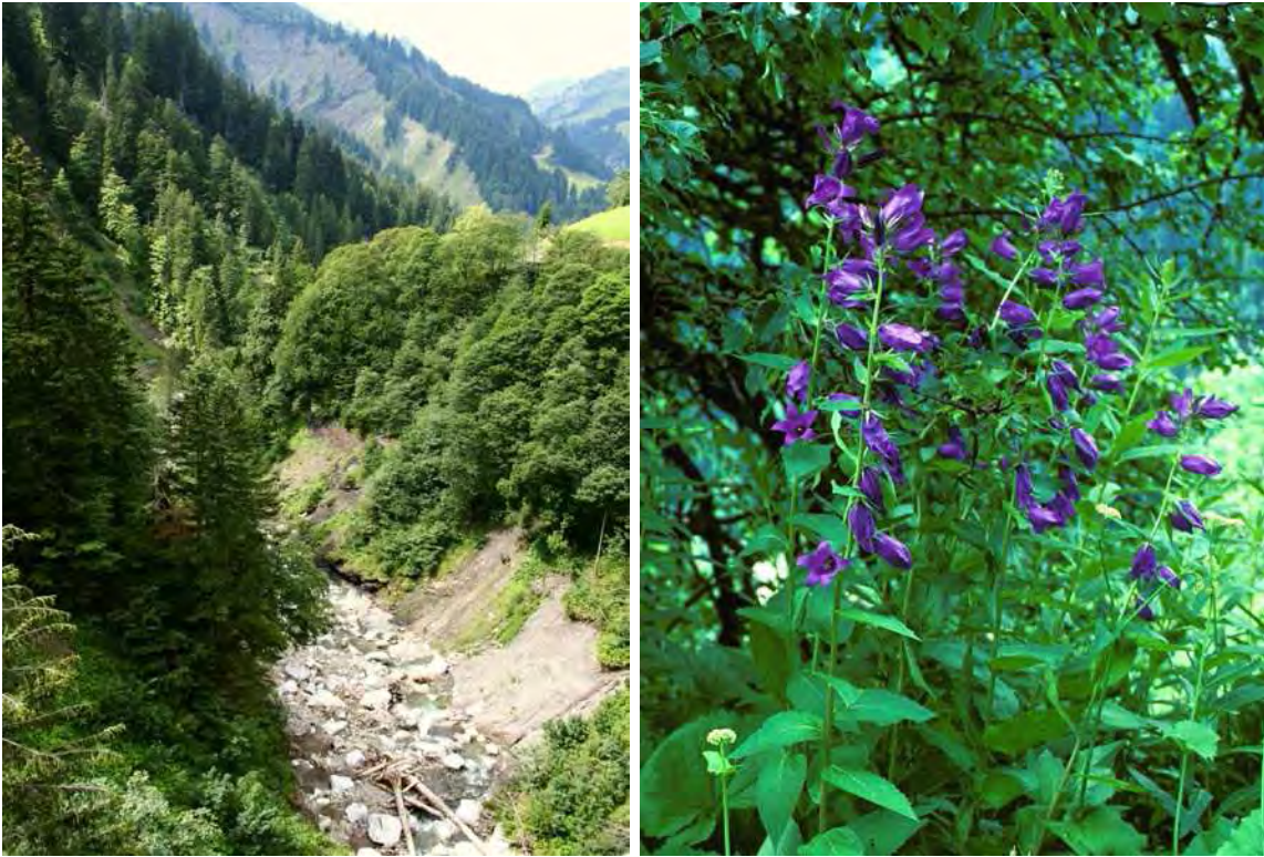
Abbildung 11: Bregenzer Ache von der Straßenbrücke in Schröcken aus fotografiert; die von Hochwasser beeinflussten bachnahen Bereiche sind vegetationsarm, darüber erstrecken sich artenreiche, luftfeuchte Schluchtwälder (z.B. Ahorn - Ulmenschluchtwald) mit der stark gefährdeten Breitblättrigen Glockenblume ( Campanula latifolia ), rechts im Bild.