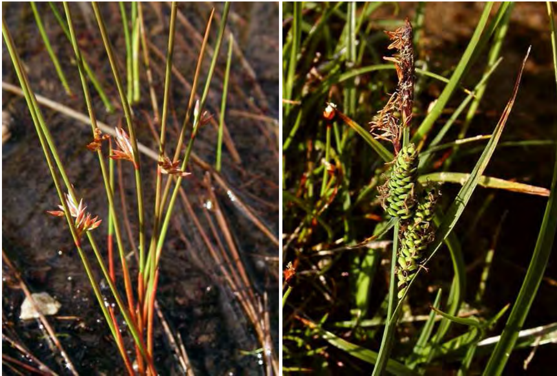
Abbildung 6: In der Umrandung des Tümpels sind die beiden Arten Faden-Binse ( Juncus filiformis ), links und die Braunsegge ( Carex nigra ) rechts, als typische Arten dieses Biototyps anzutreffen.

Kleinflächiges Durchströmungsniedermoor mit einem kleinen Tümpel in stark beweidetem Vorsäßgebiet. Das kleine Flachmoor hat sich in einer Verebnung einer Hangschulter gebildet. Durch wasserstauende Schichten dürfte es zu unterirdischen Quellaustritten kommen. Oberflächlicher Abfluss ist keiner zu sehen. Im zentralen Bereich des Moores ist ein Braunseggenmoor ( Caricetum nigrae ) ausgebildet. Das Wasserangebot ist relativ hoch, es ist fast ganzjährig anstehendes Wasser zu beobachten. In der Mitte ist ein ca. 5 m 2 großer Tümpel mit Teichschachtelhalm, randlich in den etwas trockeneren Teilen mit Fadenbinsenmoor ( Juncetum filiformis ) ausgebildet.