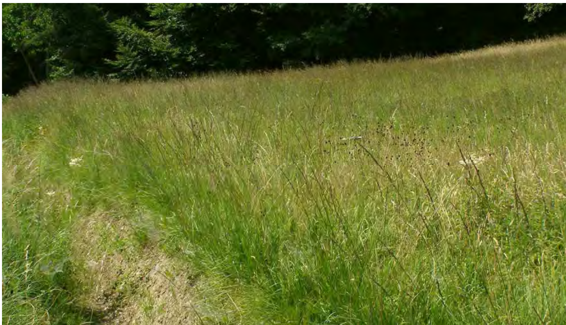
Abbildung 2: Reste der Streuwiese bei Brunnen mit dem Graben an der Südgrenze.

Die in den 80-er Jahren noch beschriebene artenreiche Pfeifengraswiese ist zum Kartierungszeitpunkt im Jahre 2006 nur noch als schmaler Streifen inmitten von Intensivwiesen vorhanden. An der südlichen Grenze verläuft ein ca. 1,5m tiefer Graben. Die Austrocknungserscheinungen in der Restfläche der Streuwiese sind deutlich feststellbar. Das ehemals noch beschriebene Vorkommen von Orchideen ist auf Einzelexemplare zurückgegangen. Gegen die Landesstraße hin verläuft eine ca. 20m breite Parzelle, die nicht in das Biotop integriert wurde, da es sich um einen stark verbrachten Feuchtwiesenrest mit Dominanz der Flatterbinse handelt.