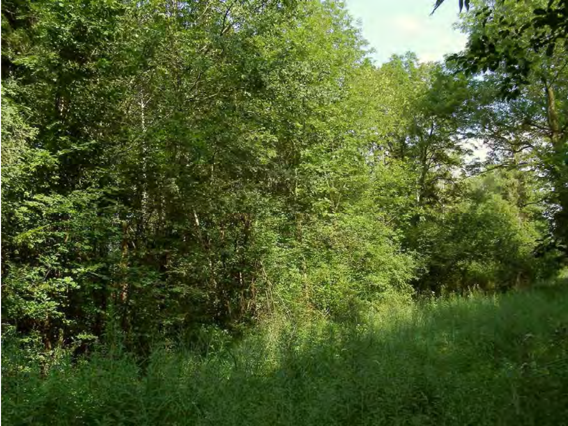
Abbildung 4: Die Restbestände der Harten Au im Bereich der Frutz.