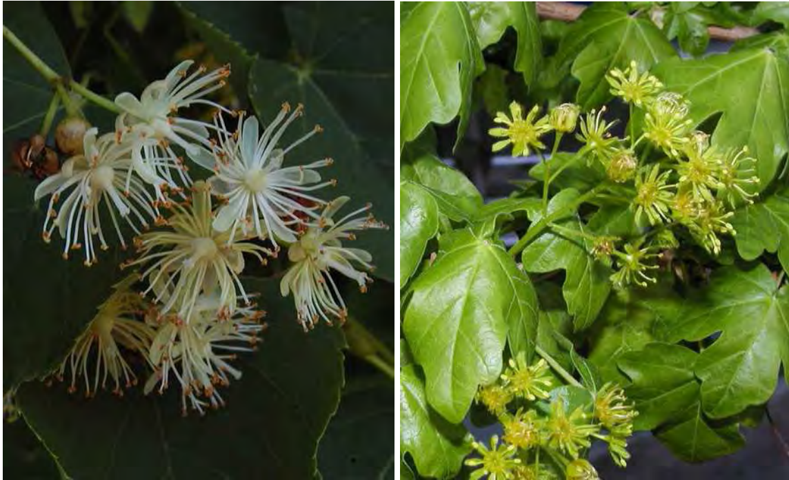
Abbildung 3: Die beiden in Vorarlberg seltenen Gehölze, Winterlinde ( Tilia cordata ), links und Feldahorn ( Acer campestre ), rechts.