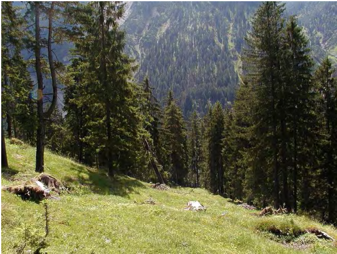
Abbildung 9: Blick in die lichten Fichtenwälder an den Abhängen der Kellaspitze