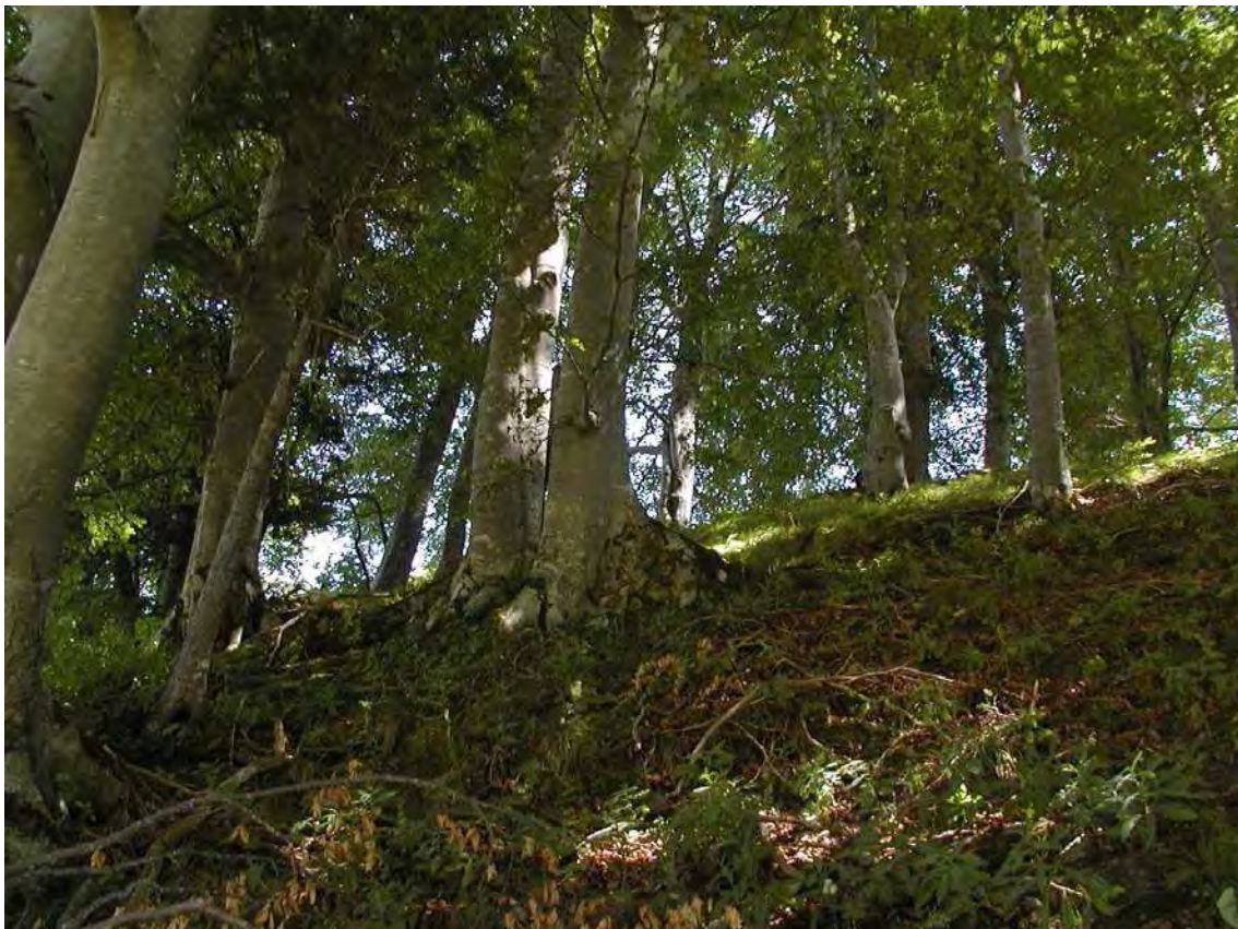
Abbildung 12: Die Buchenwaldinsel bei Marul

Der Tobelwald (am Reutlertobel) ist hochstaudenreich und wird von Eschen, Bergahorn und Ulmen aufgebaut ( Arunco-Aceretum ). Der Tobelbach weist stellenweise Tuffausfällungen auf. Die Wälder bedürfen keiner Pflege, Einzelstammnutzung ist tolerierbar. Die Magerwiese sollte im Spätsommer gemäht und nicht gedüngt werden. Die 1987 in diesem Biotop ausgewiesenen Feuchtflächen werden als Teilobjekte von 11806 geführt.