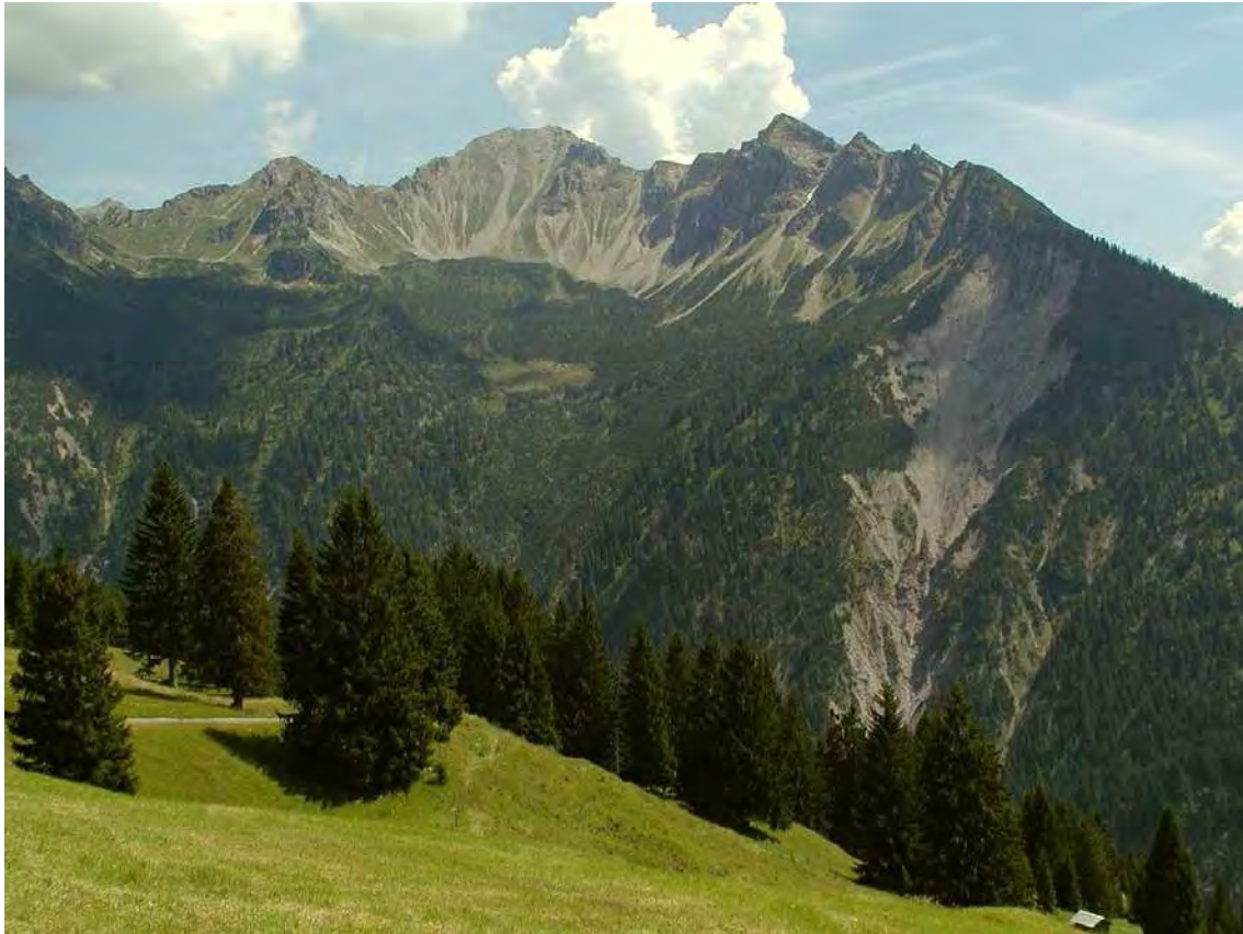
Abbildung 8: Blick auf die Gamsfreiheit und die darunterliegende obere Novaalpe