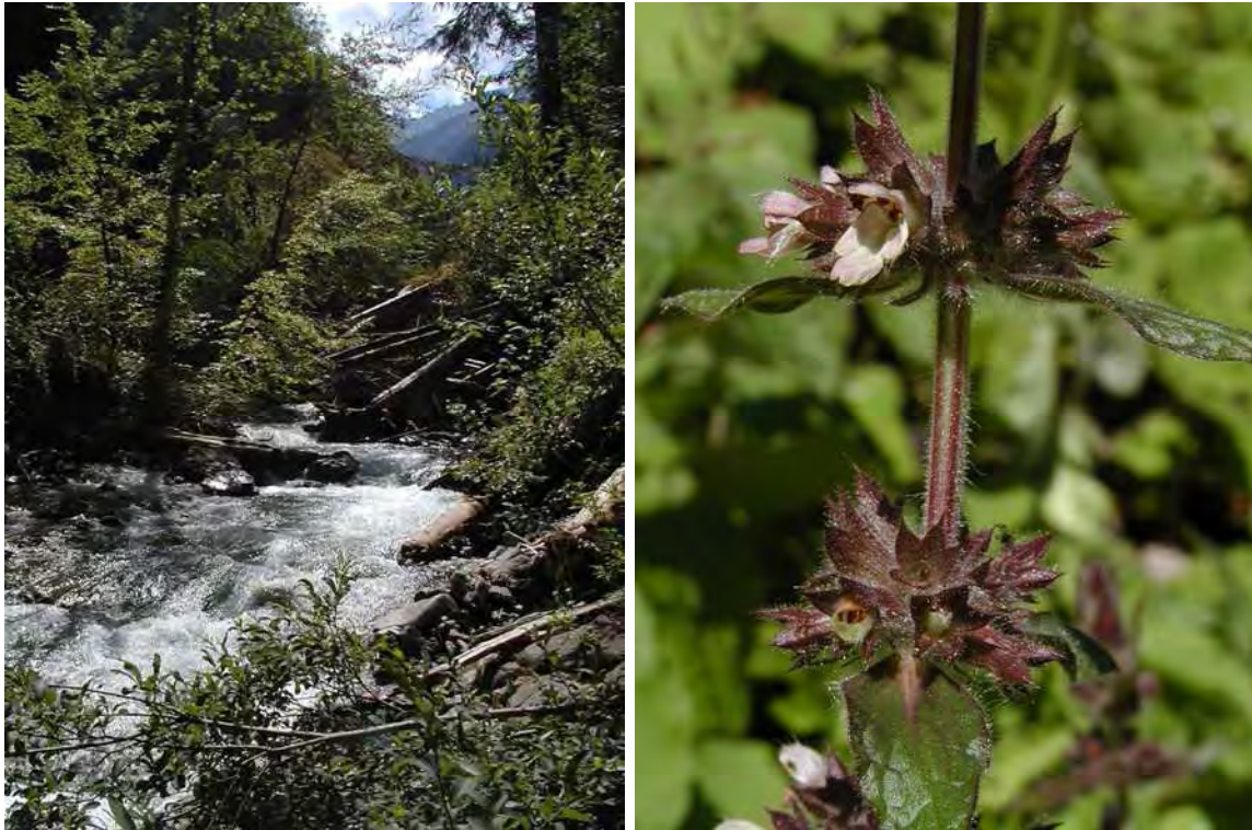
Abbildung 7: Der Lassangabach (Maruler Bach) stellt einen typischen Wildbach dar, rechts die stark gefährdete Kurzzähnlige Schwarznessel ( Ballota nigra ssp. meridionalis ) in den Alluvionen.