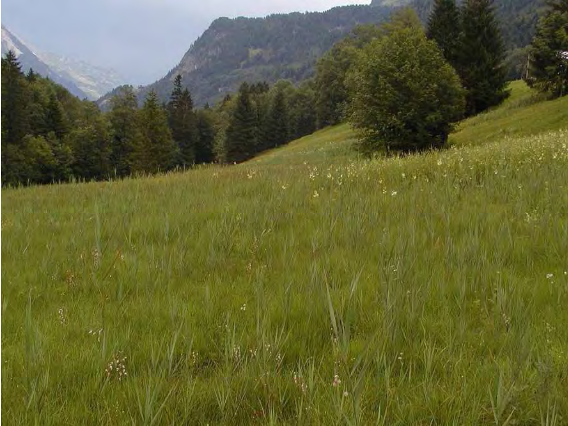
Abbildung 5: Das landschaftlich sehr reizvolle Hangmoor südlich des Lutzstausees mit stark gefährdeten Arten, wie der Floh-Segge ( Carex pulicaris ).