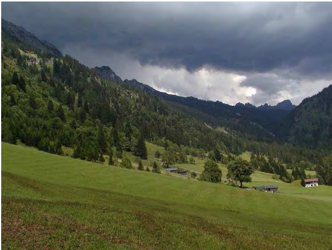
Abbildung 10: Blick auf die, durch Einzelbäume gegliederten Magerwiesen der Garfülla

Der Biotop bildet zusammen mit den Biotopen 11808 und 11810 eine abwechslungsreiche Landschaft von besonderer Vielfalt und Schönheit mit zahlreichen geschützten und gefährdeten Arten.