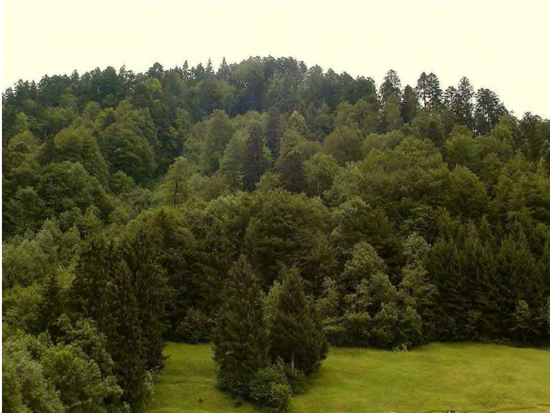
Abbildung 6: Die weitgehend naturnahen Unterhangwälder im Bereich Litze