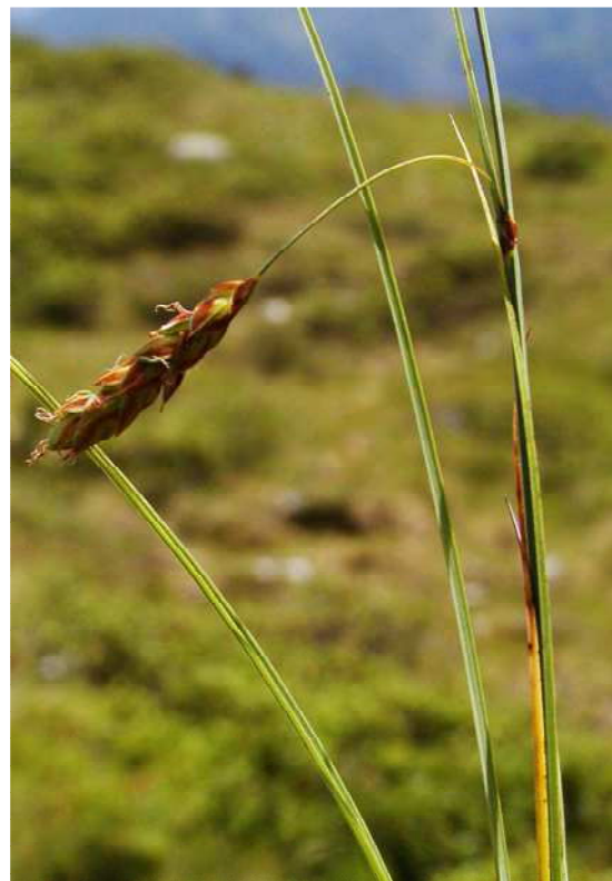
Abbildung 3: Das Verlandungsmoor östlich des Gronggenkopfes mit kleinen Schwingrasen der gefährdeten Schlammsegge ( Carex limosa ).