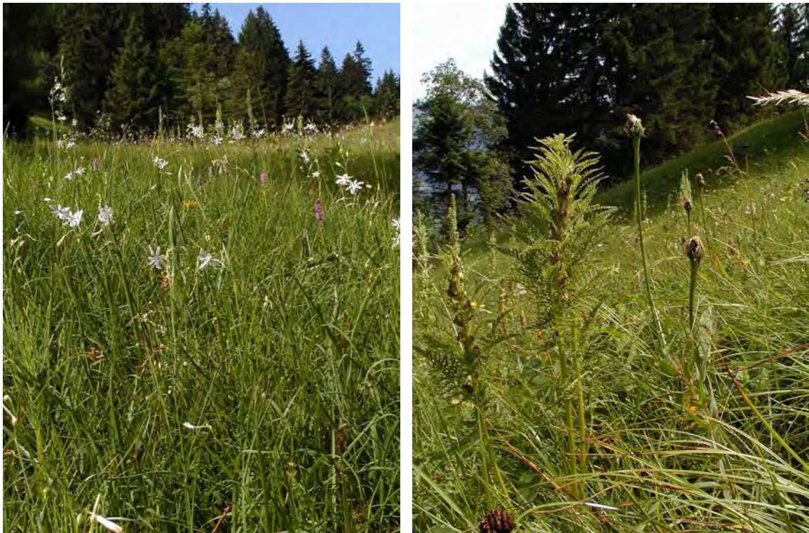
Abbildung 2: Die Mäher von Labom sind äußerst artenreich und setzen sich aus unterschiedlichen Gesellschaften zusammen. Links wechsellückene Pfeifengraswiesen mit großen Populationen der Ästigen Graslilie ( Anthericum ramosum ). Rechts Goldhaferwiesen mit Durchblätterm Läusekraut ( Pedicularis foliosa ) und Einblütigem Ferkelkraut ( Hypochaeris uniflora ).