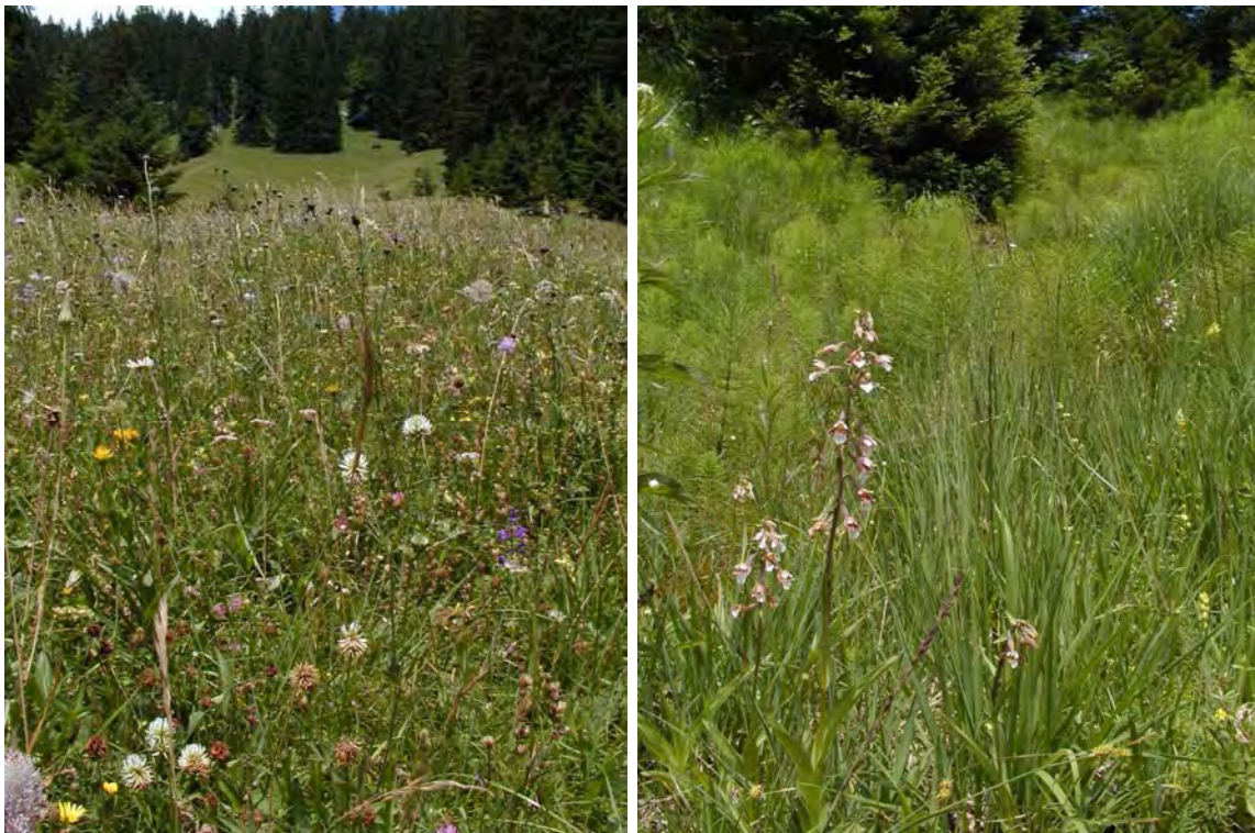
Abbildung 11: Rechts, artenreiche Trespenwiesen mit Berg-Klee ( Trifolium montanum ), links eine kleine Quellflur mit Sumpf-Stendel ( Epipactis palustris ) und Riesen-Schachtelhalm ( Equisetum telmateia ) am Sägabüchel

Im Bereich Hof fällt unterhalb der Straße eine durch eine Feldmauer abgegrenzte Weidefläche mit stark gegliedertem Relief, Lesesteinhaufen und Feldgehölzen auf. Die Weide wird zwar gedüngt, auf den Kuppen, Lesesteinhaufen und entlang der Mauer konnten sich aber noch attraktive und seltene Arten halten.