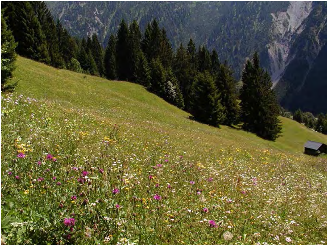
Abbildung 4: Die äußerst bunten und reich strukturierten Goldhaferwiesen oberhalb Marul

Großflächige, traditionell genutzte und reich strukturierte Kulturlandschaft oberhalb von Marul mit unterschiedlichen, sehr artenreichen Wiesentypen, kleinen Waldinseln und Resten von Hangmooren. Die Wiesen sind je nach Relief, Bewirtschaftung, Höhenlage und Exposition unterschiedlich ausgeprägt. Es dominieren Goldhaferwiesen, die alle Übergänge zu büstlingsreichen Straußgraswiesen, Glatthaferwiesen und hochstaudenreichen Brachen zeigen. Stellenweise ist auch das Pfeifengras dominant. In feuchten Mulden und entlang von Gräben sind kleinflächig Vernässungen mit Kalkmoorarten anzutreffen. Nach Osten ist die Biotopfläche durch ein Weidegebiet abgegrenzt, das aber ebenfalls artenreich ist. Einzelne Bäume und Baumgruppen strukturieren die Fläche in landschaftlich reizvoller Weise. Eine besonders alte Buche ist als Naturdenkmal ausgewiesen. Stellenweise wurden Fichten aufgeforstet.