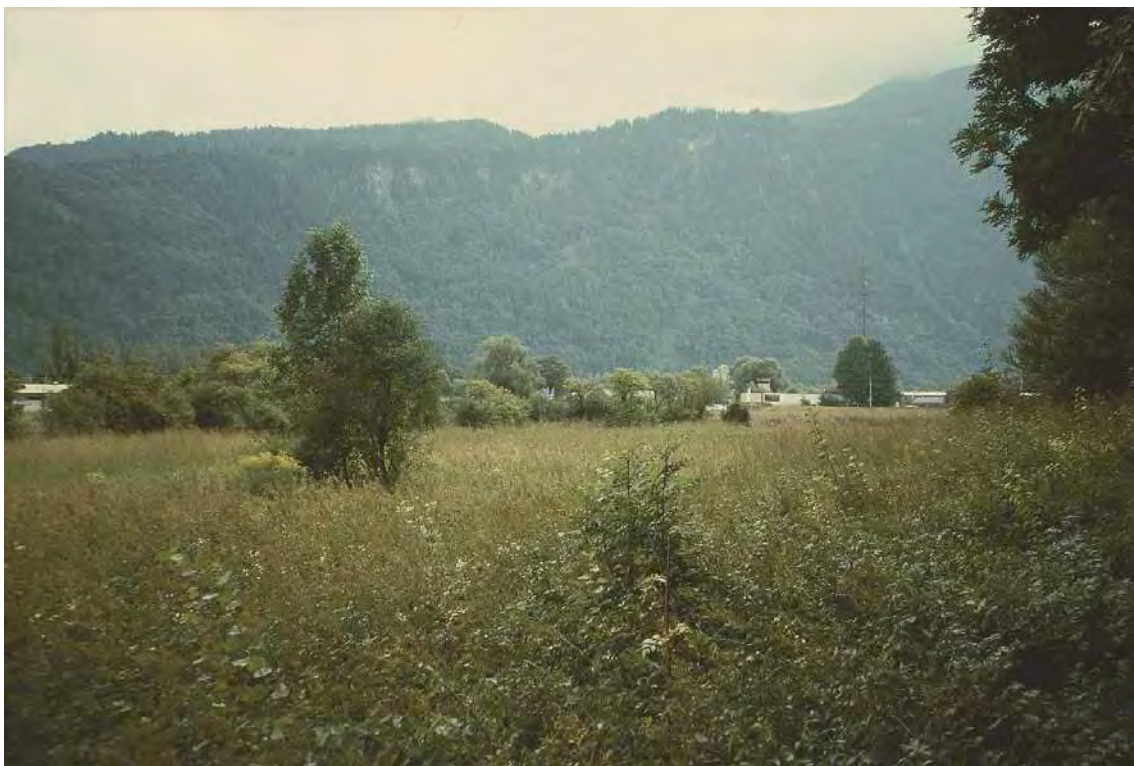
Abbildung 2: In Teilen brachgefallene Streuwiesen zwischen dem Hangfuß des Matonarückens und dem Getzenbächlein.

Am westlichen Ortsrand von Nüziders im weiteren Umfeld des Getzenbächleins gelegene Riedwiesen, die durch landwirtschaftliche Intensivierung und Ausweitung des Siedlungsgebiets stark aufgesplittert sind. Es handelt sich im Wesentlichen um relativ trockene Bestände der Hohen Pfeifengraswiese. Das kleine, etwas abseits gelegene Hangmoor am Sonnenberg wird von typischen Pfeifengraswiesen eingenommen, die in Teilen zu Kopfbinsenrasen überleiten. Die Flächen sind in Teilbereichen noch sehr artenreich und beherbergen eine Reihe stark gefährdeter Arten. Die Streuwiesen werden im Norden von den Waldhängen des Matona-Kopfs (Hangender Stein) begrenzt, im Süden durch die Bundesstraße B193. Im Siedlungs- und Gewerbegebiet südlich der B193 haben sich einige weitere isolierte Streuwiesenparzellen erhalten. Entlang des relativ naturnahen Getzenbächleins (Zubringer des Mühlbachs) finden sich stark vernässte, temporär wasserführende Flutmulden bzw. Wiesentümpel und ein kleiner Stauteich. Diese sind zumindest potentiell Laichhabitat für den Grasfrosch ( Rana temporaria ).