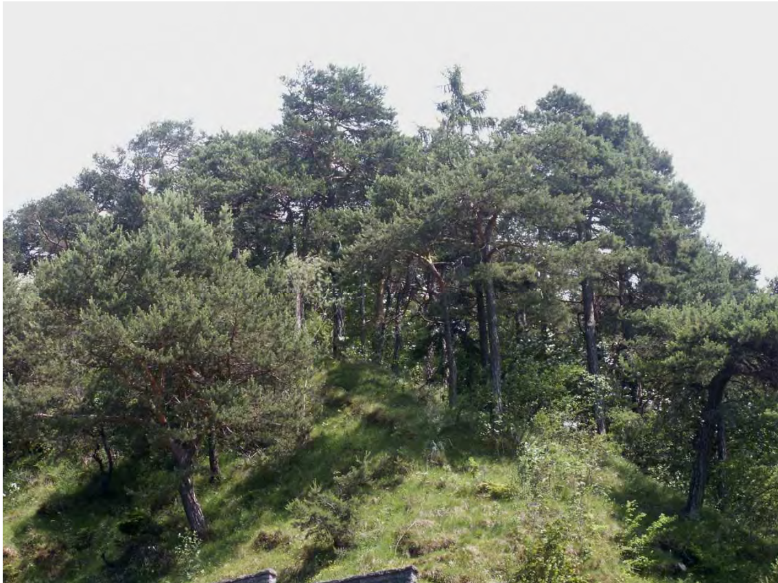
Abbildung 13: Die lichten Föhrenwälder im Galgentobel zeichnen sich durch Trockenheitsresistenz und eine hohe Artenvielfalt aus.

Beherrschender Waldtyp ist der Pfeifengras-Föhrenwald (Molinio- Pinetum), in dem die Waldkiefer ( Pinus sylvestris ) in Reinbestand auftritt. Der Unterwuchs ist vom Pfeifengras ( Molinia arundinacea ) beherrscht. Die Strauchschicht ist sehr üppig entwickelt, wobei Mehlbeere ( Sorbus aria ), Wolliger Schneeball ( Viburnum lantana ) und die Felsenbirne ( Amelanchier ovalis ) die häufigsten Arten sind. Vor allem im Galgentobel sind die Föhrenwälder von Felswänden mit der Felsenfingerkraut-Gesellschaft ( Potentilletum caulescentis ) durchsetzt. Weiters finden sich hier auf Dolomit-Schutthalden Rau grasfluren ( Stipetum calamagrostis ) mit dem seltenen Rau gras ( Achnatherum calamagrostis ) sowie in feuchteren Rinnen eine Gesellschaft mit der Schwarzen Kopfbirse ( Schoenus nigricans ).