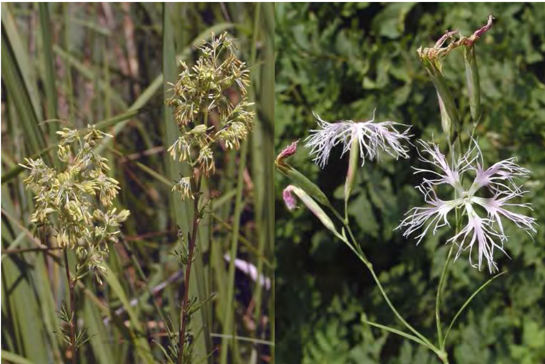
Abbildung 3: Die stark gefährdeten Arten Wiesenraute ( Thalictrum simplex ) und Prachtnelke ( Dianthus superbus ) finden in den Streuwiesen der Unteren Rieder einen Lebensraum.