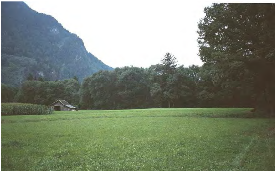
Abbildung 4: Die ausgedehnten Auwälder der Tschalenga sind ein bedeutender Lebensraum im ansonsten sehr intensiv genutzten Talboden.

Das Alter des in seiner Baumartenzusammensetzung sehr naturnahen Waldbestands beträgt rund 50 bis 60 Jahre, er dürfte aus einem Kahlschlag ohne künstliche Verjüngung hervorgegangen sein. Innerhalb des Auwalds finden sich einige alte Rodungsflächen, die südlichen werden als Viehweiden genutzt. Die zwei nördlichen Rodungsinseln wurden ehemals als Wiesen genutzt, eine der Flächen wurde inzwischen mit Fichte und Rotföhre aufgeforstet. Der östlich angrenzende Baggersee wurde in den 1980er Jahren renaturiert. Besonders die südliche Uferzone hat sich in der Zwischenzeit zu einem sehr wertvollen Lebensraum entwickelt. In der Flachwasserzone sind ausgedehnte, von Gebüsch durchsetzte Schilfröhrichte entwickelt, randlich sind im Bereich von Kiesaufschüttungen noch offene Pionierfluren vorhanden, die als Amphibienlaichplätze von Bedeutung sind. Der Baggersee selbst dient als Fischereigewässer. Abgesehen vom gärtnerisch gestalteten Bereich um die Fischerhütte ist der Nutzungsdruck im gesamten Uferbereich relativ gering.