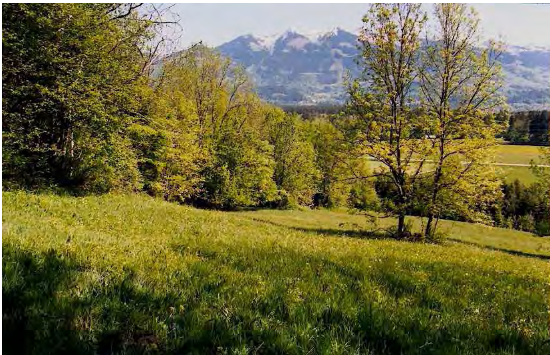
Abbildung 11: Am Hangfuß des Tschalengaberges befinden sich schöne Trespenwiesen, die mit Feldgehölzen und Buchenwald verzahnt sind.

Die Wiesen zeichnen sich durch eine besondere, frische Ausbildung einer Trespenwiese aus (Mesobrometum mit Astrantia major , Colchicum autumnale und - beachtenswert! - Carex pulicaris ). Die Vernetzung mit naturnahen Buchenmischwäldern und Feldgehölzen (z.B. Fraxinus und Acer campestre ) wertet das Gebiet zusätzlich ökologisch auf.