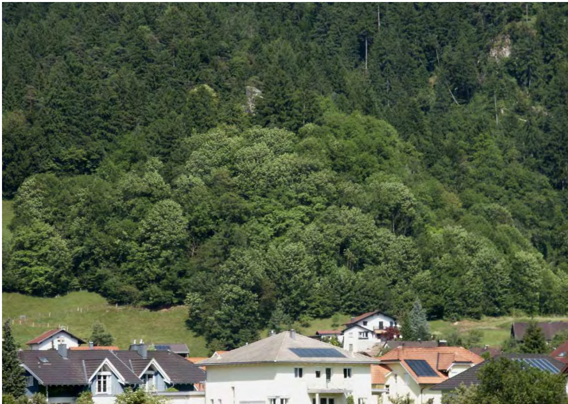
Abbildung 10: Blick auf den artenreichen Laubmischwald unter der Ruine Sonnenberg. Er enthält viele wärmeliebende Florenelemente und schöne Exemplare des Feldahorns.

Besonders artenreiches Laubwaldfragment bei der Ruine Sonnenberg. Der Wald um die Ruine Sonnenberg ist außerordentlich artenreich und ist zu den wärmegetönten Waldgesellschaften zu zählen, die auch am Montikel (Bludenz) ähnlich ausgebildet ist (Turiner Meister Linden-Mischwald auf Kalk). In der Baumschicht dominieren Esche ( Fraxinus excelsior ) und Bergulme ( Ulmus glabra ), aber auch Stieleiche ( Quercus robur ) tritt stellenweise hervor. Auffallend ist weiters eine Strauchschicht, in der Feldahorn ( Acer campestre ) mit teilweise schönen Exemplaren vertreten ist. In der üppigen Krautschicht sind wärmeliebende Arten (z.B. Asperula taurina ) zu finden.