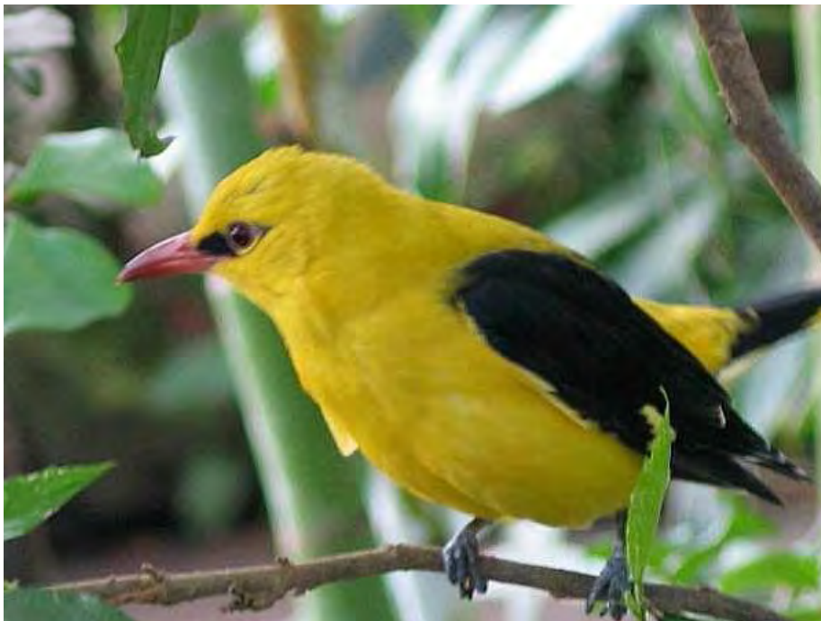
Abbildung 5: Die Tschalenga Au ist auch Rastplatz für den Pirol ( Oriolus oriolus ), wenn dieser im Frühjahr vom Süden Afrikas wieder nach Europa zieht.