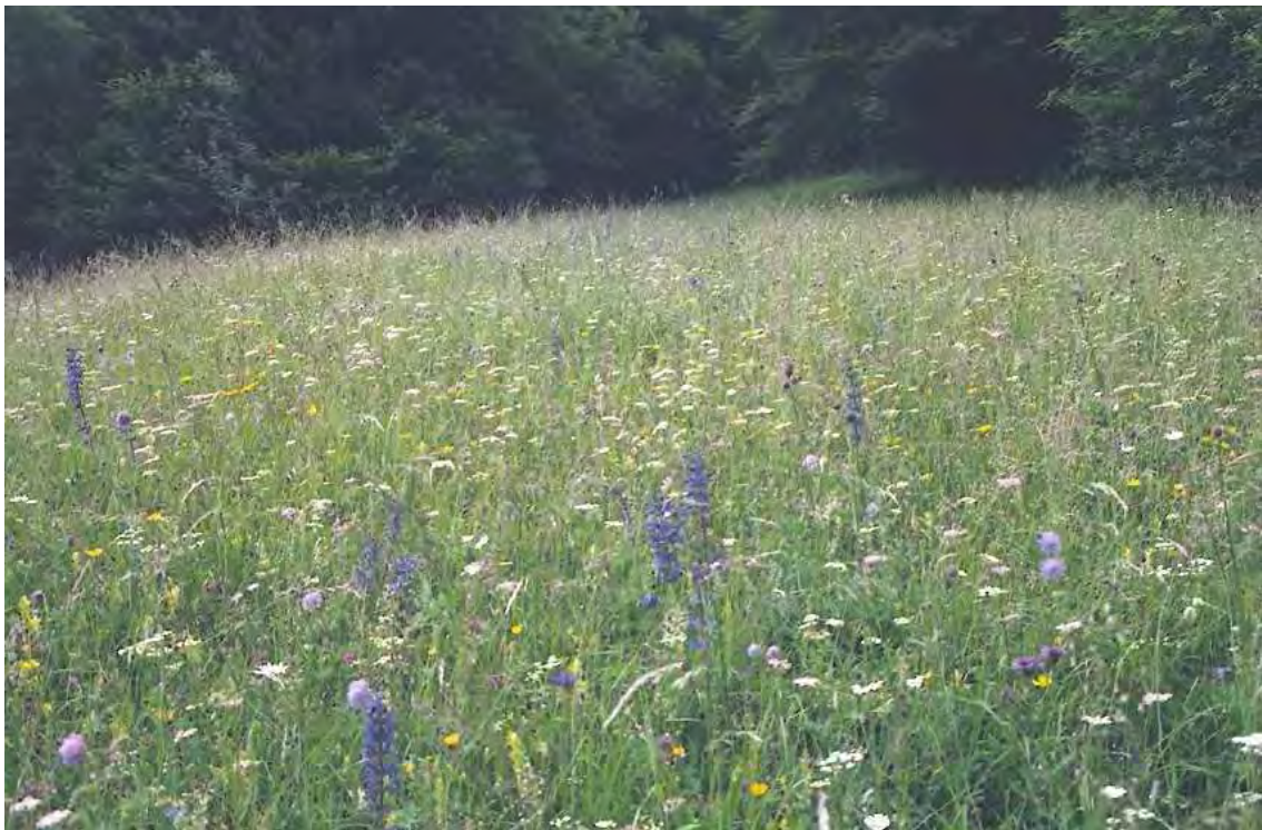
Abbildung 8: Halbtrockenrasen bei Laz in Vollblüte.

Als Lebensraum seltener und bedrohter Arten sowie als Zeugnis und letzte Überreste von gemähten Halbtrockenrasen erhaltenswert.