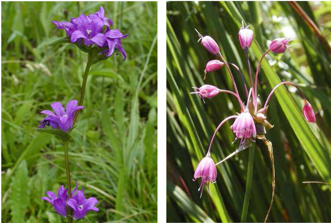
Abbildung 12: Die gefährdeten Arten Knäuel-Glockenblume ( Campanula glomerata ) und Kiel-Lauch ( Allium carinatum ) sind auf magere Wiesen wie jene der Tschalenga angewiesen.