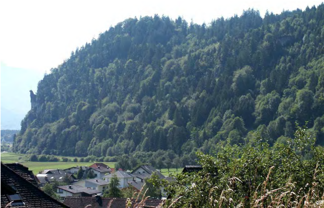
Abbildung 6: Der Hangende Stein bildet als vorderster Ausläufer des Höhenzuges Nitzkopf-Sättel-Matonakopf einen markanten Blickpunkt im Walgau. In geologischer Hinsicht stellt er die Verbindung zum Rätikon dar. Wärmeliebende Wald- und Felsspaltenvegetation mit seltenen Arten prägt den Felskopf.

Auf Ludescher Gemeindegebiet hat der Hangende Stein die Biotopnummer 11507.