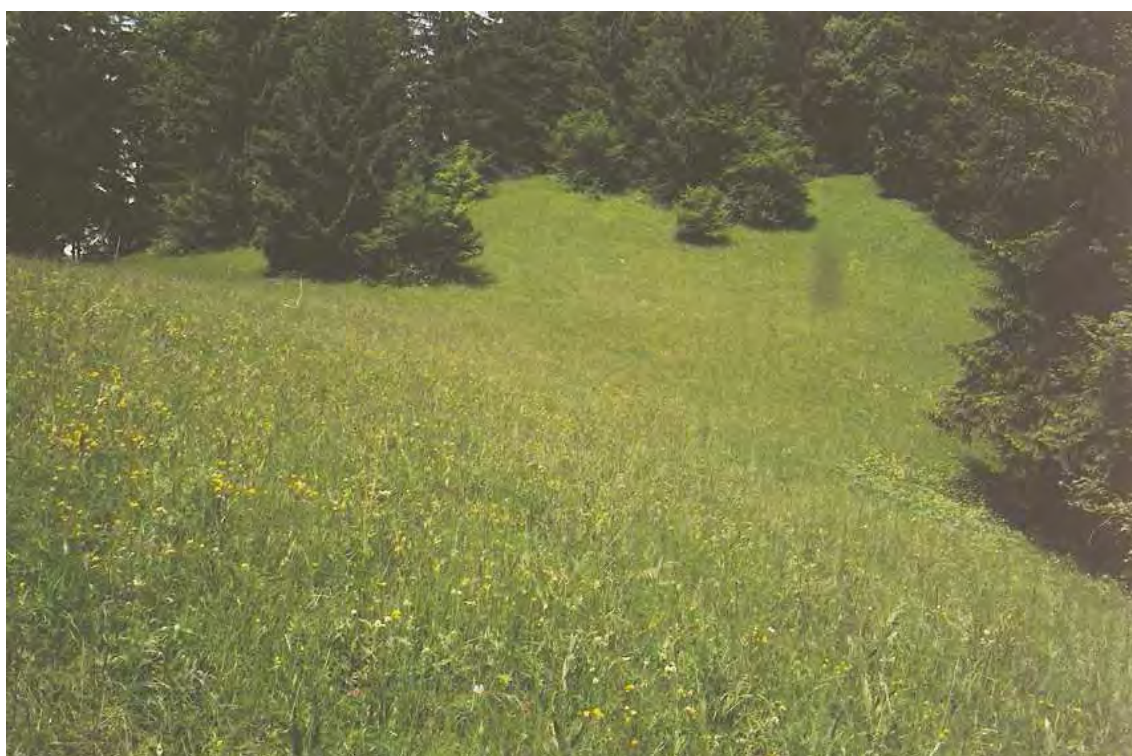
Abbildung 7: Die Bergmähder beim Sättele beherbergen eine Vielzahl verschiedenster Pflanzen auf kleinem Raum.

Am Wanderweg von Laz (Nüziders) zum Ludescherberg (Ludesch), westlich des Nitztobels, finden sich besonders artenreiche, als Bergmähder bewirtschaftete Magerwiesen vom Typ einer Trespenwiese (Mesobrometum). Die Magerwiesen zeichnen sich durch eine große Anzahl von verschiedenen Pflanzenarten auf kleinem Raum aus.