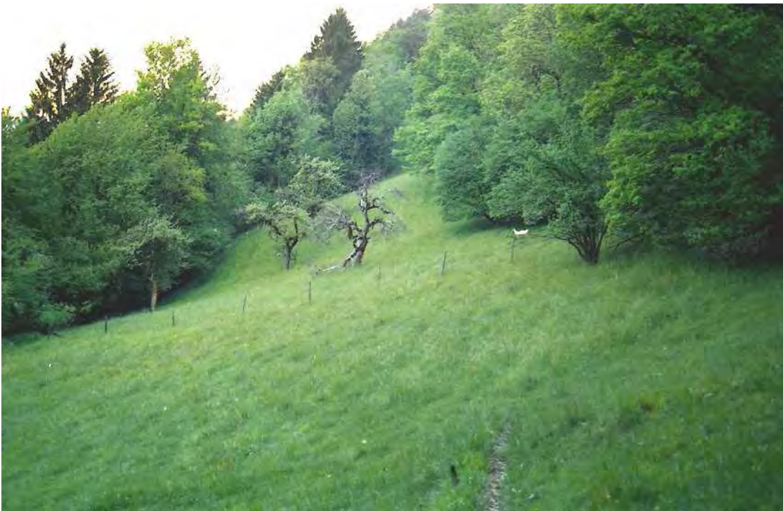
Abbildung 9: Am Siedlungsrand von Nüziders sind noch einige wertvolle Magerwiesen erhalten. Sie sind durch Intensivierung oder durch die Ausdehnung der Siedlung stark gefährdet.

Unter der Biotopnummer 11706 (Hasensprung) sind mehrere Flächen wertvoller Trespenwiesen des Siedlungsgebietes von Nüziders zusammengefasst. Es handelt sich um nur mehr bruchstückhaft erhaltene salbeireiche Trespenwiesen (Mesobrometen), die durch Intensivierungstendenz seitens der Landwirtschaft, aber auch durch Siedlungsausdehnung stark gefährdet sind. Mehrere Flächen befinden sich nordwestlich der Ruine Sonnenberg, eine Fläche am Terrassenabhang beim Hasensprung nördlich der Eisenbahnlinie und eine Fläche an einem Hügel östlich der Pfarrkirche.