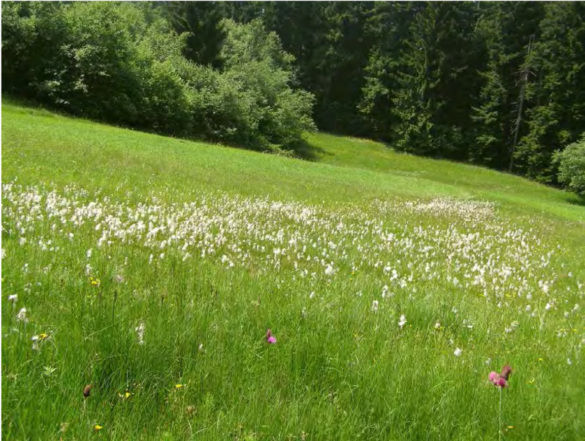
Abbildung 6: Hangflachmoor mit Breitblättrigem Wollgras ( Eriophorum latifolium ) im Hintergrund und magere Feuchtwiesen mit Bachkratzdistel ( Cirsium rivulare ) im Vordergrund.