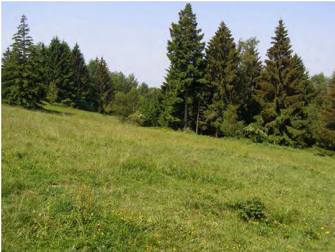
Abbildung 3: Die extensiv genutzte Viehweide bei Ramsach im oberen Teil. Blick nach Südwesten.

Die Verbuschungsinitialen und Gebüschgruppen setzen sich aus Heckenrose ( Rosa canina agg.), Brombeere ( Rubus fruticosus agg.), Himbeere ( Rubus ideaus ), Weißdorn ( Crataegus monogyna ), Hasel ( Corylus avellana ) und der Verjüngung der Baumarten zusammen, wobei recht häufig Stieleiche zu finden ist. An schattigen Stellen gesellen sich weiters die Vogelbeere ( Sorbus aucuparia ), Schwarzer und Roter Holunder ( Sambucus nigra , S. racemosa ) hinzu. An vernässten Standorten setzen sich die Gebüsche dahingegen hauptsächlich aus Salweide ( Salix caprea ), Ohrchenweide ( Salix aurita ) und der Verjüngung von Esche ( Fraxinus excelsior ) zusammen.