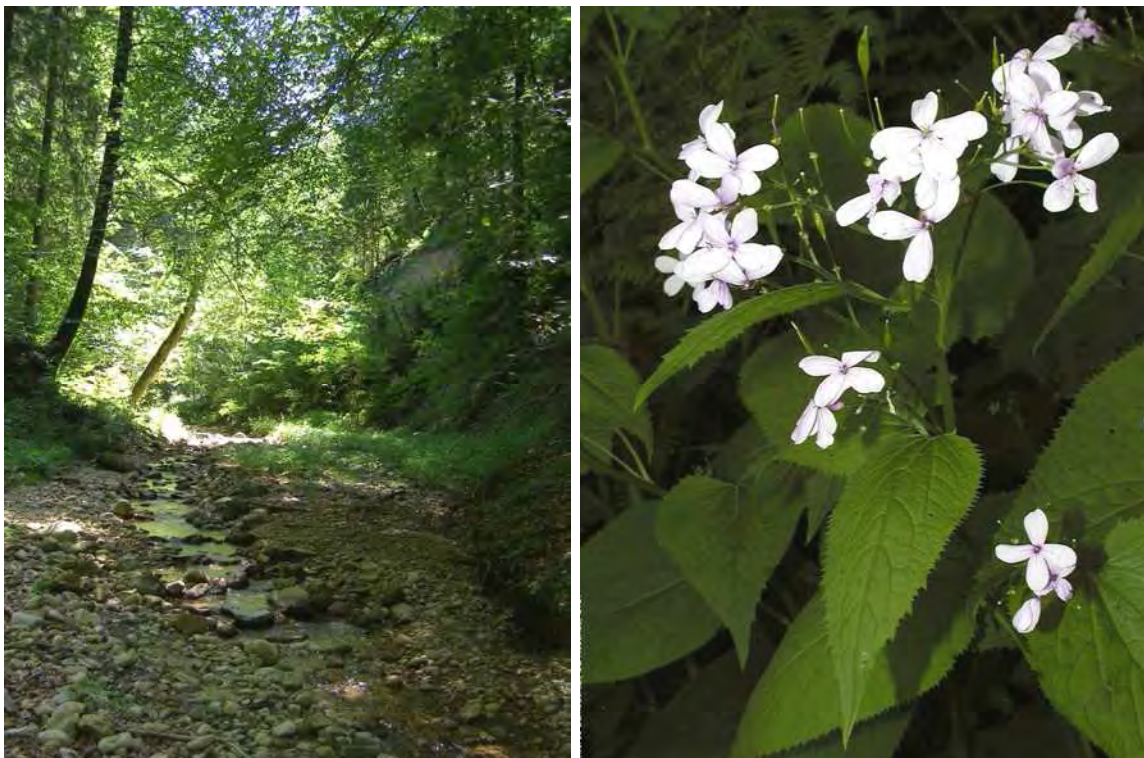
Abbildung 8: Im unteren Abschnitt des Gwigger Baches. In den bachbegleitenden Wäldern findet sich die seltene Mondviole ( Lunaria rediviva ).

Der Gwigger Bach durchfließt von seinem Quellgebiet bis zum Erreichen des Talbodens ein weitgehend natürliches, nur in sehr geringem Ausmaß durch menschliche Nutzung geprägtes Waldtobel und stellt ein sehr schönes Beispiel für die Bäche der Pfänderwestabdachung dar. Der südliche Quellast des Gwigger Baches hat seinen Ursprung in den teils von einem Schwarzerlen-Bruchwald ( Alnetum glutinosae ) bestockten Quellmooren im Gebiet von Möggers-Stadlers, weitere Zuflüsse entspringen in den Waldungen im obersten Teil des Tobels. Der Lauf des Gwigger Baches ist als weitgehend natürlich anzusprechen, einzig im Unterlauf finden sich einzelne hölzerne Querbauwerke. Im oberen Laufabschnitt ist das Bachbett teils felsig, im Bereich von Molassebänken sind stellenweise auch größere Fallstufen von bis zu 10 Meter Höhe ausgebildet. Infolge häufiger seitlicher Rutschungen und Anrisse säumen immer wieder größere Blöcke und Grobschotter den Bachlauf. Der untere Laufabschnitt ist dagegen weit weniger felsig, das Bachbett ist schottrig, stellenweise sind auch größere Schotterbänke zu finden. Die Tobeleinhänge werden im Wesentlichen von Buchen-Tannenwäldern ( Abieti-Fagetum ) eingenommen, an den Unterhängen ist lokal auch der Ahorn-Eschenwald ( Aceri-Fraxinetum ) anzutreffen.