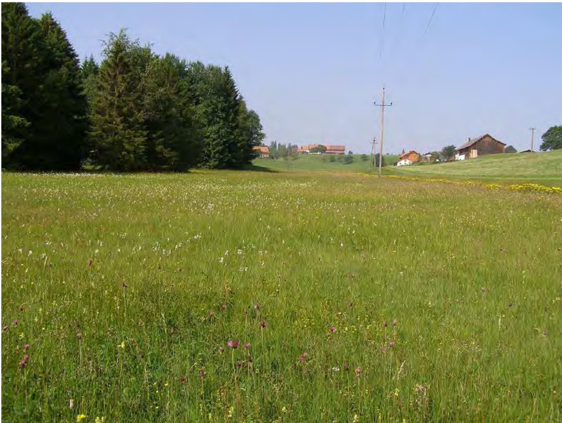
Abbildung 2: Der Moorkomplex von Stadels mit blühender Bachdistel ( Cirsium rivulare ) und fruchtendem Wollgras ( Eriophorum latifolium ).

Östlich von Sättels, findet sich zwischen der Straße und dem Waldrand eine weiterer Moorkomplex, der in kleinen Teilen noch den ursprünglichen Hochmoorcharakter in Form einer "Moorheide" erkennen lässt. Ansonsten besteht der Moorkomplex größtenteils aus nicht ganz typischen Braunseggenriedern ( Caricetum goodenowii ), uneinheitlich ausgeprägten Pfeifengraswiesen ( Molinietum caeruleae ) und etwas nährstoffreicheren Bachdistelwiesen ( Cirsietum rivularis ). Der gesamte Bestand ist durch ehemalige Versuche der Trockenlegung etwas beeinträchtigt, aber nach wie vor sehr schützenswert.