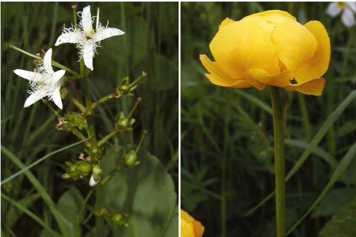
Abbildung 11: Der gefährdete Fieberklee ( Menyanthes trifoliata ), der in den am stärksten vernässten Bereichen zu finden ist und die Trollblume ( Trollius europaeus ) im Saum des Quellwaldes.

Westlich von Buchans findet sich, dem anschließenden Waldgebiet vorgelagert ein kleiner, in einer flachen Quellmulde stockender Quellwald der von Schwarz- und Grauerlen ( Alnus glutinosa , A. incana ) aufgebaut wird. Der moosreiche Unterwuchs beherbergt typische Arten wie etwa Riesen-Schachtelhalm ( Equisetum telmateia ) und Waldsegge ( Carex sylvatica ). In der Umrahmung des Quellwalds sind Flachmoorfragmente erhalten geblieben, mit einem bemerkenswerten Bestand des Fieberklee ( Menyanthes trifoliata ) im Bereich einer starken Vernässung.