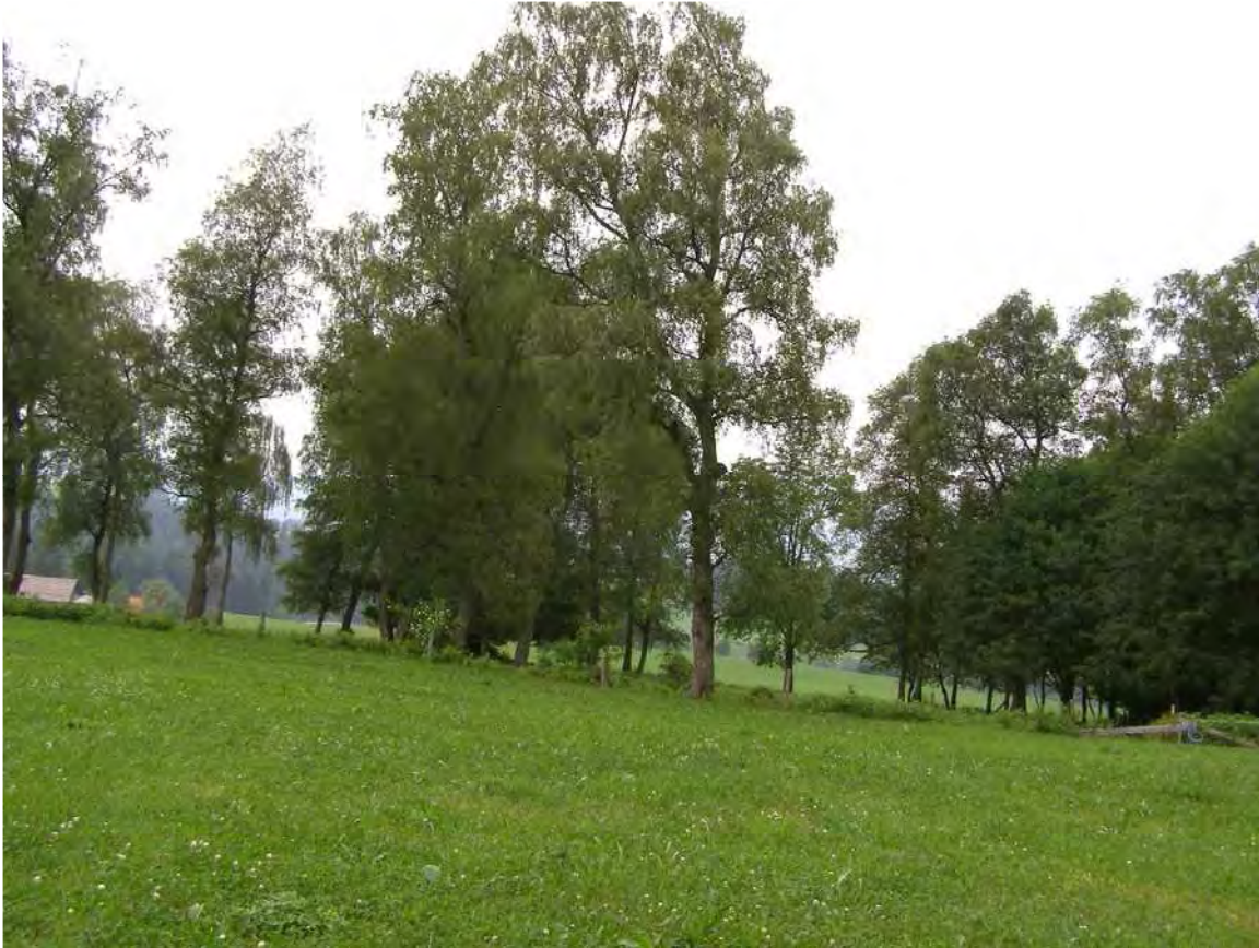
Abbildung 4: Der Besenbirkenhain bei Möggers.