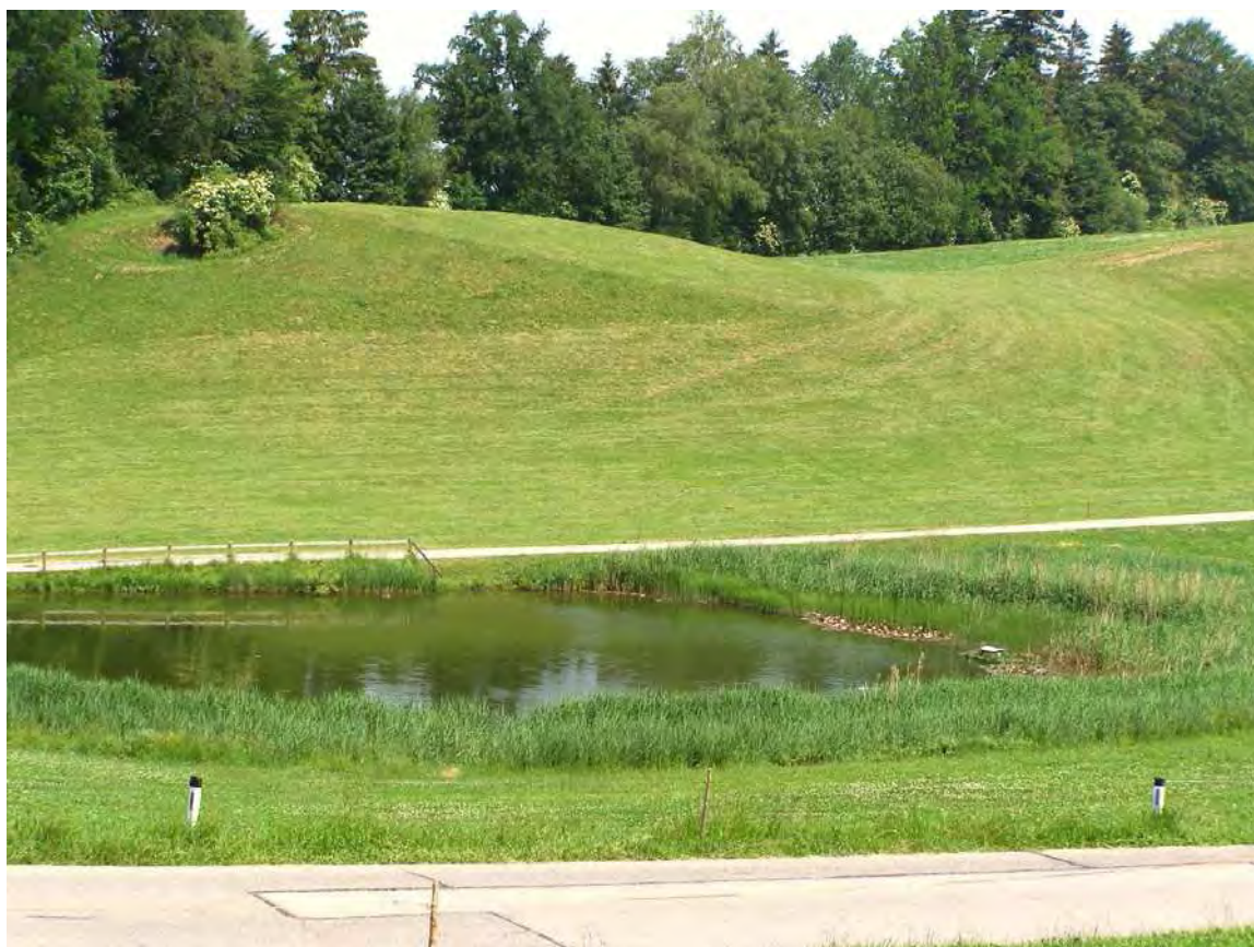
Abbildung 12: Der landschaftspflegerisch gestaltete Ramsacher Weiher.

Der Ramsacher Weiher ist ein künstlich gestautes kleines Gewässer das nach limnologischen Gesichtspunkten richtigerweise als Teich zu bezeichnen ist. Er wurde zum "Biotop" gestaltet, mit eingesetzten Seerosen (gelbblühend) und Rohrkolben. Randlich ist der Teich von einem Teichschachtelhalmröhricht ( Equisetum fluviatile -Gesellschaft) und Schilfröhricht ( Phragmitetum ) gesäumt.