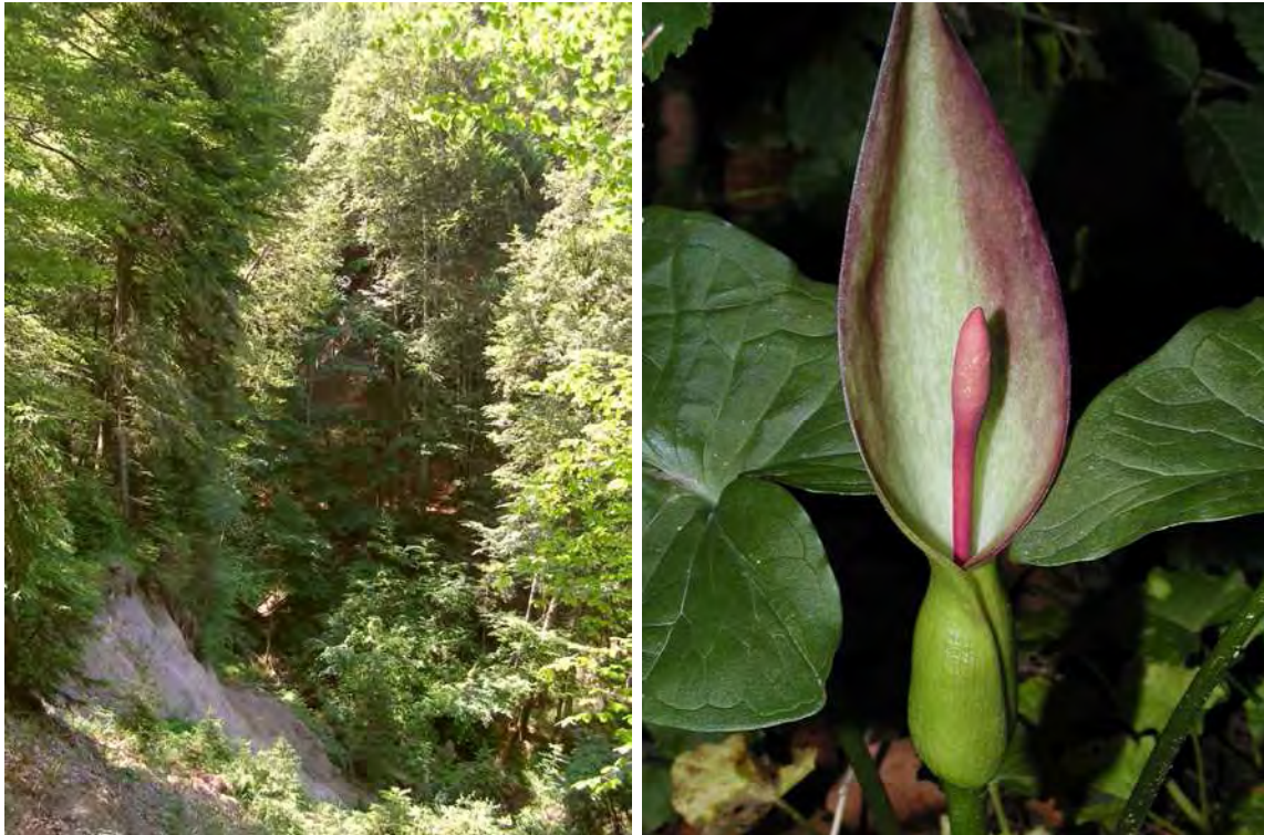
Abbildung 7: In den Schluchtwäldern der Kesselbachschlucht tritt der seltene Aronstab ( Arisema maculatum ) auf.

Der Kesselbach selbst entspricht einem Molassebach mit permanenter Wasserführung. Das Bachbett ist oft mit Konglomeratfelsbrocken verfüllt. Das geringe Gefälle und die aufgrund der fast durchgehenden Bewaldung nicht so rasche Eintrübung des Wassers während Niederschlagsereignissen dürften den Kesselbach für Fische und auch andere Fließwasserorganismen gut bewohnbar machen.