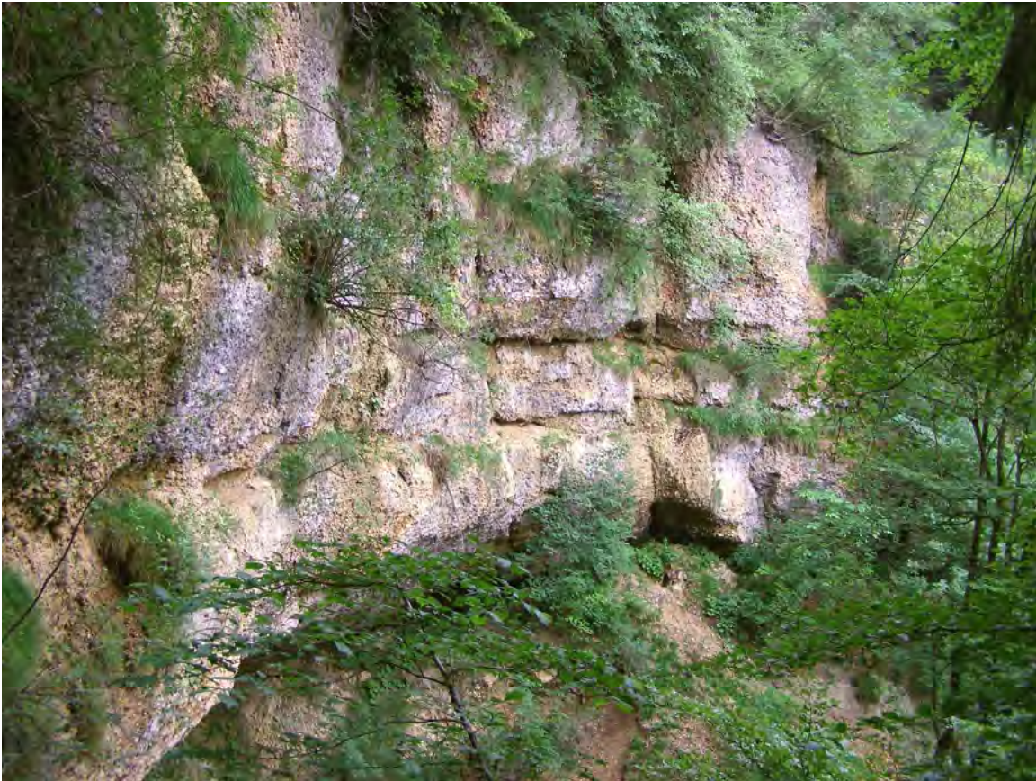
Abbildung 9: Die Nagelfluh-Bänke mit Vorkommen des stark gefährdeten Kies-Steinbrech ( Saxifraga mutata ).

Der Berger Bach fließt an der Gemeindegrenze zwischen Hörbranz und Möggers über hohe Nagelfluh-Felsschrofen und bildet einen ca. 20 Meter hohen Wasserfall. Oberhalb und darunter fließt der Bach durch enge, steil geböschte Waldschluchten. Die schattig-feuchten Felsen des Wasserfalls beherbergen die Kiessteinbrechflur (Aster bellidiastro-Saxifragetum mutatae), eine seltene Felspaltengesellschaft der Molassezone, die hier ihren einzigen bekannten Standort im Leiblachtal besitzt. Daneben vervollständigen Rasengirlanden und steile Eiben-Buchen-Tannenwälder (Abieti-Fagetum taxetosum) das Bild. Durch schwere Bringbarkeit und den Schutzwaldcharakter ist auch der Wald in sehr naturnahem Zustand.