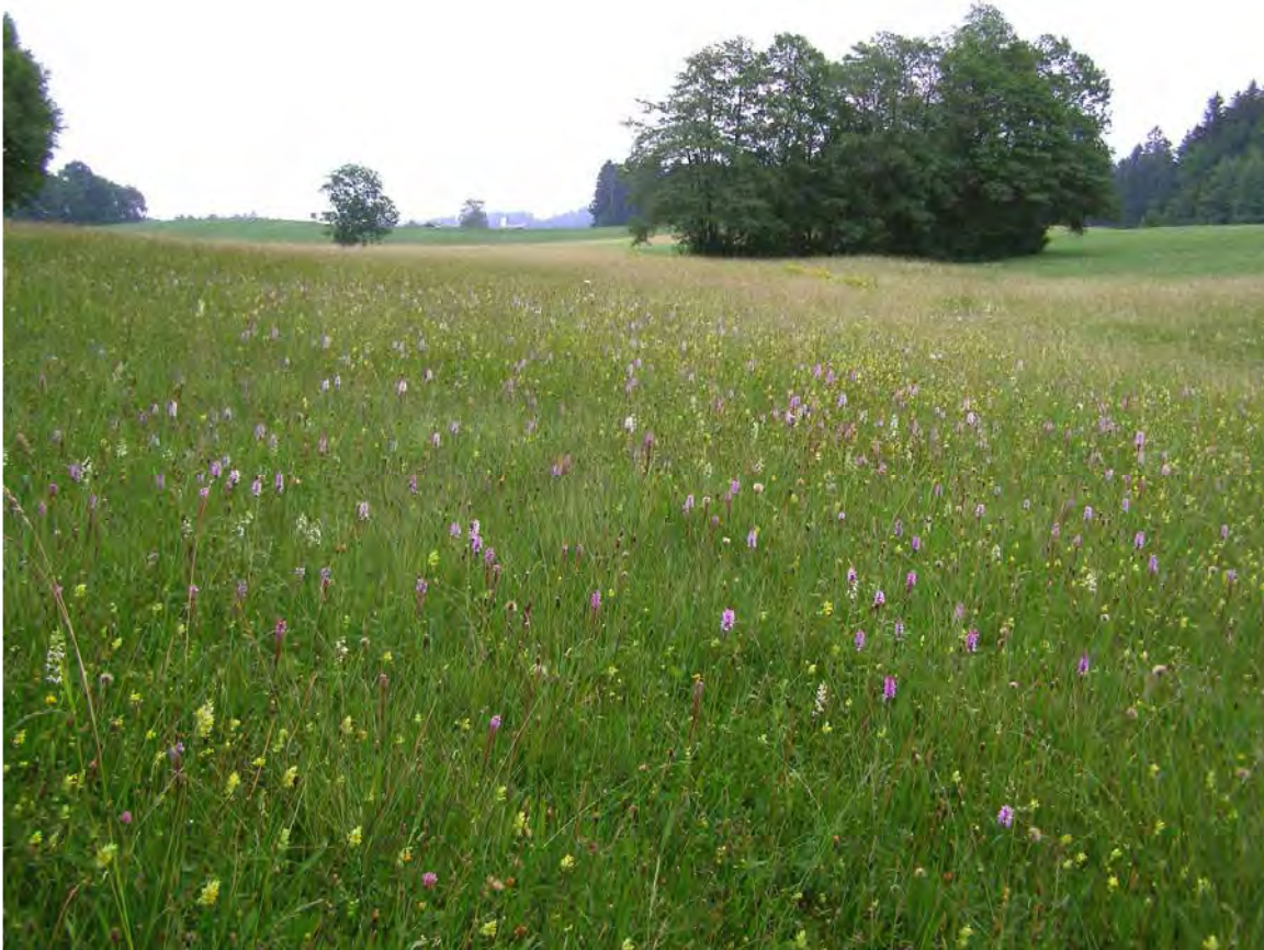
Abbildung 10: Streuwiese mit reichen Beständen des gefährdeten Gefleckten Fingerknabenkraut ( Dactylorhiza maculata ).