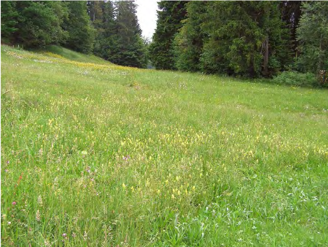
Abbildung 5: Die Hangflachmoore und Feuchtwiesen bei Kurlismühle.