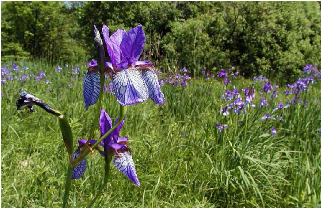
Abbildung 6: Die stark gefährdete Sibirische Schwertlilie ( Iris sibirica ), eine der schönsten Arten der Streuwiesen.