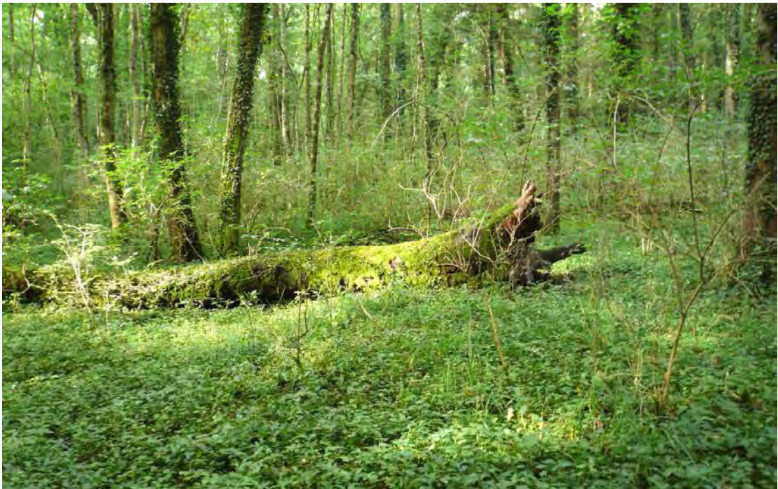
Abbildung 4: In der Meininger Oberau finden sich sehr schöne Hartholz-Auwälder die sich in Teilen durch ein weitestgehend natürliches Bestandesbild und einen großen Reichtum an Alt- und Totholz auszeichnen.

Das Biotop umfasst die Auwälder der Oberau innerhalb der Hochwasserdämme von Ill und Rhein von der Altenau bis zur Grenze mit Feldkirch. Es handelt sich hierbei um den dem Rhein am nächsten gelegenen Teil der rechtsufrigen Bereiche der Roten Au. Die Oberau stellt eine artenreiche Hartholzau (Ulmo-Fraxinetum) dar, die sich in weiten Teilen durch ein weitestgehend natürliches Bestandesbild und ein reiches Altholzvorkommen auszeichnet. Daraus begründet sich auch ihre ausgesprochene Schutzwürdigkeit, zumal Bestände wie dieser in den ausgedehnten, forstlich allerdings stark überprägten Auwäldern entlang der Unteren Ill (Rote Au), nur mehr inselhaft zu finden sind.