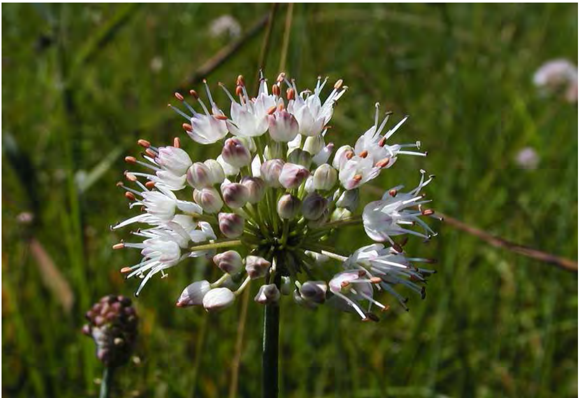
Abbildung 8: Der vom Aussterben bedrohte Duftlauch ( Allium suaveolens ), eine der charakteristischen Arten der Rheintaler Rieder.

Zwei Riedparzellen, mit teilweise sehr artenreichen Beständen der Hohen Pfeifengraswiese ( Selino-Molinetum caricetosum tomentosae ) und Mädesüßfluren. Vor allem die nordöstliche Fläche beherbergt stark bedrohte Arten. Die Parzellen liegen entlang des Ehbach-Kanals am östlichen Ortsrand von Meiningen. Die westlichen Riedteile liegen gegenwärtig inmitten des Siedlungs- bzw. Gewerbebeerweiterungsgebiets, grenzen teilweise aber noch an landwirtschaftliche Flächen. Die nordöstlichen Riedteile sind im Landwirtschaftsgebiet (Intensivgrünland, Maisäcker) westlich der ARA-Meiningen zu finden.