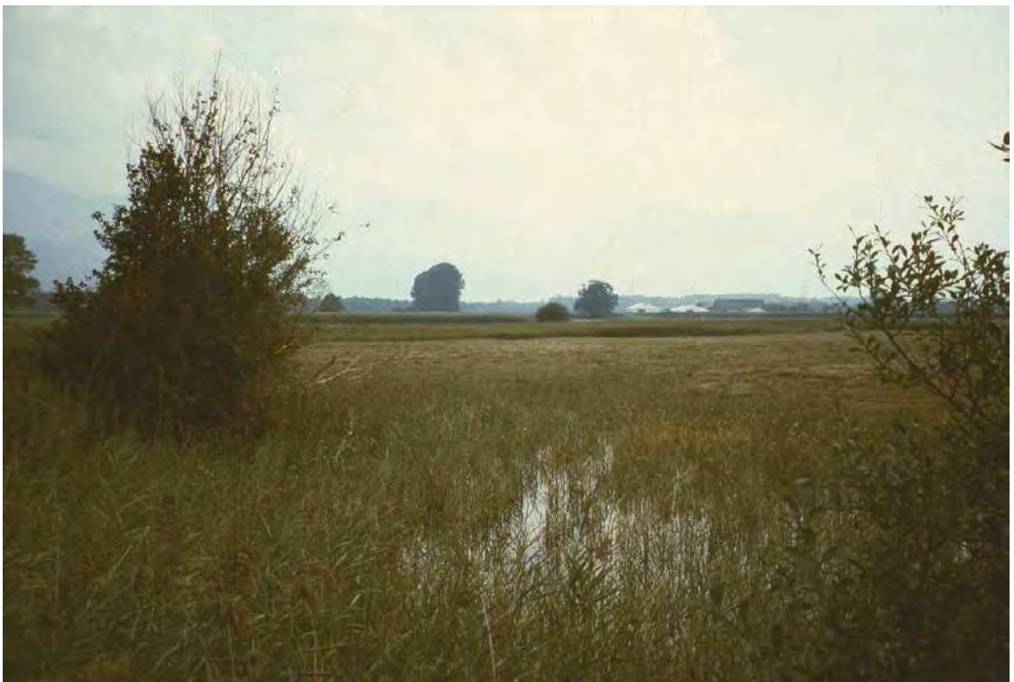
Abbildung 5: In Teilen stark vernässte Streuwiese mit Kopfbinsenriedern ( Schoenetum ferrugineae ); Nahrungsfläche für die stark gefährdete Bekassine ( Gallinago gallinago ).

Die nassen Streuwiesenflächen des Oberriedes besitzen Bedeutung als Brut- und Nahrungshabitate sowie als Trittsteinbiotop für Arten mit sehr speziellen und großflächigen Lebensraumansprüchen.