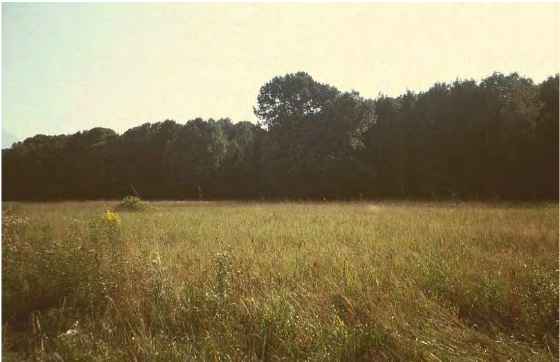
Abbildung 7: Blick auf die größte verbliebene Streuwiesenfläche der Altenau.

Artenreiche Pfeifengraswiesen (Selino-Molinietum) mit guten Beständen einiger stark bedrohter Arten. Es handelt sich um sechs isolierte Streuwiesenflächen am westlichen Siedlungsrand von Meiningen. Die fünf Teilflächen nordwestlich des Gießenbachs bzw. Ehbachkanals grenzen teils direkt an das Siedlungsgebiet, ansonsten an landwirtschaftlich intensiv genutzte Parzellen und die Auwaldreste gegen den Rhein. Die im Süden des Gießenbachs gelegene Parzelle grenzt im Westen an die Auwaldbestände am Illspitz, ansonsten ist sie von intensivlandwirtschaftlichen Flächen umgeben. Abgesehen von ihrer Bedeutung für den Artenschutz sind die Streuwiesen als vernetzende Elemente zwischen Gewässern (Giessenbach, Ehbach und Rhein), Auwald und offenem Kulturland, sowie als Trittsteinbiotope besonders schützenswert.