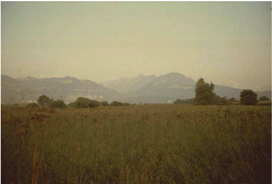
Abbildung 2: An bestimmten Stellen vermittelt die Streuwiesenlandschaft von Petzlern noch einen Eindruck der ehemaligen Weite.

Ausgedehnte, durch Einzelbäume und Feldgehölze strukturierte Riedwiesen vom Typ der Mitteleuropäischen und Hohen Pfeifengraswiese (Selino-Molinietum). Die Streuwiesen von Petzlern liegen mit Ausnahme einer Parzelle rechtsufrig des Ehbach-Kanals, an der Gemeindegrenze zwischen Meiningen und Rankweil. Der Großteil der Streuwiesen liegt auf Meininger Gebiet, zwei Parzellen in Rankweil (vgl. Biotop 41405). Im Osten schließen die Streuwiesen im Großfeld (Rankweil, Biotop 41403) an. Das Umfeld der Streuwiesen wird im Wesentlichen von landwirtschaftlich intensiv genutzten Flächen (Grünland, Maisäcker) gebildet. Die Bestände sind floristisch äußerst reichhaltig und beherbergen große Populationen stark gefährdeter Arten. Auch zoologisch ist das Gebiet von großer Bedeutung, genannt sei das Vorkommen des Wachtelkönigs ( Crex crex ).