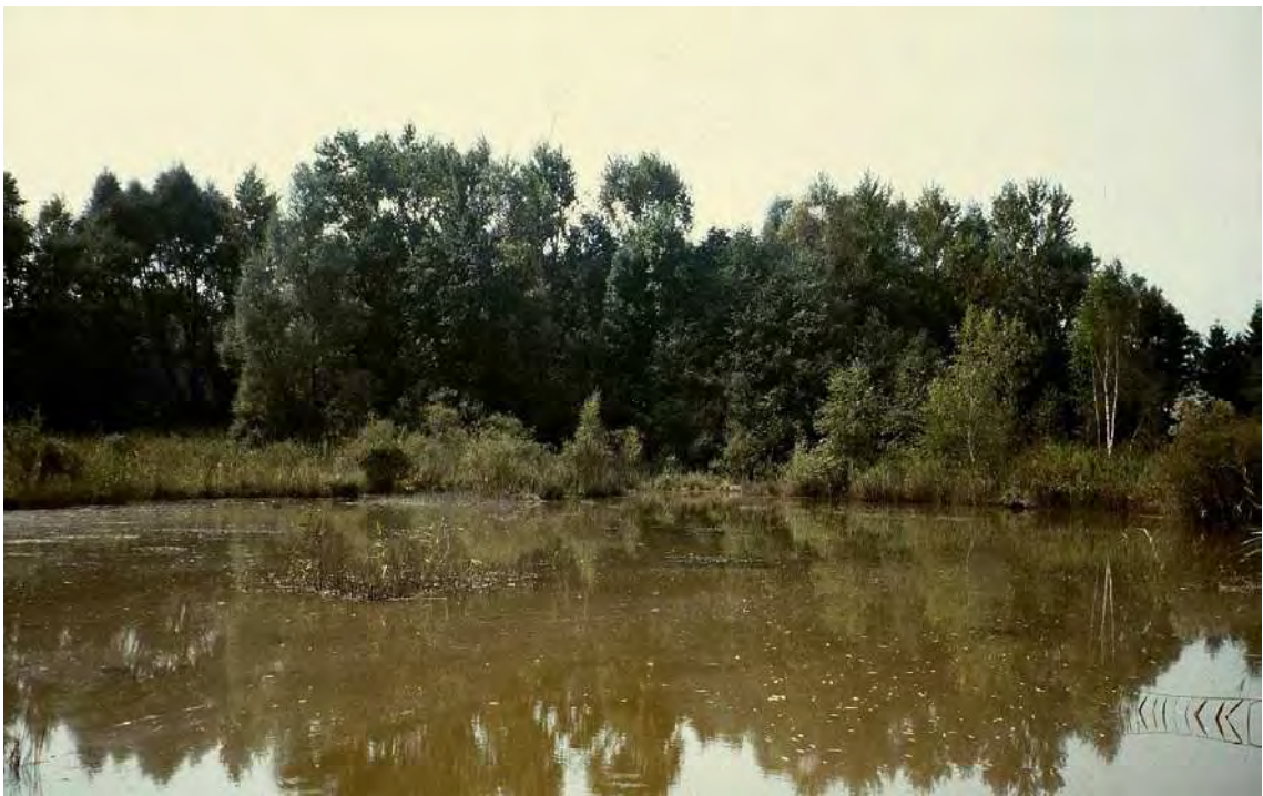
Abbildung 3: Bei den Meiningener Lehmhöhlen handelt es sich um einen bedeutsamen Feuchtlebensraum (Amphibien, Wasservogel etc).

Ehemaliges Abbaugelände, heute ausgedehnte Flachgewässer mit flächigen Schilfröhrichten und Gehölzumschattung. Wichtiger Lebensraum für bedrohte Amphibien- und Vogelarten. Die ehemalige Lehmasbeutungsstelle schließt unmittelbar nördlich an die ARA Meiningen an und ist von dieser durch den Luttengraben getrennt. Die Nordabgrenzung erfolgt durch den Ehbach-Kanal. Als regional bedeutsamer Amphibien- und Vogellebensraum sollten die Lehmhöhlen unbedingt erhalten werden. Die Ausweisung als geschützter Landschaftsteil wäre angebracht.