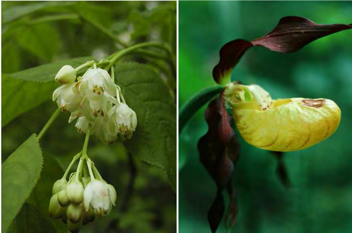
Abbildung 2: Die gefährdeten Arten Pimpernuß ( Staphylea pinnata ) links und der Frauenschuh ( Cypripedium calceolus ) rechts in den Wäldern des Pfänder.