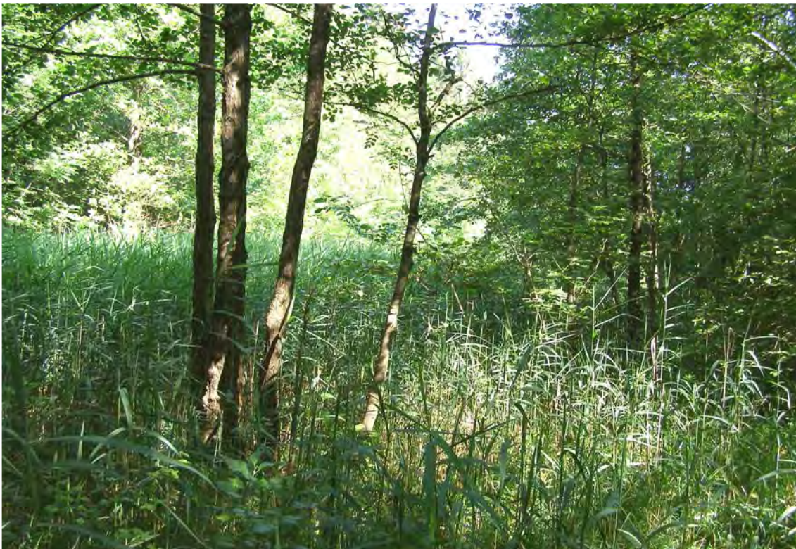
Abbildung 5: Schwarzerlenbestand mit dichtem Schilf-Unterwuchs.

Der Verlust der Pfeifengraswiesen, Grabherr (1987) bezeichnete den Bestand als einen der schönsten seiner Art, ist aus naturschutzfachlicher Sicht bedauerlich, zumal neben einem seltenen und stark gefährdeten Lebensraum auch gefährdete Arten verschwunden sind. Es gilt allerdings anzumerken, dass diesem Prozess insofern auch positive Aspekte abgewonnen werden können, als dass sich langfristig ein nasser Winkelseggen-Eschenwald ( Carici remotae-Fraxinetum ) bildet, wie er wohl vor der Kultivierung des Menschen an dieser Stelle zu finden war. Bei dieser, für nasse bis quellige Standorte der Molasszone typischen Waldgesellschaft handelt es sich ebenfalls um einen seltenen Lebensraum. Voraussetzung für eine solche Entwicklung ist allerdings, dass der Standort sich selbst überlassen wird und auf jegliche forstlichen Eingriffe verzichtet wird.