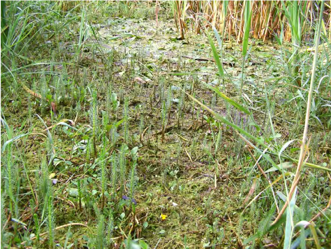
Abbildung 4. Verlandungszone mit reichlich Tannewedel ( Hippuris vulgaris ) und Wasserschlauch ( Utricularia vulgaris ) im Bregenzer Anteil des Biotops.