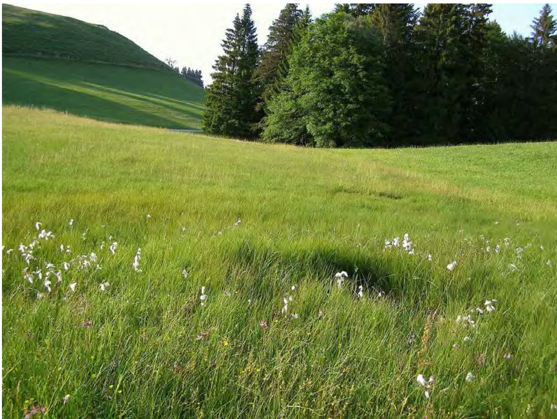
Abbildung 3: Blick über die Moorfläche mit fruchtendem Schmalblättrigem Wollgras ( Eriophorum angustifolium ).

Die Vegetation entspricht im zentralen Teil Kleinseggenriedern vom Typ des Braunseggenmoors ( Caricetum goodenowii ), randlich handelt es sich um saure Pfeifengraswiesen ( Molinietum caeruleae ) mit reichem Bestand der Spitzblütigen Binse ( Juncus acutiflorus ). In schlenkenartigen Vertiefungen gedeiht Froschlöffel ( Alisma plantago-aquatica ) und Gemeiner Sumpfried ( Eleocharis palustris ). Trotz eines gewissen Nährstoffeinflusses, der in der gesamten Fläche zu bemerken ist, beherbergt das Flachmoor nach wie vor die typische, auf nasse und nährstoffarme Bedingungen angewiesene Artengarnitur.