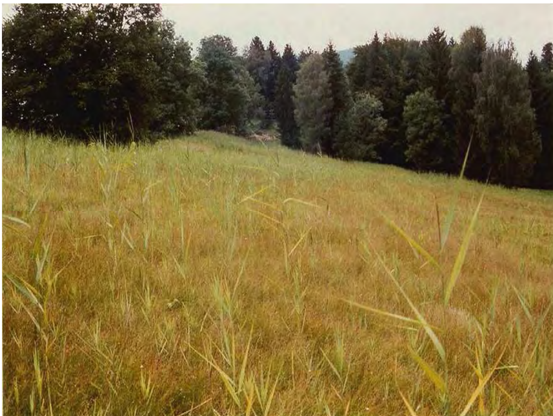
Abbildung 3: Blick über das Hangmoor bei Lässern mit schönen Kopfbinsenbestand im Vordergrund.

Flach- und Zwischenmoore mit großflächigen Mehlsprimel-Kopfbinsenrasen ( Primulo-Schoenetum ferruginei ) und Vorkommen des vom Aussterben bedrohten Langblättrigen Sonnentau ( Drosera anglica ). Der Moorkomplex liegt nördlich des Ortsteils Lässern in einer kleinen Talmulde, auf großteils sehr nassen Böden mit Hangwasseraustritten. Er ist teilweise nach Süden, teilweise nach Norden exponiert. Im Einflussbereich von Hangwasseraustrittsstellen kommt es zur Sinterbildung (kalkreiche Deltaschotter liegen hier auf Mergeln auf). In diesem Bereich liegen auch die Vorkommen des Langblättrigen Sonnentau ( Drosera anglica ). Daran schließen Davallseggenriede ( Caricetum davallianae ) mit schöner Artengarnitur an. In den nassen Bereichen weisen sie einen hohen Anteil an Fieberklee ( Menyanthes trifoliata ) auf, in trockeneren Randbereichen gehen sie in Pfeifengraswiesen ( Molinietum caeruleae ) mit der im Gebiet seltenen Färberscharte ( Serratula tinctoria ) über. An Gerinnen und Störzonen gedeihen auch Rispen-Seggenfluren ( Carex paniculata ).