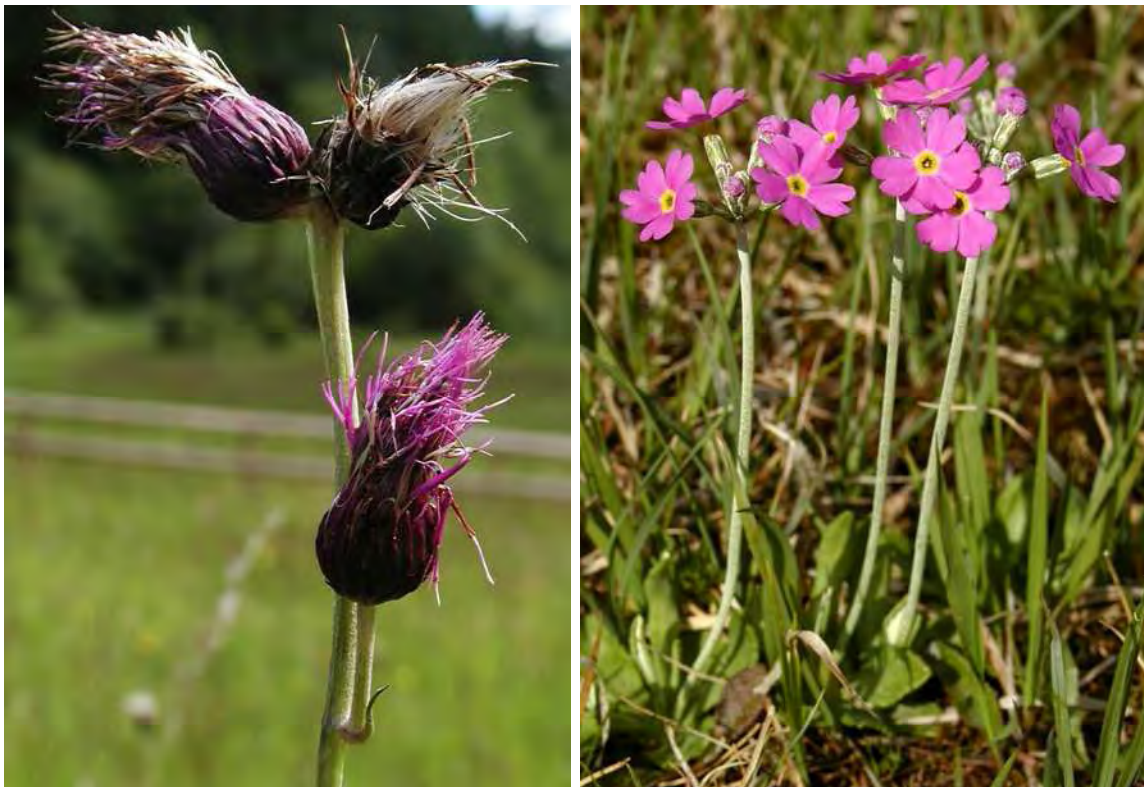
Abbildung 12: zwei der vorkommenden Arten in den Rieden bei der Lingenauer Brücke; links die stark gefährdete und in nährstoffreicheren Feuchtwiesen vorkommende Bach-Kratzdistel ( Cirsium rivulare ); rechts die für Davallseggenrieder typische Mehlprimel ( Primula farinosa ).

Drei kleine Flachmoorreste am Süd- bis Südosthang beidseitig der alten Straße nach Grossdorf, wenig vor der Brücke mit Davallseggenried, Mädesüßflur und Pfeifengraswiese mit erstaunlichem Artenreichtum. Die Hangmoore haben sich auf feinschluffigen Böden über Molasse entwickelt. Es handelt sich bei den Flächen um recht charakteristische Davallseggenrieder ( Caricetum davallianae ). In der östlichen Teilfläche ist Tuffstein lokal an einem Hangwasseraustritt zu finden. Auf weniger nassen Flächenteilen sind Pfeifengraswiesen ( Molinietum caeruleae ) entwickelt.