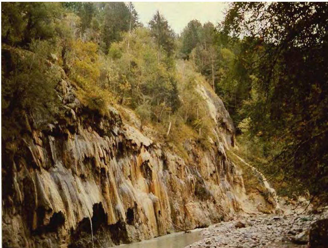
Abbildung 4: Die spektakuläre Kalktuffquelle südlich von Kapf.

Der Biotop erstreckt sich entlang der Subersach an den rechtsufrigen Einhängen von der östlichen Gemeindegrenze Lingenau bis zur Mündung in die Bregenzerache nördlich von Egg. Es handelt sich um eine naturnahe Bachschlucht in der Molassezone. Der rechtsufrige Einhang wird großteils von schön entwickelten Tannen-Buchenwäldern, sowie Ahorn-Eschenwäldern und Kalkblockwäldern bestockt. Südlich von Kapf ist eine äußerst bemerkenswerte und ausgedehnte Kalktuffflur entwickelt, die sich über den ganzen Einhang erstreckt. Es handelt sich insgesamt um einen sehr naturnahen Biotop entlang eines natürlichen und unverbauten Baches. Die Biotopfläche setzt sich in der Gemeinde Egg (Biotopnummer 21101) entlang der nordexponierten Einhänge der Subersach fort.