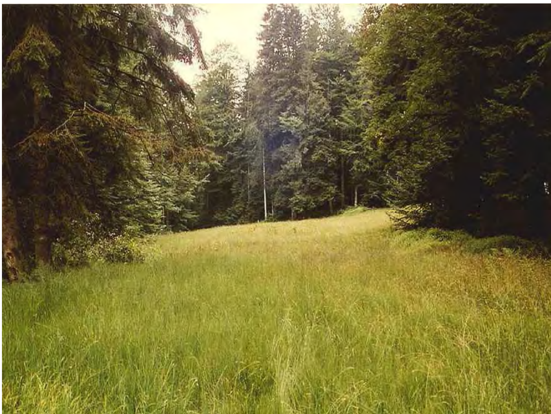
Abbildung 2: Übergang zwischen Pfeifengraswiese und Braunseggenmoor im Wald westlich des Rotenberg-Gipfels.

Braunseggenmoor und Pfeifengraswiese in einer lang gezogenen Mulde und an einer Gratverebnung im Wald direkt westlich des Rotenberg-Gipfel. Geologisch handelt es sich um einen Torfkörper über Molasse. Die Vegetation wird von einem Braunseggenmoor ( Caricetum fuscae molinietosum ) mit Vorkommen vereinzelter Hochmoorarten dominiert. In den weniger feuchten Bereichen ist eine Pfeifengraswiese ( Molinietum caeruleae ) ausgebildet. Besonders bemerkenswert ist das Vorkommen des Hundstraußgrases ( Agrostis canina ).