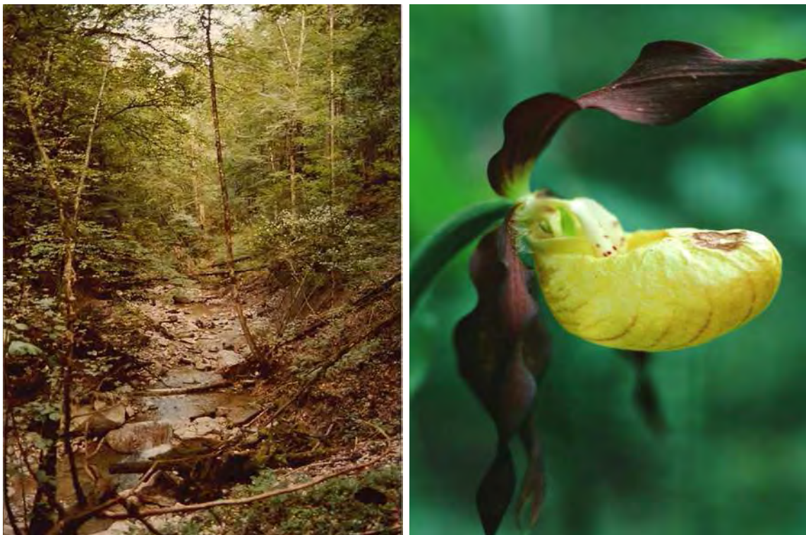
Abbildung 6: Der Bommernbach; Blick bachaufwärts mit totholzreichen Schluchtwäldern; rechts der gefährdete Frauenschuh ( Cypripedium calceolus ), der in den steilen Wäldern des Bommerngrabens Vorkommen besitzt.

Der Bommerngraben zeichnet sich durch seine sehr naturnahen Schluchtwälder sowie den natürlichen Bachverlauf aus. Die Biotopfläche umfasst die nordexponierten steilen Grabeneinhänge von der Mündung in die Bregenzerachschlucht bis zur Straßenbrücke Langenegg-Lingenau. Der Bommernbach gräbt sein steiles Bett größtenteils durch Molasse, streckenweise schneidet er auch Mergel an. Die Einhänge zum Bach hin sind mit naturnahen Schluchtwäldern bestockt. Am Unterhang wächst ein gut ausgebildeter Bacheschenwald ( Carici remotae-Fraxinetum ), hangaufwärts schließen ein Ahorn-Eschenwald ( Aceri-Fraxinetum ) und kleinfächig auch ein Geißbart-Ahornwald ( Arunco-Aceretum ) an, am Oberhang gehen die Schluchtwälder in einen Buchen-Tannenwald ( Abieti-Fagetum ) über. Bemerkenswert sind ausgeprägte Tuffquellen an den Einhängen.