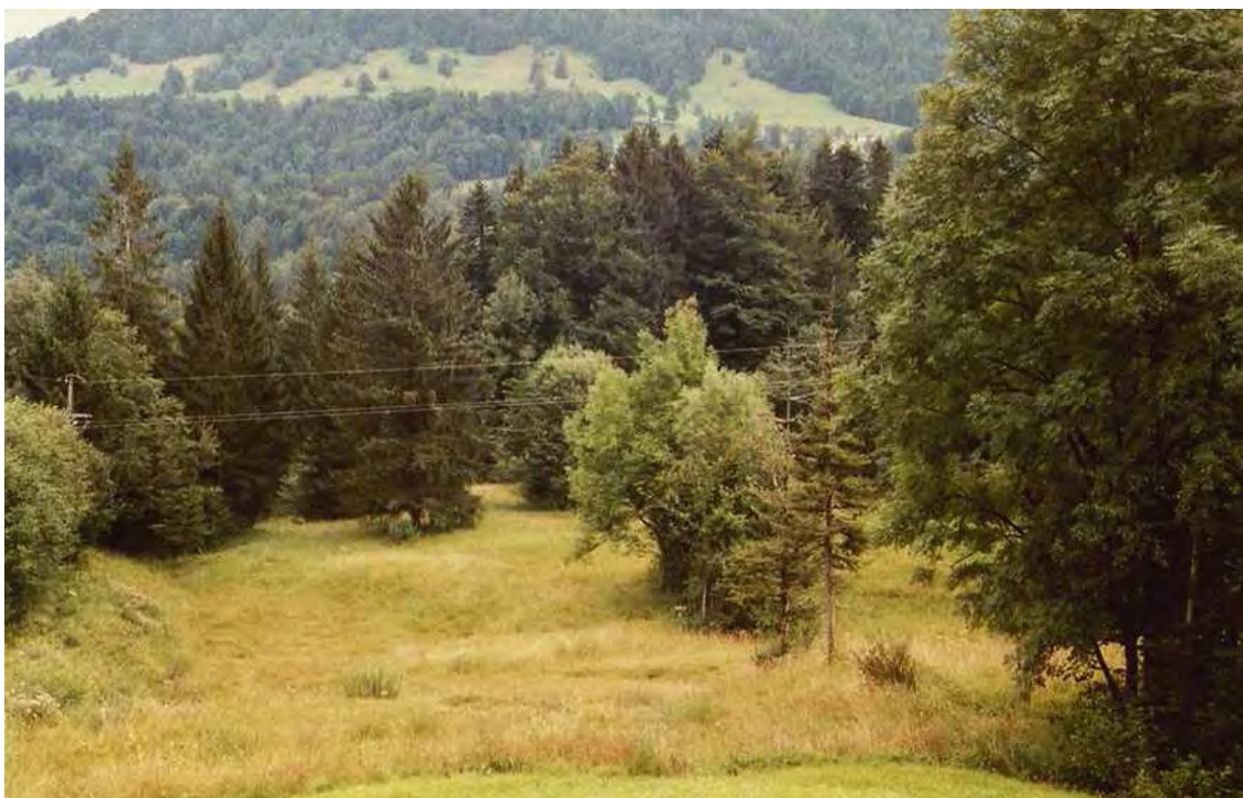
Abbildung 8 Schön ausgebildete Davallseggenrieder im Bereich des Nußbaumtobel.

Die noch einer Streunutzung unterliegenden Flachmoorparzellen sind gut erhalten und weisen nur in den Randbereichen Verbrachungen auf.