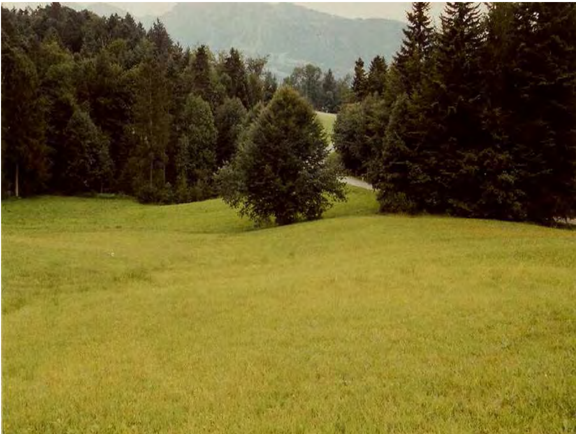
Abbildung 10: Blick auf das Hangflachmoor südlich Kränzen, Richtung Südosten.

Kleiner, leicht düngbeeinflusster Flachmoorrest mit charakteristischer Artenkombination an der Straße von Lingenau nach Müselbach gleich westlich des Grabens zwischen Kränzen und Lässern. Das kleine Moor liegt auf glazialen Schottern über Pseudogley. Es handelt sich um ein kleines Davallseggenried ( Caricetum davallianae ) in sanfter Hanglage. An den trockeneren Stellen zeigt es Anklänge an Pfeifengraswiesen ( Molinietum caeruleae ) und in den Randbereichen geht es in Kohldistelwiesen über.