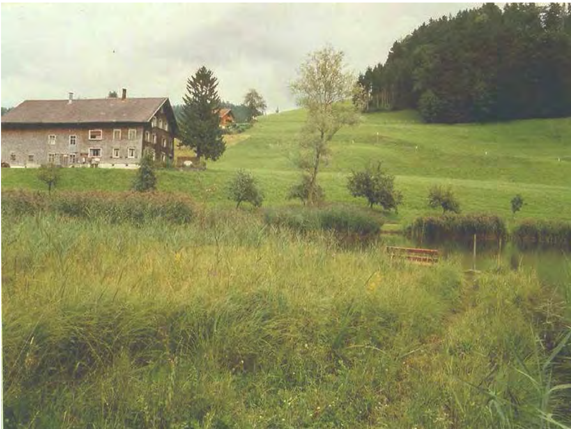
Abbildung 7: Blick auf den Dörnle-See mit seinem aufgelockerten Saum aus Schilf und Großseggen - von Südwesten.

Der Dörnle-See liegt westlich der Straße nach Langenegg am Zufahrtsweg zur Ortschaft Fehren. Undurchlässige, feinschluffige postglaziale Sedimente bilden den Untergrund. An den eigentlichen Dörnle-See mit seinem Schilfröhricht (Phragmitetum), Rohrkolbenröhricht (Typhetum) und Steifseggensaum (Caricetum elatae) sowie etwas Schwimmendem Laichkraut (Potamogeton natans- Gesellschaft) schließt ein Braunseggenmoor (Caricetum fuscae) und ein weiterer kleiner bereits gänzlich verlandeter Teich an. Randlich des Braunseggenmoores sind Übergänge zu Pfeifengraswiesen (Molinietum caeruleae) festzustellen. Die Population des vom Aussterben bedrohten Sumpflappenfarnes (Thelypteris palustris) ist höchst gefährdet und besteht nur aus wenigen Exemplaren. Ebensolches ist für die Population des Schwimmenden Laichkrauts, festzustellen, das nur noch in einem kleinen Graben angetroffen werden konnte, aber kaum mehr im See selbst.