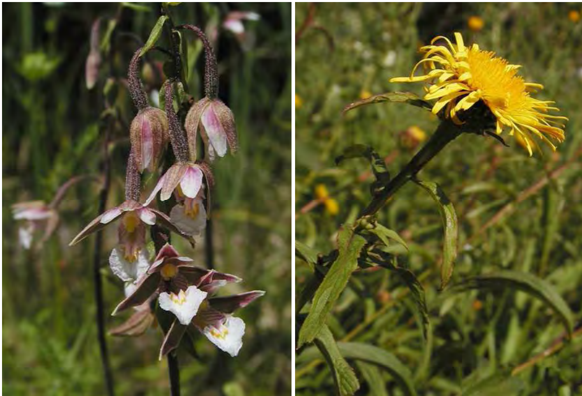
Abbildung 9: Die beiden in der Biotopfläche vorkommenden Arten Sumpf-Stendelwurz ( Epipactis palustris ) in den Davallseggenmooren und der Weidenblättrige Alant ( Inula salicina ) in den verbrachenden Randbereichen.

Flachmoorreste und Molassehöcker mit Arnika-reichem Magerrasen auf einer kleinen Terrasse im Wald südöstlich unter Stocken. Bei den Flachmoorresten handelt es sich um Davallseggenrieder ( Caricetum davallianae ) und Pfeifengraswiesen ( Molinietum caeruleae ). Weiters sind nährstoffreiche Nasswiesen ( Calthion ) sowie bodensaure Magerrasen mit schönen Beständen von Arnika ( Arnica montana ) zu finden. Im Süden der Fläche besteht lokal eine Verbuschungstendenz durch Nutzungsaufgabe.