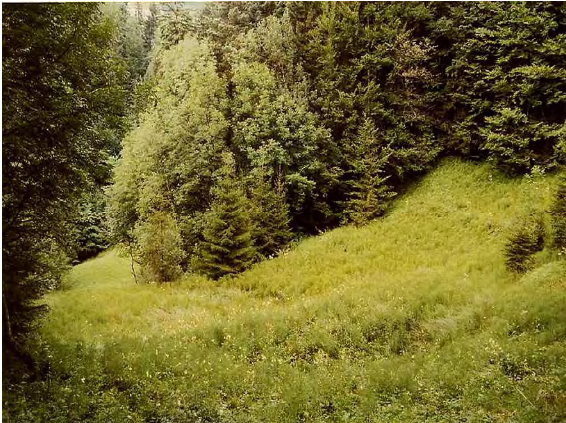
Abbildung 5: Blick auf die verbrachenden Hangflachmoore nördlich Fehren.

Davallseggen-Hangflachmoor mit typischer Artengarnitur am Abhang zum Bommernbach. Die Fläche liegt in einem offenen Bereich nördlich der Ortschaft Fehren am Nordhang zum Bommernbach, durch die der Wanderweg nach Langenegg führte. Das Hangmoor liegt auf einem vernässten Pseudogley über Molasse mit Hangwasseraustritten. Die Fläche ist durch zwei kleine Terrassenstufen gegliedert. Die Streunutzung ist seit längerem aufgegeben und bis auf eine kleine, gemähte Wildäsungsfläche ist das Hangflachmoor ungenutzt. Die Verbrachung zeigt sich durch Aufkommen von jungen Eschen, sowie die Dominanz von Schachtelhalm ( Equisetum telmateia ) an. Das Pfeifengras bildet, aufgrund des fehlenden Schnitts, deutliche Bulke. Es dominieren in der Fläche verbrachte Davallseggenrieder ( Caricetum davallianae ), an quelligen Stellen auch Schnabelseggenbestände ( Caricetum rostratae ). Vor allem am Waldrand und in Hangverebnungen leitet die Flachmoorvegetation aber auch zu nährstoffreichen Nasswiesen ( Calthion ) über. Von den Waldrändern ist auch eine langsame Verwaldung zu beobachten. Um die Biotopfläche und die sie aufbauenden Arten vor dem Verschwinden zu bewahren, sollten die Bestände wieder genutzt werden.