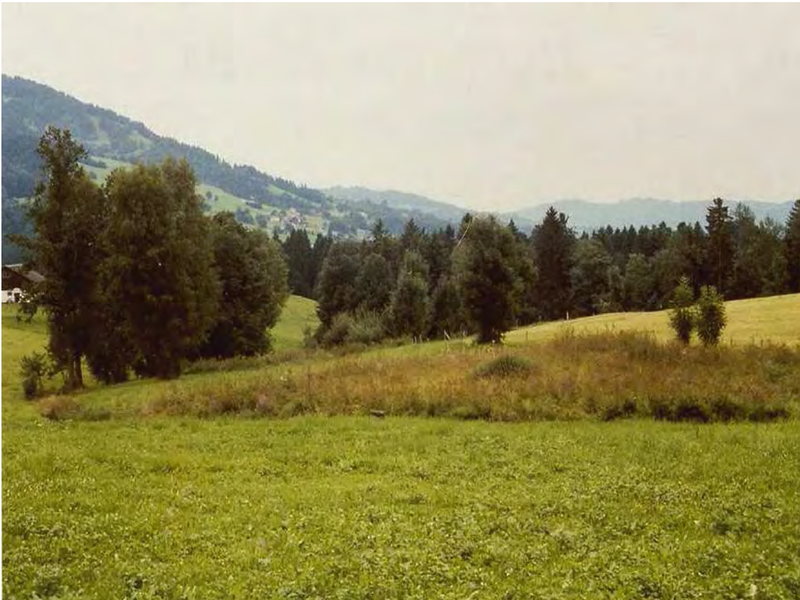
Abbildung 11: Die von Intensivgrünland umgebenen Restflächen der Flachmoore bei Kleinat.

Die Flachmoorreste sind aufgrund ihrer Lage in umgebenden Intensivgrünland nährstoffangereichert, sodass kaum mehr Arten der Davallseggenriede und Pfeifengraswiesen anzutreffen sind, sondern vor allem Arten der nährstoffreichen Nasswiesen.