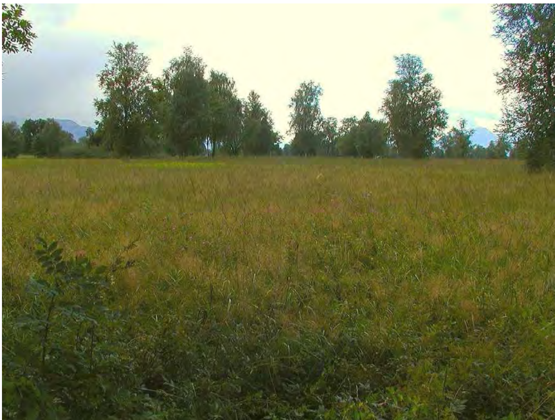
Abbildung 6: gut erhaltene, bodensaure Pfeifengraswiesen im Äußeren Beilstiel.

Relativ großflächige Pfeifengraswiese mit einem schönen Riedgraben und einem gut erhaltenen Baumbestand. Die Streuwiesen der Biotopnummer liegen nordöstlich von 22402 und sind in den zentralen Teilen relativ gut erhalten, randlich allerdings durch Nährstoffeintrag in Mitleidenschaft gezogen. In der Mitte der Fläche fließt in Ost-West- Richtung ein größerer Riedgraben mit schöner Unterwasservegetation.