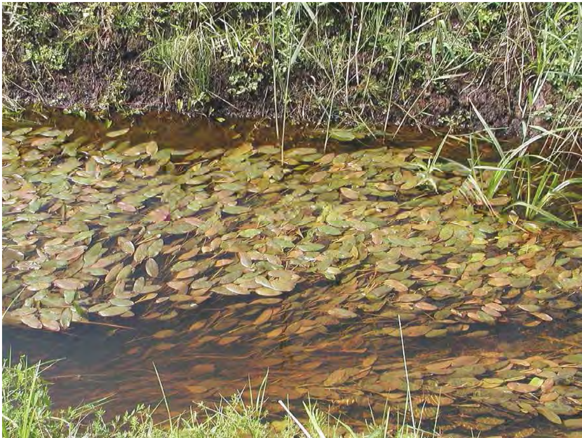
Abbildung 4: Der Beilsteingraben mit einer dichten Unterwasservegetation, im Bild ein dichter Bestand des Alpen-Laichkraut ( Potamogeton alpinus ).

Relativ artenreiche Riedflächen in unterschiedlichen Erhaltungszuständen im Ostteil des Lauteracher Rieds mit schönem Baumbestand. Die Flächen der Nummer 22413 schließen nördlich an die Flächen der Nummer 22407 und westlich an diejenigen von 22414 an. Es handelt sich um hochwüchsige, basenarme Pfeifengraswiesen, Schilfröhrichte und Hochstaudenfluren, die trotz mäßigem Erhaltungszustand relativ artenreich sind. Eine bemerkenswerte Unterwasserflora weist der Beilsteingraben auf.