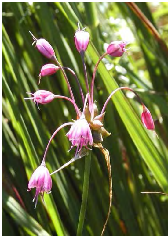
Abbildung 15: Die stark gefährdete Sibirische Schwertlilie ( Iris sibirica ), links und der gefährdete Kiel-Lauch ( Allium carinatum ) rechts. Zwei Arten die zwar im Lauteracher Ried Standorte besitzen, allerdings nicht so häufig vorkommen wie in den basenreicheren Riedern der Umgebung.