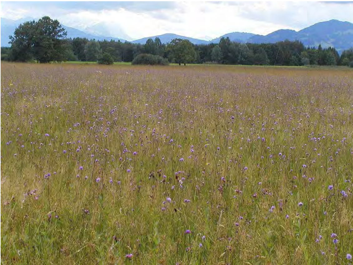
Abbildung 9: Sehr schöne und gut erhaltene bodensaure Pfeifengraswiesen mit reichen Beständen des hier blau blühenden Teufelsabbiss ( Succisa pratensis ).

Ausgedehnte, relativ trockene und größtenteils schön entwickelte basenarme Streuwiesen mit eingestreuten Schilfröhrichtern und Hochstaudenfluren. Bei dieser Biotopfläche handelt es sich um einen weiteren großflächigen Streuwiesenkomplex im südöstlichen Teil des Lauteracher Rieds nach Südosten an die Biotopnummer 22407 anschließend und dieser recht ähnlich. Die Bestände sind relativ trocken und es fällt der hohe Anteil von Straußgras in den Flächen auf. Größere Bereiche im Süden zur Dornbirner Ache hin werden von Schilfröhrichtern mit wechselnden Anteilen von Hochstauden eingenommen. Die am besten erhaltenen und sehr nährstoffarmen Bestände liegen im Nordostteil der Biotopfläche.