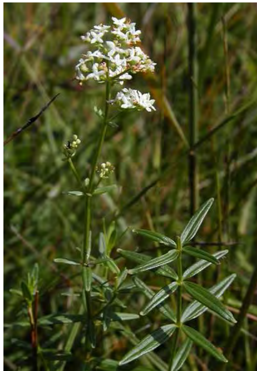
Abbildung 12: Links die Charakterart der basenarmen Streuwiesen, die Spitzblütige Simse ( Juncus acutiflorus ), rechts eine ebenfalls typische Art der Streuwiesen, die aber auch in basenreicheren Varianten vorkommt, das Nordische Labkraut ( Galium boreale ).