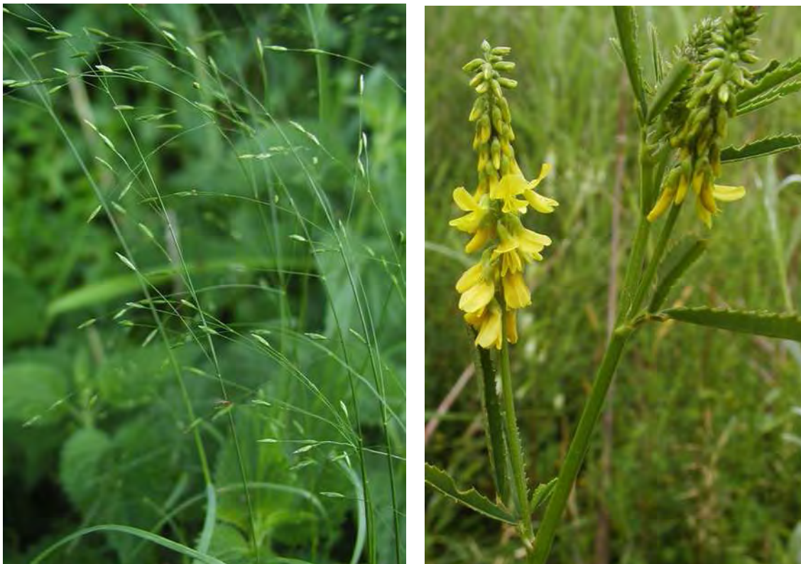
Abbildung 8: Links der gefährdete Hohe Steinklee ( Melilotus altissimus ), rechts das sehr zarte und unauffällige, stark gefährdete Sumpf-Gras ( Poa palustris ).

Hochstaudenfluren, Rasige Großseggenrieder und nasse Fettwiesen im nördlichen Teil des Lauteracher Rieds. Die Bestände sind nicht mehr als Pfeifengraswiesen anzusprechen. Bestände mit Sumpfschilf sind im Gebiet aber durchaus selten.