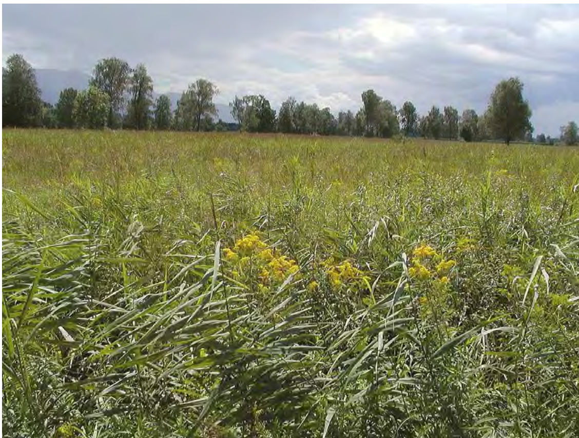
Abbildung 7: Eher artenarme, bodensaure Pfeifengraswiese mit reichem Vorkommen von Großem Wiesenknopf ( Sanguisorba officinalis ), und relativ starker Beteiligung von Schilf.

Bodensaure Pfeifengraswiesen in zumeist gutem Erhaltungszustand mit sehr schönem Altbaumbestand. Der relativ große Streuwiesenbestand liegt südöstlich der Biotopnummer 22403. Die einzelnen Abschnitte werden von West-Ost verlaufenden Riedwegen durchschnitten. Es handelt sich bei den einzelnen Flächen um niedrige bis mittelhohe Pfeifengraswiesen ( Molinietum caeruleae ) mit viel Straußgras ( Agrostis tenuis ) in den trockeneren Abschnitten, sowie einem geringen Anteil verschilfender und verbrachender Bereiche.