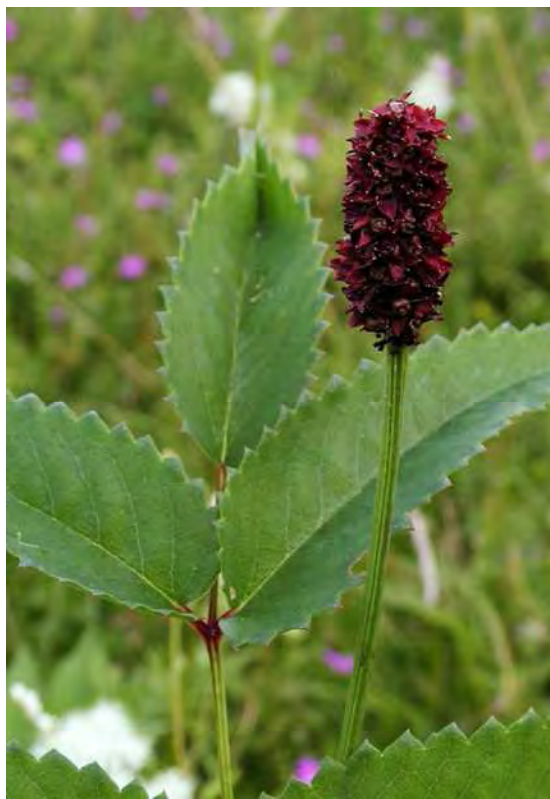
Abbildung 11: Zwei Arten hochwüchsiger, verbrachender Riedwiesen. Links der gefährdete Sumpf-Ziest ( Stachys palustris ), rechts der Große Wiesenknopf ( Sanguisorba officinalis ).