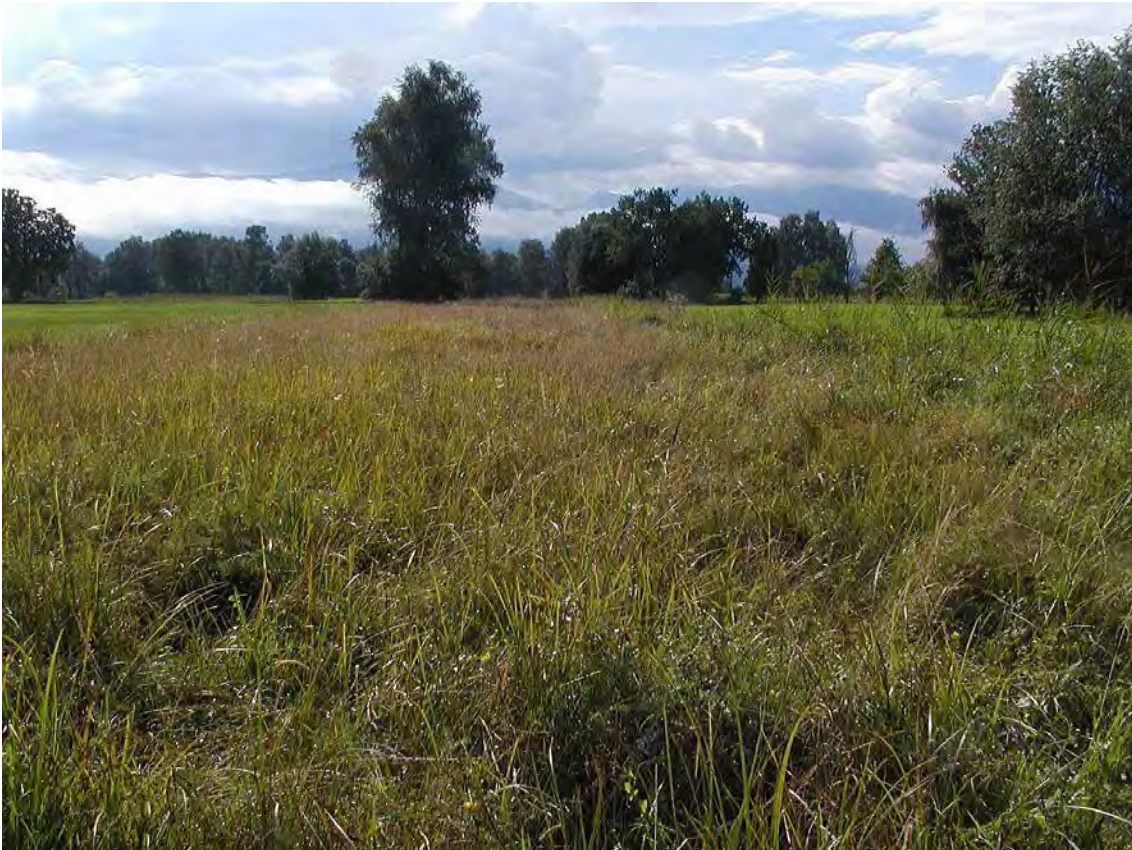
Abbildung 14: Rasiges Großseggenried mit Hochstauden im Bereich von Winterweg und Beilsteingraben mit landschaftlich sehr reizvollen Baumbestand.

Landschaftlich sehr reizvolle, baumbestandene Feuchtwiesenkomplexe mit basenarmen Streuwiesen, Schilfröhrichten und Hochstaudenfluren, sowie einem sehr krautreichen Riedbach. Die Flächen des Biotopes 22414 liegen im zentralen südlichen Teil des Lauteracher Rieds und gehen in die Flächen von 22413 und 22415 über. Die Flächen liegen zu ihrem Hauptteil nordwestlich der L41. Es handelt sich zumeist um nährstoffreiche Röhrichte, Großseggenrasen und basenarme Streuwiesen, sowie deren Verbrachungsstadien. Als bedeutendster Aspekt der Fläche ist die reiche Strukturierung durch zahlreiche Bäume zu betrachten.