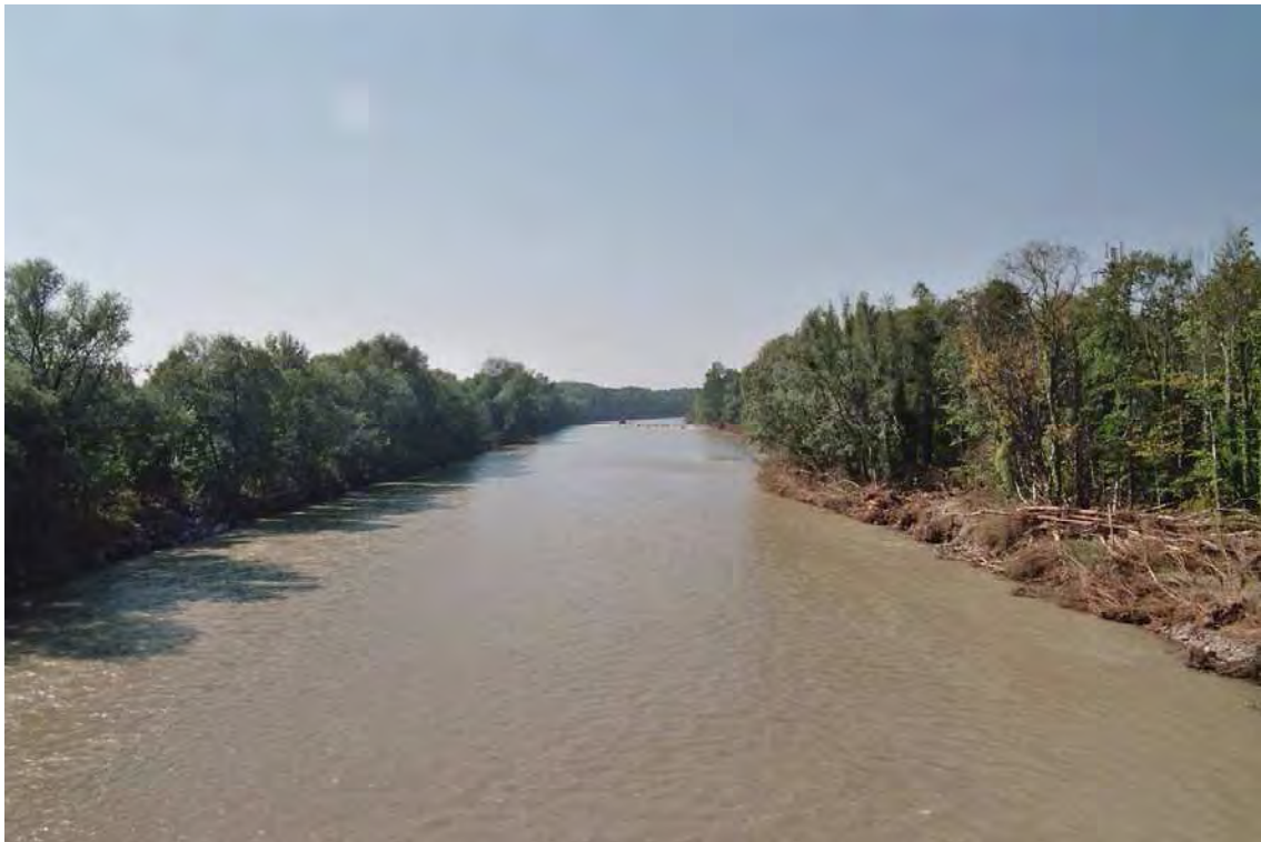
Abbildung 16: Die Bregenzerache mit ihren begleitenden Galeriewäldern. Am linken Ufer der Lauteracher Anteil, das rechte, vom Hochwasser stärker betroffene Ufer gehört zu Bregenz.

Es handelt sich bei dieser Biotopfläche um Uferbegleitgehölze mit vorherrschenden Elementen der Weichen Au. Die Fläche wurde vor allem als Vernetzungsbiotop zu den anderen Biotopen der Bregenzerache ausgewiesen und weist für sich genommen keine besondere naturschutzfachliche Wertigkeit auf. Der Damm tritt hier relativ nah ans Ufer und auch die Uferbiotope wie Weidengebüsche ( Salicetum eleagno-daphnoidis ) und Kiesbettfluren sind nur in sehr geringem Ausmaß im Westteil entwickelt. Die Fläche steht in engem Zusammenhang mit den anderen Biotopen der Bregenzerache (22001, 20701, 21502, 24013) und verbindet diese