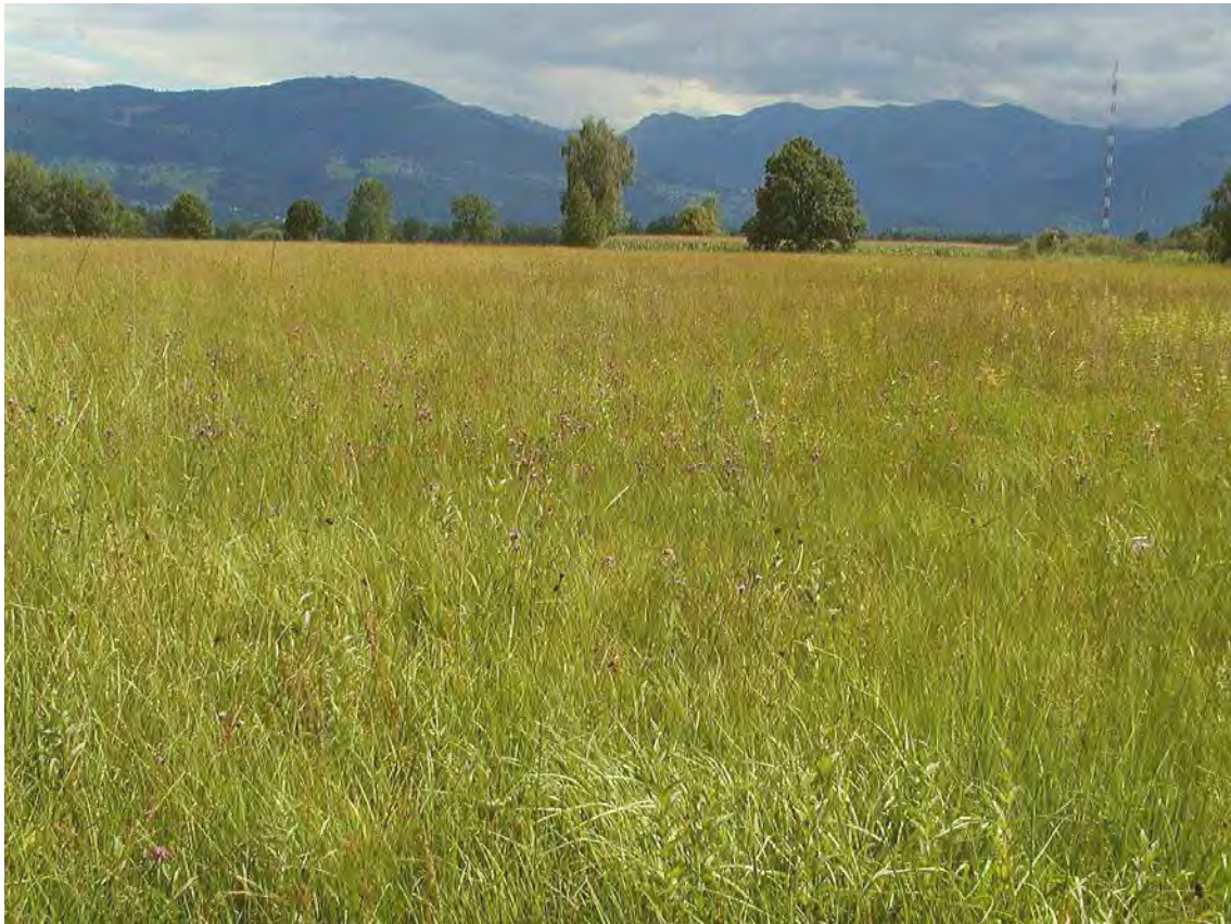
Abbildung 3: niederwüchsige, bodensaure Pfeifengraswiese mit zahlreichen Säurezeigern bis hin zu Torfmoosen.

Sehr schöne und großflächig gut erhaltene bodensaure Streuwiesen bis hin zu Ausbildungen mit Torfmoosen im Südwestteil des Lauteracher Riedes. Die hier zusammengefassten Flächen schließen südöstlich an die Bestände der Nummer 22405 an und umfassen einen großflächigen bodensauren Streuwiesenkomplex, in den einige Röhrichte und kleinere Birkenbestände eingestreut sind. Die Fläche ist durch zahlreiche, einzeln stehende Bäume reich gegliedert und von hoher ökologischer Wertigkeit. Die teils binsenreichen Bestände sind im Südosten leicht stufenförmig abgesenkt, was auf eine ehemalige Torfgewinnung schließen lässt. Besonders seltene Arten konnten nicht aufgefunden werden, die Bestände sind im Vergleich zu den basenreichen Riedern deutlich artenärmer.