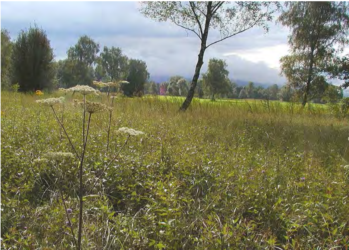
Abbildung 2: Der parkartige Charakter des Lauteracher Riedes ist durch seinen hohen Baumbestand bedingt. Hier im zentralen Bereich beim Winterweg. Blick Richtung Wolfurter Ried.

Entsprechend der Dreigliederung des Riedes, die auf die ursprüngliche Naturausstattung zurückgeht (Auwald im Norden, Moor in der Mitte, moorige Aue im Süden) verteilt sich auch der Baumbestand nicht gleichmäßig auf das Ried. Die Birken sind für das ehemalige Torfabbaugelände besonders typisch. Erstens ist es jene Baumart, die den sauren Torf noch am ehesten erträgt (vermutlich Mischformen zwischen Betula pubescens und Betula pendula ) und Birkenbrüche dürften auch in der Naturlandschaft des Moores nicht gefehlt haben, zweitens dürfte ein Großteil der Birken spontan aufgewachsen sein. Die eindrucksvollsten Baumgestalten des Riedes sind aber zweifellos die mächtigen Eichen ( Quercus robur ), die besonders den nördlichen Teil prägen. Durch ihr hohes Alter und die nur sporadische spontane Verjüngung bleibt ihre Zahl über lange Zeiträume konstanter als jene der Birken. Auffällig ist jedenfalls, dass mittlere Altersklassen fehlen.