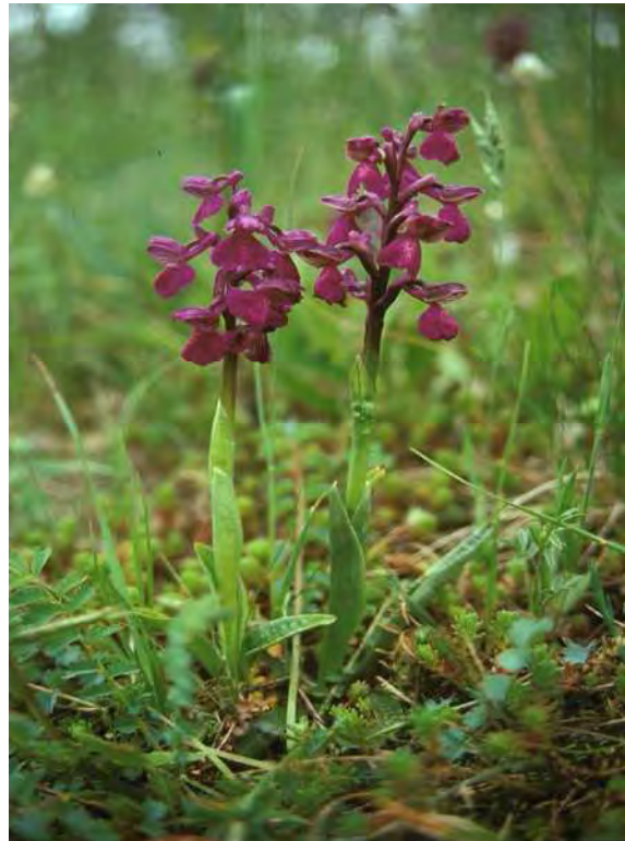
Abbildung 5: Die beiden stark gefährdeten in der Fläche vorkommenden Orchideen Helm-Knabenkraut ( Orchis militaris ), links und Kleines Knabenkraut ( Anacamptis morio ), rechts.