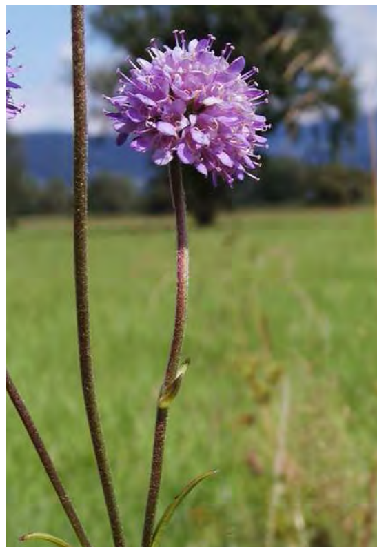
Abbildung 10: Obwohl die beiden Parzellen stark verbracht sind, treten dennoch typische Arten der Riedwiesen auf, die im gesamten Lauteracher Ried nicht selten sind. Links der Weidenblättrige Alant ( Inula salicina ), rechts der Teufelsabbiss ( Succisa pratensis ).