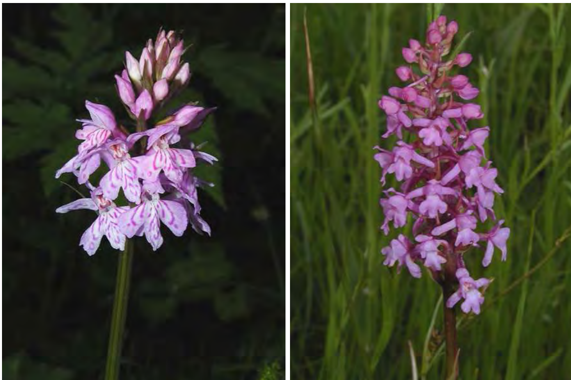
Abbildung 13: Die beiden in der Biotopfläche vorkommenden und im Lauteracher Ried weiter verbreiteten Orchideenarten Geflecktes Fingerknabenkraut ( Dactylorhiza maculata ), links, und die Händelwurz ( Gymnadenia conopsea ), rechts.

Hochstaudenfluren und Schilfröhrichte in durch Bäumen reich strukturierter "Parklandschaft" am Ostrand des Lauteracher Rieds ohne besonders seltene Arten. Die Flächen sind reich strukturiert und ornithologisch sicherlich bedeutend. Die Flächen schließen an diejenigen mit den Biotopnummern 22412 und 22413 an und bilden ein schönes Biotopensemble.