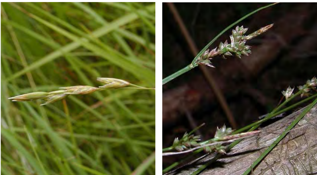
Abbildung 14: Die beiden seltenen Grasartigen Dreizahn-Gras ( Danthonia decumbens ) links und die Pillen-Segge ( Carex pilulifera )

Von Solitärbirken oder von Birkenhainen bestockte, als Magerweiden bzw. Magerwiesen genutzte Bürstlingsrasen waren bis vor wenigen Jahrzehnten am Pfänder und Hirschberg weit verbreitet. Durch Intensivierung der landwirtschaftlichen Nutzung zum einen, oder Aufgabe der Bewirtschaftung und nachfolgende spontane Verwaldung und Aufforstung (Fichte) zum anderen, sind sie bis auf wenige Restflächen praktisch vollkommen verschwunden, und die Reste demnach grundsätzlich von hoher Schutzwürdigkeit.