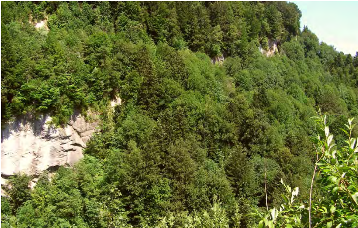
Abbildung 16: Molassefelsen und Steilhangwälder des Wirtatobel.

Die Schluchthänge sind mit Ausnahme der hohen Felsstufen im Bereich des Straßentunnels bewaldet, wobei entsprechend der reichen standörtlichen Differenzierung ein eng verzahntes Mosaik verschiedenster Waldgesellschaften zu finden ist. Zu nennen sind etwa eibenreiche Tannen-Buchenwälder ( Abieti-Fagetum taxetosum ) an steilen Hangrippen, die kleinflächig auch Versauerungserscheinungen zeigen können, Eiben-Buchenwälder ( Taxo-Fagetum ) an Rutschhängen, Ahorn-Eschen- und typische Winkelseggen-Eschenwälder ( Aceri-Fraxinetum , Carici remotae-Fraxinetum ) in Mulden und an den Unterhängen. An einigen Felsen nahe der Mündung in die Bregenzerach sind Bestände der seltenen Kiessteinbrechflur ( Aster bellidiastro-Saxifragetum mutatae ) zu finden.