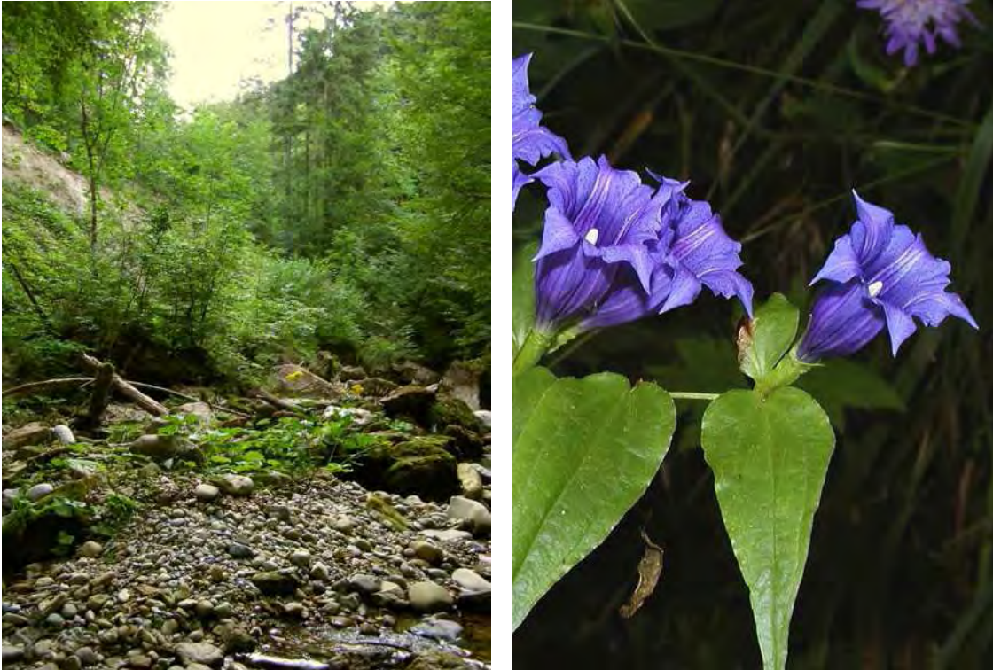
Abbildung 12: Bachbett des Kesselbaches bachaufwärts nördlich der Schottergrube. Rechts der in den Wäldern vorkommende gefährdete Schwalbenwurz-Enzian ( Gentiana asclepiadea ).