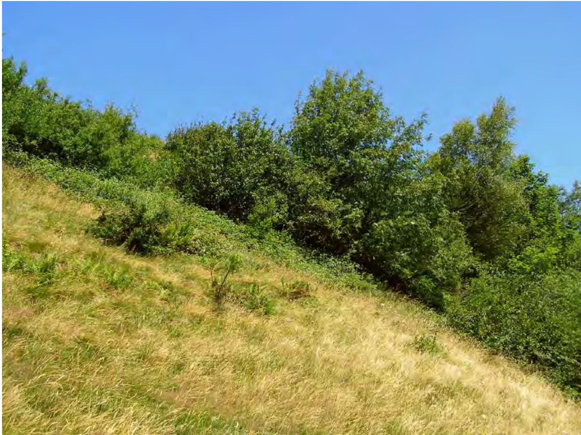
Abbildung 15: Grünerlen-Schluchtweidengebüsch unterhalb des Gipfels des Hirschberges