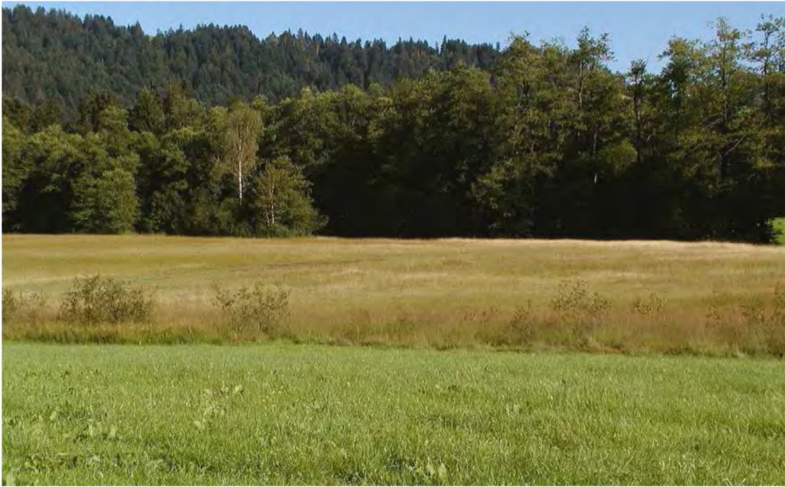
Abbildung 2: Blick auf das Natura-2000 Gebiet Witmoos von Norden.