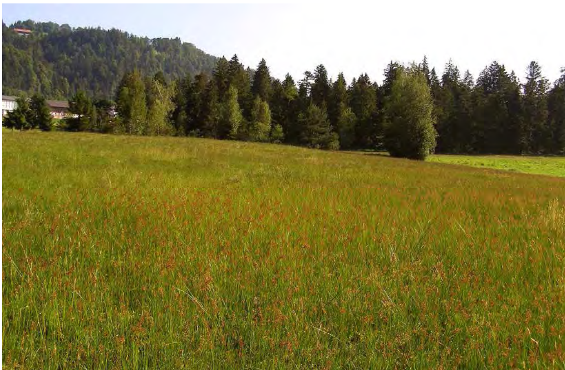
Abbildung 8: Blick von Süden auf die ausgedehnten Bestände mit Spitzblütiger Binse ( Juncus acutiflorus ) im Vordergrund.

Bei den umliegenden Moorwiesen handelt es sich um als Streuwiesen genutzte Hochmoore. Sie beherbergen die vollständige Garnitur der typischen Hochmoorarten und zeichnen sich überdies durch ein auffallend reiches Auftreten des stark gefährdeten Sumpf-Bärlapps ( Lycopodiella inundata ) aus. Südlich des Waldes, aber auch in der nördlichsten Ecke des Moors sind alte regenerierende Torfstiche zu finden. Letzterer zeigt eine starke Hochstaudenentwicklung und ist von einem schönen Moorbirkenbestand umgrenzt. Entlang alter Drainagegräben wachsen diverse Weiden, von denen die Kriechweide ( Salix repens ) besonders bemerkenswert ist. Westlich des Feldwegs ist am Waldrand eine weitere kleine Moorfläche erhalten geblieben. Sie entspricht im Wesentlichen einem Braunseggenmoor ( Caricetum goodenowii ) und zeichnet sich durch ein sehr reiches Vorkommen des in Vorarlberg vom Aussterben bedrohten Hundstraußgras ( Agrostis canina ) aus.