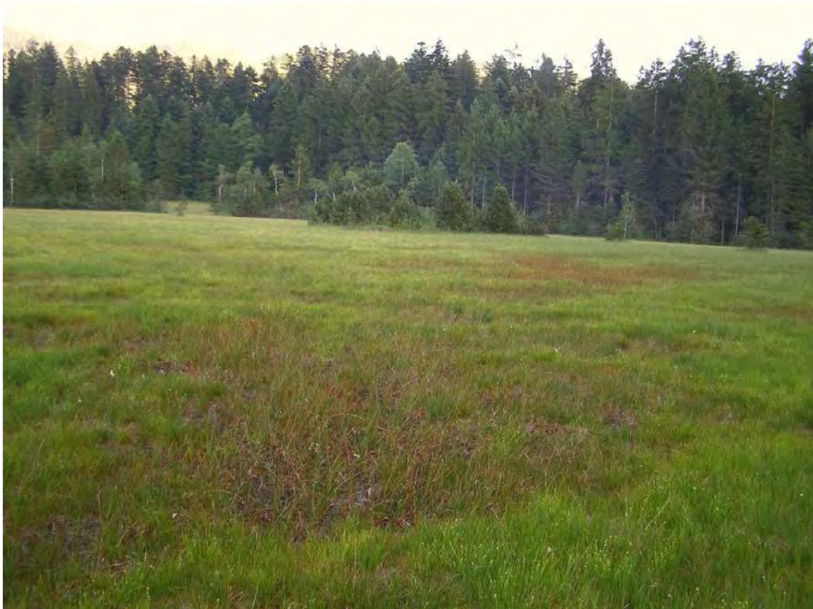
Abbildung 5: Die Schlenken im Vordergrund weisen große Populationen des Langblättrigen Sonnentau ( Drosera anglica ) und des Moorbärlapp ( Lycopodiella inundata ) auf. Im Hintergrund eine Spirkengruppe.