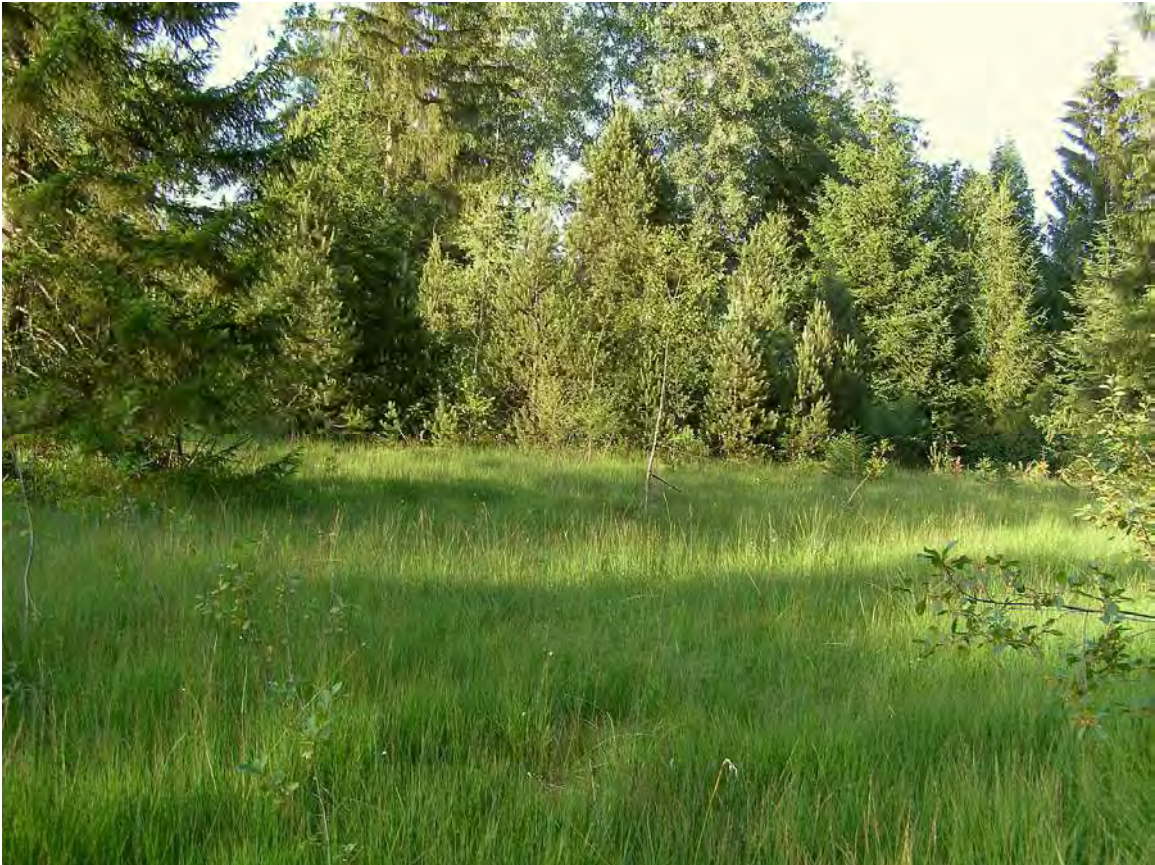
Abbildung 7: Der Moorkomplex unterhalb Fischanger im Ostteil mit Spirken im Hintergrund.