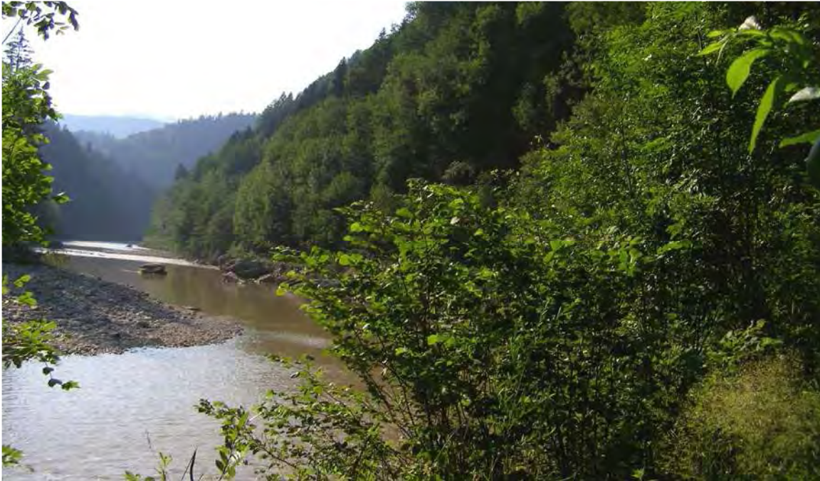
Abbildung 4: Blick auf die Bregenzerach nach Westen unterhalb der Einmündung der Rotach.