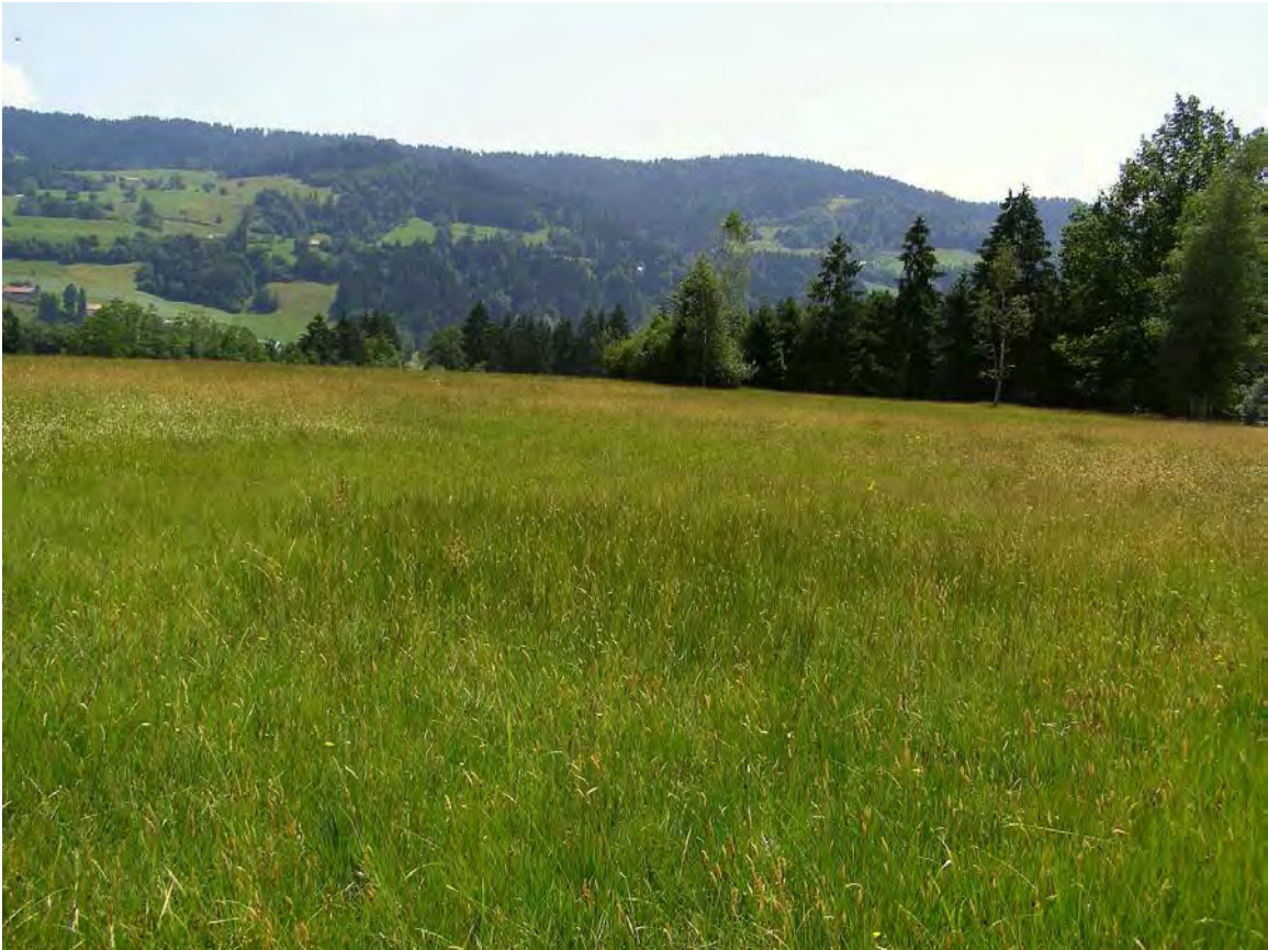
Abbildung 10: Blick über die Wiesen- und Moorkomplexe südlich Sägewerk.