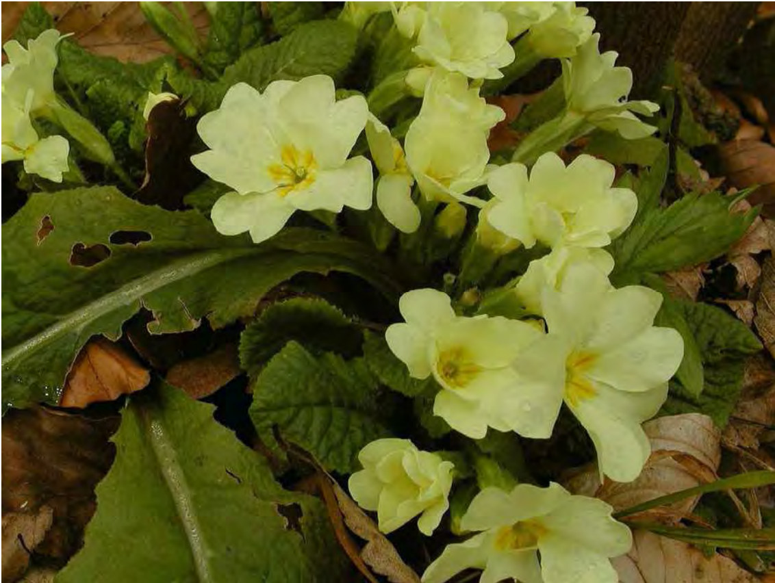
Abbildung 9: Die in Vorarlberg seltene und gefährdete, wärmebedürftige Stengellose Schlüsselblume ( Primula vulgaris ).