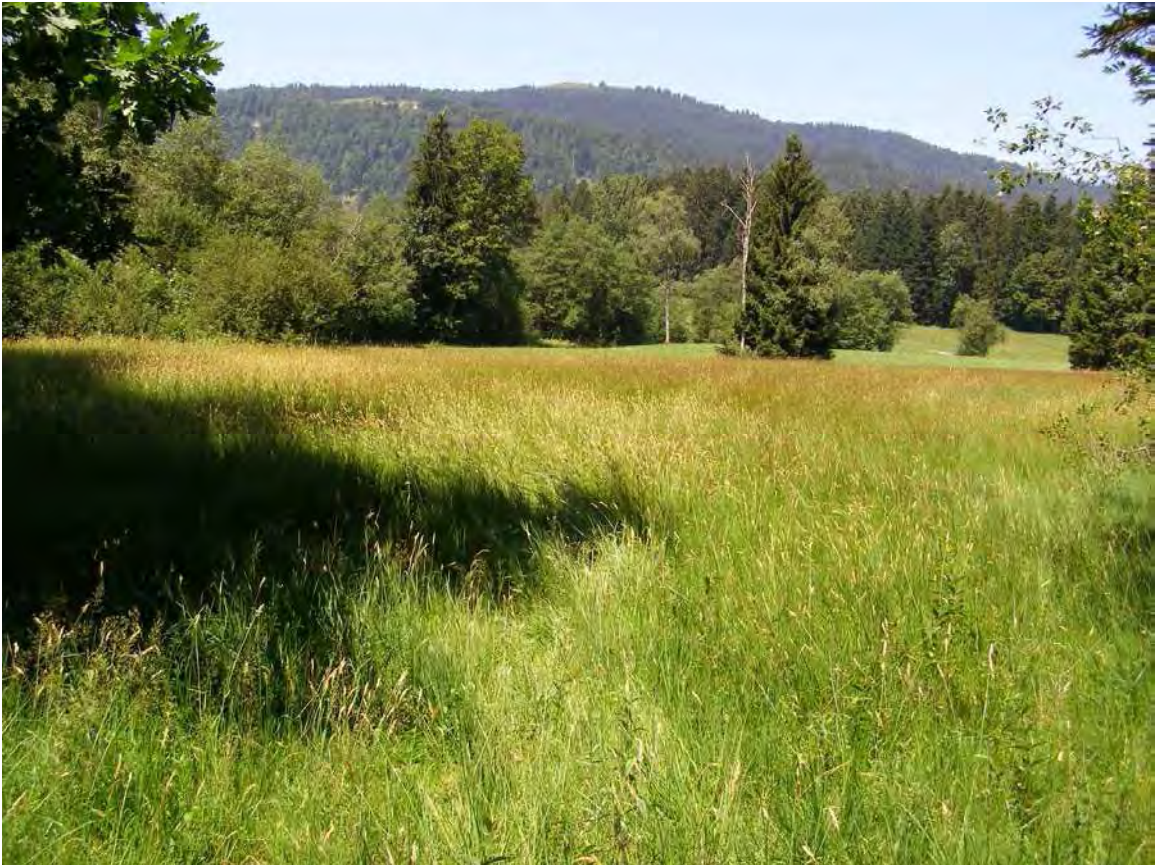
Abbildung 6: Die sauren Pfeifengraswiesen mit Spitzblütiger Simse ( Juncus acutiflorus ) in der Waldbucht beim Hittabühl.