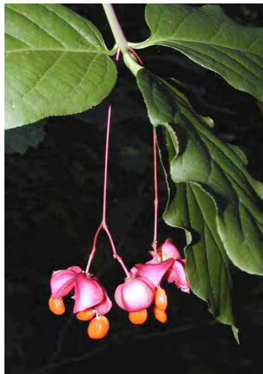
Abbildung 13: Die beiden seltenen Arten Winter-Schachtelhalm ( Equisetum hyemale ) links und Voralpen-Spindelstrauch ( Euonymus latifolia ) mit Früchten rechts.