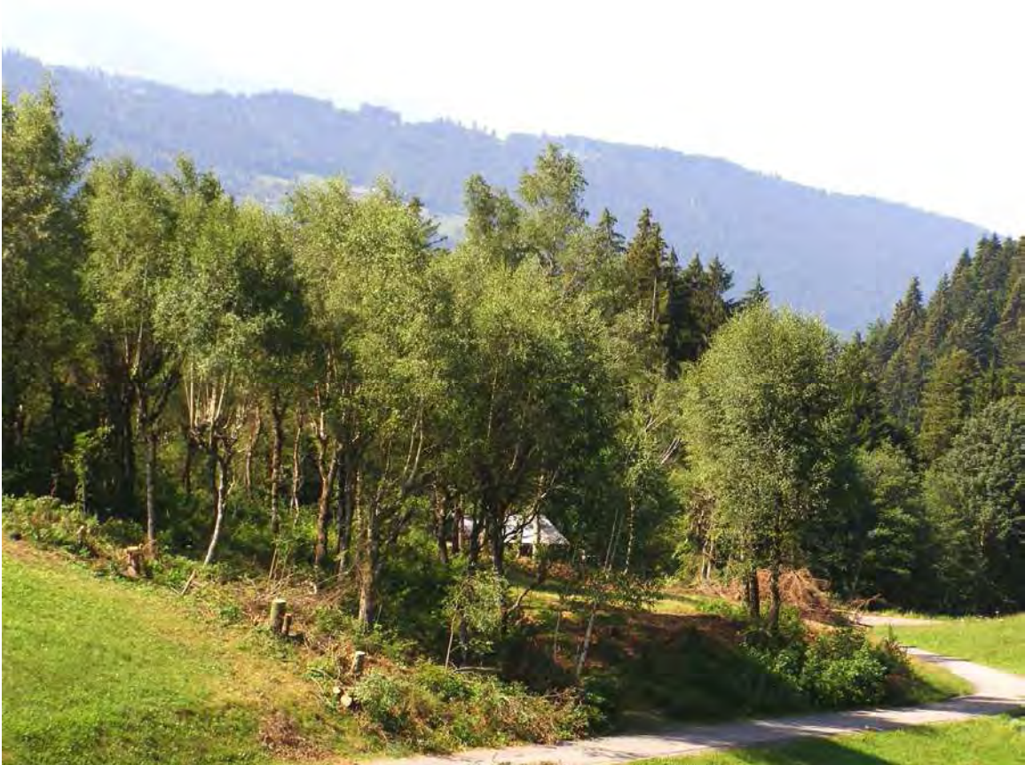
Abbildung 3: Blick auf die Besenbirkenhaine der Teilfläche 1 am Feßlerberg von Nordostens.