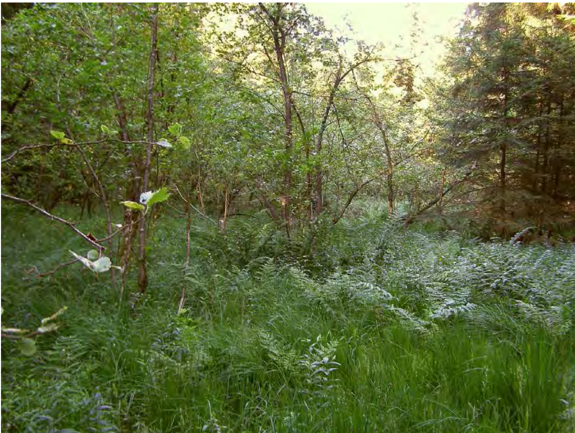
Abbildung 17: Der Erlenbruchwald bei Bollenschwend mit schönen Beständen des Dorn-Wurmfarns ( Dryopteris carthusiana ).

Kleiner, sehr nasser Erlenbestand mit dem Charakter eines Bruchwaldes, mit kräftigen, mehrstämmigen Grauerlen (BHD bis 30 cm). Der Unterwuchs ist nicht ganz typisch ausgebildet, da Hochstauden (z.B. Mädesüß) und Adlerfarn ( Pteridium aquilinum ) vorhanden sind. Dies liegt allerdings daran, dass der Bestand erst im Laufe der letzten Jahrzehnte an Stelle eines als Streuwiese genutzten Waldmoors aufgewachsen ist. Mit dem Karthäuserfarn bzw. Dorn-Wurmfarn ( Dryopteris carthusiana ) ist aber doch ein typischer Bruchwaldbegleiter nachweisbar.