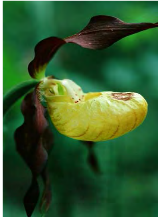
Abbildung 11: Die Rotach vor der Einmündung in die Bregenzerache bachaufwärts, rechts der in den Schluchtwäldern vorkommende Frauenschuh ( Cypripedium calceolus )