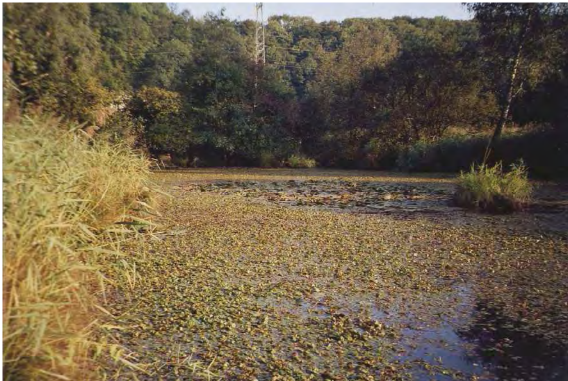
Abbildung 5: Der Glitz-Weiher, ein alter Torfstich in Koblach-Birken.

Besondere Erwähnung verdienen auch die zahlreichen kleineren und größeren, künstlich geschaffenen aber zumeist recht naturnahen Stillgewässer. Das landschaftlich wirksamste unter ihnen ist wohl der Glitz-Weiher, der das größte Laichgewässer für Erdkröten im Ried ist.