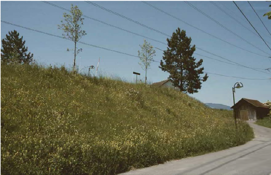
Abbildung 7: Trespenwiesen an der Rheindammböschung beim Zollamt Koblach mit schönen Populationen der stark gefährdeten Orchideen Hummelragwurz ( Ophrys holoserica ) und Bienenragwurz ( Ophrys apifera ).

Das Biotop umfasst einen Großteil des Koblacher Rheindamms. Im Norden setzen sich die Magerrasen in der Gemeinde Mäder fort. Der Koblacher Rheindamm wird sowohl auf der land- als auch der rheinseitigen Böschung von artenreiche Magerwiesen eingenommen. Sie entsprechen über weite Strecken Halbtrockenrasen, die an etwas reicheren Standorten in magere Glatthaferwiesen übergehen. Der Zustand der Magerwiesen ist größtenteils als sehr gut zu bezeichnen. Die Magerwiesen sind Lebensraum einer Reihe seltener und gefährdeter Arten. Bei den Halbtrockenrasen handelt es sich um reliktsche Bestände. Bei einer allfälligen Vernichtung der Vegetation geht die noch bestehende Artenfülle unweigerlich verloren, da eine Neuansiedlung, bzw. Einwanderung der entsprechenden Arten mangels Ressourcen in der Umgebung nicht mehr möglich ist. Demzufolge kommt der Erhaltung der gegenwärtigen Vegetationsverhältnisse eine hohe Priorität zu.