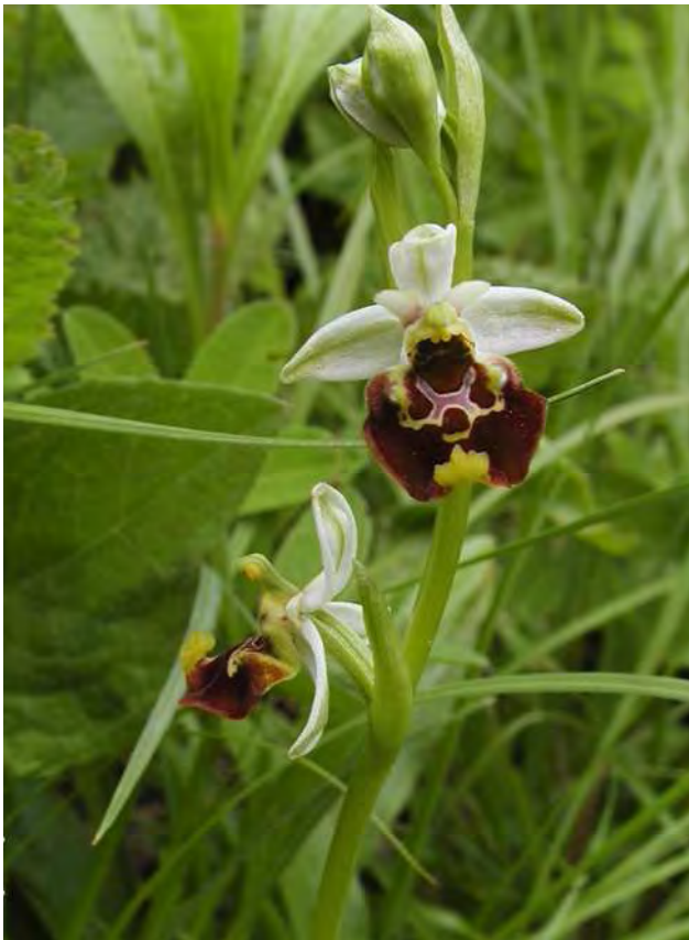
Abbildung 8: Die stark gefährdete Hummelragwurz ( Ophrys holoserica ), eine Orchidee der Magerwiesen des Rheindamms.