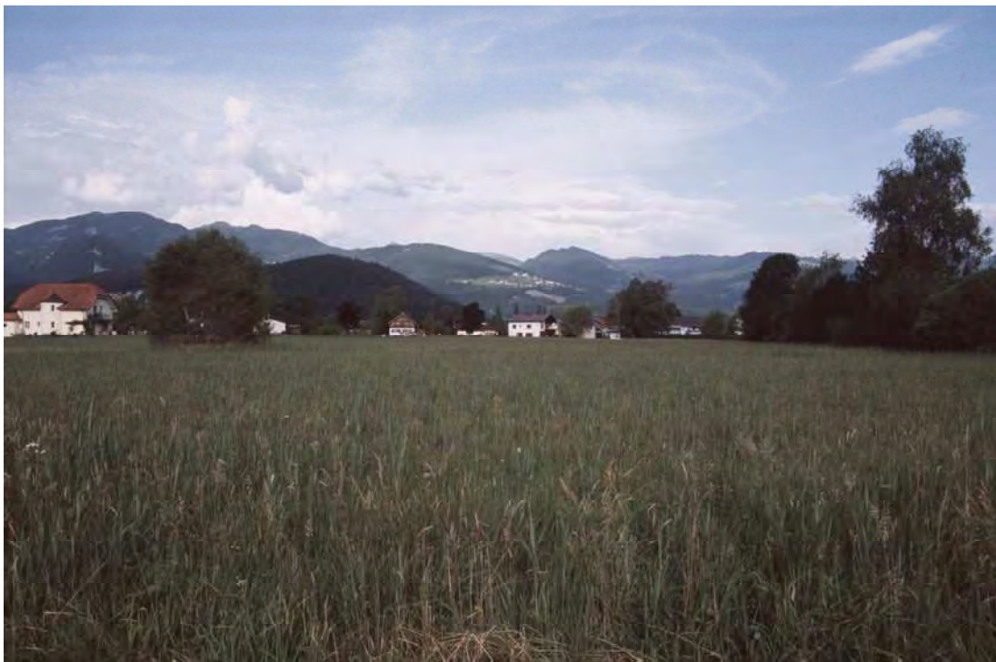
Abbildung 10: In der größten Streuwiesenfläche von Dürne finden sich unter anderem ausgedehnte Bestände von Kopfbinsenriedern ( Schoenetum ferrugineae ), einem stark gefährdeten Vegetationstyp der Flachmoore.

Die nördlich der Frutz gelegenen Streuwiesen bei Koblach-Dürne und Au sind der südlichste Teil des Koblacher Rieds. Im Norden findet das Biotop seine Fortsetzung in den ausgedehnten Streuemähdern von Bromen (Biotop 41003). Ein Teil der Flächen grenzt direkt an die Auwälder der Frutz, die anderen liegen inmitten von intensivlandwirtschaftlich genutzten Flächen und randlichem Siedlungsgebiet. Zentrales Schutzgut sind die teils recht ausgedehnten, ausgesprochen artenreichen Pfeifengraswiesen und ein noch recht großflächig erhaltener Bestand der in Vorarlberg vom Aussterben bedrohten Gesellschaft des Rostroten Kopfrieds. Gegliedert wird das Gebiet durch markante Einzelbäume, Baum- und Strauchgruppen wobei die westlich von Dürne gelegene Baumhecke mit ihren mächtigen Exemplaren der Stieleiche ( Quercus robur ) landschaftlich besonders wirksam ist.