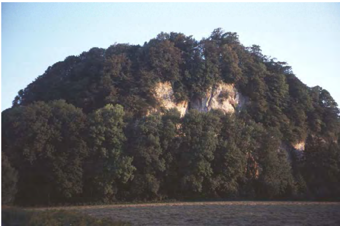
Abbildung 12: An seiner Nordseite fällt der von wärmegetönten Edellaub- und Buchenwäldern eingenommene Schloßhügel (Neuburg) über schöne Felswände zum Talboden hin ab.

Der Schloßhügel mit der Ruine Neuburg liegt inmitten des Koblacher Rieds. Im Osten verläuft direkt angrenzend die Rheintalautobahn A 14. Es handelt sich um einen kleinen, aber landschaftlich sehr wirksamen Inselberg mit naturnahen, gehölzreichen Laubmisch- und Buchenwäldern aber auch fragmentarischen Beständen von wärmeliebenden Traubeneichenwäldern und wärmeliebenden Gebüschern entlang der Felskanten des Neuburg-Horsts. An Schuttstandorten finden sich kleinflächige Bestände des Lerchensporn-Ahornwalds. Als Besonderheit des Schloßhügels ist der Bestand eines "typischen" Hainbuchen-Mischwalds ( Galio sylvatici-Carpinetum ) zu nennen. Diese in Vorarlberg sehr seltene und dementsprechend stark gefährdete Waldgesellschaft hat hier einen ihrer wenigen Standorte und ist daneben nur am Kummern (vgl. Biotop 41006) und am Sattelberg (vgl. Biotop 40901) zu finden. Die Südflanke und der Hangfuß des Schloßhügels werden in Teilen noch von einem sehr reizvollen, reich strukturierten Wiesengelände eingenommen.