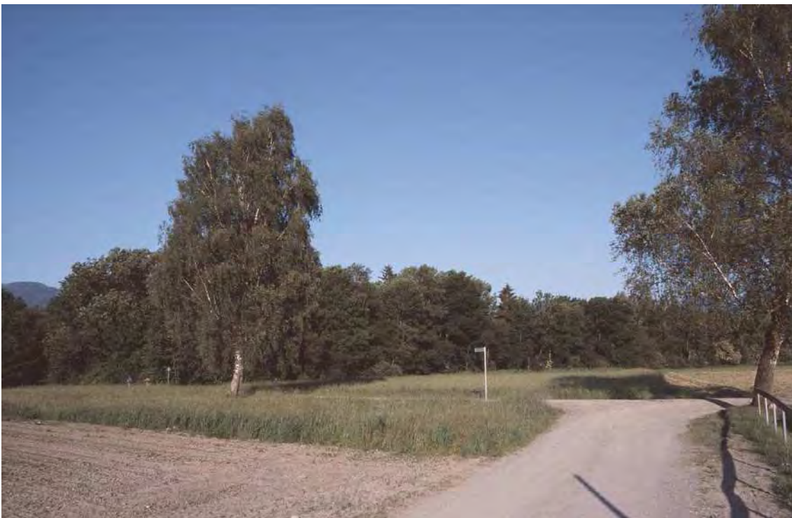
Abbildung 9: Die Streuwiesenreste des Oberrieds sind floristisch sehr reichhaltig und beherbergen eine Reihe gefährdeter Arten, so etwa Sibirische Schwertlilie ( Iris sibirica ), Hirschwurz ( Peucedanum cervaria ) und Wiesensilge ( Silaum silaus ).

Das Biotop setzt sich aus zwei durch einen Güterweg voneinander getrennten Streuwiesenparzellen zusammen. Die beiden Parzellen grenzen im Norden direkt an die Galeriewälder der Frutz, ansonsten wird das Umland - abgesehen vom Modellflugplatz - von Äckern und Intensivgrünland gebildet. Beide Streuwiesenparzellen werden von sehr artenreichen Pfeifengraswiesen trockenerer Ausprägung eingenommen. Trotz ihrer Kleinheit sind die beiden Parzellen äußerst schützenswert. Neben ihrer Bedeutung als (letzte) naturnahe Flächen in der ansonsten sehr intensiv genutzten Agrarlandschaft, ist auch der ungestörte Übergang vom Fließgewässer (Frutz) über den naturnahen Galeriewald zu den Flachmoorparzellen (Saumlinieneffekt) von hohem ökologischem Wert.