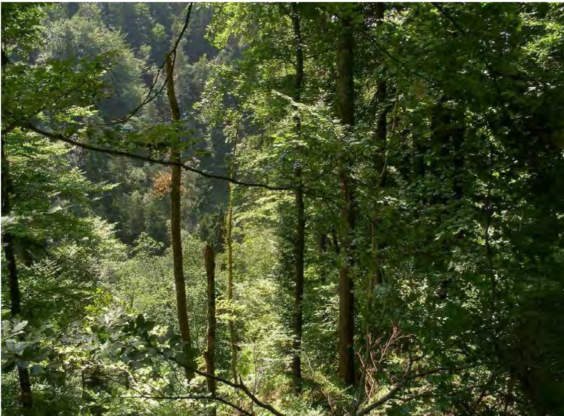
Abbildung 16: Die steilen und artenreichen Laubmischwälder des Sattelberges.

Geschlossener Waldbestand als westlichster Teil des Waldgebietes Sattelberg-Tschütsch. Es handelt sich um artenreiche Laubmischwälder vom Typ des Braunerde-Buchenwaldes. Der südlichste Teil des Biotops entspricht einem Hainbuchenwald (Ausbildung über helvetischen Kalken). An den rheintalseitigen Kalkfluhlen weist der Bestand einen schmalen Streifen eines typisches Eiben-Buchen- Steilhangwaldes auf. Auf Grund der seltenen Waldgesellschaften kommt diesem Biotop regionale Bedeutung zu. Bei diesem auf dem Gemeindegebiet von Koblach gelegenen Teil des Waldgebietes Sattelberg-Tschütsch handelt es sich um einen sehr naturnahen Bestand auf dem steilen, westexponierten Hang. Der Durchforstungsgrad ist sehr gering. Der Übergang von Braunerde-Buchenwald hin zu einem Eiben-Buchenwald ist nur als schmales Band in den Bestand eingelagert.