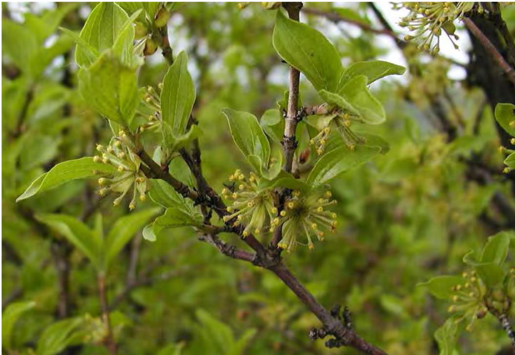
Abbildung 13: Die wärmeliebende und stark gefährdete Kornellkirsche (Cornus mas).

Der Kummen ist der größte und markanteste Inselberg des Rheintals, dem aus vielerlei Gründen besondere Schutzwürdigkeit zukommt. Neben den verschiedenen, teils seltenen Lebensräumen, dem Vorkommen einer Reihe gefährdeter Tier und Pflanzenartensowie seiner Rolle als vernetzendes Element der Lebensräume in seinem näheren und weiteren Umfeld, ist er mit seinen Waldungen auch als Naherholungsgebiet von großer Bedeutung. Daneben sei auch auf seine landeskulturelle Bedeutung hingewiesen und zwar als einer der frühesten prähistorischen Siedlungsplätze, wobei der durch den Steinbruch inzwischen leider fast gänzlich verschwundene Kadel als archäologischer Fundort besondere Erwähnung verdient.