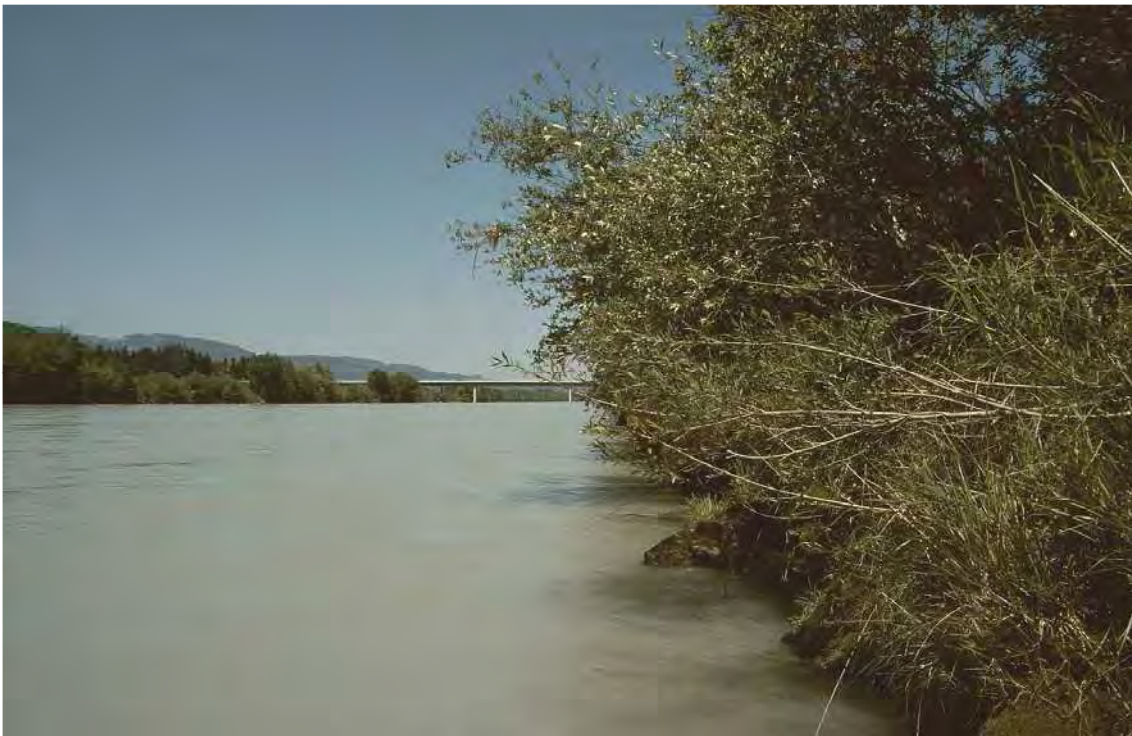
Abbildung 14: In diesem Bereich des Rheinufers kam laut Broggi (1986) ehemals der in Vorarlberg vom Aussterben bedrohte Zwergrohrkolben ( Typha minima ) vor. An diesem Standort dürfte er inzwischen verschwunden sein.

Am Rheinufer war zumindest in den 1980er Jahren noch der europaweit vom Aussterben bedrohte Zwergrohrkolben ( Typha minima ) zu finden. Es ist dies einer der wenigen nachgewiesenen Standorte der Art in Vorarlberg, wobei es sich hier und an einer zweiten Stelle in Mäder (vgl. Biotop 41204) wohl um Schwemmlinge aus dem Bündnerland handelt(e). Der Zwergrohrkolben als Charakterart der Auenbereiche der großen Alpenflüsse ist ein Pionierbesiedler sandig-schlickiger Anlandungen und baut hier recht kurzlebige Dominanzbestände auf, die sogenannte Zwergrohrkolbengesellschaft. Noch zu Beginn des 20. Jahrhunderts entlang von Rhein oder Ill regelmäßig zu finden, ist die Art aufgrund von Flussverbauung und Wasserkraftnutzung (fehlende Hochwasserdynamik) fast gänzlich verschwunden. Heute ist der Zwergrohrkolben fast nur noch im Rheindelta zu finden.