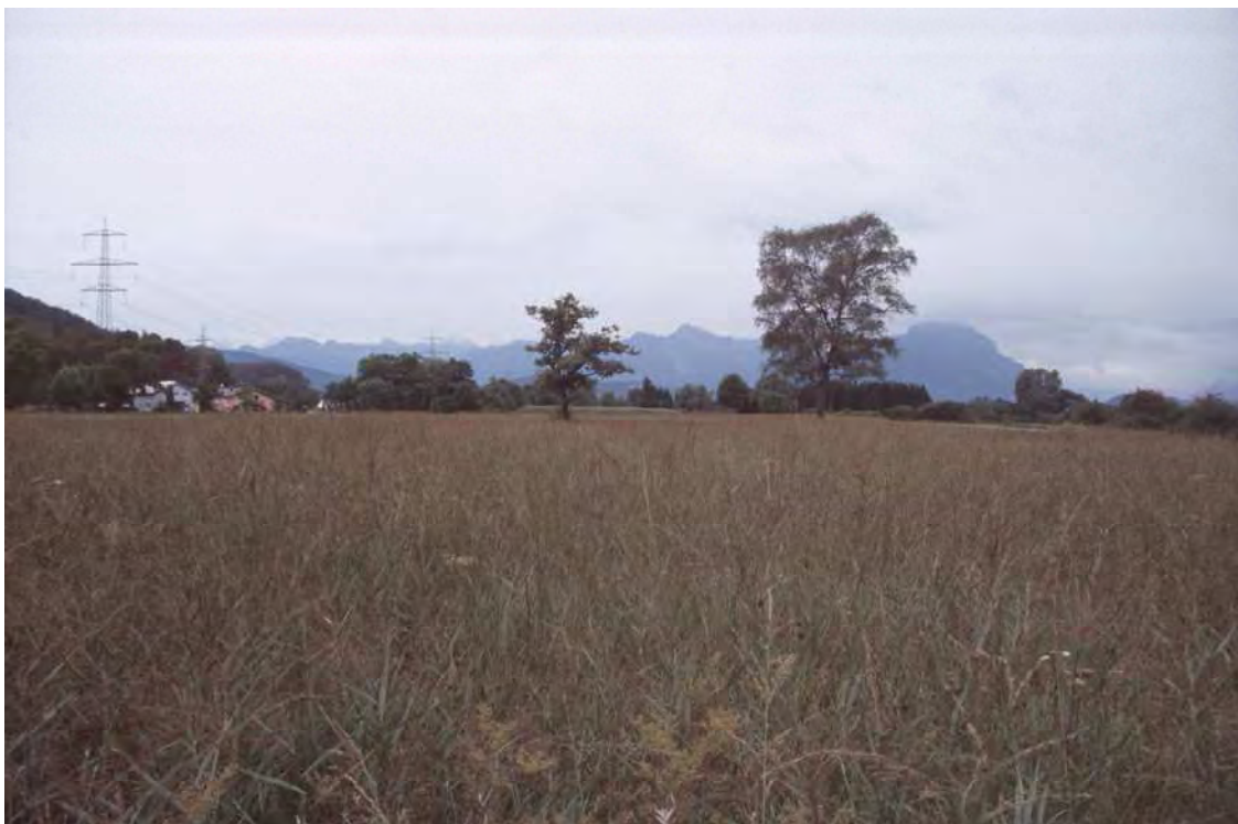
Abbildung 2: Vom historischen Torfabbau nur in geringem Ausmaß betroffene Streuwiesenfläche im zentralen Bereich von Koblach-Bromen. Im Übergang zu den ehemaligen Torfstichen fällt das Niveau über eine markante Geländekanten ab.

Entsprechend der ehemals sehr intensiven Nutzung durch die Torfstecherei stellt sich das Gebiet von Bromen gegenwärtig als sehr wechselhaftes Mosaik aus verschiedenen Pflanzengesellschaften dar. Von den Pfeifengraswiesen besonders hervorzuheben sind jene des Schloßwaldrieds als Standort mehrerer, hochgradig gefährdeter Arten. Das Gebiet ist auch durch die schönen Solitärbäume geprägt, wie z.B. Stieleiche ( Quercus robur ), Birke ( Betula pendula ) oder Silberweide ( Salix alba ).