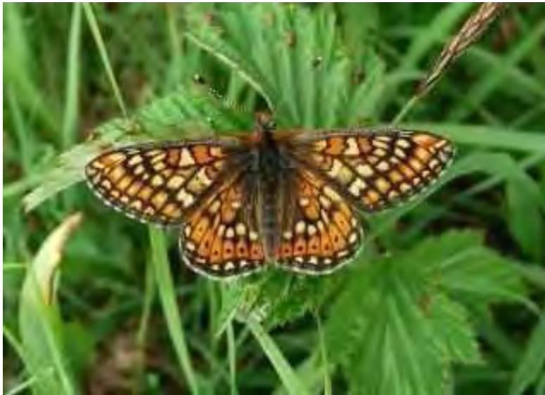
Abbildung 11: Der stark gefährdete Skabiosen-Schneckenfalter ( Euphydryas aurinia ), dessen Raupen sich von der Tauben-Skabiose ( Scabiosa columbaria ) ernähren.