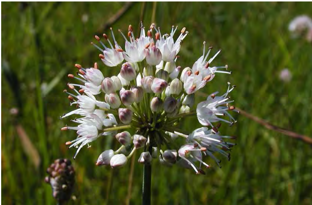
Abbildung 3: Der vom Aussterben bedrohte Duft-Lauch ( Allium suaveolens ), eine Spezialität der Rheintal-Rieder.