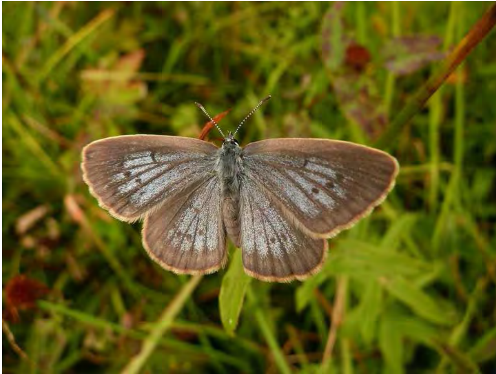
Abbildung 4: Der vom Aussterben bedrohte Helle Wiesenknopf-Ameisen-Bläuling ( Maculinea teleius ). Sein Vorkommen ist an das Vorhandensein des Großen Wiesenknopfes ( Sanguisorba officinalis ) gebunden, eine typische Pflanze der Pfeifengras-Streuwiesen..