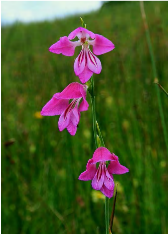
Abbildung 6: Die vom Aussterben bedrohte Sumpf-Siegwurz kommt in den Streuwiesen von Birken noch vor.