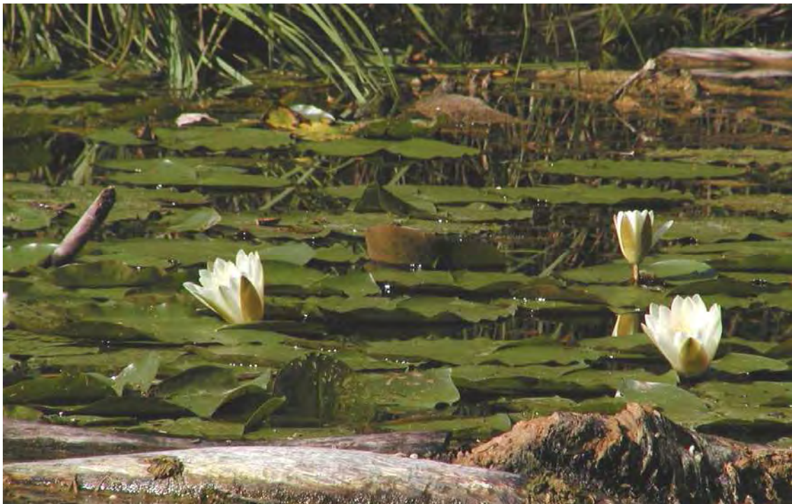
Abbildung 15: Dichte Bestände der gefährdeten Weißen Seerose ( Nymphaea alba ) prägen die Lehmlöcher bei Kommingen.

Der Feuchtgebietskomplex des ehemaligen Lehmgrubenareals von Kommingen liegt nördlich des Kummenbergs und grenzt direkt an das Steinbruchgelände an. Das Biotop liegt zum größten Teil auf Götzner Gemeindegebiet, nur der südwestliche Bereich gehört zu Koblach. Offene Wasserflächen, Seerosenbestände, ausgedehnte Röhrichte, Mädesüßfluren, Weidengebüsche, bruchwaldartige Weiden- und Birkenjungwälder, alte Baumbestandesowie Reste von Pfeifengraswiesen und artenreichen Feuchtwiesen setzen den reichhaltigen Biotopkomplex zusammen. Neben den drei großen Weihern bzw. Baggerseen finden sich auch zahlreiche kleinere, bisweilen nur temporär wasserführende und teils über Gräben miteinander verbundene Wasserflächen. Im durch Einzelbäume und Reste von Baumhecken gegliederten Wiesengebiet nördlich des Lehmabbaugeländes haben sich zwei kleine Streuwiesen als letzte Reste der ehemals ausgedehnten Flachmoorwiesen erhalten.