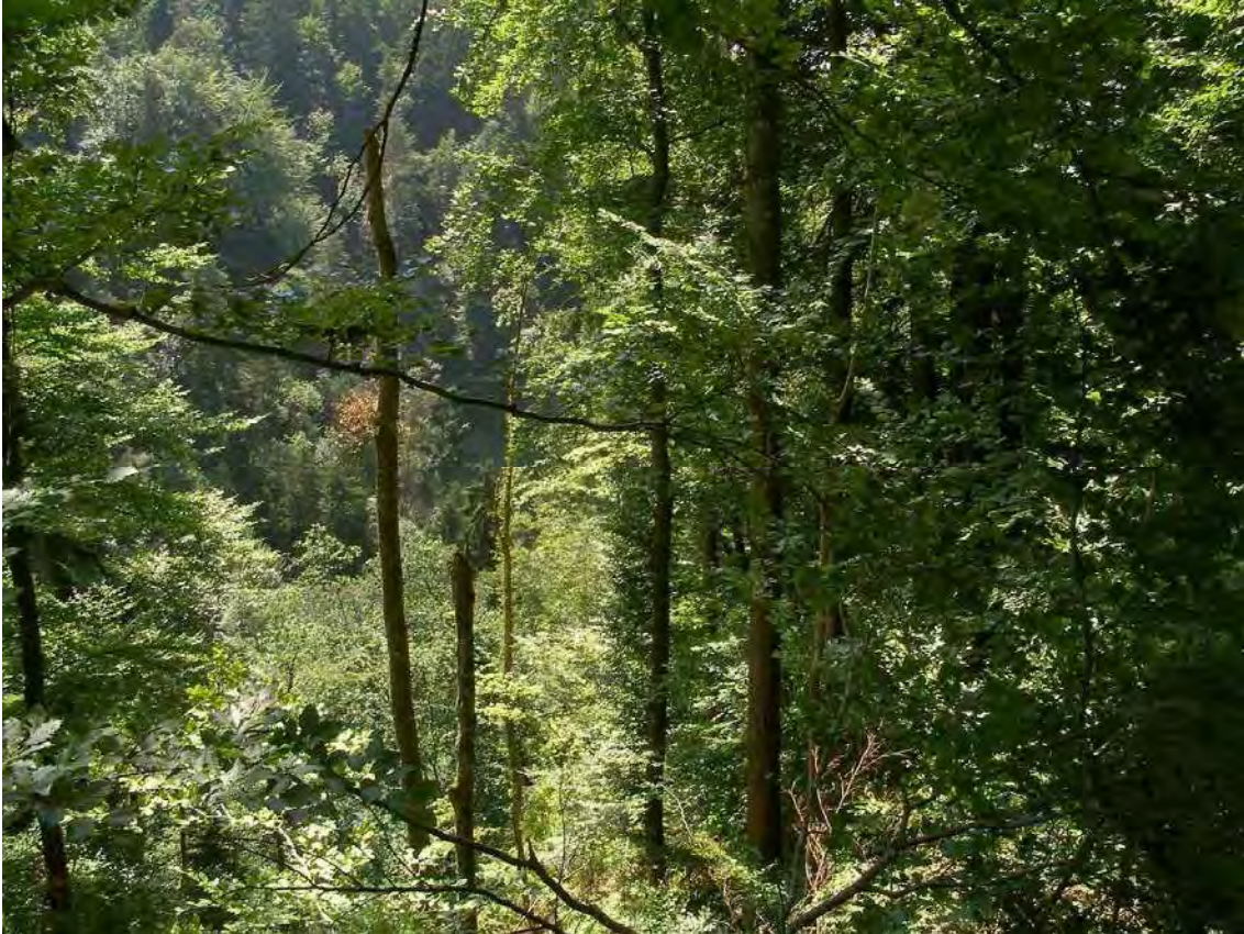
Abbildung 3: Das Klausbachtobel beherbergt auffallend viel Hirschwurde -ein seltener Farn luftfeuchter, schattiger Standorte.