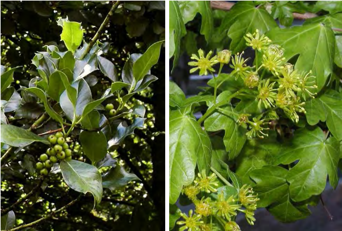
Abbildung 2: Die beiden wärmeliebenden und gefährdeten Gehölze Stechpalme ( Ilex aquifolium ) links und Feldhorn ( Acer campestre ), rechts.