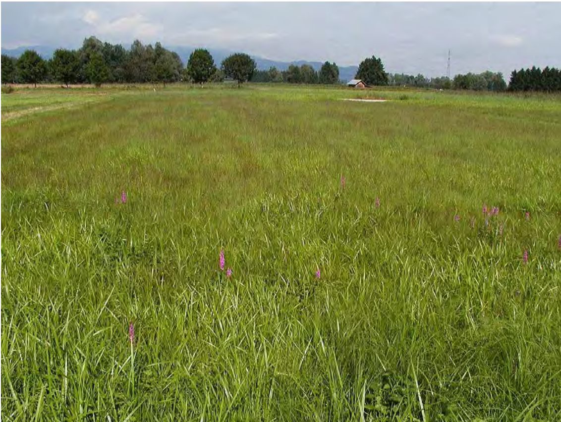
Abbildung 9: Artenarme, gemähte Pfeifengraswiese westlich des Flugfeldes im Bereich der Gemeindeäcker.

Hochstauden, Streuwiesenbrachen, Reste von Pfeifengraswiesen und Röhrichte zwischen Landgraben und Flugfeld auf anmoorigen Alluvialböden und Gleyböden aus feinem Schwemmmaterial. Die Flächen waren einst deutlich artenreicher und stellen derzeit ökologisch wertvolle Restflächen und Vernetzungselemente dar. Trotz der weitgehenden Verbrachung treten immer noch eine größere Anzahl gefährdeter Arten vor.