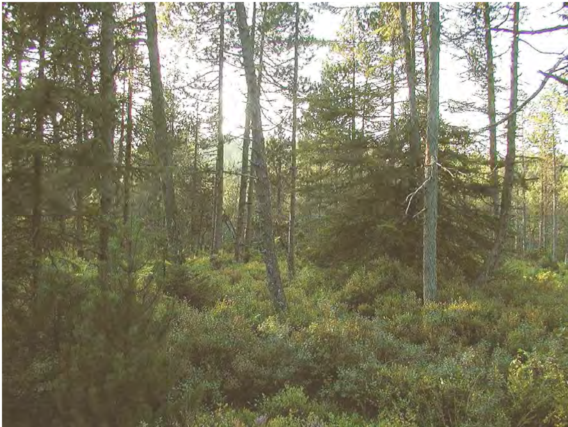
Abbildung 6: Das zwergstrauchreiche Spirkenhochmoor des Schollenschopf. Im Unterwuchs dominiert die Moor-Nebelbeere ( Vaccinium uliginosum ).

Bei diesem Biotop handelt es sich um ein landschaftlich sehr reizvolles, großflächiges und gut erhaltenes Spirkenhochmoor. Es handelt sich um das einzige Hochmoor von Hohenems. Es findet sich in Muldenlage über Moränenmaterial zwischen Schuttannenalp (Ruheshütte) und Breitem Berg. Das eher trockene Hochmoor weist durchwegs Baumbewuchs mit Krüppelfichten und Spirken auf und besitzt wenig freie Moorflächen. Die Mooroberfläche ist, abgesehen von einigen wenigen Schlenken dicht mit Zwergsträuchern (vor allem mit der Moor-Nebelbeere) bewachsen. Landschaftlich entfaltet die Fläche durch den lockeren Baumbewuchs und die dichten Torfmoospolster aber einen besonderen Reiz.