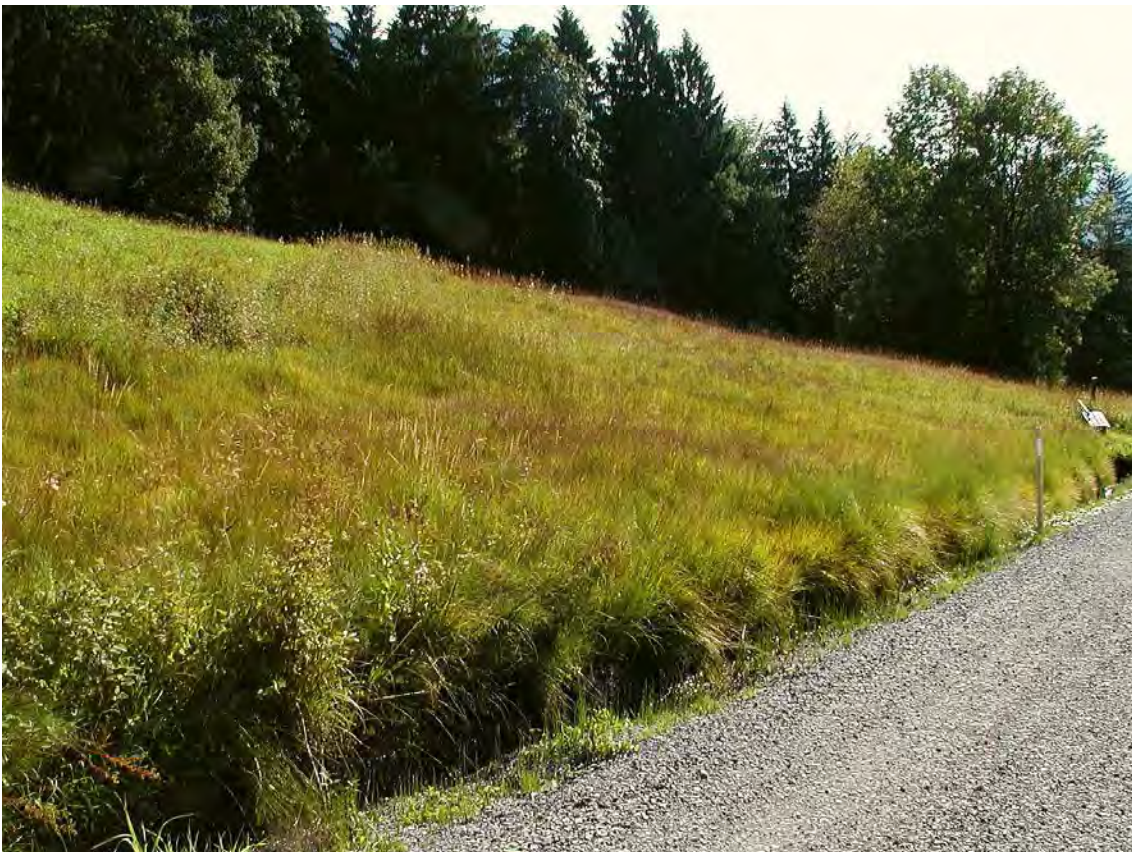
Abbildung 5: Gut erhaltenes Hangmoor an der Straße von der Ems-Reute zur Ranzenberghütte.

Kleinflächige, räumlich getrennte Hangmoorflächen mit stark unterschiedlichem Erhaltungsgrad aber teils sehr schöner Ausbildung (Kopfbinsenrieder). Die Flächen liegen am Hang oberhalb Ems-Reute und teilen sich in 4 unterschiedlich gut erhaltene räumlich getrennte Teilobjekte. Der Untergrund besteht vorwiegend aus kalkfreiem Moränenmaterial. Die in diesem Biotop zusammengefassten Hangmoore, Feuchtwiesenbrachen und Magerrasenreste zeichnen sich durch eine teilweise erstaunliche pflanzliche Artenvielfalt aus. Diese hängt weitgehend mit den, auf kleinem Raum stark wechselnden, Feuchtigkeitsverhältnissen zusammen.