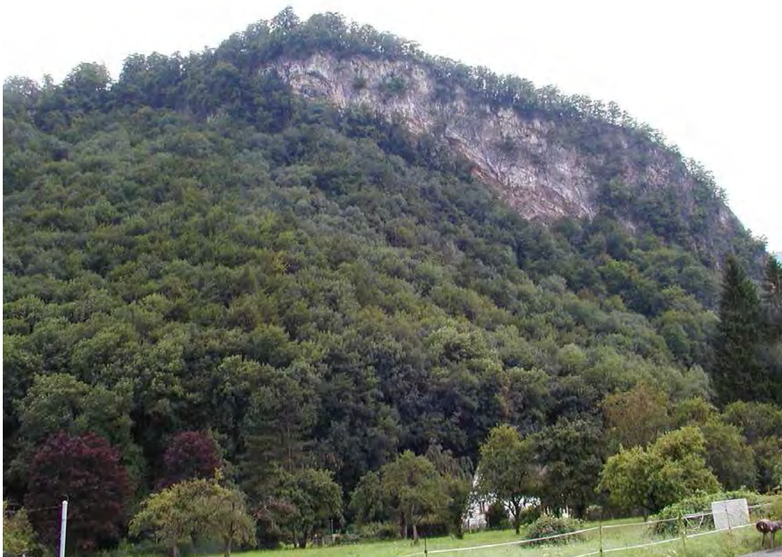
Abbildung 2: Westseite des Schloßberges mit naturnahem Laubmischwald und Felsbiotop.

Die stark reliefierte und von Felsabbrüchen und Wasserfällen geprägte Biotopfläche beinhaltet die Erhebungen mit den Burgen Alt- und Neu Ems, die Bachläufe mit den flankierenden Waldgebieten in der Emser Reute, den Schlossweiher und den Einfirst-Hügel oberhalb Hohenems. Geologisch handelt es sich um diverse Schichten des Helvetikums, die mit Moränenmaterial überdeckt sind. Entlang dem Talverlauf in der Reute liegt eine rund 500 m große Blattverschiebung. Bei den Laubwäldern handelt es sich um weitgehend noch naturnahe Laubmischwälder, die lokal durch forstliche Maßnahmen in ihrer Artenzusammensetzung verändert sind. Einzigartig ist der Komplex durch seine Ausdehnung und seine große Wirkung auf das Landschaftsbild. Am verbreitetsten sind artenarme Hallen-Buchenwälder, sowie wärmegetönte, artenreiche Buchenbestände, Bemerkenswert sind die in der Fläche verteilten Ahorn-Eschenwälder (Arunco-Aceretum und Phyllitido-Aceretum). An den exponierten Hangrippen stocken artenreiche Linden-Traubeneichenwälder (Silene nutantis-Quercetum). In den einzelnen Waldgesellschaften sind Eiben teilweise recht häufig anzutreffen.