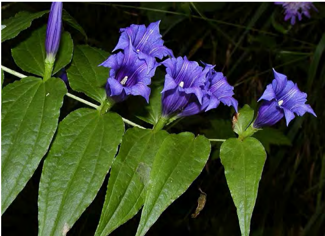
Abbildung 16: Als einzige gefährdete Art gedeiht in der Fläche der Schwalbenschwanz-Enzian ( Gentiana asclepiadea ).

Die Fläche wurde als Ersatzfläche zu der nicht mehr aufgefundenen Fläche V3.2.11 des alten Inventars aufgenommen. An der kartographisch eingetragenen Stelle liegt ein dichter Fichtenforst, in der Umgebung liegen zwar immer wieder Freiflächen, diese sind allerdings dicht mit Farnen und Hochstauden verwachsen. Fieberklee ( Menyanthes trifoliata ) konnte nirgends festgestellt werden.