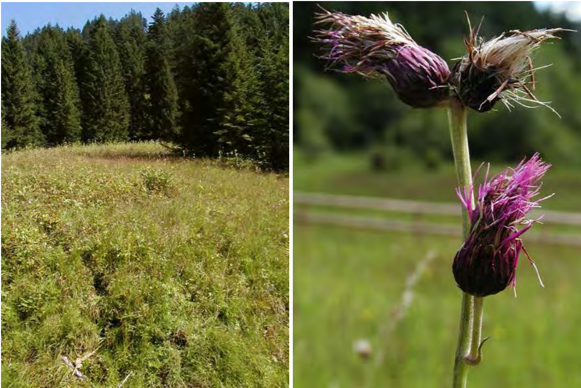
Abbildung 18: Die verbrachte und nur noch zeitweise als Pferdeweide genutzte Fläche der Briedleralp mit einem Vorkommen der stark gefährdeten Bach-Kratzdistel ( Cirsium rivulare ), rechts.

Im südlichsten Bereich der Briedleralp (südlich des Strahlkopfes) gelegener, als Pferdeweide genutzter Hangsumpf mit stellenweise Niedermoorcharakter - über penninischem Flysch der Tristelschichten. Der Biotop ist in zwei Teilobjekte gegliedert, wobei eines einer relativ artenreichen Hochstaudenflur mit Eisenhut, das andere einem recht gut erhaltenen Pfeifengrasbestand mit Hangmoorcharakter entspricht. Die Hochstaudenflur wird sporadisch als Pferdeweide genutzt.