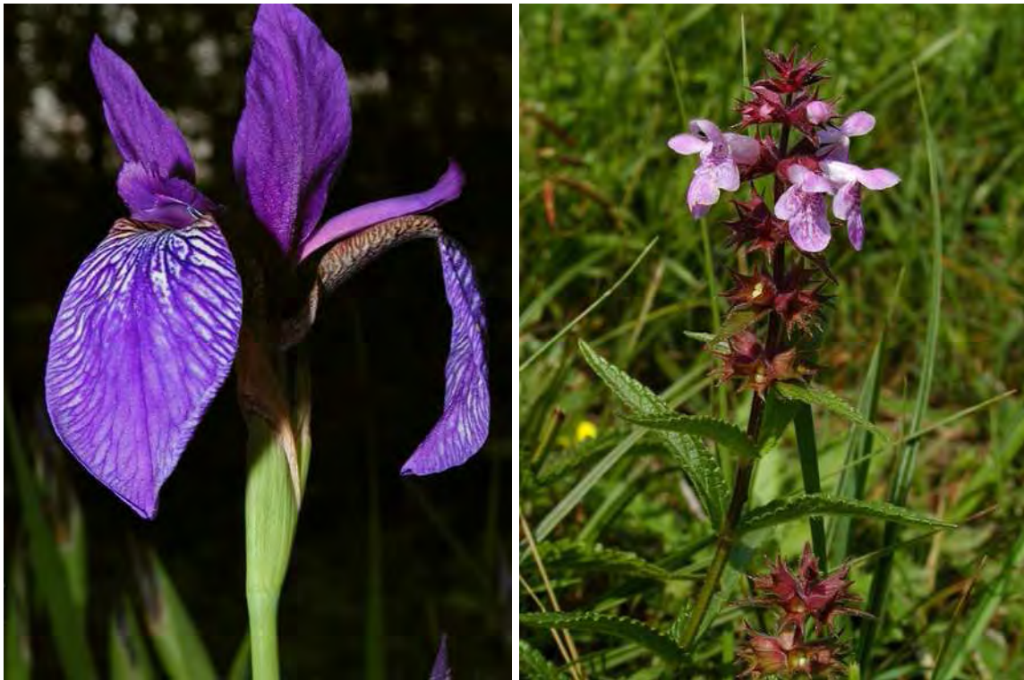
Abbildung 8: Die stark gefährdete Sibirische Schwertlilie ( Iris sibirica ), links und der gefährdete Sumpf-Ziest ( Stachys palustris ) als typische Arten der Pfeifengras-Streuwiesen und deren Verbrachungsstadien.

Es handelt sich bei diesem Biotop um drei kleinere aus Pfeifengraswiesen hervorgegangene Schilfröhrichte, die noch Reste der ursprünglichen Vegetation aufweisen (selten etwa tritt noch die Sibirische Schwertlilie auf). Die drei Parzellen liegen zwischen Gstaldengraben und Angern auf entwässerten Anmooren mit Torfeinlagerungen und Gleyböden aus feinem Schwemmmaterial. Die Flächen sind als ökologische Ausgleichsfläche in einer intensiv genutzten Landschaft im Sinne eines Biotopverbundes bedeutsam. Die in der Streuwiesenevaluierung aufgenommene orchideenreiche Pfeifengraswiese und das artenreiche Kleinseggenried konnten nicht mehr aufgefunden werden.