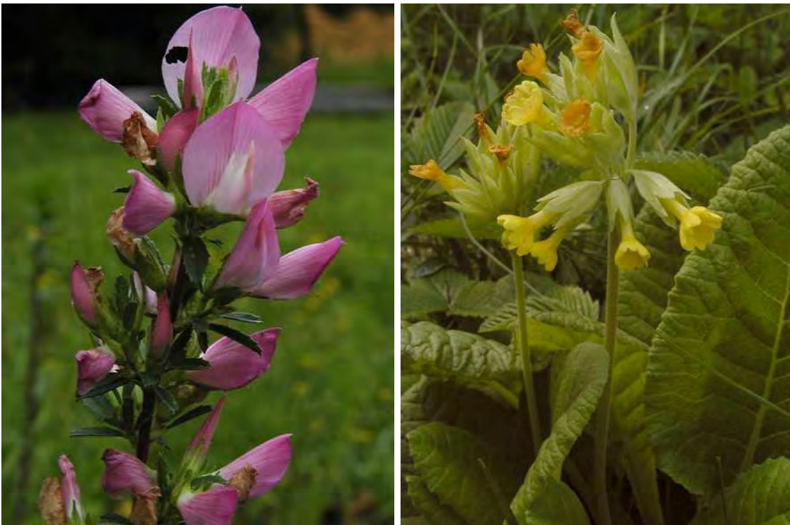
Abbildung 10: Der in Vorarlberg stark gefährdete Dornige Hauhechel ( Ononis spinosa ), links und die gefährdete Arznei-Schlüsselblume ( Primula veris ), rechts. Beides an sich Arten, die ihren Verbreitungsschwerpunkt in Magerwiesen besitzen.

Am nordöstlichen Siedlungsrand von Hohenems östlich der Eisenbahnlinie gelegene Streuwiesenbrachen. Die südliche Fläche liegt im Bereich von Einfamilienhäusern und dürfte vermutlich bald ebenfalls verbaut werden. Die nördliche ehemals artenreiche Fläche ist verbracht und stark entwässert und grenzt an Futterwiesen. Es handelt sich derzeit um stark beeinträchtigte Streuwiesen ohne besondere Artenausstattung. In den hochstaudenreichen Schilfröhrichten tritt der Sumpf-Storchschnabel ( Geranium palustre ) relativ häufig auf, die eher trockenen Streuwiesenbrachen werden von Straußgras ( Agrostis gigantea ) dominiert.