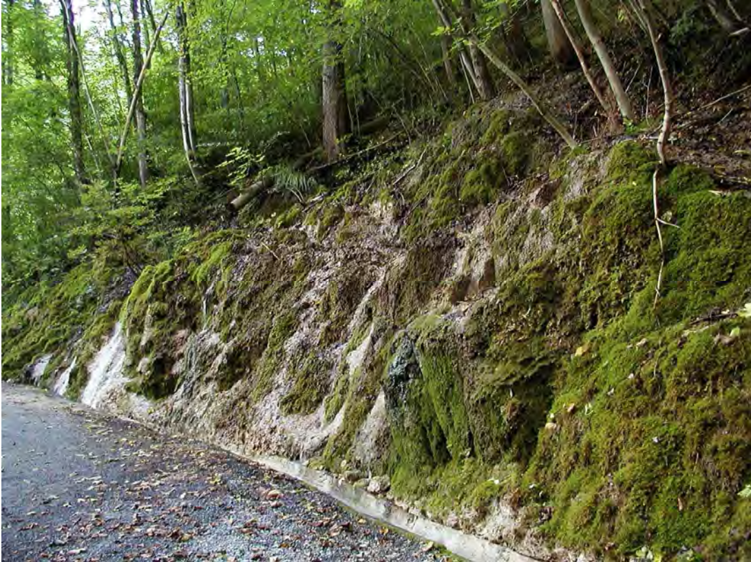
Abbildung 4: Die Tuffquellflur an der Straße in die Parzelle Tugstein zählt zu den seltensten und bedrohtesten Biotoptypen Vorarlbergs.