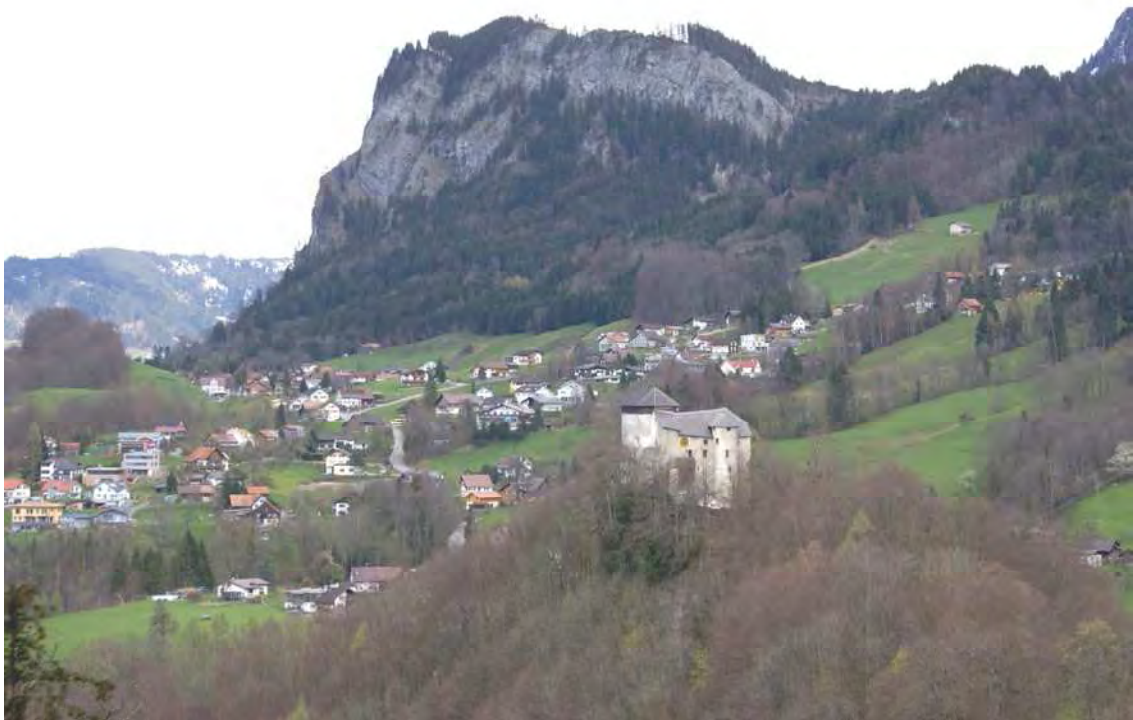
Abbildung 12: Im Vordergrund die Kuppe des Gloppers mit naturnahen Laubmischwäldern und im Hintergrund der Breitenberg, dessen Hangfußwälder ebenfalls Teil des Großraumbiotopes sind.

Biotopkomplex mit Felsabbrüchen, naturnahen Wäldern, natürlichen Bachläufen, Wasserfällen, Feuchtgebieten und traditioneller Kulturlandschaft. Der Großraumbiotop fasst die vier Biotopflächen 30208, 30209, 30210 und 30116 zusammen und wirkt als verbindendes Element. Die Biotopinhalte finden sich in den Beschreibungen der angegebenen Flächen. Die Biotopfläche hat sich weitgehend unverändert erhalten, innerhalb der Wälder sind aber größere Windwurfflächen zu beobachten.