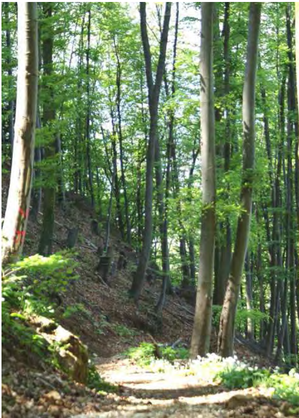
Abbildung 3: Blick in einen naturnahen Kalk-Buchenwald am Fußweg zur Ruine Alt-Ems.

Weiters sind die im Rheintal einzigartigen Kalksinterquellfluren (Tuff) im Laubmischwald unterhalb Tugstein zu erwähnen.