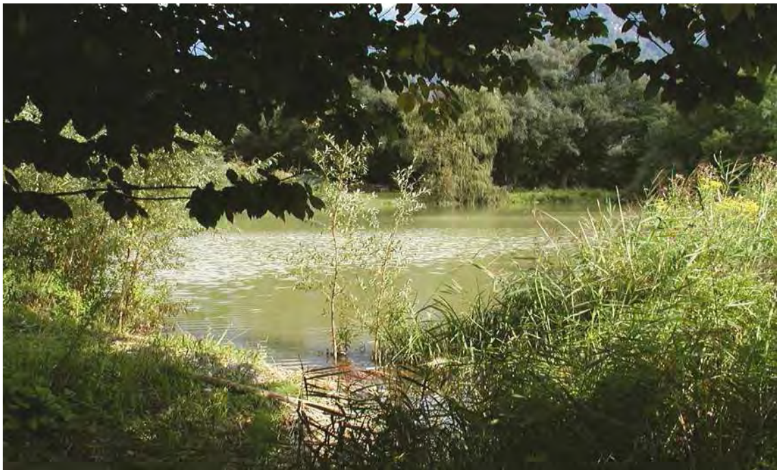
Abbildung 11: Der westliche der drei Lehmgrubenweiher mit stellenweise gut ausgebildeter Ufervegetation.

Ehemalige Lehmgruben einer Ziegeleifabrik am südlichen Siedlungsrand von Hohenems südöstlich der Bahnlinie von denen sich zwei auf einem Privatgrundstück befinden und als Bade- und/oder Fischteich genutzt werden. Die zwei größeren, nördlichen Teiche sind eingezäunt und nicht zugänglich. Ihre Ufervegetation ist stark beeinträchtigt und sie werden als Bade- und oder Fischteiche genutzt. Die Seen werden allerdings von Silberweidenbeständen umgeben, die das Gebiet zu einer naturbelassenen Oase inmitten von Siedlung und Landwirtschaftsgebiet machen, wo vor allem Wasservögel und weitere Wassertiere einen günstigen Lebensraum finden. Die Wasserflächen sind teilweise von Schilf und Breitblättrigem Rohrkolben umgeben. Die südliche, kleinere Teilfläche ist ein sehr schön ausgebildetes und sehr naturnahes Gewässer von hohem naturschutzfachlichem Wert. Es zeigt eine besonders schöne Uferzonierung aus Grauweidengebüsch, Schilfröhricht und Silberweidenbeständen.