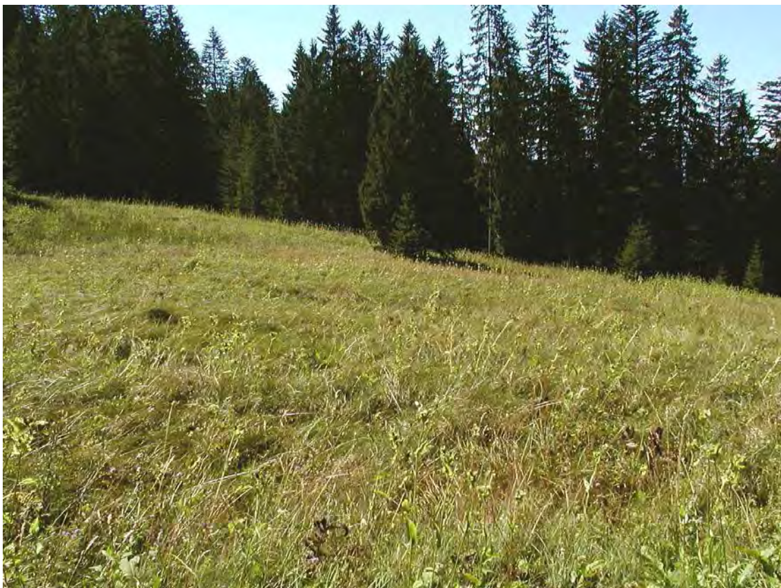
Abbildung 17: Die weitgehend verbrachten und nur noch sporadisch genutzten Magerweiden des Äpele.

FrISCHE bis feuchte, hochstaudenreiche ehemalige, heute weitgehend verbrachte Magerweide, mit Resten kleiner Davallseggenrieder (im Südwesten) und Pfeifengraswiesen. Die Fläche liegt auf einer Terrasse südwestlich der Emser Hütte. Randlich dringt Fichtenjungwuchs in die Fläche ein. Die Freifläche selbst wird von Rispensegge ( Carex paniculata ) und Kohldistel ( Cirsium oleraceum ) dominiert. Der Nordostteil der 1985 ausgewiesenen Fläche wurde aufgrund zu dichten Bewuchses mit Jungfichten nicht mehr ins Inventar aufgenommen.