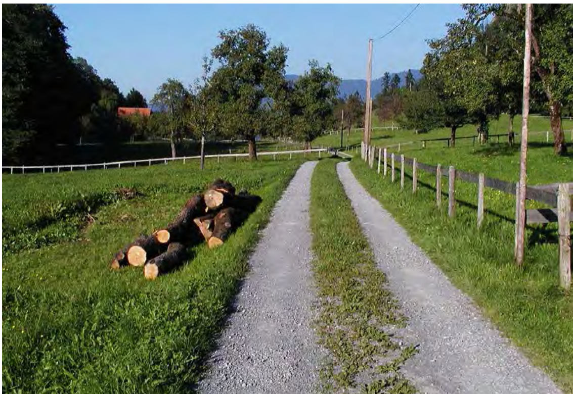
Abbildung 14: Die traditionelle Kulturlandschaft in Steckenwegen mit alten Obstbaumkulturen.

Bei den anstehenden Kalkfelswänden handelt es sich um verschiedene Schichten des Helvetikums. Die Terrasse von Steckenwegen wird von Hangschutt und Moränenmaterial gebildet. Auf relativ kleinem Raum findet sich im Biotop eine Vielfalt an Lebensräumen. Dominiert wird die Fläche aber von den Felswänden und den sie umschließenden Wäldern. Eine Besonderheit stellt die landschaftlich sehr reizvolle Kulturlandschaft von Steckenwegen dar. Zum Breitenberg hin sind die hier tannenreich ausgebildeten Buchenwälder durch forstlich eingebrachte Fichten beeinträchtigt. Unterhalb der Felsstufe sind die teilweise sehr jungen Buchenwälder stark mit Lärchen durchsetzt.