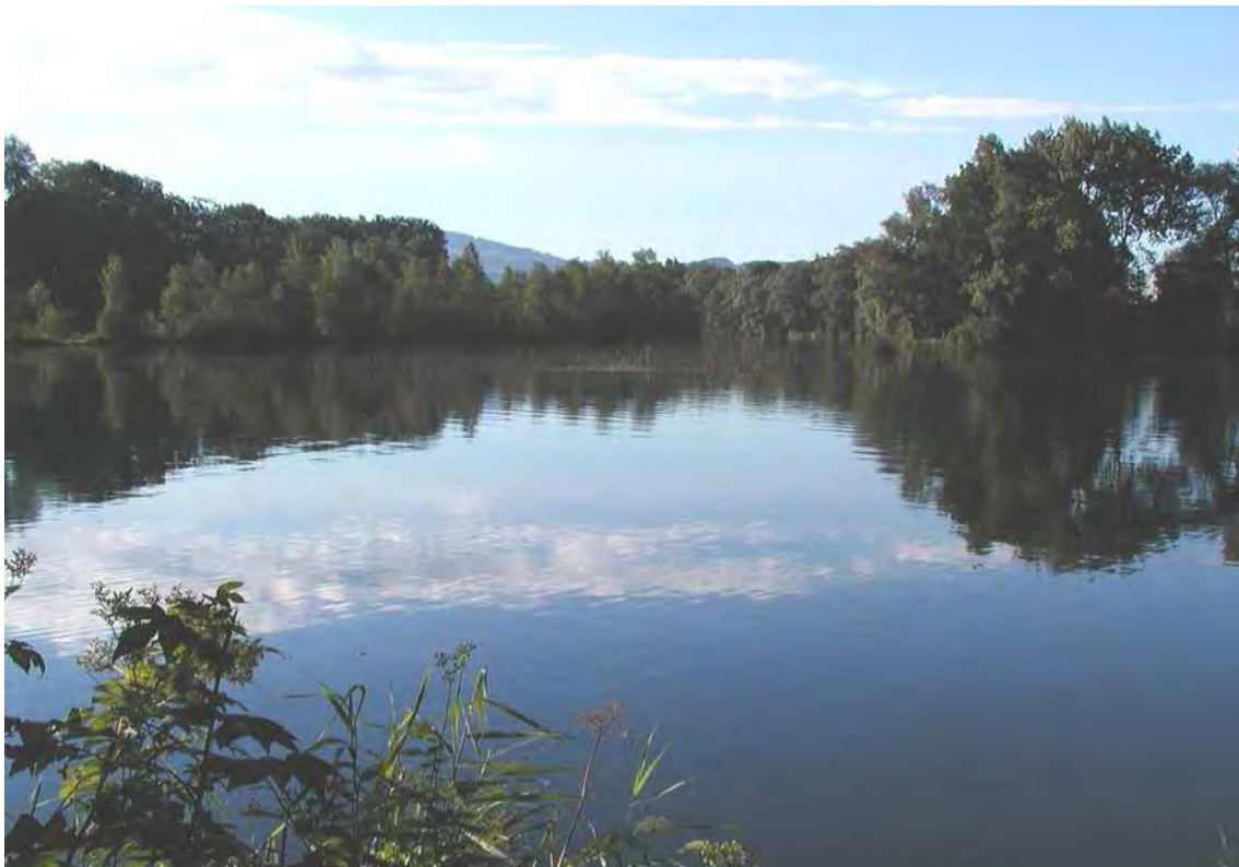
Abbildung 7: Der Totarm des Hohenemser Alt-Rhein im Nordteil an der Gemeindegrenze zu Lustenau mit Verlandungszonen und Auwaldfragmenten.

Beim Altrheinlauf zwischen Freizeitzentrum Rheinauen im Süden und der Gemeindegrenze gegen Lustenau im Norden handelt es sich um eine seit dem Rheindurchstich 1923 bei Diepoldsau bestehende Kiesausbeutungsfläche. Der größtenteils erhaltene Mitteldamm bildet die Landesgrenze zur Schweiz. Beim gesamten Altrheinlauf handelt es sich um ein für das Bundesland Vorarlberg höchst seltenen Altarm mit vielfältigen Vegetationsabfolgen. Die Bestände sind allerdings einem starken Besucherandrang von Erholungssuchenden ausgesetzt und die Wälder wie die Ufer von zahlreichen kleinen Wegen, Liege- und Lagerplätzen durchsetzt.