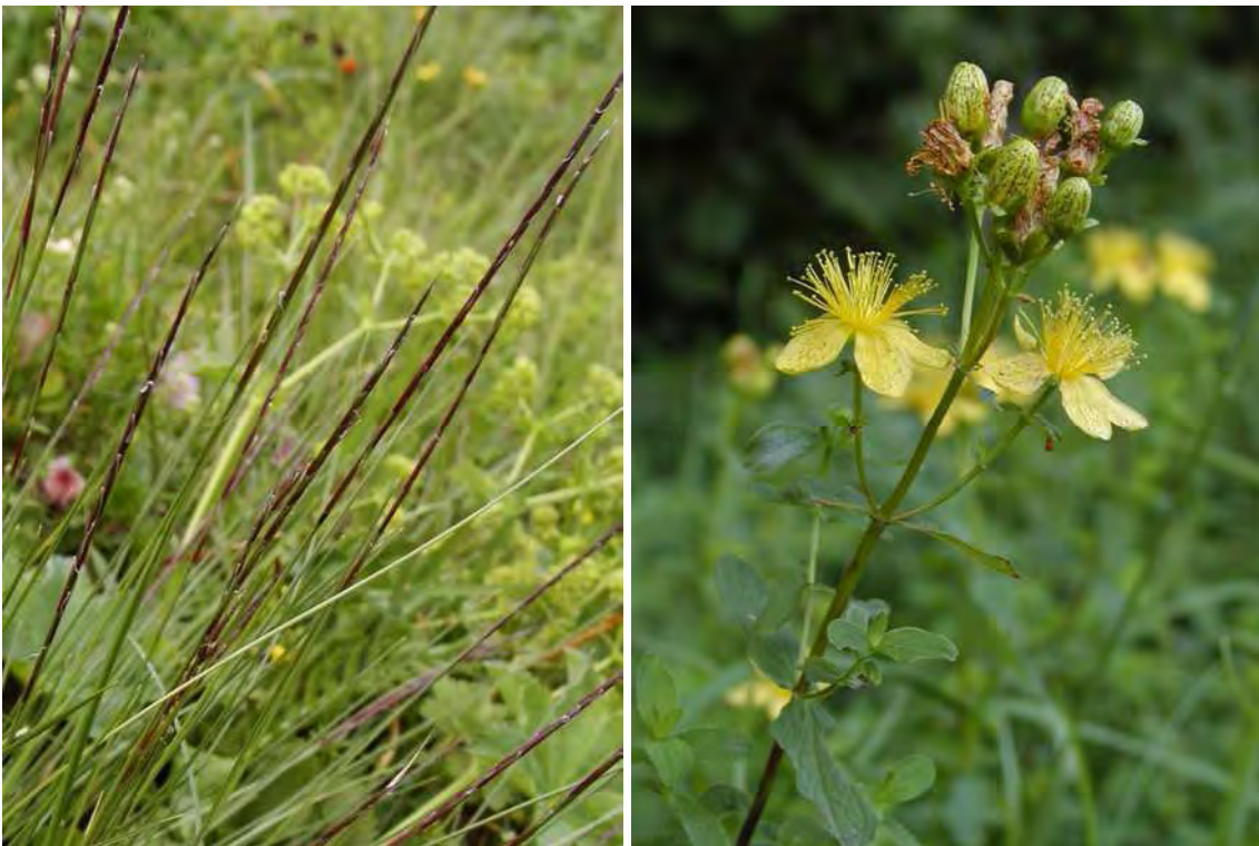
Abbildung 15: Der Bürstling ( Nardus stricta ), links und das Gefleckte Johanniskraut ( Hypericum maculatum ), rechts sind als letzte Reste der Arten der Magerwiesen „in der Wanne“ noch selten anzutreffen.

Innerhalb der Wochenendsiedlung "In der Wanne" finden sich letzte Reste von mageren Wiesen. Hier sind noch kleinste Reste mit Bürstling anzutreffen, diese sind aber als Vorgarten anzusehen. Die Fläche geht zu einem kleinen Bach hin in eine Mädesüßflur über. Der Großteil der ehemaligen Magerwiesen ging durch den Bau von Wochenendhütten verloren.