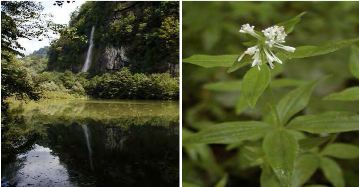
Abbildung 13: Der Teich bei Oberklien mit dem imposanten Wasserfall unterhalb von Reute. In den an eine Harte Au erinnernden Edellaubwäldern gedeiht der wärmeliebende Turiner-Meister ( Asperula taurina ).

Die Baumschicht ist äußerst artenreich und weist Grau- und Schwarzerle, Esche, Bergulme, Sommer-Linde, Hänge-Birke, Bergahorn, Stiel-Eiche, Trauben-Eiche, Traubenkirsche, Silber-Weide, Schwarz-Weide, Föhre und Fichte auf. Die Krautschicht ist von stickstoffliebenden Arten geprägt, Bemerkenswert ist das Vorkommen des wärmeliebenden Turiner-Meister ( Asperula taurina ). Das Nordostufer wird von einem bemerkenswerten Weidengebüsch, das bis auf Höhe des nördlichen Wasserfalles zum Begehungszeitpunkt unter Wasser stand, eingenommen. Vorgelagert sind Schilfröhrichte.