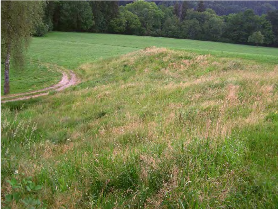
Abbildung 5: Nördliche Terrasse mit uneinheitlichen Fettwiesen.