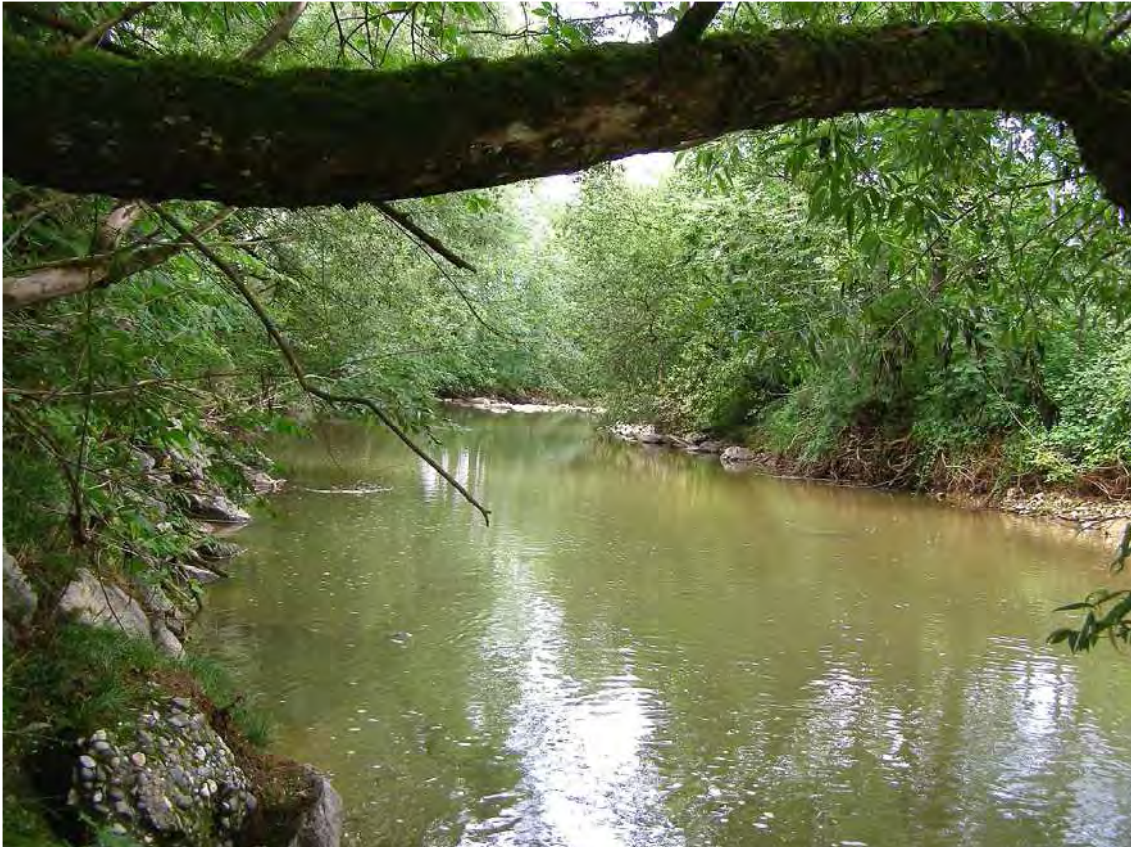
Abbildung 3: Blick die Leiblach flussabwärts bei Leonards mit Blockwurf-Uferverbauung.