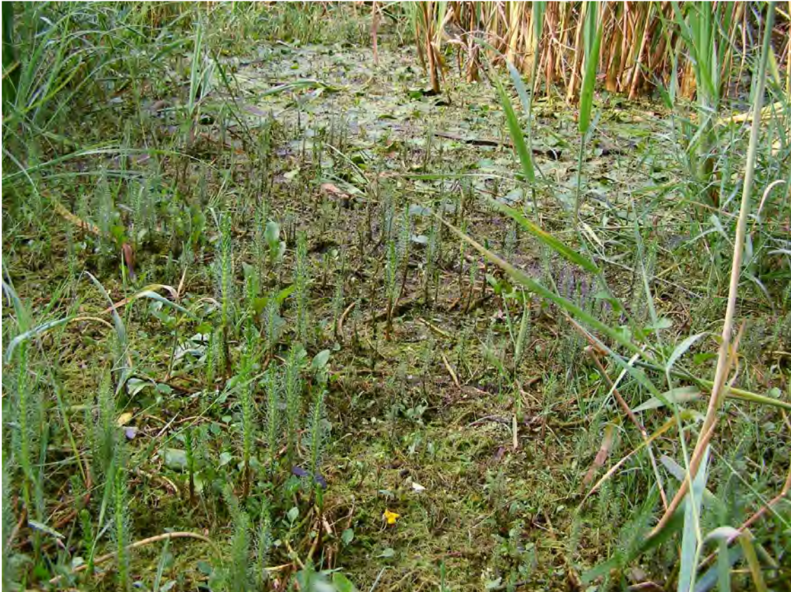
Abbildung 2: Verlandungsbereich mit reichlich Tannenwedel ( Hippurus vulgaris ) und Wasserschlauch ( Utricularia vulgaris ).