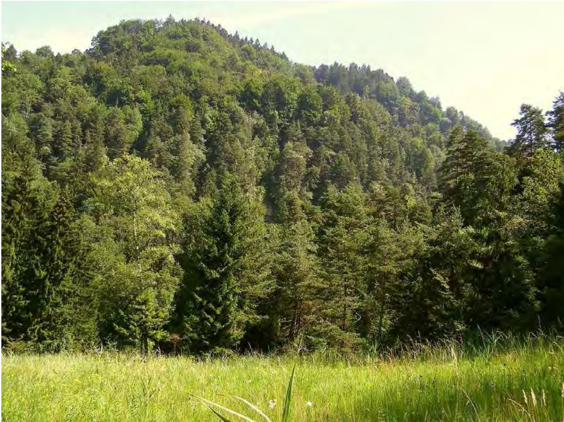
Abbildung 4: Blick über eine Streuwiese mit blühendem Weidenblättrigen Alant ( Inula salicina ) auf die Fels-Föhrenwälder der Ruggburg.