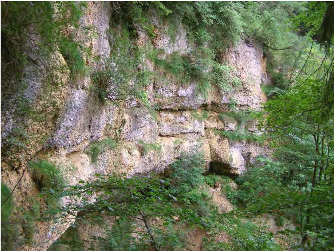
Abbildung 7: Nagelfluh-Felsen mit Standorten des Stark gefährdeten Kies-Steinbrech ( Saxifraga mutata ).

Der Berger Bach fließt an der Gemeindegrenze zwischen Hörbranz und Möggers über hohe Nagelfluh-Felsschrofen und bildet einen ca. 20 Meter hohen Wasserfall. Oberhalb und darunter fließt der Bach durch enge, steil geböschte Waldschluchten. Die schattig-feuchten Felsen des Wasserfalls beherbergen die Kiessteinbrechflur (Aster bellidiastro-Saxifragetum mutatae), eine seltene Felspaltengesellschaft der Molassezone, die hier ihren einzigen bekannten Standort im Leiblachtal besitzt. Daneben vervollständigen Rasengirlanden und steile Eiben-Buchen-Tannenwälder (Abieti-Fagetum taxetosum) das Bild. Durch schwere Bringbarkeit und den Schutzwaldcharakter ist auch der Wald in sehr naturnahem Zustand.