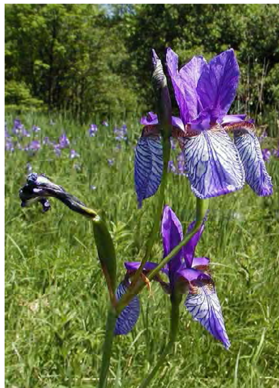
Abbildung 6: Die beiden stark gefährdeten Streuwiesenarten Lungen-Enzian ( Gentiana pneumonanthe ) und die Sibirische Schwertlilie ( Iris sibirica ).