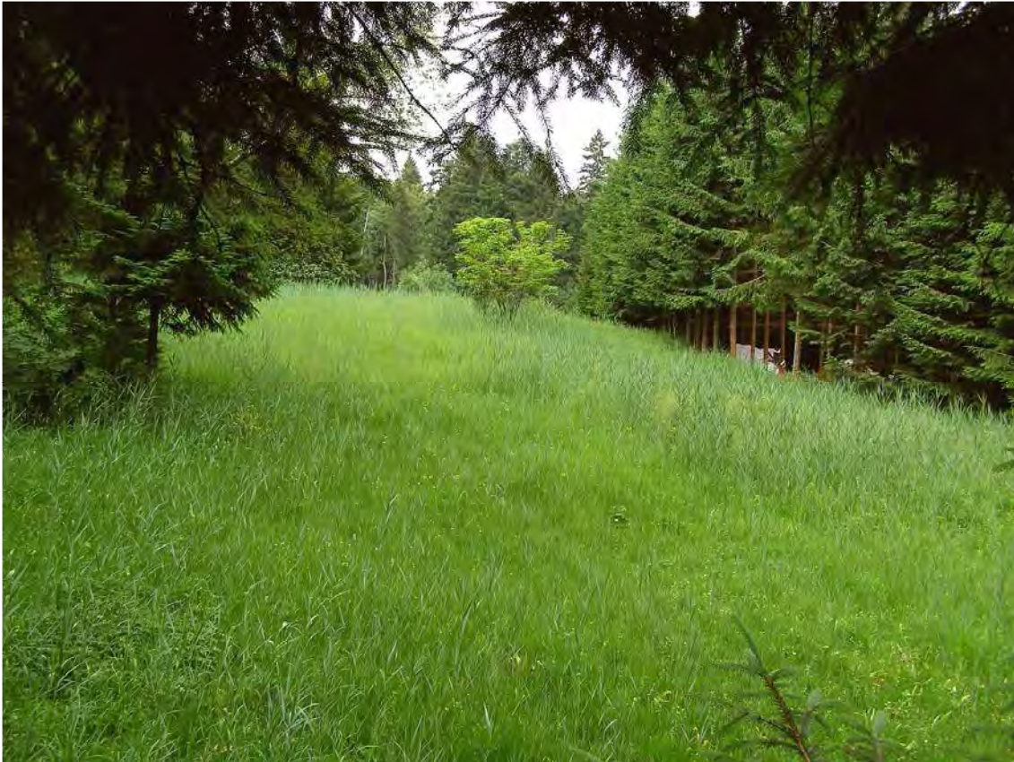
Abbildung 8: Blick von Norden über den Ostteil (vom Jägerstand) der noch genutzten Teile der Berger Wiese.