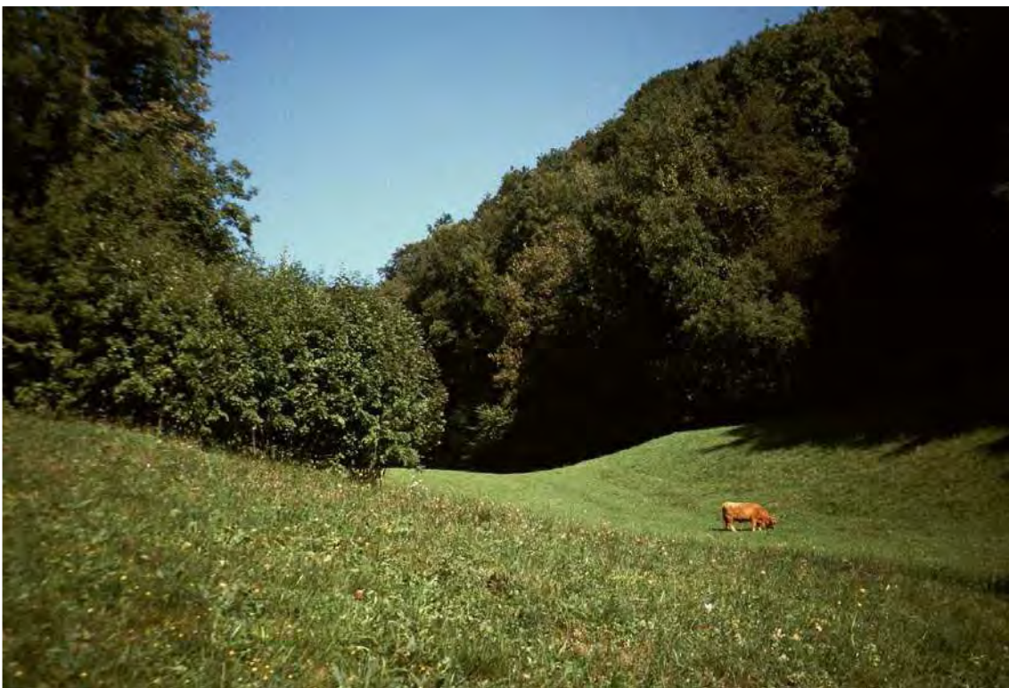
Abbildung 3: Die ehemaligen Magerwiesen auf der Kanzel sind in weiten Teilen aufgedüngt und werden heute beweidet. In den randlichen Bereichen blieben allerdings noch kleinere Reste von Trespenwiesen erhalten.