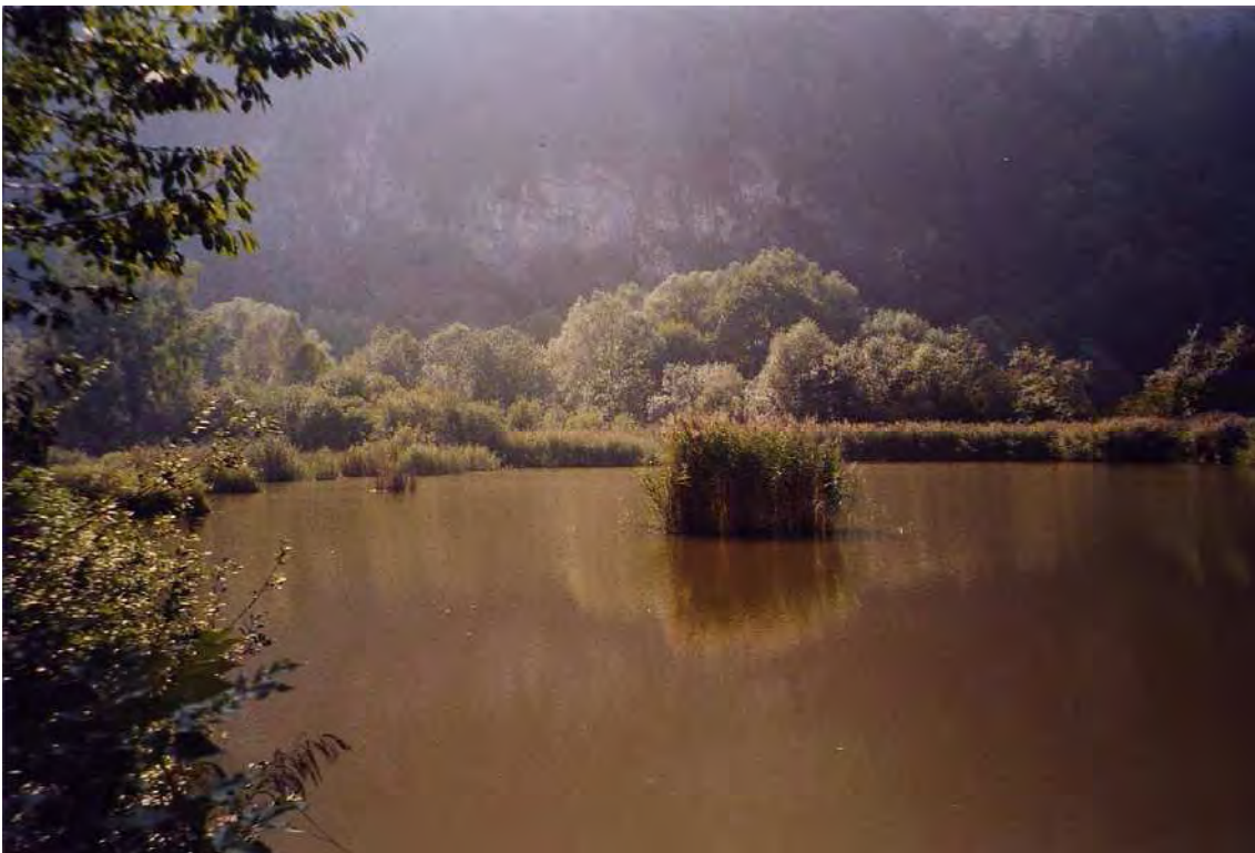
Abbildung 5: Nördliches Lehmloch mit ausgedehnten Schilfröhrichten.

Der Feuchtgebietskomplex des ehemaligen Lehmgrubenareals von Kommingen liegt nördlich des Kummenbergs und grenzt direkt an das Steinbruchgelände auf Koblacher Gemeindegebiet an. Das Biotop liegt zum größten Teil auf Götzner Gemeindegebiet, nur der südwestliche Bereich gehört zu Koblach (vgl. Biotop 41009). Offene Wasserflächen, Seerosenbestände, ausgedehnte Röhrichte, Mädesüßfluren, Weidengebüsche, bruchwaldartige Weiden- und Birkenjungwälder, alte Baumbestände, sowie Reste von Pfeifengraswiesen und artenreichen Feuchtwiesen setzen den reichhaltigen Biotopkomplex zusammen. Neben den drei großen Weihern bzw. Baggerseen finden sich auch zahlreiche kleinere, bisweilen nur temporär wasserführende und teils über Gräben miteinander verbundene Wasserflächen. Im durch Einzelbäume und Reste von Baumhecken gegliederten Wiesengebiet nördlich des Lehmabbaugeländes haben sich zwei kleine Streuwiesen als letzte Reste der ehemals ausgedehnten Flachmoorwiesen erhalten. Die Bedeutung dieses mannigfaltigen Feuchtgebietes ist auch in seiner räumlichen Nähe zum Kummenberg mit seinem ganz anders gearteten Lebensraumangebot zu sehen.