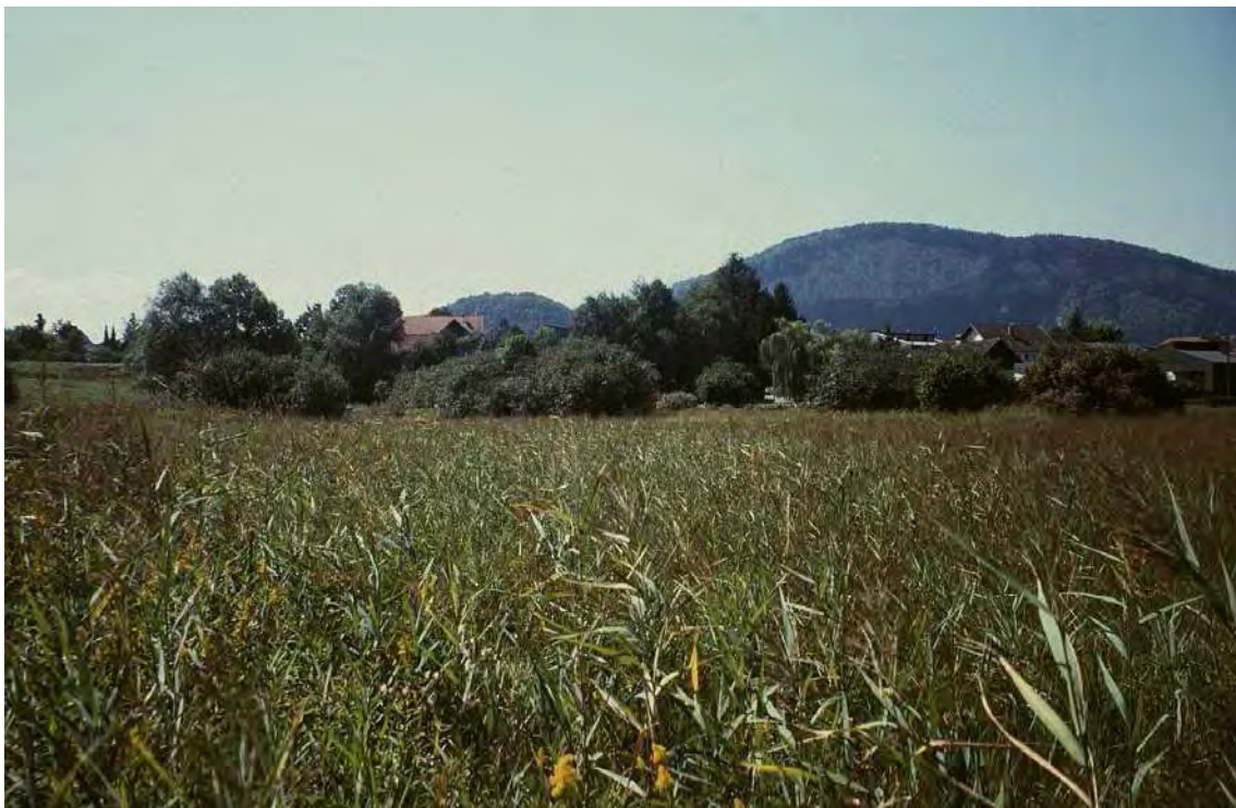
Abbildung 2: Blick auf den zentralen Bereich des Mösles. Die ausgesprochen artenreichen Streuwiesen zeigen starke Verschilfungstendenzen.

Das Flachmoor liegt südlich des Mösle-Stadions. Im Westen und Süden wird es von Siedlungsraum und landwirtschaftlich genutzten Flächen begrenzt, im Osten von der Bahntrasse. Durch seine Lage in einer Hangsenke ist das Gebiet vor allem im östlichen Teil stark versumpft; am Hangfuß finden sich wohl auch Quellaustritte. Im Untergrund wechselt Torf mit Lagen von feinem Schwemmmaterial. Es handelt sich um ein sehr artenreiches Flachmoor mit einer Massierung hochgradig gefährdeter bis akut vom Aussterben bedrohter Pflanzenarten und den entsprechenden Vegetationstypen. Einer der wenigen Vorarlberger Standort des prioritären FFH-Lebensraumtypes der Schneidbinsengesellschaft ( Cladietum marisci ).