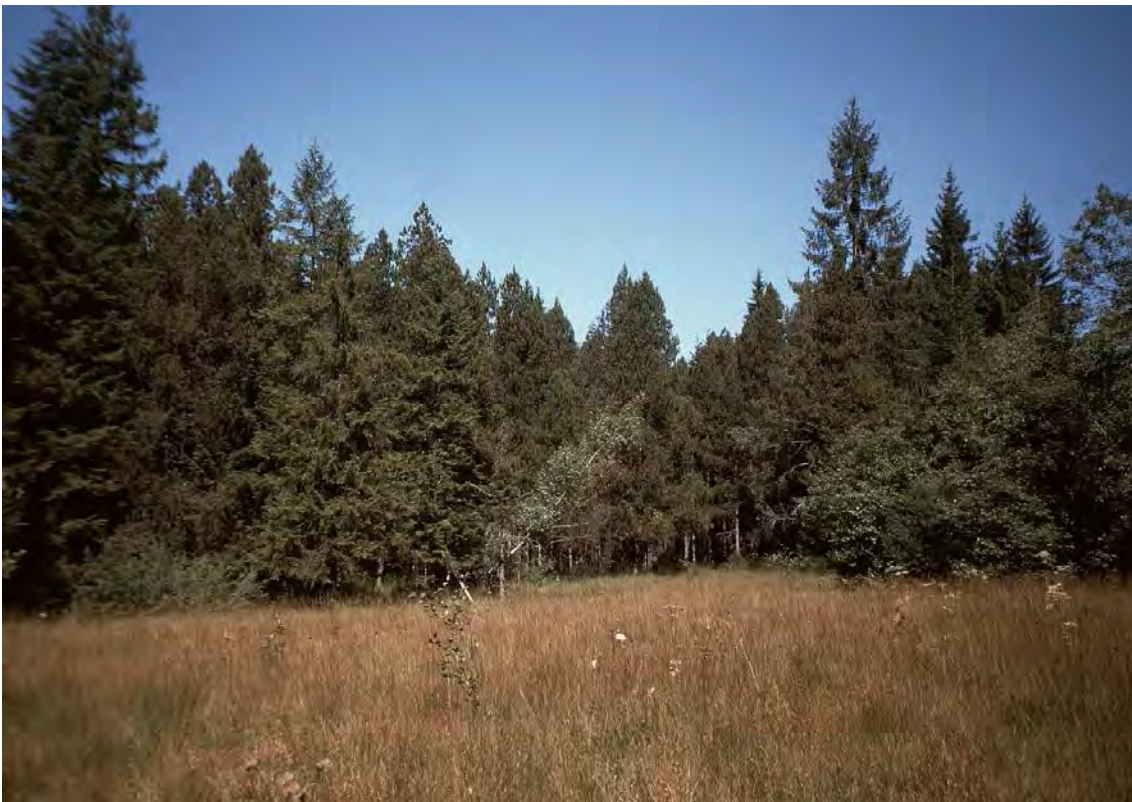
Abbildung 4: Moorkomplex des Orsanken Moos mit Kleinseggenriedern, Pfeifengraswiesen (im Vordergrund) und Spirkenhochmoor (im Hintergrund).

Das Orsanken Moos liegt in den Hangverflachungen der nordexponierten Flanken des Höhenzugs zwischen Hoher Lug und Hoher Kugel ungefähr 250 Meter oberhalb des Emmebachs. Das Hochmoor selbst hat sich in einem Geländesattel im westlichen Teil des Gebiets gebildet. Es handelt sich um einen ausgedehnten, ausgesprochen reichhaltigen Feuchtbiotopkomplex. Kernstück des Biotops ist ein Spirkenhochmoor und die offenen Hochmoorflächen - beides prioritäre Lebensräume der FFH-Richtlinie. Im Moorschutzkatalog (Steiner, 1992) wird der gesamte Moorkomplex als Lebensraum von internationaler Bedeutung geführt. Im Umfeld der Hochmoore findet sich eine nicht minder schutzwürdige, leider bereits stark verbrachte und in Teilen verwaldete Kulturlandschaft mit Kalkflachmooren, artenreichen Pfeifengraswiesen, Kohldistelwiesen und Hochstaudenfluren. Die Biotopfläche ist Teil des Naturschutzgebietes Hohe Kugel-Hoher Freschen-Mellental, Verordnung vom 13. März 1979.