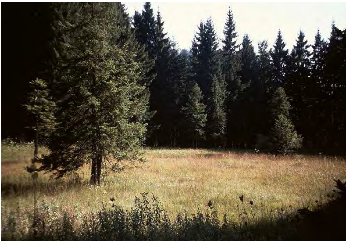
Abbildung 10: Oberer Teil des sehr artenreichen Flachmoors beim Naturfreundehaus.

Im Großraum von Meschach finden sich an verschiedenen Stellen kleinere oder größere Hangmoorflächen. Es handelt sich um Flachmoorfragmente in den Hängen zwischen Meschach und Millrüti und zwar bei Bort/Ried, unterhalb des Marxahöfle, südöstlich des Gasthofs Millrüti, beim Naturfreundehaus und bei Schlatt. Die Hangmoore sind eingebettet in eine kleinteilige strukturierte Landschaft mit teils noch traditionell bewirtschafteten Wiesen und Weiden. Das Moor beim Naturfreundehaus ist das bedeutendste Hangmoor im Gebiet von Meschach. Über weite Strecken handelt sich um ausgesprochen artenreiche Davallseggenmoore. Als Besonderheit sind hier die Hochmooransätze in den Hangbereichen unterhalb des Forstwegs zu nennen. Die übrigen, teilweise stärker beeinträchtigten Flächen stellen aber immer noch wichtige Trittstein- und Refugiallebensräume dar. Die Flächen sind Teil des Naturschutzgebietes Hohe Kugel- Hoher Freschen- Mellental, Verordnung vom 13. März 1979.