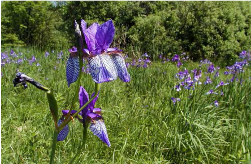
Abbildung 6: Die stark gefährdete Sibirische Schwertlilie ( Iris sibirica ), eine der schönsten Arten der Streuwiesen.

Von den Wirtschaftswiesen sind die zwei- bis dreischürigen, recht artenreichen Kohldistelwiesen (Angelico-Cirsietum oleracei) zu erwähnen. Auch wenn ihnen die klassischen Streuwiesenarten fehlen, sind die sie aus naturschutzfachlicher Sicht schützenswert, zumal dieser Wiesentyp im Rheintal zumindest gebietsweise bereits ebenso selten ist wie die einschürigen Streuwiesen (aus denen sie durch Intensivierung hervorgingen).