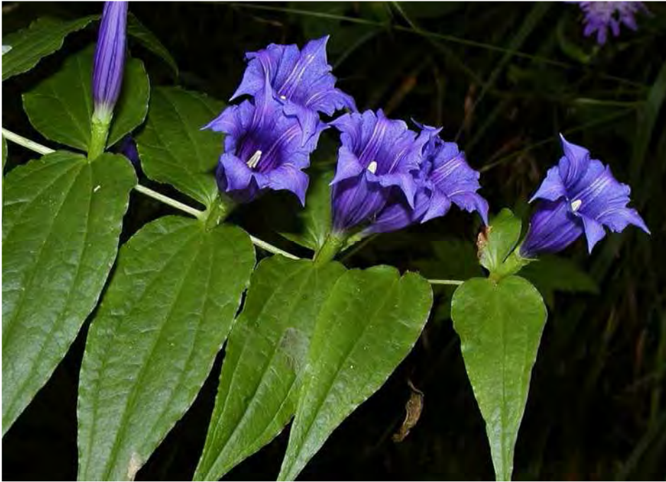
Abbildung 9: Der gefährdete Schwalbenwurz-Enzian in den Waldsäumen des Kapf