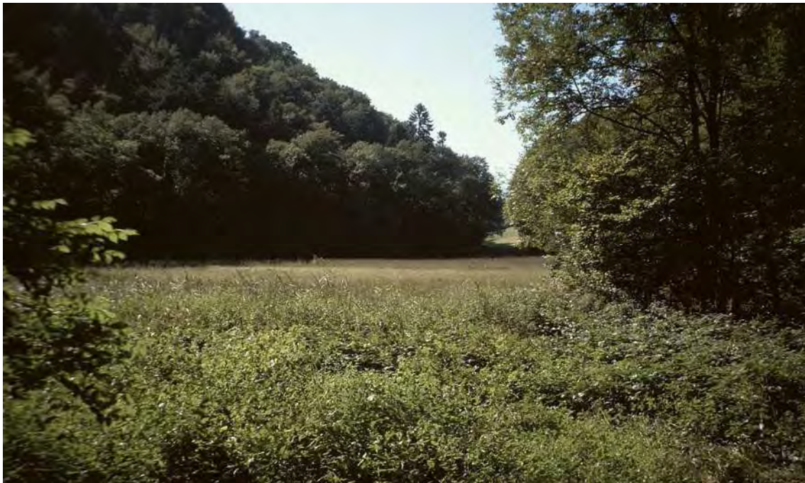
Abbildung 8: Streuwiese Tälchen des Mitzgebachs.

Der auf der Westseite der Hohen Kugel entspringende Emmebach durchbricht unterhalb von Meschach den Felsriegel zwischen Zwurms und Kapf und hat die eindrucksvolle, tiefe Örflaschlucht gebildet. Die Schluchteinhänge sind mit weitgehend naturbelassenen, artenreichen Laubmischwäldern bestockt. Es handelt sich um vielfach wärmegetönte und edellaubreiche submontane Kalk-Buchenwälder, sowie Kalk-Buchen-Tannen-Fichtenwälder. An den Unterhängen und am Grund der Schlucht finden sich mit Hirschzungen- und Mondviolen-Ahornwäldern dagegen typische Schluchtwaldgesellschaften. Durch die hohe Luftfeuchtigkeit sind sie reich an Farnen und Hochstauden. Daneben finden sich Alluvionen mit Grauerlen-Auwäldern, sonnige Felswände mit wärmeliebenden Felsfluren und Gebüsch, sowie ein kleines Flachmoorgebiet beim Mitzgebach. Während der Emmebach im unteren Teil teilweise etwas breitere Alluvionen ausgebildet hat, fließt er im oberen Teil abschnittsweise durch schmale Klammpassagen mit Kolken. An Steilstufen sind Wasserfälle ausgebildet. Der von Westen herführende Mitzgebach zeigt dagegen das Bild eines sanften Waldbächleins.