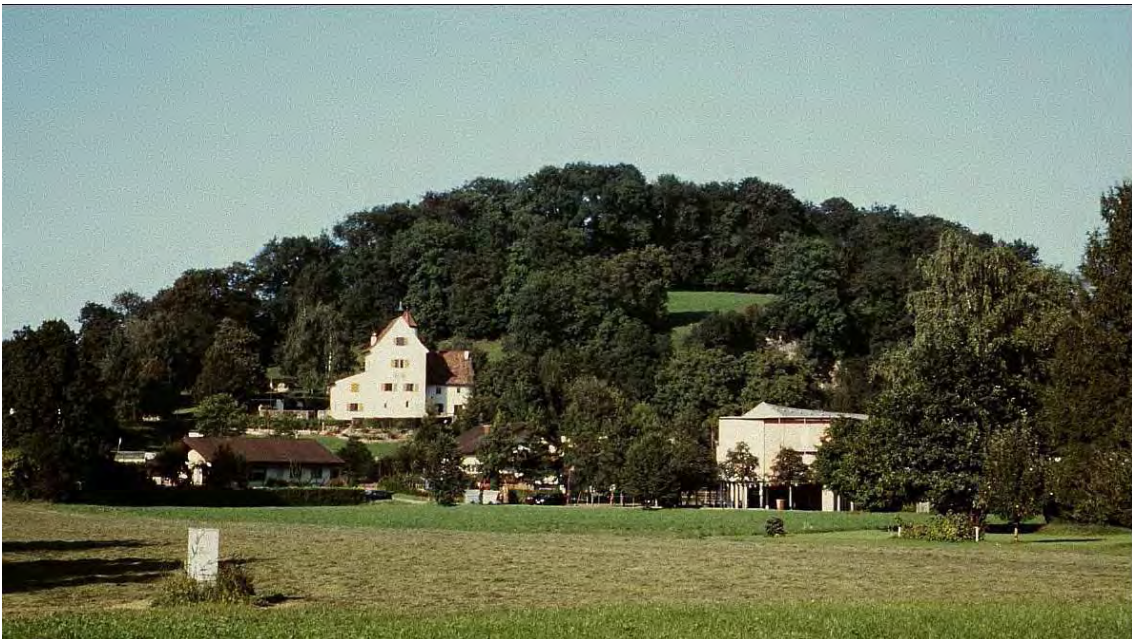
Abbildung 7: Der Sonnenhang des Sonderbergs wird von einem kleinteilig strukturierten Wiesen- und Weidegelände eingenommen.

Der kleine, weitgehend bewaldete Sonderberg prägt die Rheintalebene zwischen Altach und Götzis landschaftlich. Im Norden, Osten und Süden grenzt er an Siedlungs- und Gewerbegebiete. Im Westen finden sich, durch die Bahnlinie getrennt, die Streuwiesenreste und Grünlandflächen von Schubbas (vgl. Biotop 40803). Die Wälder des Sonderbergs sind über weite Strecken als naturnah anzusehen, submontane Kalk- und Braunerdebuchenwälder dominieren. Besonders erwähnenswert sind der Hirschzungen-Ahornwald um die west- und nordexponierten Felswände und der edellaubreiche Bestand auf der Gipfelkuppe. Auffallend ist das reiche Auftreten der Eibe, wobei es sich teils um sehr alte, stattliche Exemplare mit beachtlichen Stammumfängen handelt. Die Verjüngung der Eibe ist gut, was wohl auf das weitgehende Fehlen von Schalenwild zurückzuführen ist. Die Felswände und die Mauerreste am Gipfelbereich sind mit Kleinfarnfluren und Efeubehängen bewachsen. An den Südhängen findet sich ein durch Feldgehölze und Einzelbäume gegliedertes Wiesen- und Weidegelände mit Resten artenreicher Magerrasen.